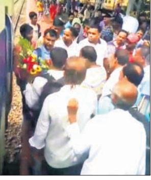
ଲୋକୋ ପାଇଲଟ୍‌କୁ ଯାତ୍ରୀମାନେ ପୁଷ୍ପଗୁଚ୍ଛ ଦେଇ ସମ୍ବର୍ଦ୍ଧନା ଦେଉଛନ୍ତି।

■ ବଡ଼ ଦୁର୍ଘଟଣାକୁ ବର୍ତ୍ତିଲା ■ ଲୋକୋ ପାଇଲଟ୍‌କ୍ ଉପସ୍ଥିତ ବୁଦ୍ଧି ଯୋଗୁ ରକ୍ଷା ପାଇଗଲେ ଯାତ୍ରୀ ■ ପୁଷ୍ପଗୁଚ୍ଛ ଦେଇ ସମ୍ବର୍ଦ୍ଧିତ କଲେ ଓହ୍ଲାଇ ଲୋକୋ ପାଇଲଟ୍‌କୁ ଜୀବନ ରକ୍ଷା ଲାଗି ଧନ୍ୟବାଦ ଦେବା ସହ ଫୁଲଗୋଡ଼ା ଦେଇ ସମ୍ବର୍ଦ୍ଧିତ କରି ପ୍ରଶଂସା କରିଥିଲେ। ପ୍ରତ୍ୟକ୍ଷଦର୍ଶୀଙ୍କ କହିବା ଅନୁଯାୟୀ, ନାକଗିରି ରୋଡ଼ ଷ୍ଟେଶନ ଛାଡ଼ିବାର ପ୍ରାୟ ୧୦୦ ମିଟର ପରେ ଏକ ବଡ଼ ଧରଣର ଶବ୍ଦ ହୋଇଥିଲା। ଏହାପରେ ଟ୍ରେନ୍ ଜୋର୍‌ରେ ବ୍ରେକ୍ ମାରି ରହିଥିଲା। କିଛି ସମୟ ମଧ୍ୟରେ ଟ୍ରେନ୍ ଟ୍ରାକ୍‌ରେ ଭୁଟି ଥିବା ଜଣାପଡ଼ିଥିଲା। ପରେ ଟେକ୍‌ନିକାଲ ଟିମ୍ ଆସି ଭୁଟି ସଜାଡ଼ିବା ପରେ ମେମୁ ଟ୍ରେନ୍ ବାଲେଶ୍ୱରରେ ପହଞ୍ଚିଥିଲା। ତେବେ ପଏଣ୍ଟ ରିଭର୍ସ ସେଟରେ ସମସ୍ୟା ଥିବା ବେଳେ ସିଗନାଲ ଷ୍ଟାଏକ୍ ଅବହେଳା ଯୋଗୁ ଏକ ବଡ଼ ଦୁର୍ଘଟଣାର ଶିକାର ହୋଇଥାନ୍ତା ମେମୁ ଟ୍ରେନ୍। ଆଉ ତିନିକ ଆଗକୁ ଯାଇଥିଲେ ପଏଣ୍ଟ ଫାଟି ଯାଇ ଅନେକ ଲୋକଙ୍କ ଜୀବନ ଯିବାର ସମ୍ଭାବନା ଥିଲା।