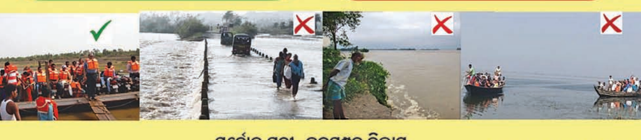
ବର୍ଷୋଳ ଯନ୍ତ୍ରୀ, ଜଳସମ୍ପଦ ବିଭାଗ OIPR-32465/13/0010/2324