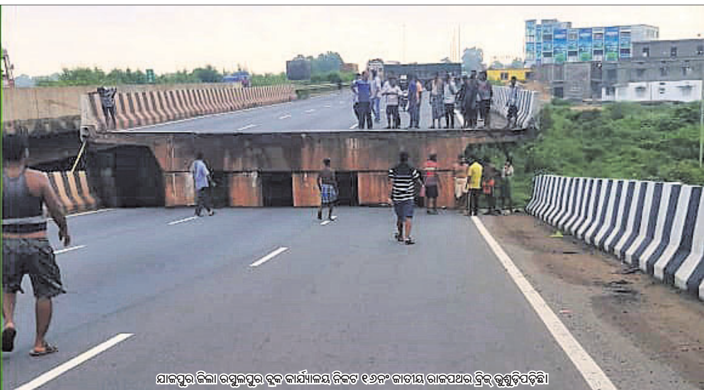
ଯାକପୁର ଜିଲ୍ଲା ରସୁଲପୁର ବ୍ଲକ୍ କାର୍ଯ୍ୟାଳୟ ନିକଟ ୧୬୯ମ ଜାତୀୟ ରାଜପଥର ଦ୍ୱିତୀୟ ଭୃଗୁଡ଼ିପଡ଼ିଛି।

ଆର୍ଯ୍ୟନ୍ ମୁଖାର୍ଜୀଙ୍କ ନିର୍ଦ୍ଦେଶିତ ଫିଲ୍ମ 'ୱାର୍-୨'ରେ ଅଭିନେତ୍ରୀ କିଆରା ଆଡଭାନୀଙ୍କ ଏଣ୍ଟ୍ରି ନେଇ ଅନେକ ଆଲୋଚନା ହେଉଛି।