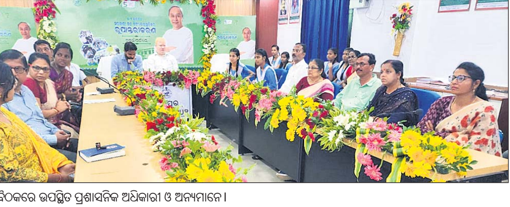
ବୈଠକରେ ଉପସ୍ଥିତ ପ୍ରଶାସନିକ ଅଧିକାରୀ ଓ ଅନ୍ୟମାନେ।

୪ଟି ପର୍ଯ୍ୟାୟରେ ୫-ଟି ରୂପାନ୍ତରଣ ହେବାକୁ ଥିବା ହାଇସ୍କୁଲଗୁଡ଼ିକ ମଧ୍ୟରେ ରଙ୍ଗେଇଲୁଣ୍ଡା ବୁକ୍‌ର ୫ଟି ବିଦ୍ୟାଳୟ ରହିଛି। ସେଥିମଧ୍ୟରେ ବ୍ରହ୍ମପୁର ମହାନଗର ନିଗମର ବୁକ୍‌ଟି ବହୁ ପୁରାତନ ବିଦ୍ୟାଳୟ ରହିଛି। ବ୍ରହ୍ମପୁର ମହାନଗର ନିଗମର କେସିଡାଉନ ବାଳକ ଉଚ୍ଚ ବିଦ୍ୟାଳୟ, ଲାଞ୍ଜିପଲ୍ଲୀ ବାଳିକା ଉଚ୍ଚ ବିଦ୍ୟାଳୟ ରୂପାନ୍ତରଣ ହେବାକୁ ଥିବା ବେଳେ ଗୋଳକରାସ୍ଥିତ ସିଦ୍ଧକେଶରୀ ଉଚ୍ଚ ବିଦ୍ୟାଳୟ, ନାରାୟଣପୁର ଉଚ୍ଚ ବିଦ୍ୟାଳୟ, ହରଡ଼ଙ୍ଗ ଆଞ୍ଚଳିକ ବାଳିକା ବିଦ୍ୟାଳୟ, ମଧ୍ୟ ସ୍ମାର୍ଟ ସ୍କୁଲ ହେବାକୁ ଯାଉଛି। ସରକାରଙ୍କ ପକ୍ଷରୁ ପ୍ରତ୍ୟେକ ବିଦ୍ୟାଳୟ ପଛା ୪୫ ଲକ୍ଷ ଟଙ୍କା ବ୍ୟୟ ଅବେକ ହୋଇଛି। ଏହି ଶିକ୍ଷାନୁଷ୍ଠାନଗୁଡ଼ିକ ସ୍ମାର୍ଟ ସ୍କୁଲରେ ରୂପାନ୍ତରଣ ହେବା ଦ୍ୱାରା ଛାତ୍ରଛାତ୍ରୀ ମାନେ ସ୍ମାର୍ଟ ଲାଭକ୍ରେତା, ଲେକ୍ଚୋଟୋରୀ, ଡିଜିଟାଲ କ୍ଲାସରୁମ୍, ସ୍ମାର୍ଟ