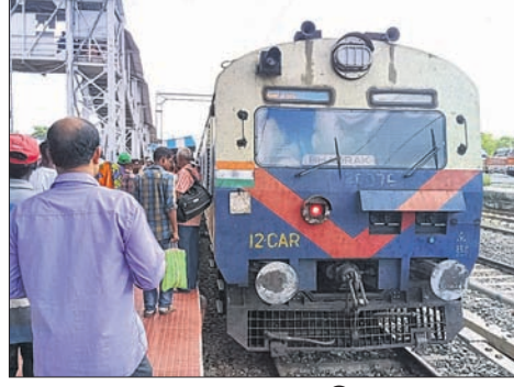
ବାଲେଶ୍ୱର ରେଳଷ୍ଟେଶନରେ ପହଞ୍ଚିଥିବା ବାଲେଶ୍ୱର-ଭଦ୍ରକ ମେମୁ ଟ୍ରେନ୍।

ବାଲେଶ୍ୱର(ମାନସ ବିଶ୍ୱାଳ)/ବାହାନଗା (ଅନୁପ ଦାସ), ୧୮ ୭ ବାହାନଗା ଟ୍ରେନ୍ ଦୁର୍ଘଟଣା ମନରୁ ଲିଭି ନ ଥିବା ବେଳେ ଆଉ ଏକ ନିଶ୍ଚିତ ଦୁର୍ଘଟଣା ପରିସ୍ଥିତିକୁ ଏଡ଼ାଇ ଦିଆଯାଇପାରିବି। ଲୋକୋ ପାଇଲଟ୍‌କ୍ ଉପସ୍ଥିତ ବୁଦ୍ଧି ଯୋଗୁ ଭଦ୍ରକ-ବାଲେଶ୍ୱର ମେମୁ ଟ୍ରେନ୍ (ନଂ.୦୮୦୩୨) ଦୁର୍ଘଟଣାକୁ ବର୍ତ୍ତିଯାଇଛି।