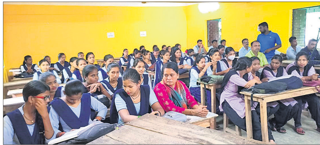
ଜଗତ୍ସିଂହପୁର ଜିଲ୍ଲା ନାଉରୀ ହାଟ ଶ୍ରୀଜଗନ୍ନାଥ ମହାବିଦ୍ୟାଳୟରେ ମଙ୍ଗଳବାର ଧରିତ୍ରୀର ୫୦ ବର୍ଷ ପାଳନ ଅବସରରେ ଆୟୋଜିତ ବକ୍ତୃତା ପ୍ରତିଯୋଗିତାରେ ଅତିଥି ଓ ବିଚାରକ (ବାମ) । ପ୍ରତିଯୋଗିତାରେ ଉପସ୍ଥିତ ଛାତ୍ରାଛାତ୍ରୀ ।