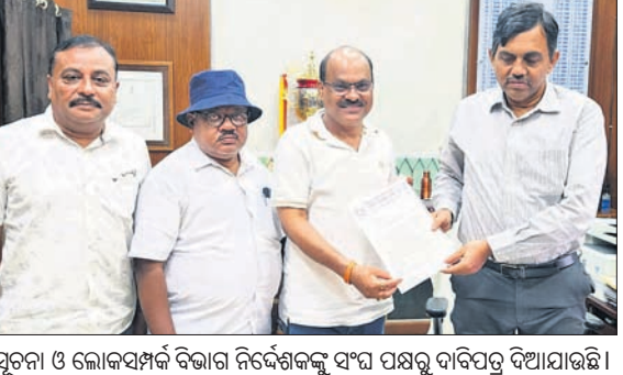
ସୂଚନା ଓ ଲୋକସମ୍ପର୍କ ବିଭାଗ ନିର୍ଦ୍ଦେଶକ ସଂପଦ ପକ୍ଷରୁ ଦାବିପତ୍ର ଦିଆଯାଇଛି।