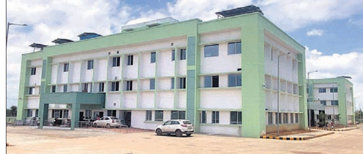
ଝାରସୁଗୁଡ଼ା କାର୍ଡିଆକ୍ କେନ୍ଦ୍ରର ହସ୍ତଗତ ପାଇଁ ନିର୍ମାଣାଧୀନ କୋଠା।