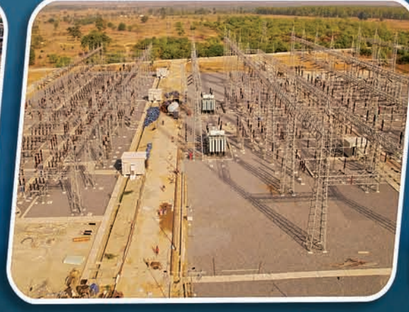
୨୨୦/୧୩୨/୩୩୩ କେ.ଭି. ଗ୍ରୀଡ୍ ବାମ୍ବରା, ସମ୍ବଲପୁର