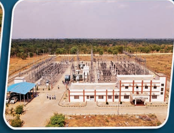
୧୩୨/୩୩୩ କେ.ଭି. ଗ୍ରୀଡ୍ ଭଟ୍ଟି, ବରଗଡ