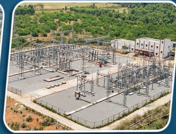
୧୩୨/୩୩୩ କେ.ଭି. ଗ୍ରୀଡ୍ ବୋରିଗୁମ୍ଫା, କୋରାପୁଟ