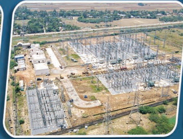
୨୨୦/୧୩୨/୩୩୩ କେ.ଭି. ଗ୍ରୀଡ୍ ବାଲିମୁଣ୍ଡା, ଭଦ୍ରକ