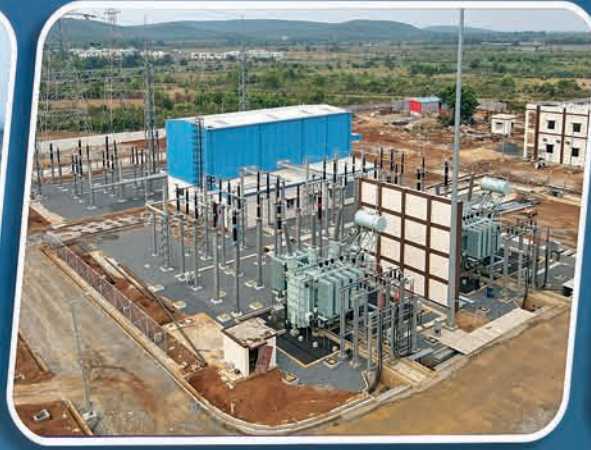
୨୨୦/୩୩୩ କେ.ଭି. କିଆଇଏମ୍ ଗ୍ରୀଡ୍ କଣ୍ଠାବାଟ, ଖୋର୍ଦ୍ଧା