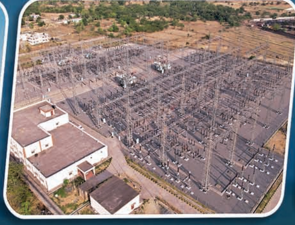
୨୨୦/୧୩୨/୩୩୩ କେ.ଭି. ଗ୍ରୀଡ୍ କୁର୍ଥାରମୁଣ୍ଡା, ସୁନ୍ଦରଗଡ