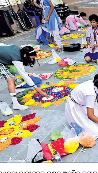
କର୍ମଚାରୀ ନାରୀମାନଙ୍କ ପକ୍ଷରୁ ଅନୁଷ୍ଠିତ କୁମାର ଉଦ୍‌ଯୋଗ ପ୍ରତିଯୋଗିତାରେ ପିଲାମାନେ ଫୁଲରେ ଖୋଟି କରୁଥିବା ଚିତ୍ର।