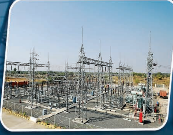
୧୩୨/୩୩୩ କେ.ଭି. ଗ୍ରୀଡ୍ ଲଖନପୁର, ଝାରସୁଗୁଡା