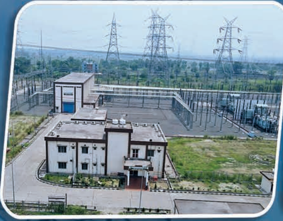
୪୦୦/୨୨୦ କେ.ଭି. କିଆଇଏମ୍ ଗ୍ରୀଡ୍ ମେରାପୁଣ୍ଡଳା, ଅନୁଗୋଳ