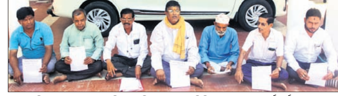
ଶ୍ରୀମନ୍ଦିର ୪ ଦ୍ୱାର ଖୋଲାଯିବା ଦିନରେ ପୁରୀର ବିଭିନ୍ନ ସଙ୍ଗଠନର କର୍ମଚାରୀଙ୍କୁ ପୁରୀ, ୧୯/୬ (ଅକ୍ଷୟ ମହାନ୍ତି)