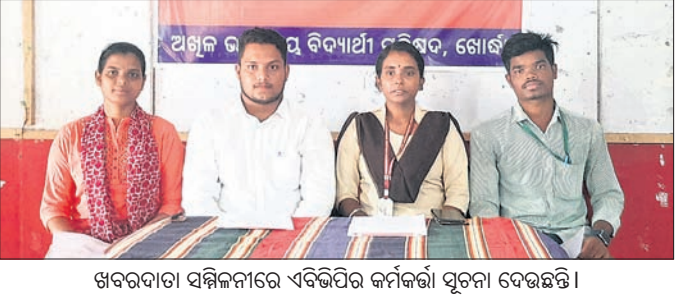
ଖବରଦାତା ସମ୍ମିଳନୀରେ ଏଭିପିର କର୍ମକର୍ତ୍ତା ସୂଚନା ଦେଉଛନ୍ତି।