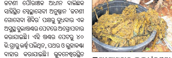
ଅସ୍ତ୍ରୋପଚାର କଲମ 'ଜଟଣୀ ଗୋସେବା ଶିବିର'