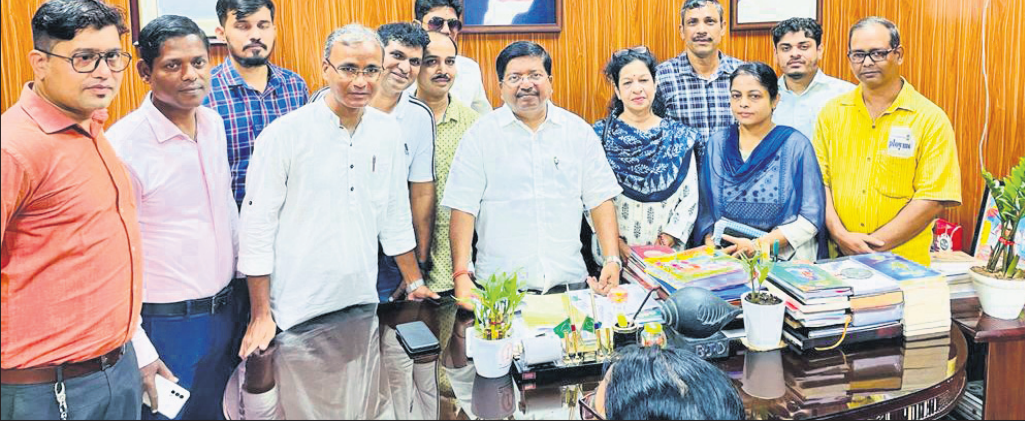
ଭୁବନେଶ୍ୱର, ୧୯/୬ (ଅନୁରାଧା ମହାନ୍ତ)