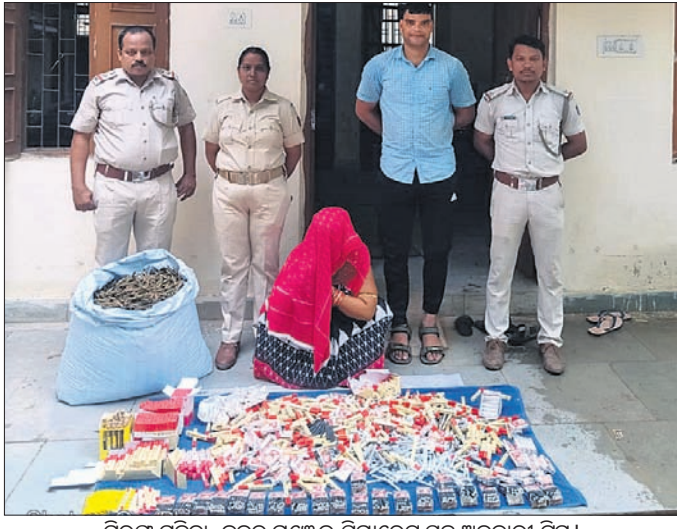
ଗିରଫ ମହିଳା, ଜବତ ଗଞ୍ଜୋଇ ସିଗାରେଟ ସହ ଅବକାରୀ ଚିପ୍ସ। ଗଞ୍ଜୋଇ ସିଗାରେଟ ସହ ଅବକାରୀ ଚିପ୍ସ। ଗଞ୍ଜୋଇ ସିଗାରେଟ ସହ ଅବକାରୀ ଚିପ୍ସ।