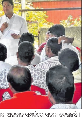
ଧର୍ମାନୁଷ୍ଠାନର ଉନ୍ନତିକରଣ ପାଇଁ ୪.୯ କୋଟି