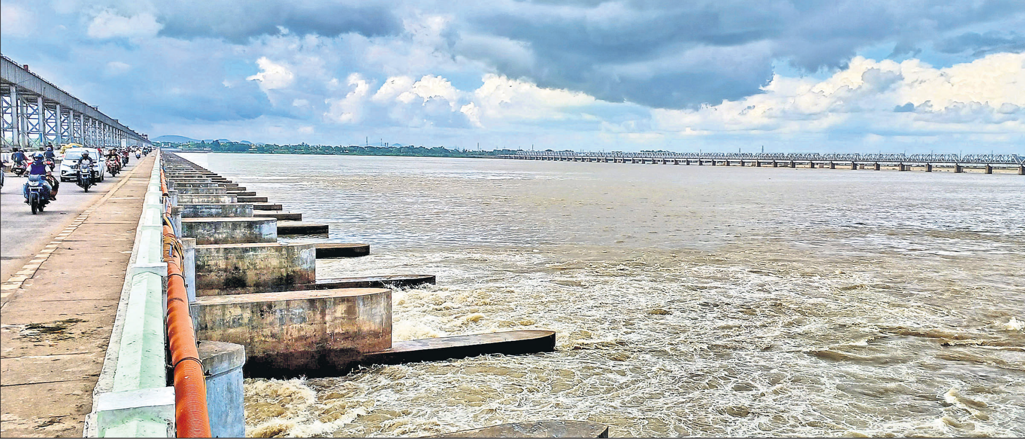
କଟକ ଯୋଗୁ ଆନିକଟ ଦେଇ ମହାନଦୀରେ ରୁଧିବାର ପ୍ରବାହିତ ପ୍ରଥମ ବନ୍ୟାଜଳ।

ନମାମି ଗଙ୍ଗା ପ୍ରକଳ୍ପରେ ଅଭ୍ୟାସ ଡେଭର, ୧୯/୭ ଉତ୍ତରାଖଣ୍ଡ ଚମୋଲି ଜିଲ୍ଲାରେ ମଙ୍ଗଳବାର ରାତିରେ ଜଲେଜ୍ଜିନ୍ ଗ୍ରାମ୍ପଫର୍ମ ପାଟି ଏକ ବ୍ରିଜ୍‌ରେ ରେଲିଂକୁ ବିଦ୍ୟୁତ୍ ଚାର୍ଜ୍ ହୋଇଯିବାରୁ ୧୫ ଜଣଙ୍କ ମୃତ୍ୟୁ ଘଟିଛି। ମୃତକଙ୍କ ମଧ୍ୟରେ ଜଣେ ପୋଲିସ୍ ଅଧିକାରୀଙ୍କ ସମେତ ୩ ଗୁରୁତ୍ର ଅଛନ୍ତି। ରୁଧିବାର ମୁଖ୍ୟମନ୍ତ୍ରୀ ପୁଷ୍କର ସିଂ ଧାନି ଘଟଣାସ୍ଥଳରେ ପହଞ୍ଚିବା ସହ ଘଟଣାର ମାଲିକଣ୍ଠ ସ୍ୱରାୟ ସାଧି ନିର୍ଦ୍ଦେଶ ଦେଇଛନ୍ତି। ଗ୍ରାମ୍ପଫର୍ମ ପାଟିବାରୁ ଚାର୍ଜ୍ ହୋଇଯାଇଥିବା ବ୍ରିଜ୍‌ଟି 'ନମାମି ଗଙ୍ଗା' ପ୍ରକଳ୍ପର ଦୁର୍ଘଟ ଟ୍ରିଗ୍‌ମେଣ୍ଟ ପ୍ଲାଣ୍ଟ ଅଧୀନରେ ଆସୁଥିବାବେଳେ ଏହା ଅକଳନକ୍ଷମ ନଦୀ ଉପରେ ଦେଇ ପିପାଲକୋଟି ଗ୍ରାମ ପର୍ଯ୍ୟନ୍ତ ଲାମ୍ପିଥିଲା। ତେବେ କ୍ଷେତ୍ର ତିଆରିରେ ରେଷ୍ଟ୍ରିକ୍ଟିଭ୍ (ଏକ୍ସ୍‌ଡିଆର୍‌ଏଫ୍) ପକ୍ଷରୁ ଉଦ୍ଧାର କାର୍ଯ୍ୟ ଚାଲିଥିବାବେଳେ