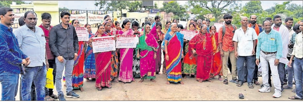
ରୁକ୍ଷା କମ୍ପାନୀ ସମ୍ମୁଖରେ କ୍ଷତିଗ୍ରସ୍ତ ପ୍ରଜାଳ ଧାରଣା।

ଡେକାନାଲ ଜିଲ୍ଲା ସିନ୍ଦୂରା ରୁକ୍ଷା କ୍ଷତିଗ୍ରସ୍ତ ସଂଘର୍ଷ ୧୬ ବର୍ଷ ହେଲା ଶେଷ ହେଉନାହିଁ। କମ୍ପାନୀର ପ୍ରତିଶ୍ରୁତି ପାଖିର ଗାଠ ସାଜିଛି। ଏହାର ପ୍ରତିବାଦରେ ଚଳିବେଦ୍ଲା ଗ୍ରାମ ବାଲିସାହି ଅଞ୍ଚଳର ୫୩ ବିପ୍ଳାପିତ ପରିବାର ରୁଧିବାର କମ୍ପାନୀ ଫାଟକ ସମ୍ମୁଖରେ ଧାରଣା ଦେବା ସହ ହକ୍ ଦାବି କରିଥିଲେ।