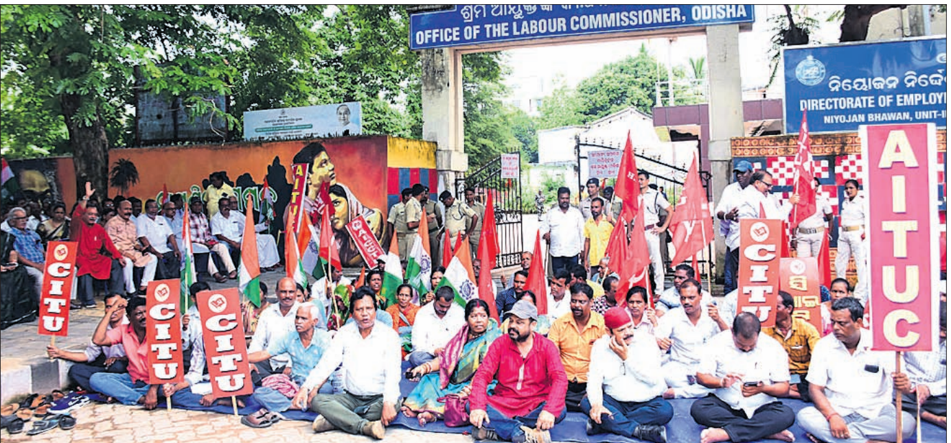
ଶ୍ରମିକ ପଞ୍ଜାବର ଓ ନବାକରଣ ପାଇଁ ଆନ୍ଦୋଳନ ଆବେଦନ ଅବଧି ବୃଦ୍ଧି ସହ ବିଭିନ୍ନ ଦାବି ନେଇ ଏଆଇଟିୟୁସି ସମେତ ବିଭିନ୍ନ କେନ୍ଦ୍ରୀୟ ଶ୍ରମିକ ଓ ନିର୍ମାଣ ଶ୍ରମିକ ସଙ୍ଗଠନ ପକ୍ଷରୁ ଭୁବନେଶ୍ୱରରେ ଶ୍ରମ କର୍ମଚାରୀଙ୍କ କାର୍ଯ୍ୟାଳୟ ଆଗରେ ଧାରଣା ଦିଆଯିବା ସହ ଦାବି ଉପସ୍ଥାପନ କରାଯାଇଛି।

ଭୁବନେଶ୍ୱର, ୧୯୭୭ (ଓପିଏଫ୍) ଓଢ଼ିଆ ଲୋକଙ୍କୁ ଧର୍ମପାଠ ଦେବାକୁ ଆବେଦନ ହାଇକୋର୍ଟରେ ଖାରଜ ହୋଇଛି। ଧର୍ମପାଠ ଦେବାକୁ ଆବେଦନ କରିବା ପାଇଁ ଉଚ୍ଚତମ ନ୍ୟାୟାଳୟ ଧର୍ମପାଠ ଦେବାକୁ ଆବେଦନ କରିବାକୁ ନିଷିଦ୍ଧ କରିଛନ୍ତି।