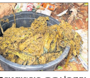
ଅସ୍ତ୍ରୋପଚାର କଲା 'କଟଣା ଗୋସେବା ଶିବିର'

କଟଣା, ୧୯୭୭ (ରବୀନ୍ଦ୍ରନାଥ ମହାକୁଡ଼) କଟଣା ଚୌରାଞ୍ଚଳ ଅଧୀନ ବାଲିଞ୍ଜଳ ସାହିନୀୟ ଷ୍ଟାଣ୍ଡାସେବା ଅନୁଷ୍ଠାନ 'କଟଣା ଗୋସେବା ଶିବିର' ପକ୍ଷରୁ ଭୁବନେଶ୍ୱର ଏକ ଅନୁଷ୍ଠାନରେ ଅପେକ୍ଷାରେ ଅପୋଷ୍ୟ ରୋଗ କରାଯାଇଛି।