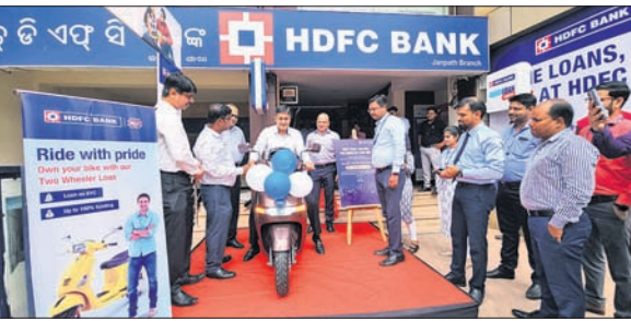
ଝୁଟିଆଇ ବାଲାଙ୍ଗିର ଆଡ଼ଭାଷେଇ ପଞ୍ଚୁ ଉନ୍ମୋଚିତ ଏଡ଼ିଟିଏସ୍ ବିଦ୍ୟାଳୟ ବ୍ୟାଙ୍କର ୨ଟିକିଆ ଯାନ ରଣମେଳା