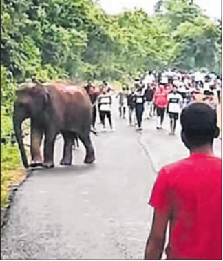
କାର୍ଯ୍ୟ ରାଜପଥରେ ହାତୀ।