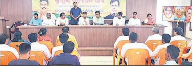
ବୈଠକରେ କେନ୍ଦ୍ରମନ୍ତ୍ରୀଙ୍କ ସମେତ ଭାଜପା କର୍ମକର୍ତ୍ତାମାନେ।

କେନ୍ଦ୍ର ସାମାଜିକ ଗଣମାଧ୍ୟମ କାର୍ଯ୍ୟକର୍ତ୍ତାଙ୍କୁ ଉଦ୍ଦେଶ୍ୟରେ ଦେଇ କେନ୍ଦ୍ରମନ୍ତ୍ରୀ କହିଛନ୍ତି, ଅନୁଗୋଳ ଜିଲାକୁ ନୋଡି ସରକାର ୯ ବର୍ଷରେ ୬୦ ହଜାର କୋଟି ଟଙ୍କା ବିଭିନ୍ନ ଯୋଜନାରେ ପ୍ରଦାନ