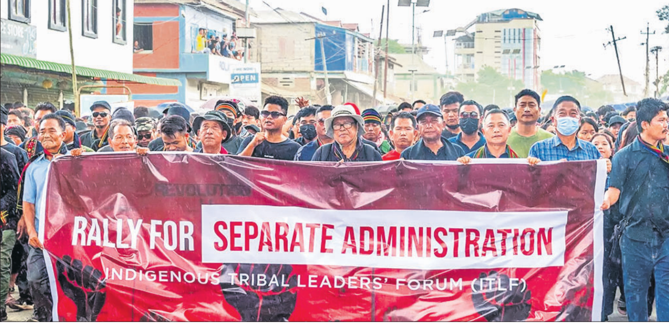
ମେ' ୪ ଯତ୍ନ ପ୍ରତିବାଦରେ ମଣିପୁରର ଚୁଡ଼ାଚାନ୍ଦପୁରରେ ଗୁରୁବାର ଇଣ୍ଡିଜେନସ୍ ଗ୍ରାଉଣ୍ଡସ୍ ଲିଡର୍ସ ଫୋରମ୍ (ଆଇଟିଏଲ୍ଏଫ୍) ପକ୍ଷରୁ ବିଶାଳ ବିକ୍ଷୋଭ ଶୋଭାଯାତ୍ରା କରାଯାଇଛି।

ଝେଷ୍ଟକଣ୍ଠ ବିପକ୍ଷରେ ଟେଷ୍ଟ ପଦାର୍ପଣ କରିଛନ୍ତି ଭାରତର ବେଙ୍ଗାଲ ପେସ୍ ବୋଲର ମୁକେଶ କୁମାର।