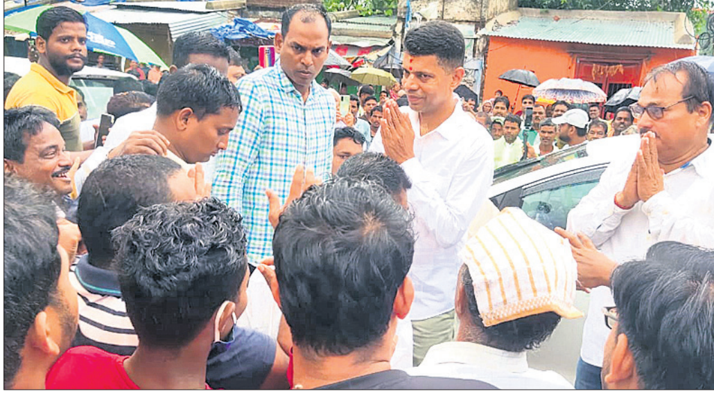
ରାଜପୁରଠାରେ ୫-ଟି ସର୍ବିସ ଭି.କେ.ପାଠିଆନ ଲୋକମାନଙ୍କ ଅଭିଯୋଗ ଶୁଣୁଛନ୍ତି ।

୫-ଟି ସର୍ବିସ ୨ଦିନିଆ ନୟାଗଡ଼ ଜିଲା ଗସ୍ତ ■ ଚମକିତ ରଣପୁର ପରିସର ପରିସର ■ ବିଜୁଳା ଶ୍ରୀକ୍ଷେତ୍ର ପାଳିକା ସମିତି ■ ୨ ଦିନ ପର୍ଯ୍ୟନ୍ତ ସର୍ବିସ ଗସ୍ତ ■ ଭଲ କାମ କରି ସମସ୍ତଙ୍କୁ ଉପହାସନ କରିବାକୁ ପରାମର୍ଶ