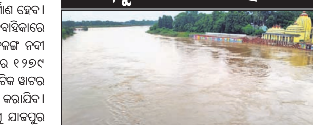
ବୈତରଣୀ, ବୁଢ଼ାବଳଙ୍ଗରେ ବନ୍ୟା ନିୟନ୍ତ୍ରଣ ଯୋଜନା

■ ଖର୍ଚ୍ଚ ହେବ ୧୨୭୯ କୋଟି ଟଙ୍କା ■ ଅତ୍ୟାଧୁନିକ ଖାର ଲେଉଟା ରେକର୍ଡର ନିର୍ମାଣ କରାଯିବ ୮୦ ଲକ୍ଷ ୮ ହଜାର ଟଙ୍କା ମଞ୍ଜୁର ହୋଇଥିଲା । ଏହାପୂର୍ବରୁ ବୈତରଣୀ ବାହାରିବା ସମୟରେ ବାଲିପାଟଣା, ବଳରାମପୁର ନଦୀବନ୍ଧ ନିର୍ମାଣ କରିବାକୁ ୯ କୋଟି ୯୬ ଲକ୍ଷ ୩୦ ହଜାର ଟଙ୍କା ମଞ୍ଜୁର କରାଯାଇଛି । ଏହି ୩ ପ୍ରକଳ୍ପ ସମ୍ପୂର୍ଣ୍ଣ କାର୍ଯ୍ୟକାରୀ ହେଲେ ଜିଲାର କୋରେଇ ଓ ବଣପଲ୍ଲୀରୁ ବୁଢ଼ାବଳଙ୍ଗ ଏବଂ ଭଦ୍ରକ ଜିଲାର ଭଣ୍ଡାରୀପୋଖରୀ ବୁଢ଼ାବଳଙ୍ଗ ନିୟନ୍ତ୍ରଣ ହୋଇପାରିବ ବୋଲି ବିଭାଗ ପକ୍ଷରୁ କୁହାଯାଇଛି । ବୈତରଣୀ ଓ ବ୍ରାହ୍ମଣୀ ନଦୀର ସମୁଦାୟ ୧୨୦୨୦ ହକ୍ଟର ବନ୍ୟା ଏକଟି ଶତାବ୍ଦୀର ସମସ୍ତ ବନ୍ୟା ବୋଲି କୁହାଯାଇଥିଲା । ଏହି ବନ୍ୟାରେ ଜିଲାର ସମସ୍ତ ବ୍ଲକ୍ ଓ ଗୋଟିଏ ପୌର ପରିଷଦର ୧୪୩ ପଞ୍ଚାୟତର ୬୧୨ ଗ୍ରାମ ସହ ୧ ଖାରତ ପାଖାପାଖି ୧୦ ଲକ୍ଷ ଲୋକ ପ୍ରଭାବିତ ହୋଇଥିଲେ । ୨୫ଟି ବଡ଼ବଡ଼ ଯାଜପୁର ଷ୍ଟେସନରେ ୧୨ ଜଣଙ୍କ ମୃତ୍ୟୁ ହୋଇଥିଲା । ତେଣୁ ବର୍ଷା ଋତୁ ଆସିଲେ ଯାଜପୁର ଜିଲା ନଦୀକଳବାସୀ ଭୟରେ କାଳିପତା କରିଥାନ୍ତି । ବନ୍ୟା ନିୟନ୍ତ୍ରଣ ପାଇଁ ସମ୍ପୂର୍ଣ୍ଣ ନଦୀ ବିଚାରଣା ଯୋଜନା, ବ୍ୟାରେଜ ଆଦି ସରକାରୀ ପ୍ରତିଷ୍ଠିତରେ ଅଟକିଛି । ଏହାସହ ବେଆଇନ ବାଲିଖାଦାନ ସମେତ ଖଣି ଓ ଶିଳ୍ପସମ୍ପାଦନ ବର୍ଦ୍ଧିତ ନଦୀଶାଖାକୁ ପୋତି ଚାଲିଛି । ଏହାର ସମାଧାନ ପାଇଁ କେନ୍ଦୁଝର ଓ ଯାଜପୁର ଜିଲାର ଲୋକମାନେ ସମ୍ବନ୍ଧିତ ମାଧ୍ୟମରେ ଦାବିନାମା ହେବ ଆହ୍ୱାନନ ଓ ଦାବି କରି ଆପୁଷ୍ଟି । ଏକାଧିକରେ ଆଗାମୀ ଦିନରେ ବନ୍ୟା ପରିସ୍ଥିତି ନିୟନ୍ତ୍ରଣ ବହୁ ଜରୁରୀ ବୋଲି ଅଞ୍ଚଳବାସୀ କହିଛନ୍ତି ।