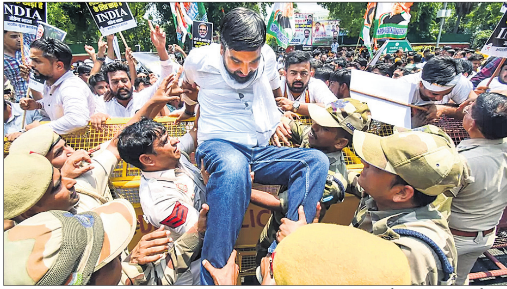
ନିର୍ବାଚନ ଲଢ଼ିବାକୁ ନେଇ ଗୁରୁବାର ଚୌତାଲାଙ୍କୁ ଭେଟିବା ପାଇଁ ଚୌତାଲାଙ୍କୁ ପ୍ରଦର୍ଶନ ସମୟରେ ଜଣେ କର୍ମୀ ବ୍ୟାରିକେଡ୍ ଚେଉଁଥିବା ବେଳେ ଚୌତାଲାଙ୍କୁ ଆବେଦନ କରୁଥିବା ଦର୍ଶକମାନଙ୍କର ସମୂହ।

ଚୌତାଲା, ୨୦୧୭: ଇଣ୍ଡିଆନ ନ୍ୟାଶନାଲ ଲୋକ ଦଳ (ଆଇଏନ୍‌ଏଲ୍‌ଡି) ନେତା ଚୌତାଲା ହରିୟାଣାରେ ପୂର୍ବତନ ମୁଖ୍ୟମନ୍ତ୍ରୀ ଓ ପ୍ରଧାନ ଚୌତାଲା ୨୦୨୪ ବିଧାନସଭା ନିର୍ବାଚନ ଲଢ଼ିବାକୁ ଚାହାନ୍ତି ବୋଲି ଗୁରୁବାର କହିଛନ୍ତି।