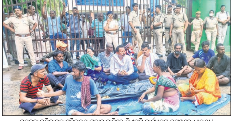
ମୃତକଙ୍କ ପରିବାରକୁ କ୍ଷତିପୂରଣ ପ୍ରଦାନ ଦାବିରେ ସିଏମ୍‌ସି କାର୍ଯ୍ୟାଳୟ ସମ୍ମୁଖରେ ଧାରଣା।

■ ୧୦ ଲକ୍ଷ କ୍ଷତିପୂରଣ ପ୍ରଦାନ ଦାବି ■ ମୁଖ୍ୟମନ୍ତ୍ରୀଙ୍କ ରିଲିଫ୍ ପାଣ୍ଠିରୁ ସହାୟତା ପାଇଁ ଚିଠି