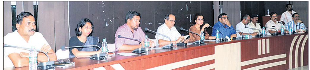
ଶାନ୍ତି କମିଟି ବୈଠକରେ ପ୍ରଶାସନିକ ଅଧିକାରୀ ଓ କମିଟି ସଦସ୍ୟ।

ସମ୍ବଲପୁର, ୨୦୧୭ (ଶୁଭାଶିଷ ପାଠୀ) ସମ୍ବଲପୁରରେ ବର୍ଷକ ଭିତରେ ବିନା ଶୋଭାଯାତ୍ରାରେ ମହରମ ଓ ହନୁମାନ ଜୟନ୍ତୀ ପାଳନ କରାଯିବ। ଜିଲ୍ଲା ପରିଷଦ ସମ୍ମିଳନୀ କକ୍ଷରେ ଗୁରୁବାର ଆୟୋଜିତ ମହରମ ଶାନ୍ତି ଓ ସମନ୍ୱୟ କମିଟି ବୈଠକରେ ଏହି ନିଷ୍ପତ୍ତି ନିଆଯାଇଛି। ଗତ ଏପ୍ରିଲରେ ହନୁମାନ ଜୟନ୍ତୀ ଶୋଭାଯାତ୍ରା ସମୟରେ ସାମ୍ବାଦିକ ଦଳା ଘଟିଥିଲା। ପ୍ରାୟ ଏକମାସ ପରେ ପରିସ୍ଥିତି ସୁଧାର ଆସିଥିଲା। ଏବେ ମଧ୍ୟ ଶତାଧିକ ଲୋକ ଜେଲରେ ଅଛନ୍ତି। ମହରମରେ ମିଳିତ