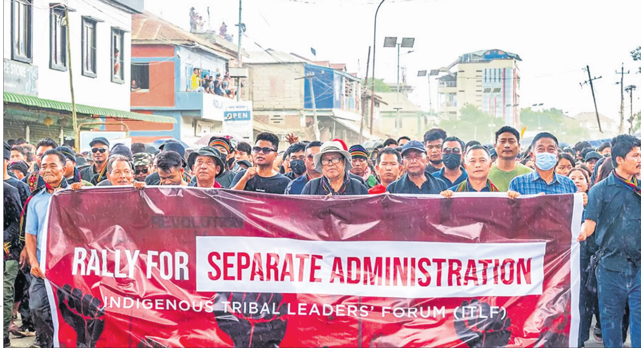
ମେ' ୪ ଘଟଣା ପ୍ରତିବାଦରେ ମଣିପୁରର ଚୁରାଗାନ୍ଧପୁରରେ ଗୁରୁବାର ଇଣ୍ଡିଜେନସ୍ ଟ୍ରାଇବାଲ୍ ଲିଡର୍ସ୍ ଫୋରମ୍ (ଆଇଟିଏଲ୍ଏଫ୍) ପକ୍ଷରୁ ବିଶାଳ ବିକ୍ଷୋଭ ଶୋଭାଯାତ୍ରା କରାଯାଇଛି।

ଆଜିର ସମ୍ବାଦକାରୀ ନାଗୋ, ଜେଲେନିକ୍ସ ଓ ପ୍ଲୁଟିନ