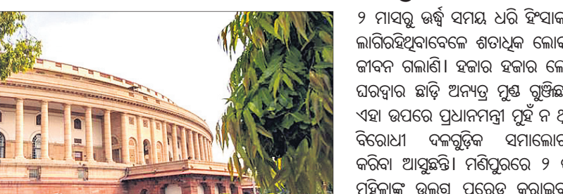
ମଣିପୁର ହିଂସା ପ୍ରସଙ୍ଗରେ ଆଲୋଚନା ଦାବିକରି ଉତ୍ତର ଲୋକ ସଭା ଓ ରାଜ୍ୟ ସଭାରେ ବିରୋଧୀ ସଦସ୍ୟମାନେ ଗୁରୁବାର ପ୍ରବଳ ହକ୍‌ଗୋଳ କରିବାକୁ ମୌସୁମୀ ଅଧ୍ୟାବେଶର ପ୍ରଥମ ଦିନ ପାଇଁମେଣ୍ଟୁ ମୂଲତରୀ ରଖାଯାଇଛି। ଆଲୋଚନା ପାଇଁ ସରକାର ପ୍ରସ୍ତୁତ ବୋଲି ସଂସଦୀୟ ବ୍ୟାପାର ମନ୍ତ୍ରୀ ପ୍ରହଲ୍ଲାଦ ଶିଂ ପ୍ରତିଶ୍ରୁତି ଦେବା ସତ୍ତ୍ୱେ ବିରୋଧୀ ସଦସ୍ୟମାନେ ହକ୍‌ଗୋଳ ଓ ସ୍ଲୋଗାନବାଦି କରି ରଖୁଥିଲେ। ସମସ୍ତ ଆଲୋଚନାକୁ ବନ୍ଦ ରଖି କେବଳ ମଣିପୁର ହିଂସା ଉପରେ ଆଲୋଚନା କରିବା ପାଇଁ ୧୫ ବିରୋଧୀ ଦଳର ଏମ୍‌ପିମାନେ ଅଡ଼ିବସିଥିଲେ। ଲୋକ ସଭାରେ ସରକାର ଗୁହର ନିୟମିତ କାର୍ଯ୍ୟଧାରା ଆରମ୍ଭ କରିବାକୁ ଉଦ୍ୟମ