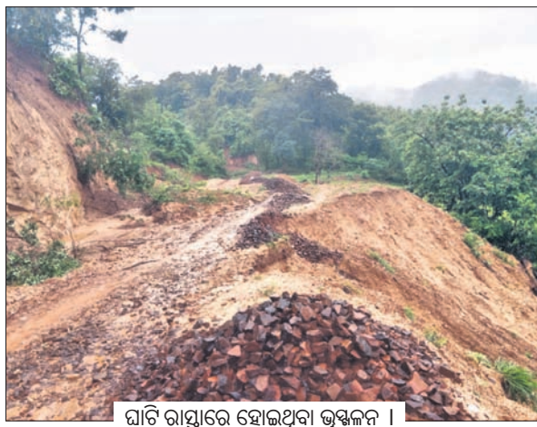
ଘାଟି ରାସ୍ତାରେ ହୋଇଥିବା ଭୁଞ୍ଜନ