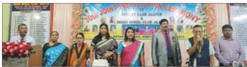
ପ୍ରତିଷ୍ଠା ଦିବସରେ ଯୋଗଦେଇଥିବା ଅତିଥି ଓ ଅନ୍ୟମାନେ।