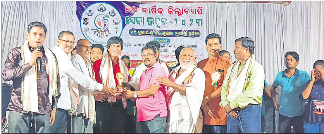
ସେବା ଉତ୍ସବର ଉଦ୍‌ଯାପନା ଉତ୍ସବରେ ବିଶିଷ୍ଟ ବ୍ୟକ୍ତିମାନଙ୍କୁ ସମ୍ମାନିତ କରାଯାଇଛି।

ଯୁବଗୋଷ୍ଠୀ ଚାହିଁଲେ ସେବା ଆନ୍ଦୋଳନ ହୋଇପାରିବ। ସେବାକୁ ଓଲଟାଇଲେ ବାସେ, ଏଣୁ ଏହାର ମହକରେ ସମାଜ ସୁଧାରି ହେବ।