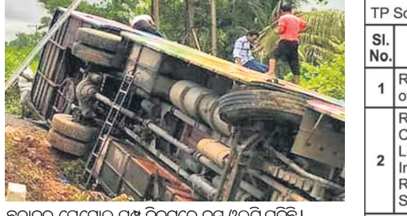
ଭଦ୍ରକର ସୁଗନ୍ଧା ଗ୍ରାମ ନିକଟରେ ବସ୍ ଓଲଟି ପଡ଼ିଛି