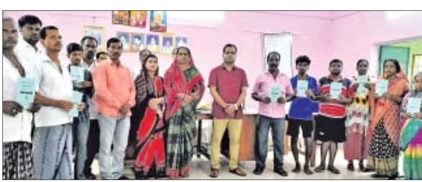
ପ୍ରଥମାଞ୍ଚି ପଞ୍ଚାୟତରେ ଭଡା ବଣ୍ଟନ କରାଯାଇଛି।