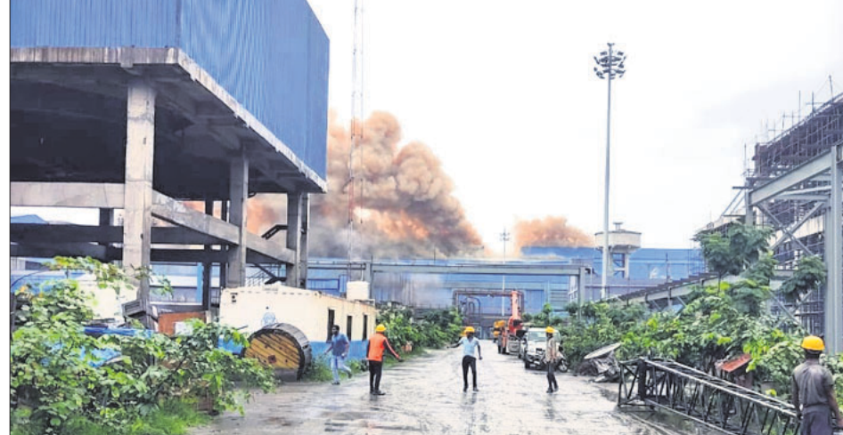
ବିଦ୍ୟୁତ୍ ସାମଗ୍ରୀ ସଂଗ୍ରହଣ ବିଘ୍ନରଣ

■ ଇଞ୍ଜିନିୟର, ଠିକାସଂସ୍ଥା ମୁଖ୍ୟ ଆହତ ■ ମଧ୍ୟାହ୍ନଭୋଜନ ଥିବାରୁ ଉର୍ଦ୍ଧ୍ୱଗଲ ଶ୍ରମିକ ■ ଚନ୍ଦ୍ର ଆରମ୍ଭ, କ୍ଷତିଗ୍ରସ୍ତ ଫର୍ମେସ୍ ମିଲିଟ୍ ବନ୍ଦ