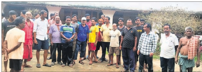
ଶିକ୍ଷକ ବଦଳି ବାତିଲ କରିବା କାର୍ଯ୍ୟାଳୟରେ ତାଲିକା ପକାଇ ଅଭିଭାବକଙ୍କୁ ଧାରଣା।