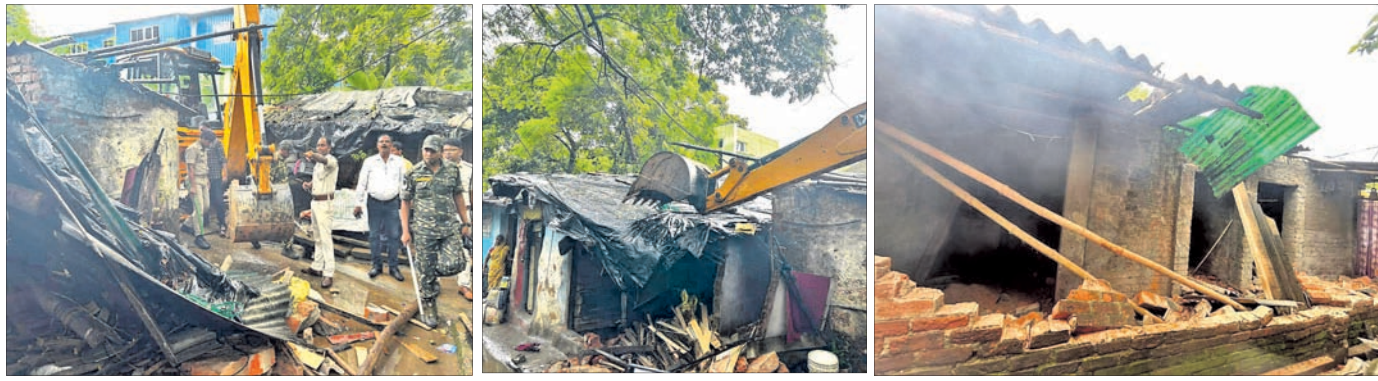
ୟୁନିଟ୍-୬ ରାଧାକ୍ରିଷ୍ଣନ ଉପର ବସ୍ତି, ୟୁନିଟ୍-୫ କେଶରୀନଗର ବସ୍ତି, ଜିଲ୍ଲା ବସ୍ତିରେ ଥିବା ଅପରାଧୀଙ୍କ ଘରକୁ କମିଶନରେଟ ପୋଲିସ ପକ୍ଷରୁ ଭଙ୍ଗାଯାଇଛି ।