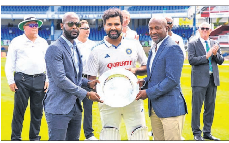
ଭାରତ ଓ ଫ୍ରେଜିଲିଟି ଶତକୀୟ ଶତକୀୟ ଭାଗୀଦାରି ପରେ ବିପର୍ଯ୍ୟୟ।

ପୋର୍ଟ ଅଫ୍ ସେନ୍, ୨୦୧୭ (ପି.ଟି.) ଫ୍ରେଜିଲିଟି ଓ ଭାରତ ମଧ୍ୟରେ ବିତୀୟ ଚାରିମ ଜଣଙ୍କ ଶତକୀୟ ଶତକୀୟ ଭାଗୀଦାରି ପରେ ବିପର୍ଯ୍ୟୟ।