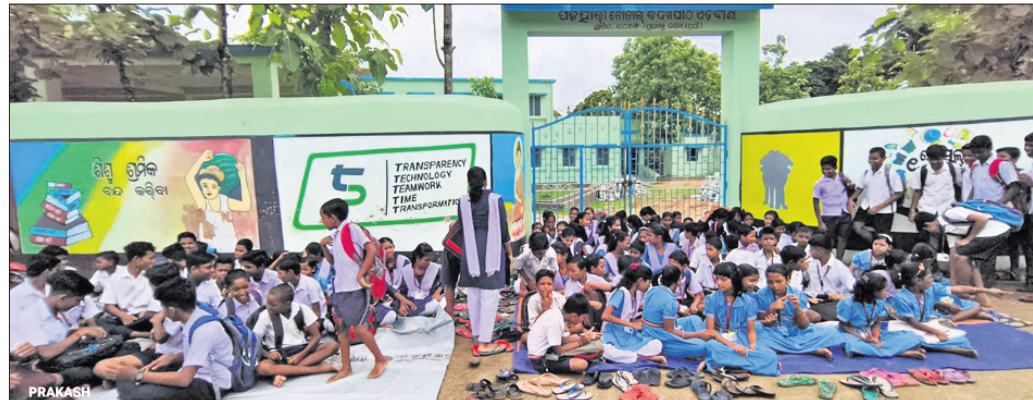
ପଢ଼ିଆରୀ ନୋଡାଲ ବିଦ୍ୟାପୀଠ ଫାଟକରେ ତାଳା ପକାଇ ଛାତ୍ରାଛାତ୍ରୀ ଧାରଣାରେ ବସିଛନ୍ତି ।

୫-ଟି ସ୍କୁଲରୁ ପ୍ଲାଷ୍ଟର ଖସିବା ଘଟଣା ■ ଆହତ ଶିକ୍ଷୟିତ୍ରୀଙ୍କୁ ଭେଟିଲେ ୪ଜଣିଆ ଭାଙ୍ଗିଯାଏ ଟିମ୍ ■ ଜିଲାପାଳ, ଜିଲାପ୍ରଧାନ ଅଧିକାରୀଙ୍କ ତତ୍ପର ଦାବି ଅଗ୍ରଭଙ୍ଗ, ୨୦୧୭ (ମମତା ଜେନା)