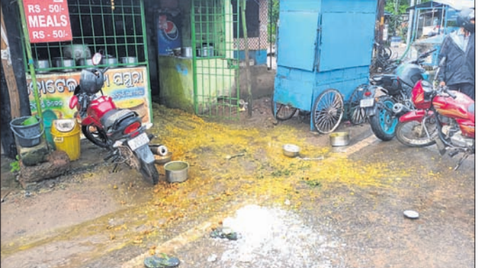
ଉଦ୍‌ଘାଟନାବେଳେ ହୋଟେଲର ଖାଦ୍ୟକୁ ବାହାରକୁ ଫିଙ୍ଗା ଯାଇଛି।