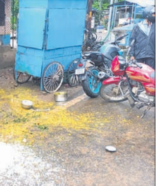
କୋଇଲାରେ ରୋଷେଇ ହେଉଥିବା ଦେଖି ଉକ୍ତ ହୋଟେଲକୁ ସିଲ୍ କରିଥିଲା।