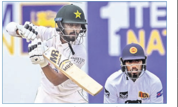
ପ୍ଲେୟର ଅଫ୍ ଦି ମ୍ୟାଚ୍ ସଭର ସକଳ।

କିଛି ପାକିସ୍ତାନ ଅଧିନାୟକଙ୍କୁ ୨୪ରେ ଆଉଟ କରି ପ୍ରଭାତ ଜୟହ୍ନିୟା ଶ୍ରୀଲଙ୍କା ପାଇଁ ଆଶା ସୂଚୀ କରିଥିଲେ।