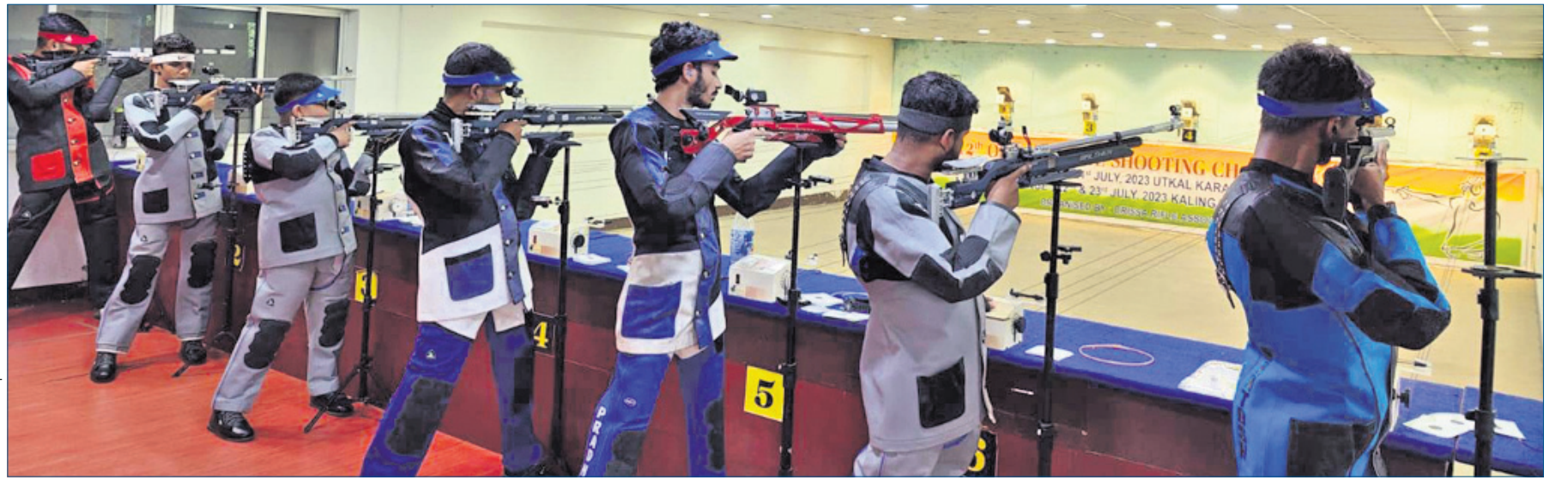
ରାଜ୍ୟ ବନ୍ଧୁକଚାଳନା ପ୍ରତିଯୋଗିତାରେ ଭାଗ ନେଇଥିବା ପ୍ରତିଯୋଗୀ।

ଭୁବନେଶ୍ୱର, ୨୦୧୭ (ବିଜୟ ରଣା) ଶ୍ରୀମତୀ ଉତ୍କଳ କରାଣେ ସ୍କୁଲ ପରିସରରେ ବ୍ରାଦଶ ରାଜ୍ୟ ବନ୍ଧୁକ ଚାଳନା ପ୍ରତିଯୋଗିତା ଗୁରୁବାରଠାରୁ ଆରମ୍ଭ ହୋଇଛି।