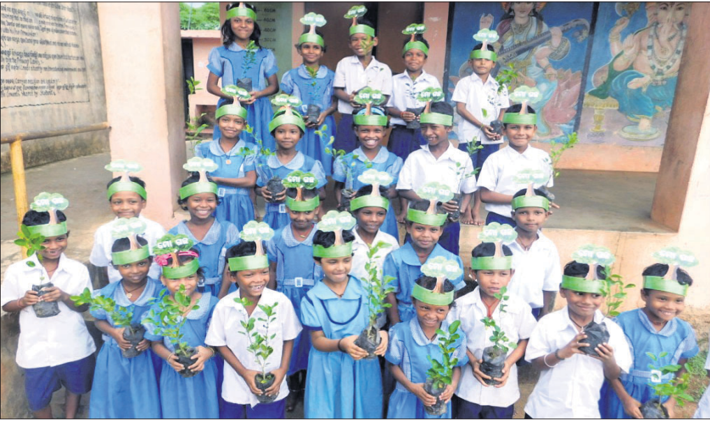
ଚିତ୍ରଧା ପାଠଶାଳା ଗ୍ରନ୍ଥ ପକ୍ଷରୁ ଛତାବର ପଞ୍ଚାୟତ ବିକାଶିକା ପ୍ରାଥମିକ ବିଦ୍ୟାଳୟରେ 'ମୋ ଗଛ' ସଚେତନତା କାର୍ଯ୍ୟକ୍ରମର ଶୁଭାରମ୍ଭ ଅବସରରେ ଛାତ୍ରାଛାତ୍ରୀ

ଭୁବନେଶ୍ୱର, ୨୦୧୭ (ବନ୍ଦନା ସେଠା): ଭୁବନେଶ୍ୱର ମହାନଗର ନିଗମ (ବିଏମ୍‌ସି)ରେ ୪ଜଣ ହୋମିଓପାଥି ମେଡିକାଲ ଅଫିସର ପୁନଃ ଯୋଗଦେବେ। ଏନେଇ ଗୃହ ଓ ନଗର ଉନ୍ନୟନ ବିଭାଗ ପକ୍ଷରୁ ବିଏମ୍‌ସି କମିଶନର ବିଜୟ ଅମୃତା କୁଳାଙ୍ଗେଙ୍କୁ ଚିଠି ଲେଖି ଅବଗତ କରାଯାଇଛି। ଅବସର ନେଇଥିବା ଏହି ୪ଜଣ ହୋମିଓପାଥି ମେଡିକାଲ ଅଫିସରଙ୍କ ପୁନଃ ନିଯୁକ୍ତି ନେଇ ବିଏମ୍‌ସି ଦ୍ୱାରା ୨୦୨୨ ଡିସେମ୍ବର ୨୯ରେ ପ୍ରସ୍ତାବ ଦିଆଯାଇଥିଲା। ଏବେ ଏହାକୁ ଅନୁମୋଦନ ଦିଆଯାଇଥିବା ବିଭାଗ ଅନୁସନ୍ଧିତ ଦାଖଲର ମାଧ୍ୟମରେ ଚିଠିରେ ଉଲ୍ଲେଖ କରିଛନ୍ତି। ଖୁବ୍ଶୀଘ୍ର ବିଏମ୍‌ସିରେ ୪ଜଣ ହୋମିଓପାଥି ମେଡିକାଲ ଅଫିସର ନିଯୁକ୍ତ ହେବେ। ସେମାନଙ୍କ ଲାଗି ଆବଶ୍ୟକ ଥିବା ଅର୍ଥ ରାଶି ବ୍ୟବସ୍ଥା ବିଏମ୍‌ସି ନିକଷ୍ପ ପାଣ୍ଠିକୁ କରିବ ବୋଲି ଚିଠିରେ ଉଲ୍ଲେଖ କରାଯାଇଛି।