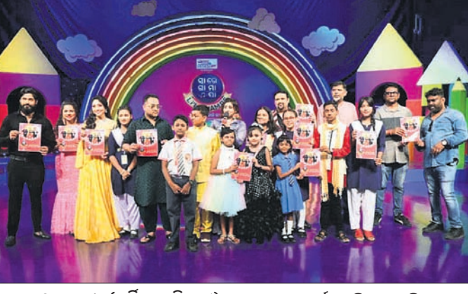
ଭୁବନେଶ୍ୱର, ୨୦୧୭ (ଶର୍ମିଷ୍ଠା ପାଣିଗ୍ରାହୀ)

ବଡ଼ ପୁଅ ପର୍ଯ୍ୟାୟ ପ୍ରତିଭାର ଏହି ମଞ୍ଚରେ କା-ସାଥକରେ ଆସନ୍ତା ୨୨ ତାରିଖରୁ ଆରମ୍ଭ ହେବାକୁ ଯାଉଛି ଓଡ଼ିଶାର ବିଜ୍ଞାନ ରିଆଲିଟି ଶୋ 'ସାରେଗାମାପା ଲିଟିଲ ଚାମ୍ପସ-ଆଜି ଛୋଟ କାଲି ଉତ୍ସାହ'। ଏହି ମେଘା ରିଆଲିଟି ଶୋ ପୁଣିଥରେ ଦର୍ଶକଙ୍କ ପାଖକୁ ଫେରୁଥିବା କା-ସାଥକ ପକ୍ଷରୁ ସୂଚନା ଦିଆଯାଇଛି। ପ୍ରତି ଶନିବାର ଓ ରବିବାର ରାତି ୯ଟା ୩୦ରେ ଏହା ପ୍ରସାରିତ ହେବ। ସ୍ୱର ବ୍ୟାଗରେ ଚୁକ୍ତପୁସ୍ତକ କାଗଜ ପତ୍ର ଥିଲା। ଅଭିଯୋଗକୁ ଭିଜି କରି ପୋଲିସ୍ ସହିତ ବିଏମ୍‌ସିରୁ ଉଦ୍‌ଘାଟିତ ହେବ ଏହି ଶୋ' ଏକ କୁନି କଳାକାରଙ୍କ ପାଇଁ ଏହି ଶୋ' ଏକ