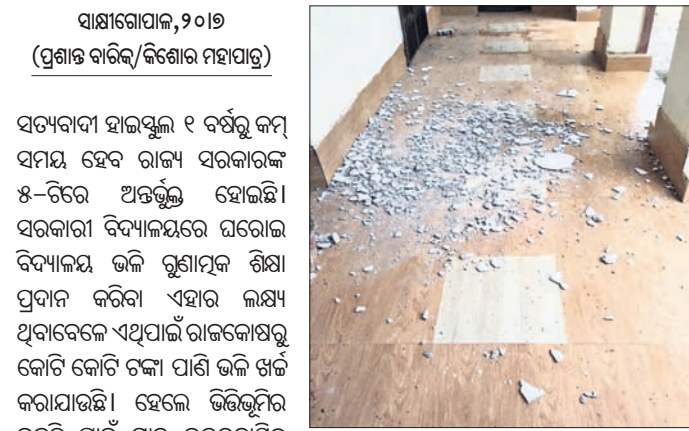
ସତ୍ୟବାଦୀ ହାଇସ୍କୁଲ ୧ ବର୍ଷରୁ କମ୍ ସମୟ ହେବ ରାଜ୍ୟ ସରକାରଙ୍କ ୫-ଟିର ଅନ୍ତର୍ଭୁକ୍ତ ହୋଇଛି। ସରକାରୀ ବିଦ୍ୟାଳୟରେ ଘରୋଇ ବିଦ୍ୟାଳୟ ଭଳି ରୂପାନ୍ତର ଶିକ୍ଷା ପ୍ରଦାନ କରିବା ଏହାର ଲକ୍ଷ୍ୟ ଥିବାବେଳେ ଏଥିପାଇଁ ରାଜକୋଷରୁ କୋଟି କୋଟି ଟଙ୍କା ପାଣି ଭଳି ଖର୍ଚ୍ଚ କରାଯାଇଛି। ହେଲେ ଭିତ୍ତିଭୂମିର ଉନ୍ନତ ପାଇଁ ମାତ୍ର ଉଦ୍‌ଗ୍ରହଣ ହେବ ନ ଥିବା ଭଳି ସମସ୍ୟା ସୃଷ୍ଟି ହେଉଥିବା ଅନେକ ଅଭିଭାବକ ଅଭିଯୋଗ କରିଛନ୍ତି। ଖବର ନେବାରେ ଜଣାପଡ଼ିଛି, ଗୁରୁବାର ବିଦ୍ୟାଳୟର ଜଣେ କର୍ମଚାରୀ, ଗୁରୁବାର ବିଦ୍ୟାଳୟର ଜଣେ କର୍ମଚାରୀ ଅର୍ଥ କାର୍ଯ୍ୟାଳୟ ଖୋଲିବାବେଳେ କାର୍ଯ୍ୟାଳୟ ଭିତରେ ଏକ ବିଷଧର ତମ୍ବୁ ସାପ ଦେଖିଥିଲେ। ଏ ବିଷୟରେ ସ୍କୁଲ ପ୍ରଧାନଶିକ୍ଷକଙ୍କୁ ଅବଗତ କରାଗଲା। ପ୍ରଧାନ ଶିକ୍ଷକ ଓ ଉପସ୍ଥିତ ଅନ୍ୟ ଶିକ୍ଷୟିତ୍ରୀ ଶିକ୍ଷକ ଯୋଗରେ ପହଞ୍ଚି ସାପକୁ ଦେଖିଥିଲେ ମଧ୍ୟ ସାପଟି ଚୁପ୍ ଭିତରେ ଥିବା ବିଭିନ୍ନ ଆସବାବ ଭିତରେ ପଶିଯାଇଥିଲା। ଦୀର୍ଘ ସମୟ ଚେଷ୍ଟା ପ୍ରତିଦିନ ଭୟଭୀତ ହୋଇ ଚଳୁଛନ୍ତି।