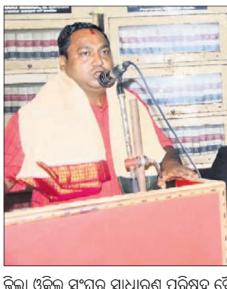
ଜିଲା ଓକିଲ ସଂଘର ସାଧାରଣ ପରିଷଦ ବୈଠକରେ ଉପସ୍ଥିତ ଅତିଥି ଓ ଅନ୍ୟମାନେ ।