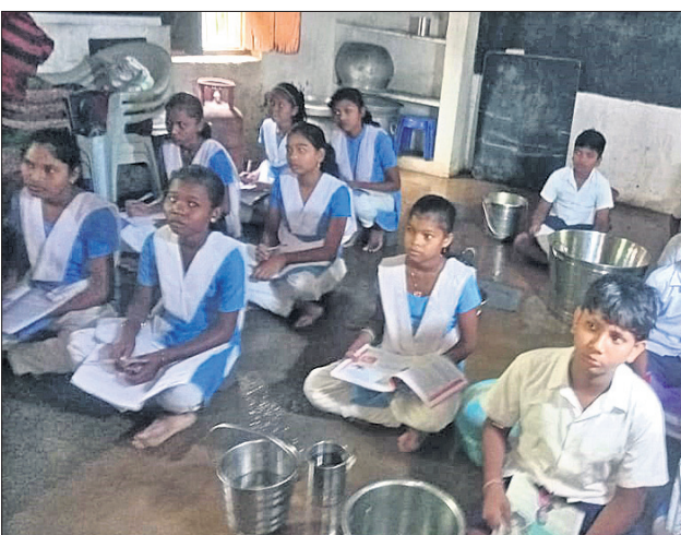
ବର୍ଷା ହେଲେ ଇଟା ପକାଇ ପାଠ ପଢ଼ୁଛନ୍ତି ଛାତ୍ରାଛାତ୍ର।

ବର୍ଷା ହେଲେ ଇଟା ପକାଇ ବସି ପାଠ ପଢ଼ୁଛନ୍ତି। ବିନିକା, ୨୨।୭ (ରାମ ଗୋପାଳ ବାବୁ) ସୁବର୍ଣ୍ଣପୁର ଜିଲା ବିନିକା ସହରାଞ୍ଚଳ ୧୨ ନମ୍ବର ଖାର୍ତ୍ତରେ ଥିବା ନୂଆପାଲି ପ୍ରାଥମିକ ବିଦ୍ୟାଳୟ ନା ନା ଅବ୍ୟବସ୍ଥା ମଧ୍ୟରେ ଚାଲିଛି। ପ୍ରଥମରୁ ଅଷ୍ଟମ ଶ୍ରେଣୀ ପର୍ଯ୍ୟନ୍ତ ଏହି ବିଦ୍ୟାଳୟରେ ଦୁଇଟି ଶ୍ରେଣୀ ଗୃହ ରହିଛି। ସେଥିରୁ ଗୋଟିଏ କୋଠା ଘର ହୋଇଥିବା ବେଳେ ଗୋଟିଏ ଘରର ଆକବେଷ୍ଟ ସଜାତ ରହିଛି। ଗତ ଲଗାଣ ବର୍ଷରେ ବିଦ୍ୟାଳୟ କୋଠା ଭିତରେ ପାଣି ଜମି ରହିଥିବାରୁ ଛାତ୍ରାଛାତ୍ର ଇଟା ପକାଇ ତା ଉପରେ ବସି ପାଠ ପଢ଼ିବା ଦେଖିବାକୁ ମିଳିଥିଲା। ଆକବେଷ୍ଟ ଉପରେ ଯାଇଥିବାରୁ ବର୍ଷା ହେଲେ ପାଣି ଗରୁଛି। ଫଳରେ ଶ୍ରେଣୀଗୁଡ଼ିକରେ ପାଣି