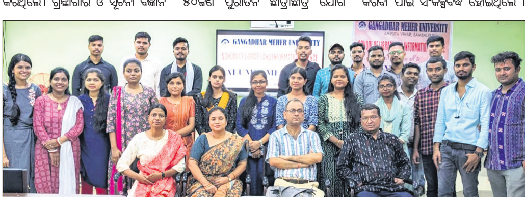
ସମାବେଶରେ ଯୋଗଦେଇଥିବା ପୁରାତନ ଛାତ୍ର ।

ଦେଇଥିଲେ । ଏତଦ୍ୱ୍ୟତୀତ ଆଭାସି ଛାତ୍ରଛାତ୍ରୀଙ୍କୁ ମଧ୍ୟ ବହୁ ପୁରାତନ ଛାତ୍ରଛାତ୍ରୀ ଅଂଶଗ୍ରହଣ କରିଥିଲେ । ପୁରାତନ ଛାତ୍ରଛାତ୍ରୀଙ୍କୁ ନୂତନ ଛାତ୍ରଛାତ୍ରୀଙ୍କୁ ପ୍ରେରଣା ଦେବା ସହ ଜିଏମ୍ସୁ ଗ୍ରନ୍ଥାଗାର ଓ ସୂଚନା ବିଭାଗ ଉନ୍ନତ ନିମନ୍ତେ କାର୍ଯ୍ୟ କରିବା ପାଇଁ ଏକକ୍ଷରକ୍ଷ ହୋଇଥିଲା ।