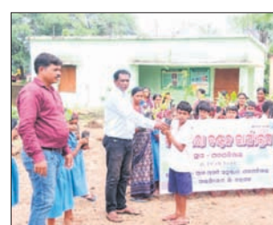
ଛାତ୍ରାଛାତ୍ରୀଙ୍କୁ ଫଳଗଣା ବଣ୍ଟନ କରାଯାଉଛି ।