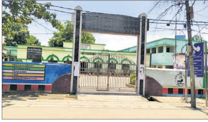
ସୋନପୁର ମହାରାଜା ହାଇସ୍କୁଲ।

ବର୍ତ୍ତମାନ ପରିସ୍ଥିତିରେ ରାଜ୍ୟ ସରକାର ହାଇସ୍କୁଲ ଶିକ୍ଷାକୁ ଅଧିକ ଗୁରୁତ୍ୱ ଦେଉଥିବା କହୁଛନ୍ତି। ୫-ଟି ଜିଲ୍ଲାରେ ବିଦ୍ୟାଳୟ ଭିତ୍ତିଭୂମି ନିର୍ମାଣ କରାଯାଇ ସହ ଆଧୁନିକ ଶିକ୍ଷା ପ୍ରଣାଳୀ ପ୍ରଣୟନ କରୁଛନ୍ତି। ୩ ଟି ପର୍ଯ୍ୟାୟରେ ୫-ଟି ଅଧୀନରେ ସୁବର୍ଣ୍ଣପୁର ଜିଲାର ୯୯ଟି ହାଇସ୍କୁଲକୁ ରୂପାନ୍ତରଣ କରାଯାଇଛି। ପୁଖ୍ୟମନ୍ତ୍ରୀ ନବୀନ ପଟ୍ଟନାୟକ ଭୂଖଣ୍ଡ ମୋଡ୍ରେ ଏହାର ଲୋକାର୍ପଣ କରିଛନ୍ତି। ଚତୁର୍ଥ ପର୍ଯ୍ୟାୟରେ ୨୫ଟି ହାଇସ୍କୁଲର ରୂପାନ୍ତରଣ କାର୍ଯ୍ୟ ଜାରି ରହିଛି। ଏହିସବୁ ବିଦ୍ୟାଳୟରେ ସ୍ନାତ୍ତ ଶ୍ରେଣୀଗୁଡ଼ିକ, ଅତି ଉତ୍କୃଷ୍ଟ ମାଧ୍ୟମରେ ଡିଜିଟାଲ ଶିକ୍ଷା, ଇ-ଲାର୍ନିଂ, ବିଜ୍ଞାନାଗାର, ଶୈବାଳୟ, ପାନୀୟ ଜଳ ଓ ଖେଳପଡ଼ିଆର ବ୍ୟବସ୍ଥା କରାଯାଇଛି। ତେବେ ବାହାରକୁଳାଳୟରେ ଯାଉଥିବା ହାଇସ୍କୁଲଗୁଡ଼ିକ ଦେଖିଲେ ଯିଏ ବି କହିବ ପାଠପଢ଼ା ନିହାତି ଭଲ ହେଉଥିବ। ହେଲେ ଜିଲାର ସମସ୍ତ ହାଇସ୍କୁଲଗୁଡ଼ିକର ଛାତ୍ର ଦେଖିଲେ ସୁବର୍ଣ୍ଣପୁର ଜିଲାରେ ଶିକ୍ଷକ ମନୁଷ୍ୟ ଏକ ପ୍ରମୁଖ ସମସ୍ୟା। ଅନେକ ସରକାରୀ ହାଇସ୍କୁଲରେ ପ୍ରାଥମିକ ଶିକ୍ଷକ ନାହାନ୍ତି। ଏପରିକି