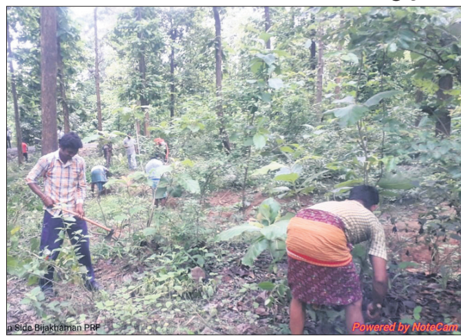
ଲଟାବୁଦା ସଫା କରାଯାଉଛି।

ନୂଆପତା ଜିଲା କୋମନା ବ୍ଲକ କୋମାବିରା ପଞ୍ଚାୟତ ଅନ୍ତର୍ଗତ ବିରୁନପଦର ଗାଁ ବିକାଶମନ ଜଙ୍ଗଲକୁ ଲାଗି କରି ରହିଛି। ଏବେ ଗ୍ରାମବାସୀ ଥିବା ଲଟାବୁଦା ସହ ଜଙ୍ଗଲ ଭିତରେ ଥିବା ଲଟା ଓ ବୁଦା ସବୁ ସଫା କରାଯାଉଛି। ୩୫୩ ନମ୍ବର ଜାତୀୟ ରାଜପଥର ଡାହାଣକୁ ବିକାଶମନ ରହିଥିବା ବେଳେ ବାମକୁ ବ୍ଲକ କାର୍ଯ୍ୟାଳୟ, ତହସିଲ କାର୍ଯ୍ୟାଳୟ, କୃଷି ବିଭାଗ, ସମନ୍ୱିତ ଶିଶୁ ବିଭାଗ, ଅଗ୍ନିଶମ ବିଭାଗ ସହ ଅନ୍ୟାନ୍ୟ କାର୍ଯ୍ୟାଳୟ ମାନ ରହିଛି। କାର୍ଯ୍ୟାଳୟକୁ ଲାଗି ଛୋଟ ବଡ଼ ଦୋକାନ ମଧ୍ୟ ରହିଛି। ଭାଲୁ ଆଡ଼େ ପରଠାରୁ ଅଧିକ ମାନକୁ ପାଇ ଭୟ କରୁଛନ୍ତି। ବିରୁନପଦରର ପାଖେଲିଆସିଲେ ଦେଇ ୩୫୩ ନମ୍ବର ବିଲେଇଅଞ୍ଜର ଦେଇ ୩୫୩ ନମ୍ବର ଜାତୀୟ ରାଜପଥକୁ ଆସୁଛନ୍ତି। ଜାତୀୟ ରାଜପଥକୁ ଆସିଲା ପରେ ଯିଏ ଯେଉଁ