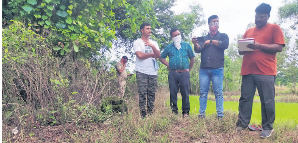
ଘଟଣାସ୍ଥଳରେ ମାଜିଷ୍ଟ୍ରେଟ ଓ ପୋଲିସ୍।