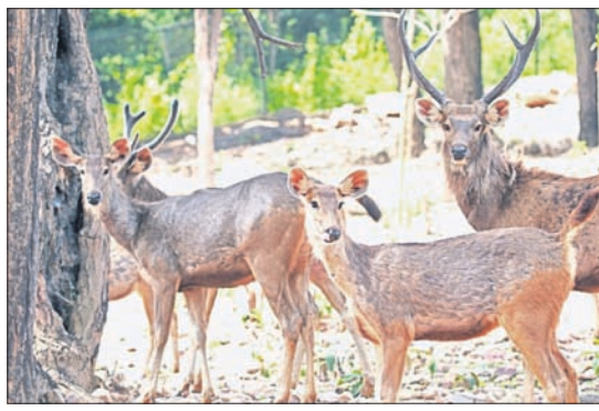
ପ୍ରାଣୀ ଉଦ୍ୟାନ ଓ ଉଦ୍ଧାର କେନ୍ଦ୍ରରେ ହରିଶ।

ସମ୍ବଲପୁର, ୨୨୧୭(ଶୁଭାଶିଷ ପାଠୀ) ସମ୍ବଲପୁର ମୋତିଝରଣାଠାରେ ଥିବା ତୁ (ଡିଡିଆଖାନା) ପ୍ରାଣୀ ଉଦ୍ୟାନ ଓ ଉଦ୍ଧାର କେନ୍ଦ୍ର ନାମରେ ନାମିତ ହୋଇଛି। ରାଜ୍ୟ ସରକାରଙ୍କ ଜଙ୍ଗଲ ବିଭାଗ ଏହାର ନାମ ପରିବର୍ତ୍ତନ କରିଛନ୍ତି। ହାରାକୁଦ ଖାଲକୁ ଲାଲପୁ ଡିଡିକନ ୬୦୦୦ରୁ ଅଧିକ ଉଦ୍ଧାର ସହ ୪ହେକ୍ଟର ପରିମିତ ଅଞ୍ଚଳରେ ଗତବର୍ଷ ବନାନିକାଳୁ ବନ୍ଦିତା ଆରମ୍ଭ କରିଥିଲା। ଏହା ପ୍ରାଣୀ ଉଦ୍ୟାନର ପ୍ରାଣୀମାନଙ୍କ ପାଇଁ ସବୁଜ ବେଲୁ ଭାବରେ କାର୍ଯ୍ୟ କରୁଛି। ଏହି ପ୍ରାଣୀ ଉଦ୍ୟାନକୁ ପୂର୍ବରୁ ହରିଶ ପାର୍କ୍ ଏବଂ ବନପ୍ରାଣୀ ସଂରକ୍ଷଣ କେନ୍ଦ୍ର ଭାବରେ ନାମିତ କରାଯାଇଥିଲା। ୧୯୮୦ରେ ୧୩ ହେକ୍ଟର ଅଞ୍ଚଳରେ ଏହା ପ୍ରତିଷ୍ଠା କରାଯାଇଥିଲା। ବର୍ତ୍ତମାନ ପ୍ରାଣୀ ଉଦ୍ୟାନରେ ୨୭ ଏନ୍ଡୋଜର ସହ ୧୫ ପ୍ରଜାତିର ୩୩୩ ପ୍ରାଣୀ ଅଛନ୍ତି। ସେମାନଙ୍କ ମଧ୍ୟରେ କଲରାପତରିଆ ବାଘ, ଭାଲୁ, ରୁସିଙ୍ଗା, ପାଲଥନ ଓ ମୟୂର ରହିଛନ୍ତି। ହରିଶ ସଂଖ୍ୟା ସର୍ବାଧିକ ୧୨୩ ଥିବାବେଳେ ଶମ୍ବର ୪୧ ଓ ୫୮ ଭାଲୁ