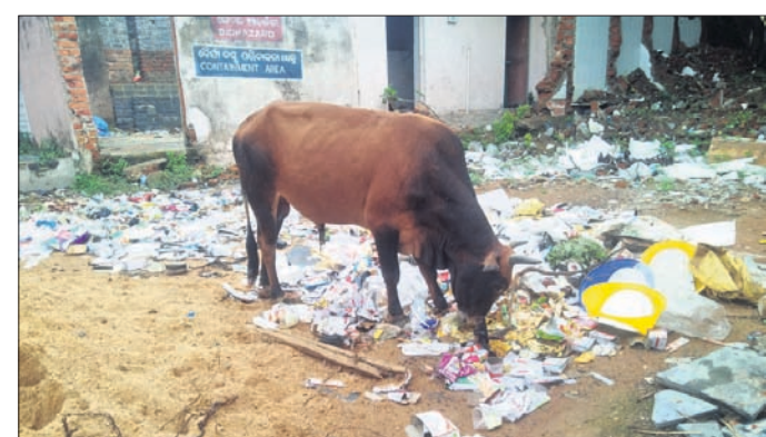
ସହରାଞ୍ଚଳ ଗୋଷ୍ଠୀ ସ୍ୱାସ୍ଥ୍ୟକେନ୍ଦ୍ରର ବର୍ଜ୍ୟବସ୍ତୁ ପରିଚାଳନା କ୍ଷେତ୍ର ପରିସର ।

ରାଜ୍ୟର ବିଭିନ୍ନ ସ୍ଥାନରେ ଡେଙ୍ଗୁ ବ୍ୟାପିବାରେ ଲାଗିଛି । ଡେଙ୍ଗୁକୁ ନେଇ ସବୁଆଡ଼େ ଭୟ ଘାରିଛି । ଏଥିରୁ ବରଗଡ଼ ଜିଲ୍ଲା ମଧ୍ୟ ବାଦ୍ ପଡ଼ିନାହିଁ । ଇତିମଧ୍ୟରେ ଜିଲ୍ଲାରେ ଜଣେ ଡେଙ୍ଗୁ ରୋଗୀ ଚିହ୍ନଟ ହୋଇଛନ୍ତି । ତେବେ ସେ ସମ୍ପୂର୍ଣ୍ଣ ସୁସ୍ଥ ହୋଇଯାଉଥିଲେ ମଧ୍ୟ ଡେଙ୍ଗୁକୁ ନେଇ ଜିଲ୍ଲାବାସୀଙ୍କ ମଧ୍ୟରେ ଭୟ ଦୂର ହୋଇନାହିଁ । ଅନ୍ୟପଟେ ଡେଙ୍ଗୁ ପ୍ରତିକାର ପାଇଁ ଜିଲ୍ଲା ସ୍ୱାସ୍ଥ୍ୟ ବିଭାଗ ପକ୍ଷରୁ ଜିଲ୍ଲାର ବିଭିନ୍ନ ଅଞ୍ଚଳରେ ସଚେତନତା କାର୍ଯ୍ୟକ୍ରମ କରାଯାଉଛି । ପରିଷ୍କାର, ପରିଚ୍ଛେଦ ଆଦି ଉପରେ ଲୋକଙ୍କୁ ପରାମର୍ଶ ଦିଆଯାଉଛି । ହେଲେ ତାହା କେବଳ ସଚେତନତା କାର୍ଯ୍ୟକ୍ରମରେ ସୀମିତ ରହିଯାଉଛି । ଏପରିକି ଖୋର୍ଦ୍ଧା ସରକାର ସ୍ୱାସ୍ଥ୍ୟକେନ୍ଦ୍ର ପରିସର ଅପରିଷ୍କୃତ ହୋଇ ପଡ଼ିରହିଛି । ଏଥିରୁ ଜିଲ୍ଲାରେ ଡେଙ୍ଗୁ ସଚେତନତା କିଭଳି ଚାଲିଛି, ତାହା ସହଜରେ ଜଣାପଡ଼ୁଛି । ବରଗଡ଼ ସହରାଞ୍ଚଳ ଗୋଷ୍ଠୀ ସ୍ୱାସ୍ଥ୍ୟକେନ୍ଦ୍ରରେ ଏଭଳି ସ୍ଥିତି ଜଳଜଳ ହୋଇ ଦିଶୁଛି । ଏହି ସ୍ୱାସ୍ଥ୍ୟକେନ୍ଦ୍ର