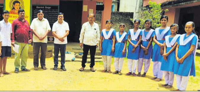
କୃମିକୀର ଶୁଦ୍ଧି ସ୍କୁଲର ସ୍କୁଲ କ୍ୟାମ୍ପରେ ମନ୍ତ୍ରୀମାନଙ୍କ ଓ ଶିକ୍ଷକମାନେ।