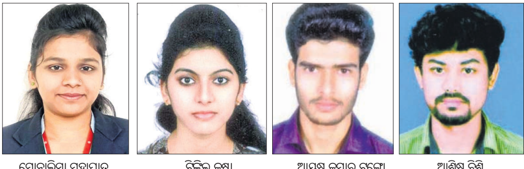
ବରଗଡ଼, ୨୨।୭ (ପ୍ରେମାନନ୍ଦ ଖମ୍ବାରୀ)