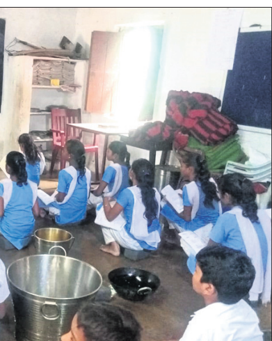
ଛାତ୍ରାଛାତ୍ର ଇଟା ପକାଇ ବସି ପାଠ ପଢ଼ୁଛନ୍ତି।