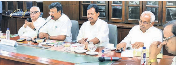
ଭୁବନେଶ୍ୱରର ଏକ ହୋଟେଲରେ ଅନୁଷ୍ଠିତ କଂଗ୍ରେସ ରାଜ୍ୟ କାର୍ଯ୍ୟକାରୀଣା ବୈଠକରେ ଉପସ୍ଥିତ ଦଳୀୟ ନେତୃତ୍ୱ ।