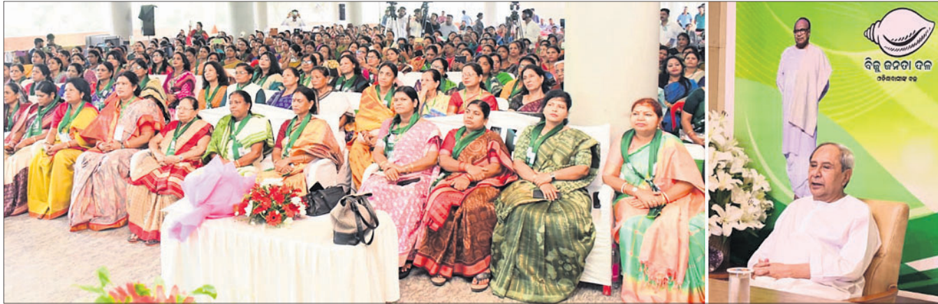
ଶଙ୍ଖଭବନଠାରେ ଶନିବାର ଅନୁଷ୍ଠିତ ବିଜୁ ମହିଳା ଜନତା ଦଳର ରାଜ୍ୟ କାର୍ଯ୍ୟକାରୀଣା ବୈଠକରେ ଭିଡ଼ିଓ କନ୍ଫରେନ୍ସରେ ବିଜେଡି ସଭାପତି ନବୀନ ପଟ୍ଟନାୟକ ଉଦ୍‌ଘୋଷଣା ଦେଉଛନ୍ତି

ସର୍ବାବକା: ଏହି କୁପନ ବ୍ୟବହାର କରି ସମ୍ପୂର୍ଣ୍ଣ ମାଗଣାରେ ଜନ୍ମଦିନ ଶୁଭେଚ୍ଛା ଜଣାନ୍ତୁ । ଫଟୋଗ୍ରାଫ ସହିତ କୁପନଟି ପ୍ରକାଶନ ତାରିଖର ୬ ଦିନ ପୂର୍ବରୁ ଜନ୍ମଦିନ ଶୁଭେଚ୍ଛା, ଧାରତ୍ରୀ, ବି-୨୬, ରଘୁଲଗତ ଶିଶୁାଳୟ, ଭୁବନେଶ୍ୱର-୧୦ ଠିକଣାରେ ପହଞ୍ଚାଇ ଆବଶ୍ୟକ ।