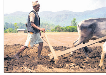
ବଡ଼ିଲ ବଜାରରେ ଯେଉଁ ଦର ବୁଦ୍ଧି ହୁଏ, ତାହାର ଗାପ ପଡ଼େ ଆମ ଉପରେ । ଦରମା ଭରା ବଡ଼ିବ ତ ତୁମ ସାମ୍ପ୍ର, ସାବୁନ, ପେଷ୍ଟ, ପାଉଁରର ବଡ଼ି, ଆମ ଡାଳି ଓ ତେଲର କାର୍ଯ୍ୟକ୍ଷେତ୍ର ? ଆମ ଜିବା, ସୋରିଷ ବା ଅବା ରସୁଣ କାର୍ଯ୍ୟକ୍ଷେତ୍ର ହେବ ?

ପିଛା ଦେହଶୁଦ୍ଧ, ବାଜରଣ ଅଶୀ, ଭେଣ୍ଡି, କଲରା ଓ ପୋଚଳ ଆଦି ପରିବାର ଦର ଆକାଶକୁଆଁ ସହିତ ଡାଳି, ଚାଉଳ ମଧ୍ୟ ଅଦର ଦର । ସୁତରାଂ, ଏମନ୍ତ ବିଷମ ବେଳାରେ ଜଣେ ନିମ୍ନ ମଧ୍ୟତର ବେତନଭୋଗୀ ଲୋକର ଅନ୍ତରକୁ ଅତିଥି ସହାରଦ ବିଦ୍ୟା ଅନୁଭବ ଚିକକ ନିର୍ଦ୍ଦୀପିତ ହୋଇଯିବାର କିଛି ଦୈନିକ ନାହିଁ । ତଥାପି ମୁହଁରେ କୃତ୍ରିମ ହସ ପୁଟାଳି ବନ୍ଧୁ ତାଙ୍କ ସମ୍ପର୍କୀୟଙ୍କୁ ସ୍ୱାଗତ କରିଥିଲେ । ସେଇ ସମ୍ପର୍କରେ ପରିବା ହାତକୁ ସାତଗହ ଟଙ୍କା ଦିନିମୟରେ ତଥାପି ନିଜ ଝୁଲି ପୁରାଇବାରେ ଅସମର୍ଥ ବନ୍ଧୁଙ୍କ ବିଷୟ ବଦନ ଦେଖି ନାରଣ କଳା ପୁରବିସ୍ମୟକ ମନ୍ତବ୍ୟ ଦେଲେ, “ଘରକୁ ଲାଗି ଏତେ ଜାଗା ଥାଇ ଥାଇ ବଜାରକୁ ପୁଣି ଶାଗ କିଣନ୍ତୁ ? ଶାଗ ମଧ୍ୟା ଛିଡ଼ା କରାଇଥିଲେ ଏବେ ତ ପରିବା ଖର୍ଚ୍ଚ କିଛି କମିଯାଉଥା'ନ୍ତା ।”