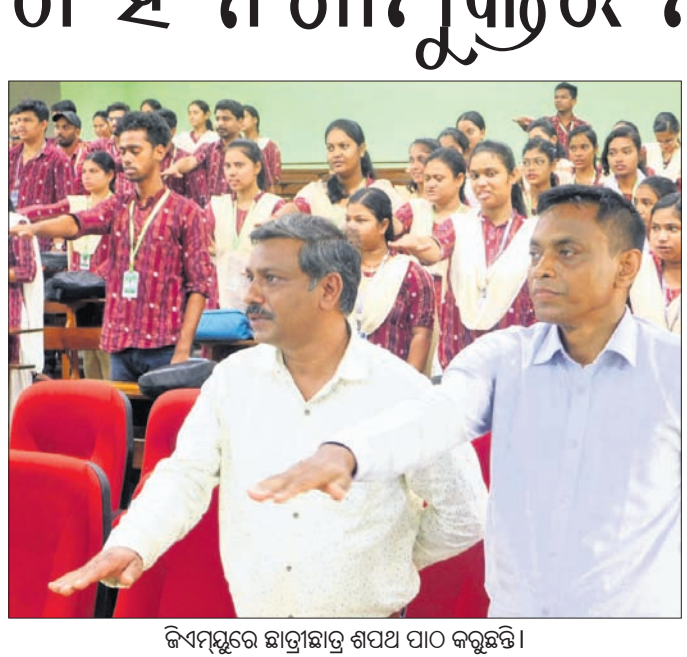
ଜିଏମ୍ସୁରେ ଛାତ୍ରଛାତ୍ରୀଙ୍କୁ ଶପଥ ପାଠ କରୁଛନ୍ତି ।