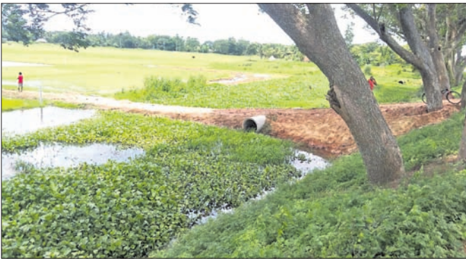
ନୟନଯୋଗି କେନାଲର ପ୍ରଦେଶ ପଥରେ ବନ୍ଧ।

କେନାଲ ଜଳ ଲୋକଙ୍କ ଚାଷ ଜମି ପହଞ୍ଚି ପାରୁନାହିଁ। ଫଳରେ ଚାଷୀ ଫସଲହାନୀ ସମ୍ଭବ ହେଉଛି।