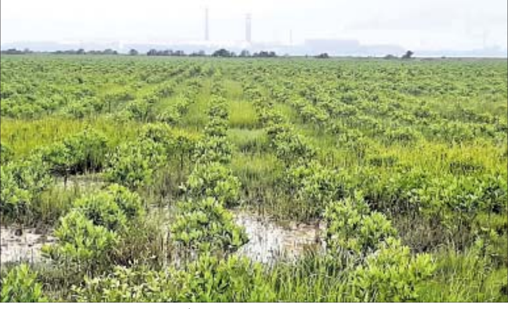
ରୁକ ଅଧୀନ ବସନ୍ତର ନିପତିଆ, ବଡ଼ ରୁଦ୍ଧ ଗ୍ରାମ ପାର୍ଶ୍ୱ ଶହେ ହେକ୍ଟର ଅଧିକ ସରକାରୀ ଜମିରେ ଲୁଣା କାଟାୟ ଚାରା ରୋପଣ ।