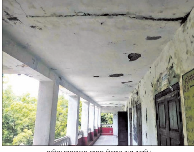
ବାଲିକା ହାଇସ୍କୁଲର ଛାତ୍ର ବିପେଶ ଖଣ୍ଡ ଖସୁଛି।

ଧର୍ମାତ୍ମକ ଭାବେ ଧାର୍ଯ୍ୟାତ୍ମକ ଉପାୟ ଗ୍ରହଣ କରିବା ପାଇଁ ସମର୍ଥନ ଯାଚୁଛନ୍ତି। ଧର୍ମାତ୍ମକ ଭାବେ ଧାର୍ଯ୍ୟାତ୍ମକ ଉପାୟ ଗ୍ରହଣ କରିବା ପାଇଁ ସମର୍ଥନ ଯାଚୁଛନ୍ତି।