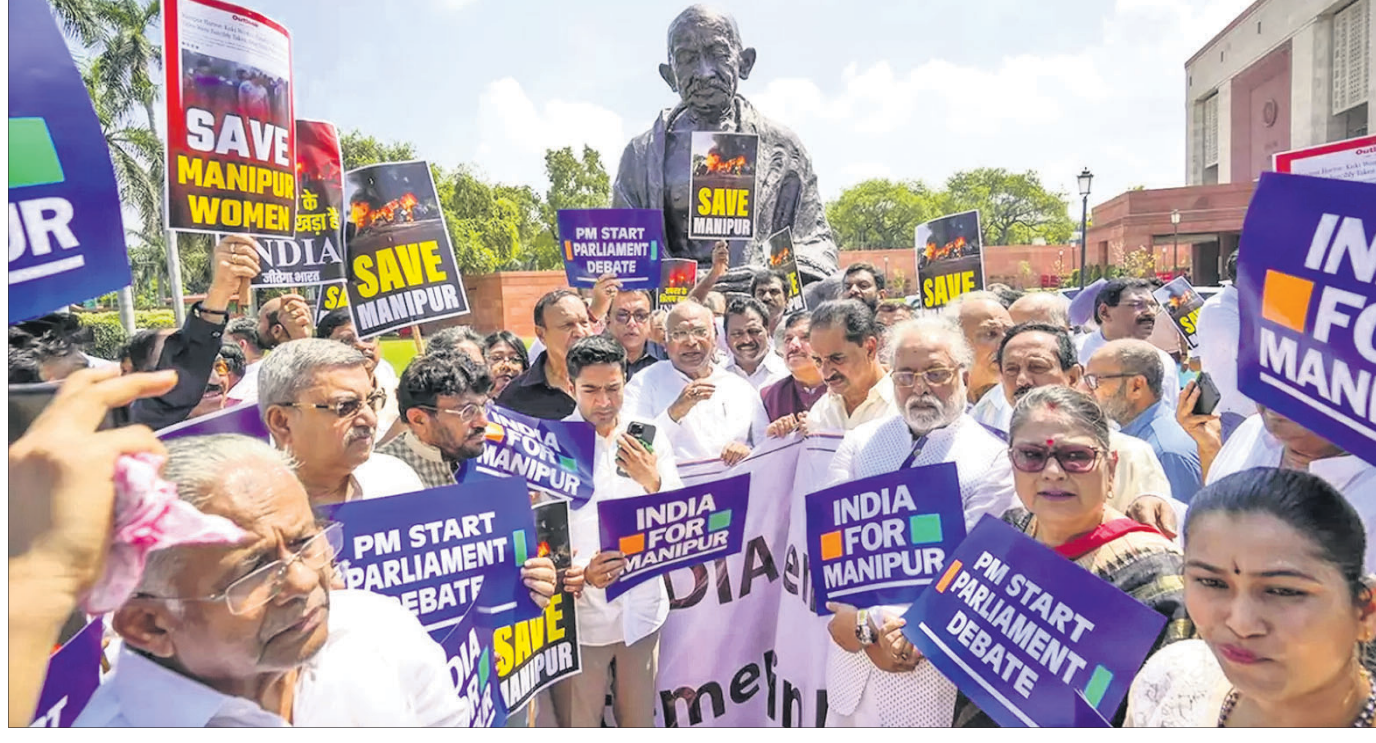
ମଣିପୁର ପ୍ରସଙ୍ଗରେ ପ୍ରଧାନମନ୍ତ୍ରୀ ନରେନ୍ଦ୍ର ମୋଦିଙ୍କ ବିକୃତି ଦାବି କରି ପାର୍ଲିମେଣ୍ଟ ପରିସରରେ ଯୋଗଦାନ ରାଜ୍ୟ ସଭା ବିରୋଧୀ ଦଳ ନେତା ମଲିକାର୍ଜୁନ ଖାରୋଙ୍କ ସମେତ 'ଇଣ୍ଡିଆ' ମେଣ୍ଡର ଏମ୍‌ପିମାନେ ବିରୋଧ ପ୍ରଦର୍ଶନ କରୁଛନ୍ତି।