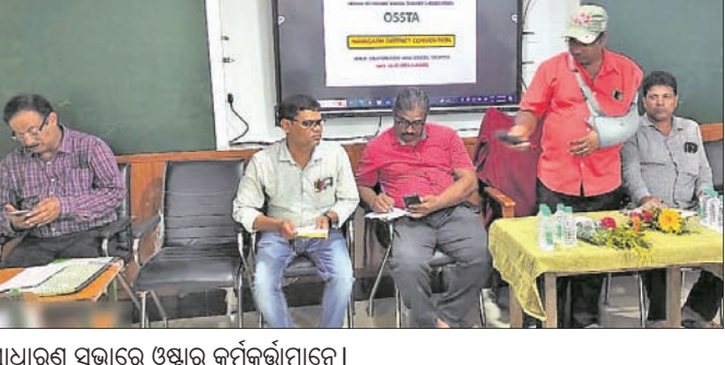
ସାଧାରଣ ସଭାରେ ଓଷ୍ଟର କର୍ମକର୍ମୀମାନେ।

ଧର୍ମାତ୍ମକ ଭାବେ ଧାର୍ଯ୍ୟାତ୍ମକ ଉପାୟ ଗ୍ରହଣ କରିବା ପାଇଁ ସମର୍ଥନ ଯାଚୁଛନ୍ତି। ଧର୍ମାତ୍ମକ ଭାବେ ଧାର୍ଯ୍ୟାତ୍ମକ ଉପାୟ ଗ୍ରହଣ କରିବା ପାଇଁ ସମର୍ଥନ ଯାଚୁଛନ୍ତି।