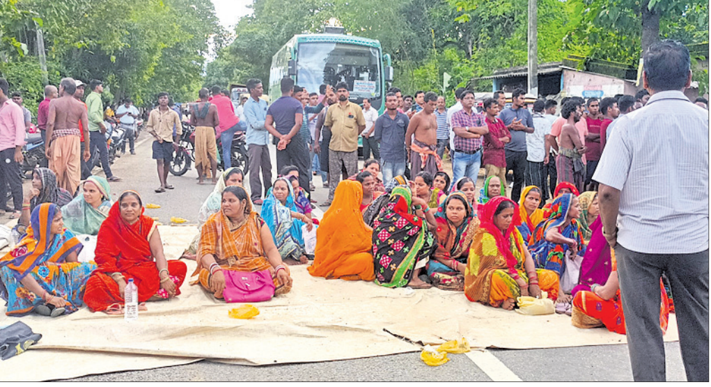
ଯୋଜନା ନିର୍ମାଣ ଦାବିରେ ମହିଳାମାନଙ୍କ ଦ୍ୱାରା ରାସ୍ତାଚାରଣ।