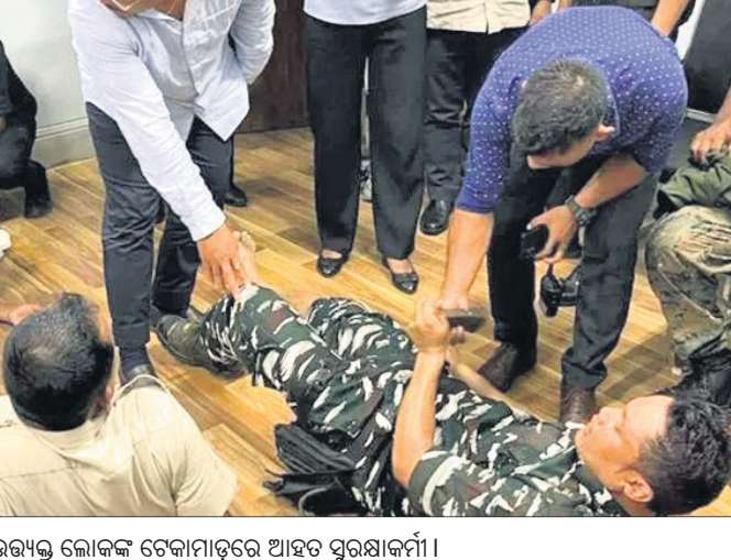
ଉତ୍ତମ ଲୋକଙ୍କ ଚେକାମାଡ଼ରେ ଆହତ ସୁରକ୍ଷାକର୍ମୀ।

ପିଲିବା ଆରମ୍ଭ କରିଥିଲେ। ସେଠାରେ ଥିବା ସୁରକ୍ଷାକର୍ମୀ ମୁଖ୍ୟମନ୍ତ୍ରୀଙ୍କୁ କାର୍ଯ୍ୟାଳୟ ଭିତରକୁ ସୁରକ୍ଷିତ ଭାବେ ନେଇଯାଇଥିଲେ।