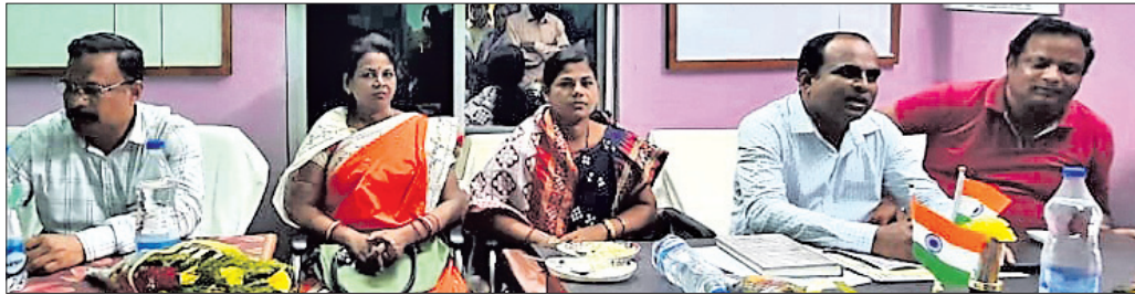
ପଲ୍ଲୀରେ ପ୍ରଶାସନ କାର୍ଯ୍ୟକ୍ରମରେ ଉପସ୍ଥିତ ଅତିଥି।