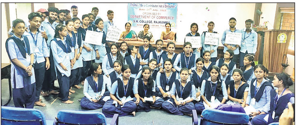
ଆୟକର ଦିବସ କାର୍ଯ୍ୟକ୍ରମରେ ଉପସ୍ଥିତ ଛାତ୍ରଛାତ୍ରୀ ଓ ଶିକ୍ଷୟିତ୍ରୀଶିକ୍ଷକମାନେ।

ଗରଦପୁର ବ୍ଲକ୍ ବନ୍ତଳା ପଞ୍ଚାୟତ କାର୍ଯ୍ୟାଳୟ ପରିସରରେ ଯୋଜନା ପଲ୍ଲୀରେ ପ୍ରଶାସନ କାର୍ଯ୍ୟକ୍ରମ ଅନୁଷ୍ଠିତ ହୋଇଥିଲା।