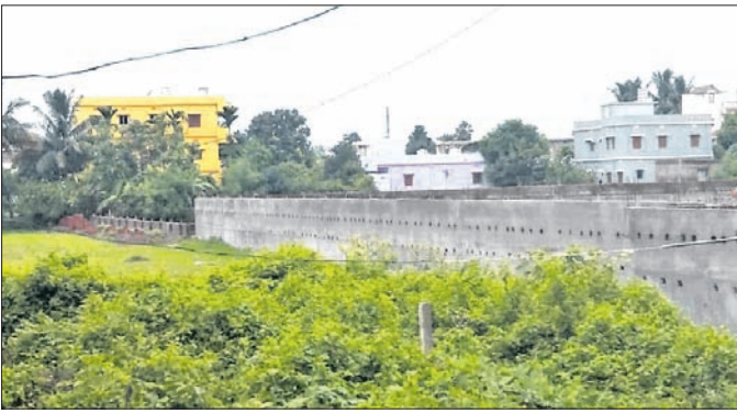
ଜଳ ପ୍ରଦେଶପଥକୁ ଜବରଦଖଲ କରାଯାଇଛି।

କେନାଲ ଜଳ ଲୋକଙ୍କ ଚାଷ ଜମି ପହଞ୍ଚି ପାରୁନାହିଁ। ଫଳରେ ଚାଷୀ ଫସଲହାନୀ ସମ୍ଭବ ହେଉଛି।