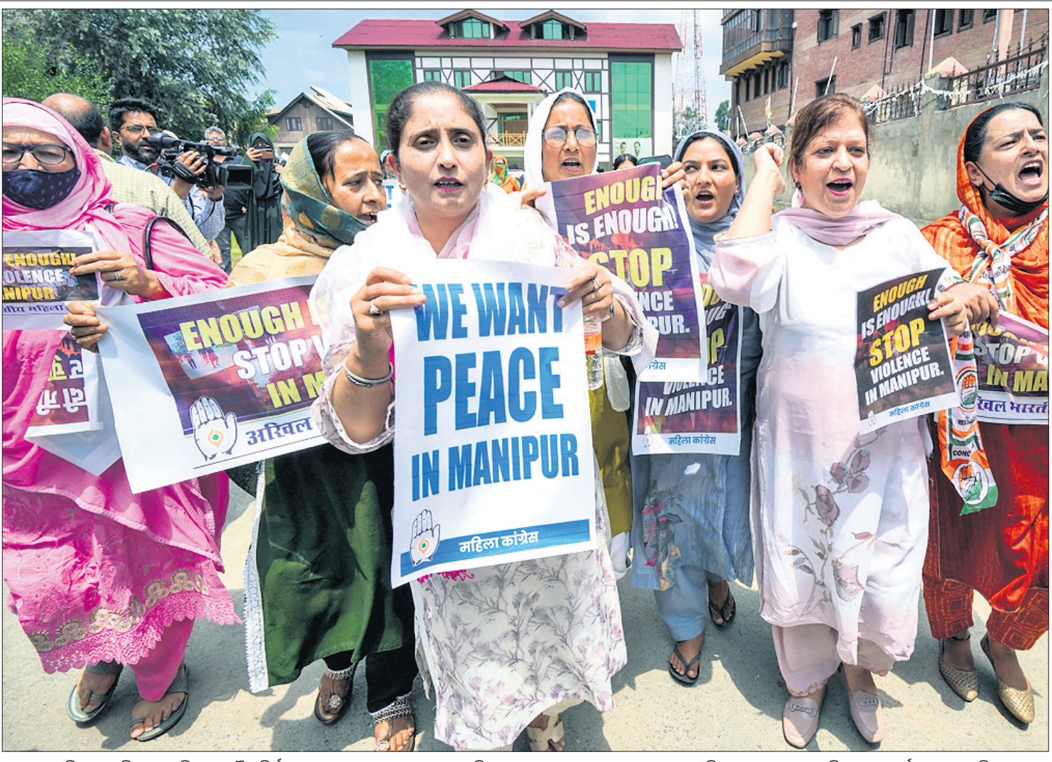
ମଣିପୁରରେ ହିଂସା ଓ ମହିଳାଙ୍କୁ ଯୌନ ନିର୍ଯାତନା ଘଟଣାରେ କେନ୍ଦ୍ର ସରକାରଙ୍କ ବିରୋଧରେ ସୋମବାର ଶ୍ରୀନଗରଠାରେ ମହିଳା କଂଗ୍ରେସ ପକ୍ଷରୁ ବିରୋଧ ପ୍ରଦର୍ଶନ କରାଯାଇଛି।