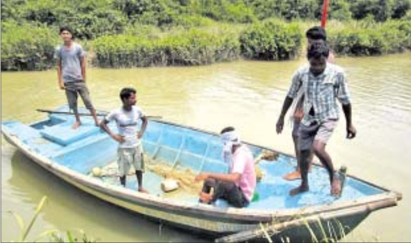
ଭିତରକନିକାର କରତଯୋଗରୁ ମସ୍ୟାକୀ ଗୁପ୍ତଗାମି ମାଛ ତଳାରେ ଯାଇ ଧରୁଛନ୍ତି।