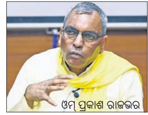
ଓମ୍ ପ୍ରକାଶ ରାଜଭର

ଲକ୍ଷ୍ନୌ, ୨୪୭: ସୁହେଲଦେବ ଭାରତୀୟ ସମାଜ ପାର୍ଟିର ଅଧ୍ୟକ୍ଷ ଓମ୍ ପ୍ରକାଶ ରାଜଭର ଏହିପ୍ରସଙ୍ଗରେ ସାମିଲ ହୋଇ ପ୍ରକାଶ କରିଛନ୍ତି। ଅନ୍ୟପକ୍ଷରେ ସେ ବିରୋଧୀ ଦଳ ବିଶେଷ କରି ଏସ୍ପି ମୁଖ୍ୟ ଅଶ୍ୱିନୀ ଯାଦବଙ୍କୁ କଡ଼ା ସମାଲୋଚନା କରୁଛନ୍ତି। ଏସ୍ପିର ଉତ୍ତର ପ୍ରଦେଶରେ ଏସ୍ପିର ମିଶନ ୮୦ରେ କାମ କରିବା ଆରମ୍ଭ କରିଛନ୍ତି। ଏସ୍ପିର ଉଦ୍ଦେଶ୍ୟରେ ଯୋଗଦେବା ପରେ ରାଜଭର ମୁଖ୍ୟମନ୍ତ୍ରୀ ଯୋଗୀ ଆଦିତ୍ୟନାଥ, ଉପ ମୁଖ୍ୟମନ୍ତ୍ରୀ