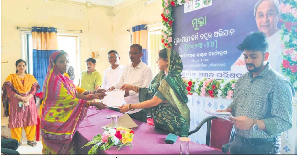
କାର୍ଯ୍ୟାଳୟ ବନ୍ଧନ କରୁଛନ୍ତି ବିଧାୟକ।

ସହାୟକ ଗୋଷ୍ଠୀ କାର୍ଯ୍ୟାଳୟ ବନ୍ଧନ... ସହାୟକ ଗୋଷ୍ଠୀ କାର୍ଯ୍ୟାଳୟ ବନ୍ଧନ