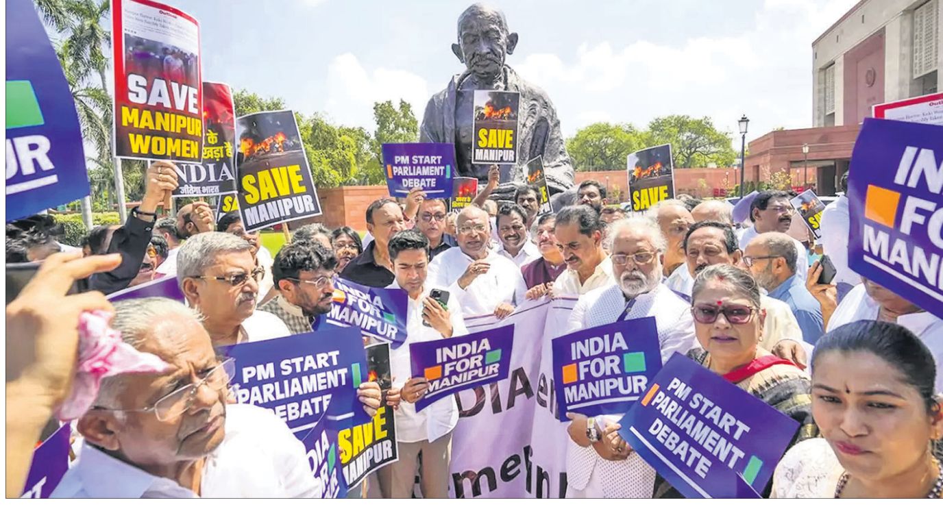
ମଣିପୁର ପ୍ରସଙ୍ଗରେ ପ୍ରଧାନମନ୍ତ୍ରୀ ନରେନ୍ଦ୍ର ମୋଦିଙ୍କ ବିକୃତି ଦାବି କରି ପାର୍ଲିାମେଣ୍ଟ ପରିସରରେ ଯୋଗଦାନ ରାଜ୍ୟ ସଭା ବିରୋଧୀ ଦଳ ନେତା ମଲିକାର୍ଜୁନ ଖାରୋଙ୍କ ସମେତ 'ଇଣ୍ଡିଆ' ମେଣ୍ଡର ଏମ୍ପିମାନେ ବିରୋଧ ପ୍ରଦର୍ଶନ କରୁଛନ୍ତି।