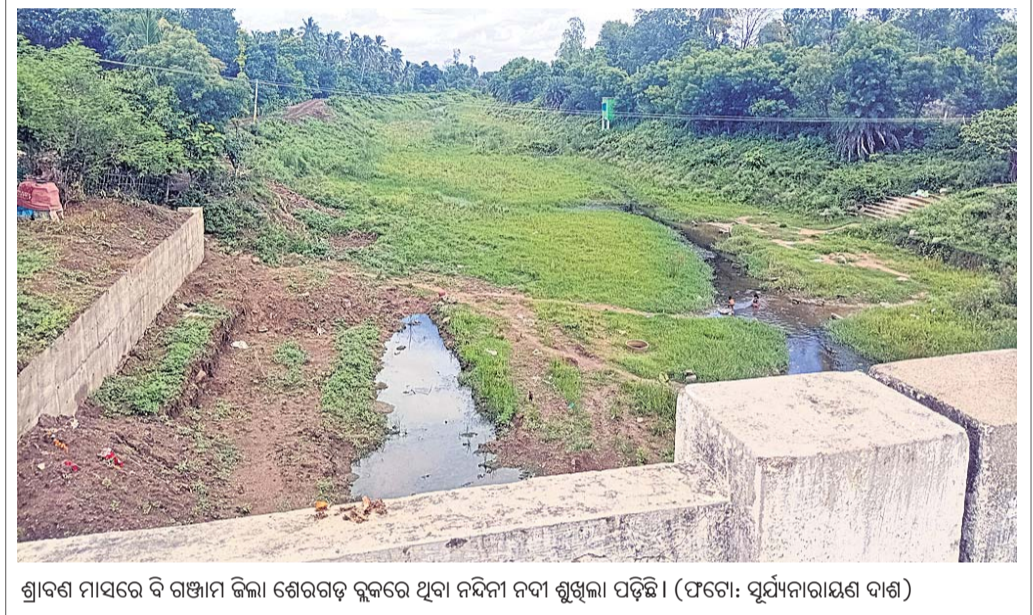
ଶ୍ରୀରାମ ମାସରେ ବି ଗଞ୍ଜାମ ଜିଲ୍ଲା ଶେରଗଡ଼ ବ୍ଲକରେ ଥିବା ନନ୍ଦିନୀ ନଦୀ ଶୁଖିଲା ପଡ଼ିଛି।