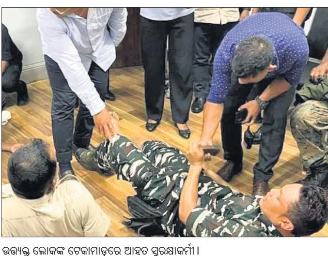
ଉତ୍ତମ ଲୋକଙ୍କ ଚେକାମାଡ଼ରେ ଆହତ ସୁରକ୍ଷାକର୍ମୀ।

ପିଲିବା ଆରମ୍ଭ କରିଥିଲେ। ସେଠାରେ ଥିବା ସୁରକ୍ଷାକର୍ମୀ ମୁଖ୍ୟମନ୍ତ୍ରୀଙ୍କୁ କାର୍ଯ୍ୟାଳୟ ଭିତରକୁ ସୁରକ୍ଷିତ ଭାବେ ନେଇଯାଇଥିଲେ।