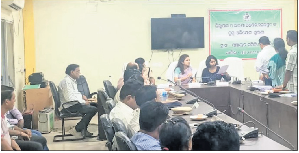
ଅଭିଯୋଗ ଶୁଣାଣିରେ ଅଧିକାରୀ ଓ ଲୋକପ୍ରତିନିଧି।