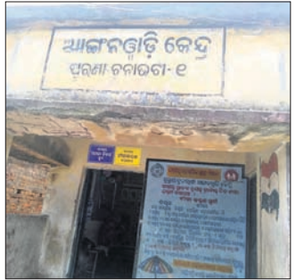
ଭାଙ୍ଗିରୁଜି ଯାଇଥିବା ଅଜ୍ଞାନଓଡ଼ି କେନ୍ଦ୍ର।

ବ୍ରଜରାଜନଗର ପୌରାଞ୍ଚଳର ୧୬୯୦.୩୯ ପୁରୁଣା ରୂନାଭଗା ଅଜ୍ଞାନଓଡ଼ି କେନ୍ଦ୍ର ବିପଦପୂର୍ଣ୍ଣ ଅବସ୍ଥାରେ ଚାଲୁଛି। କୋଠାର କାନ୍ଥ ଓ ଛାତ ଭାଙ୍ଗିରୁଜି ଯାଇଛି। ଅନେକ ସମୟରେ ସିମେଣ୍ଟ ଖଣ୍ଡ ଭାଙ୍ଗି ତଳେ ପଡୁଥିବାରୁ କୌଣସି ସମୟରେ ଅଘଟଣ ଆଶଙ୍କାକୁ ଏତାଇ ହେବନାହିଁ ବୋଲି ପଡ଼ାବାସୀ କହିଛନ୍ତି। ପଡ଼ାବାସୀଙ୍କ କହିବା କଥା, ଏ ନେଇ ବାସନ୍ଦୀରେ ଅଭିଯୋଗ କଲାପରେ ମଧ୍ୟ କେନ୍ଦ୍ର ଶୁଣାଣିହାତ୍ତି। ବର୍ତ୍ତମାନ ବର୍ଷା