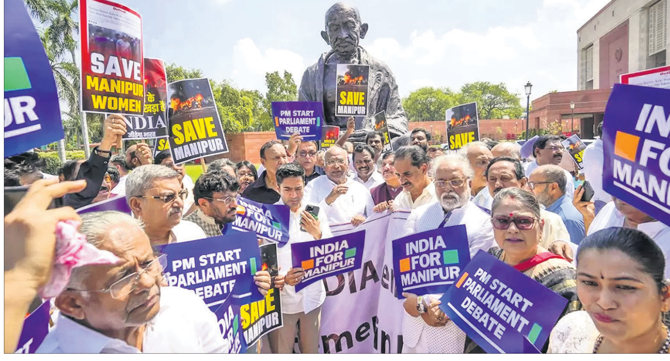
ମଣିପୁର ପ୍ରସଙ୍ଗରେ ପ୍ରଧାନମନ୍ତ୍ରୀ ନରେନ୍ଦ୍ର ମୋଦିଙ୍କ ବିକୃତି ଦାବି କରି ପାର୍ଲିମେଣ୍ଟ ପରିସରରେ ଯୋଗଦାନ ରାଜ୍ୟ ସଭା ବିରୋଧୀ ଦଳ ନେତା ମଲିକାର୍ଜୁନ ଖାରୋଙ୍କ ସମେତ 'ଇଣ୍ଡିଆ' ମେଣ୍ଡର ଏମ୍ପିମାନେ ବିରୋଧ ପ୍ରଦର୍ଶନ କରୁଛନ୍ତି।