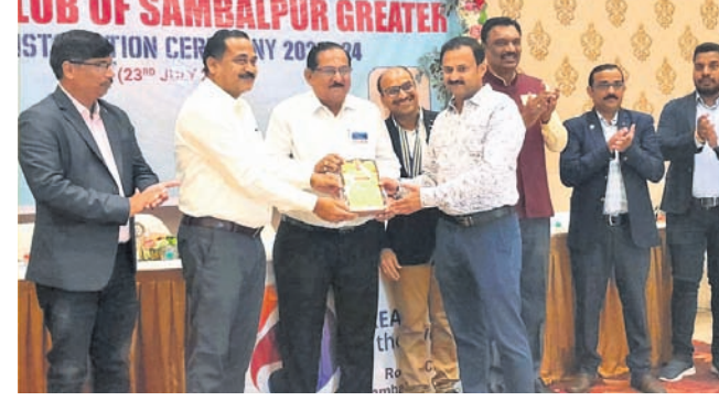
ସମାରୋହରେ ମଞ୍ଚାଧୀନ ଅତିଥିମାନେ।