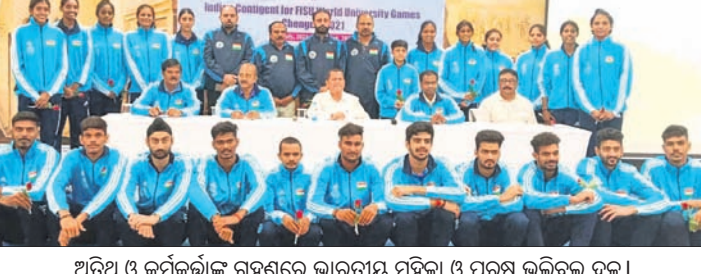
ଅଭିପ୍ତ ଓ କର୍ମକର୍ତ୍ତାଙ୍କ ଗହଣରେ ଭାରତୀୟ ମହିଳା ଓ ପୁରୁଷ ଭଲିବଲ୍ ଦଳ ।