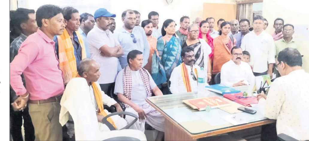
ଆଦିବାସୀ କଲ୍ୟାଣ ମହାସଂଘ ପକ୍ଷରୁ ବିଡ଼ିଓଙ୍କୁ ଦାବିପତ୍ର ପ୍ରଦାନ କରାଯାଇଛି।

ବରଗଡ଼ ଜିଲ୍ଲା ଆଦିବାସୀ କଲ୍ୟାଣ ମହାସଂଘ ତରଫରୁ ପାଇକମାଳ ବ୍ଲକ୍ ସଭାପତି ତେରୁ ବରିହାଙ୍କ ସଭାପତିତ୍ୱରେ ସୋମବାର ଦୁର୍ଘଟଣାରେ ଏକ ସଭା ଅନୁଷ୍ଠିତ ହୋଇଥିଲା। ଏଥିରେ ଜଣେ ଜନ ପ୍ରତିନିଧି ଭାବେ କାନ୍ତରା ପ୍ରମାଣପତ୍ର ବକରେ ନିର୍ବାଚନ ଲଢ଼ି ବିଜୟା ହୋଇଥିବାକୁ ତାଙ୍କ ପଦକୁ ରଦ୍ଦ କରିବା ଲାଗି ଦାବି ହୋଇଥିଲା। ଏହାସହ ପାଇକମାଳ ବ୍ଲକ୍‌ର ସମସ୍ତ ଆଶ୍ରମ ସ୍କୁଲ ଓ ସେବାଶ୍ରମ ସ୍କୁଲରେ ଶିକ୍ଷକ ନିଯୁକ୍ତି, ଏକଲବ୍ୟ ମଡେଲ ସ୍କୁଲ ନିର୍ମାଣ, ସ୍ୱାସ୍ଥ୍ୟ ସେବା ଏବଂ ଘରଢ଼ିହ ପତ୍ନୀ ପାଇଥିବା ଭୂମିହାତୀଙ୍କୁ କାର୍ଯ୍ୟ ଦଖଲ ଦେବା, ସମସ୍ତ ହିତାଧିକାରୀଙ୍କୁ ପ୍ରଧାନମନ୍ତ୍ରୀ ଆବାସ, ସବୁ ପଞ୍ଚାୟତକୁ ରାସ୍ତା ଏବଂ ଆଦିବାସୀ ଉନ୍ନୟନ ଯୋଜନା ଠିକ୍ ଭାବେ କାର୍ଯ୍ୟ କାର୍ଯ୍ୟକାରୀ କରିବା ପାଇଁ ବୈଠକରେ ଆଲୋଚନା ହୋଇଥିଲା। ସଂଘର