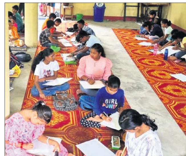
ହାରାକୃତ ବରିଷ୍ଠ ନାଗରିକ କାର୍ଯ୍ୟାଳୟରେ ତିରୁକାନ୍ ପ୍ରତିଯୋଗିତା।