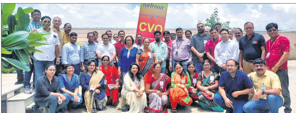
ବୈଠକରେ ଯୋଗ ଦେଇଥିବା ବିଭିନ୍ନ ସଙ୍ଗଠନର ପ୍ରତିନିଧିମାନେ।

କ୍ୟାନସର ବର୍ତ୍ତମାନ ତିନିଦିନ ବିଷୟ ପାଲଟିଛି। ଦିନକୁ ଦିନ ଏହି ରୋଗ ସାରା ରାଜ୍ୟରେ କାୟା ବିସ୍ତାର କରିବାରେ ଲାଗିଛି। ଗ୍ରାମାଞ୍ଚଳଠାରୁ ଆରମ୍ଭ କରି ସହରାଞ୍ଚଳ ପର୍ଯ୍ୟନ୍ତ କ୍ୟାନସର ଭାବେ ଏହି ରୋଗୀଙ୍କ ସଂଖ୍ୟା ବଢ଼ି ଚାଲିଛି। ସେହି ଅନୁପାତରେ ମୃତକଙ୍କ ସଂଖ୍ୟା ମଧ୍ୟ ବୃଦ୍ଧି ପାଇଛି। ରାଜ୍ୟର ବରଗଡ଼ ଜିଲ୍ଲାରେ ସର୍ବାଧିକ ଏହି ରୋଗୀ ରହିଛନ୍ତି। ତେବେ ବରଗଡ଼ ଜିଲ୍ଲାର କ୍ୟାନସର ସର୍ତ୍ତାକ୍ରମକୁ ଦ୍ୱାରା ଗଠିତ ପାଇକର୍ସ ଗ୍ରୁପ୍ ଏ ନେଇ ସଚେତନ କରିବା ସହିତ କିଛି କ୍ୟାନସର ରୋଗୀ ଏବଂ ସେମାନଙ୍କ ପରିବାରକୁ ଆର୍ଥିକ, ମାନସିକ ଏବଂ ଚିକିତ୍ସା କ୍ଷେତ୍ରରେ ସାହାଯ୍ୟ କରିପାରିବେ, ସେ ନେଇ ନିଆରା ପ୍ରୟାସ କାରି ରହିଛି। ଏହି କ୍ରମରେ ଓଡ଼ିଶାରେ କ୍ୟାନସର କର୍ମକର୍ତ୍ତା ରୋଗୀଙ୍କ ପାଇଁ କାର୍ଯ୍ୟ କରୁଥିବା ସମସ୍ତ ଜିଲ୍ଲାର ବିଭିନ୍ନ ସଙ୍ଗଠନ ମାନଙ୍କୁ ନେଇ ଉଦ୍ଦିଷ୍ଟ ବରଗଡ଼ ସହରସ୍ଥିତ ସ୍ୱୟଂସିଦ୍ଧା ଭବନରେ କ୍ୟାନସର ଭଲ୍‌ସିୟର ଓଡ଼ିଶା (ସିଭିଓ)ର ରାଜ୍ୟସ୍ତରୀୟ ବୈଠକ ଅନୁଷ୍ଠିତ ହୋଇଯାଇଛି। କ୍ୟାନସର ରୋଗ ସହିତ ଲଢ଼େଇ କରିବାକୁ ହେଲେ ବ୍ୟାପକ ସଚେତନତା ସହିତ କ୍ୟାନସର ରୋଗର ଶୀଘ୍ର ଚିକିତ୍ସାକରଣ, ରୋଗୀଙ୍କ ପରିବାର