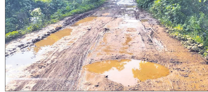
ହେମବିର, ୨୪୧୭ (ଚୈତନ୍ୟ ପଟେଲ)