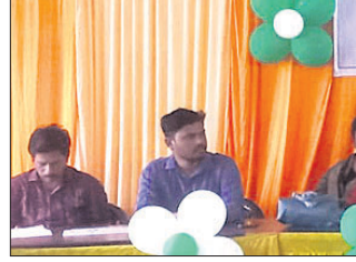
ଶିବିରରେ ମଞ୍ଚାସୀନ ଅତିଥିମାନେ।

ବରପାଲି, ୨୪।୭(ବିଭବଜନ ସାହୁ) ବରପାଲି ବ୍ଲକ୍ ପରିସରରେ ଥିବା ଆଇସିଟିଏସ୍ ହଲରେ ସ୍ୱୟଂ ସହାୟକ ଗୋଷ୍ଠୀ ସମୂହକୁ ବ୍ୟାଙ୍କ ରଣ, ସୁହାସର ତଥା ରଣ ପରିକ୍ଷାଧୀ ସମ୍ବଲପୁରୀ ସଚେତନତା ସୃଷ୍ଟି କରିବା ପାଇଁ ଏକ ୯ ଦିନିଆ ଶିବିର ସୋମବାର ଉଦଘାଟିତ ହୋଇଛି। ଶିବିରରେ ପ୍ରଥମ ଦିନ