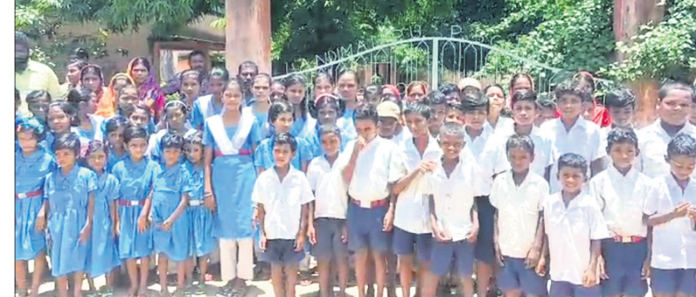
ସ୍କୁଲ ଗେଟରେ ତାଲା ପକାଇ ଧାରଣା ଦେଇଛନ୍ତି ଛାତ୍ରାଛାତ୍ରୀ ଓ ଅଭିଭାବକ।