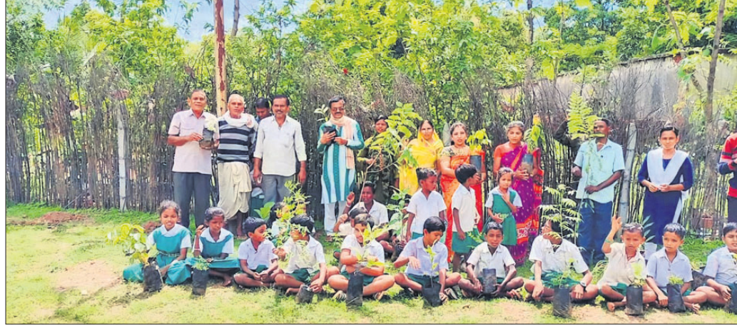
କାର୍ଯ୍ୟକ୍ରମରେ ଅତିଥିଙ୍କ ସହ ଛାତ୍ରାଛାତ୍ରୀମାନେ।