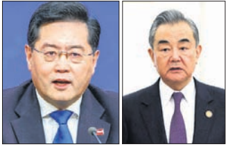
କିନ୍ ଗାଙ୍ଗ୍ ଫ୍ରାଙ୍ଗ୍ ଯି

ବେଞ୍ଚି, ୨୫୩୭: ମାସେ ହେଲା ଯୁବକଙ୍କୁ ନିଲମ୍ବନ କରିବା ପାଇଁ ଯୁବକଙ୍କୁ ନିଲମ୍ବନ କରାଯାଇଛି।