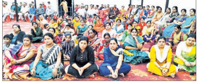
ହିଣ୍ଡାଲକୋ କଲୋନୀଠାରେ ଅନୁଷ୍ଠିତ କାର୍ଯ୍ୟକ୍ରମରେ ଭଗ୍ନମାନେ।