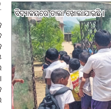
ବିଦ୍ୟାଳୟରେ ତାଲା ଖୋଲାଯାଇଛି।

ବୌଦ୍ଧ ଜିଲ୍ଲା କଣ୍ଠାମାଳ ବ୍ଲକ୍ ନାରାୟଣପ୍ରସାଦ ପଞ୍ଚାୟତ ଅନ୍ତର୍ଗତ ସିଲେଟପଡ଼ା ଉନୀତ ଉକ୍ତ ପ୍ରାଥମିକ ବିଦ୍ୟାଳୟରେ ପଢ଼ିଥିବା ତାଲା ଦୀର୍ଘ ୫ ଦିନ ପରେ ଖୋଲାଯାଇଛି। ଫଳରେ ପାଠପଢ଼ା ସ୍ୱାଭାବିକ ହୋଇଛି। ବିଦ୍ୟାଳୟର ଭାରପ୍ରାପ୍ତ ପ୍ରଧାନଶିକ୍ଷକ ପ୍ରଭାତକ କହିଲେ କର୍ତ୍ତବ୍ୟ ନେଇ ଗତ୨୦ ତାରିଖ ସକାଳୁ ଛାତ୍ରଛାତ୍ରୀ, ବିଦ୍ୟାଳୟ ପରିଚାଳନା କମିଟି ସଦସ୍ୟ ଓ ଅଭିଭାବକ ମିଳିତ ଭାବେ ବିଦ୍ୟାଳୟରେ ତାଲା ପକାଇ ପ୍ରତିବାଦ କରିଥିଲେ। ବିଭାଗୀୟ ଅଧିକାରୀ କୌଣସି ପଦକ୍ଷେପ