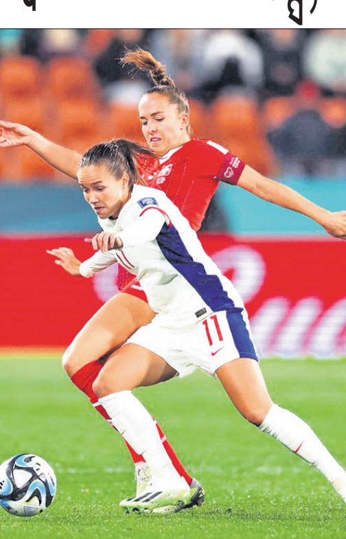
ନରଢ଼େ ଓ ଭୁଇଁଜରଲାଣ୍ଡ ମଧ୍ୟରେ ଅନୁଷ୍ଠିତ ମ୍ୟାଚ୍

ଫିଫା ମହିଳା ଯୁବକଲ୍ ବିଶ୍ୱକପରେ ମଙ୍ଗଳବାର ଫିଲିପାଇନ୍ସ, କଲମ୍ବିଆ ବିଜୟ ହାସଲ କରିଥିବା ବେଳେ ଭୁଇଁଜରଲାଣ୍ଡ ବିପକ୍ଷରେ ପଏଣ୍ଟ ବାଣ୍ଟି ନରଢ଼େ।