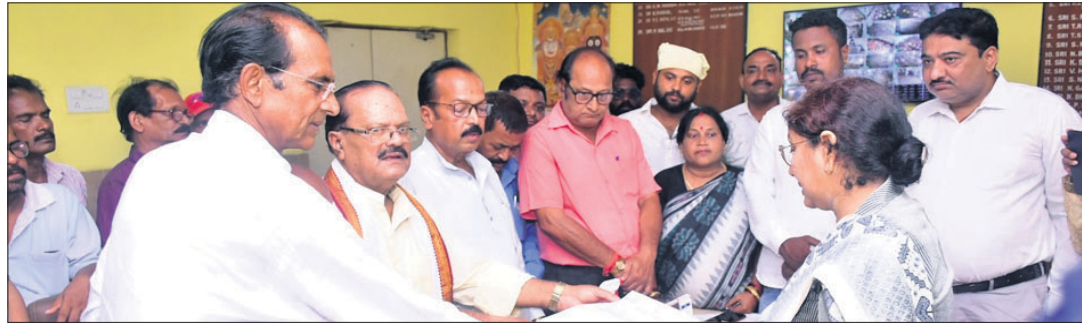
କଂଗ୍ରେସ ନେତୃବୃନ୍ଦ ଶିକ୍ଷାନୁଷ୍ଠାନର ଅଧିକାରୀଙ୍କୁ ଦାବିପତ୍ର ପ୍ରଦାନ କରୁଛନ୍ତି।