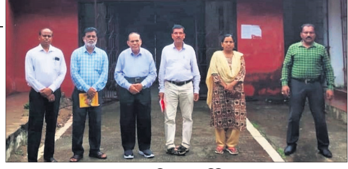
ସୋନପୁର ଉପକାରାଗାର ସମ୍ମୁଖରେ ବିଶେଷଜ୍ଞ କମିଟିର ସଭ୍ୟ ।

କଣ୍ଠାମାଳ/ଘଣ୍ଟାପଡ଼ା, ୨୫୧୭ (ଆବିଷେଷକମିଟି/ପ୍ରଭାତ କୁମାର ସାହୁ)