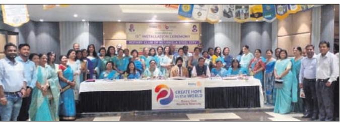
ସମାଜସେବା କ୍ଷେତ୍ରରେ ସହରର ସମସ୍ତ ରୋଗୀରୀ କ୍ଳବ ସଭାପତି ଓ ସମ୍ପାଦକ।

ଡାକ୍ତର ଦାୟିତ୍ୱଭାର ହସ୍ତାନ୍ତର କରିଥିଲେ। ଦାୟିତ୍ୱଭାର ଗ୍ରହଣ କରିଥିବା ସଭାପତି ଓ ସମ୍ପାଦକଙ୍କୁ ପୁରସ୍କାର କରିଥିବା ସମ୍ପର୍କରେ ସମାଜସେବା କ୍ଷେତ୍ରରେ ଉଲ୍ଲେଖନୀୟ ଅବଦାନ ନିମନ୍ତେ ସାମାଜିକ କ୍ଷେତ୍ରରେ, ବିକାଶ କ୍ଷେତ୍ରରେ ସର୍ବଦା କାମ କରି ଆସୁଛି।