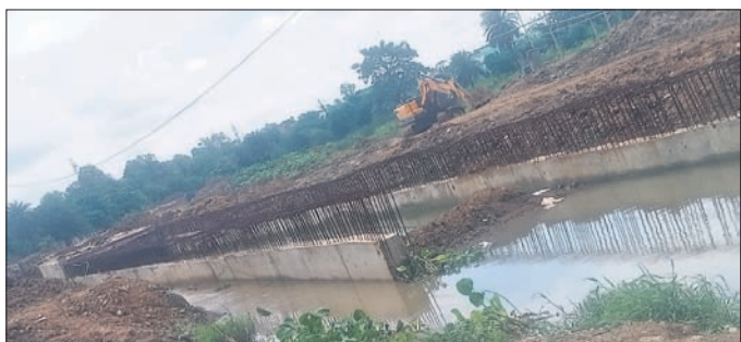
ସହରର ଅସମ୍ପୂର୍ଣ୍ଣ ଏକ ଡ୍ରେନ୍।

ସ୍ମାର୍ଟସିଟି ରାଉରକେଲା ସହରର ୧୦ଟି ପ୍ରମୁଖ ଡ୍ରେନ୍ ମଧ୍ୟରେ ନିର୍ମାଣ ହେଉଥିବା ବର୍ଷାଜଳ ସହରବାସୀଙ୍କର ମୁକ୍ତିଦାୟକ ସାଜୁଥିଲା।