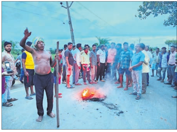
ଉତ୍ତମକୁ ଲୋକେ ୨୬ ନମ୍ବର ଜାତୀୟ ରାଜପଥ ଅବରୋଧ କରିଛନ୍ତି।