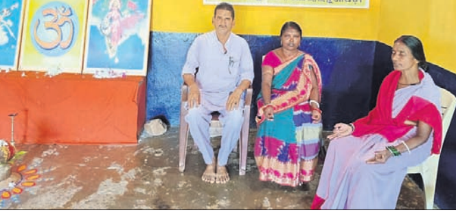
ବୈଠକରେ ଉପସ୍ଥିତ ଅତିଥିବୃନ୍ଦ।