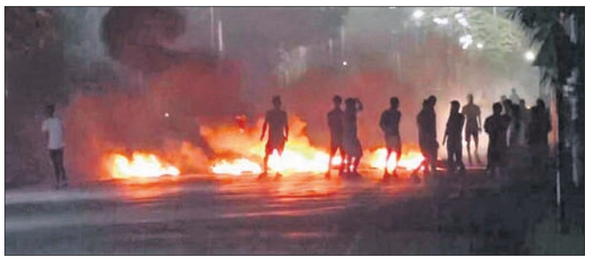
କାଳପୋକ୍ତିରେ ଉତ୍ତ୍ୟକ୍ତ ଲୋକେ ନିଆଁ ଲାଗାଇଦେଇଥିବା ବସ।

କେତେଜଣ ନିଆଁ ଲାଗାଇ ଦେଇଥିଲେ। ମେଲିଟି ଓ କୁଳି-କି ସମ୍ପ୍ରଦାୟ ମଧ୍ୟରେ ଲାଗି ରହିଥିବା ବିବାଦକୁ ନେଇ ରାଜ୍ୟବ୍ୟାପୀ ଦେଖାଯାଇଥିବା ହିଂସାରେ ମୋଟ ୧୬୦ ଜଣଙ୍କ ମୃତ୍ୟୁ ଘଟିଛି। ଅନ୍ୟପକ୍ଷେ ବୁଲୁ ମହିଳାଙ୍କୁ ଉଲଗ୍ନ ପରେଡ଼ କରାଯିବା ନେଇ ଭାରତୀୟ ଗଣତନ୍ତ୍ର ଅଫିସ୍