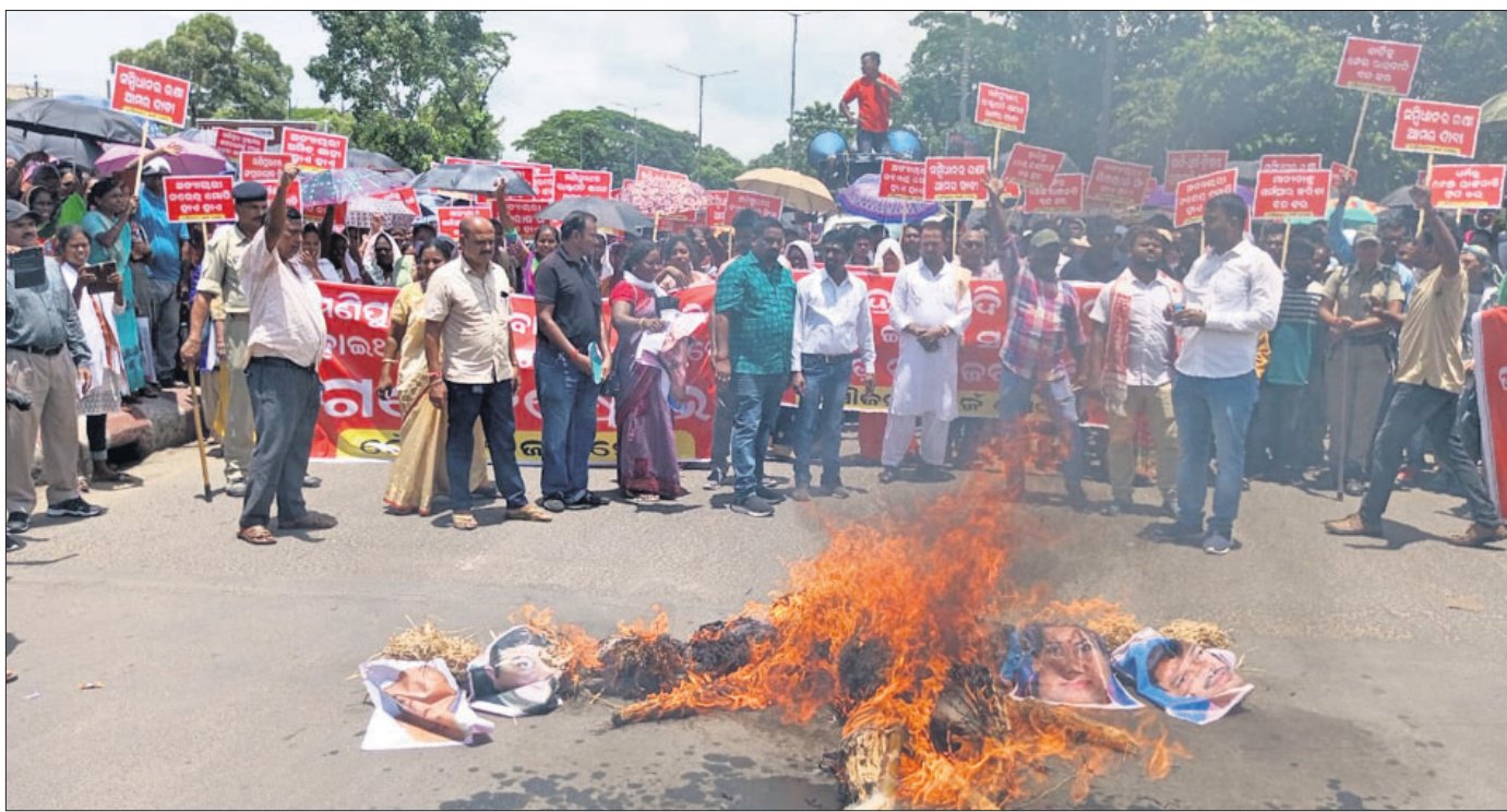
ରାଉରକେଲା ବିଶ୍ୱାସୀ ଛକରେ ଜର୍ଜ ସେନା ପକ୍ଷରୁ ଗୁରୁବାର ବିକ୍ଷୋଭ କରାଯାଇଛି।