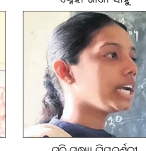
ସୁତି ସନ୍ଧ୍ୟା ପ୍ରିୟଦର୍ଶିନୀ