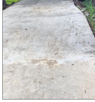
ନିର୍ମାଣ ହୋଇଥିବା ନୂତନ ରାସ୍ତା।

ସୁନ୍ଦରଗଡ଼ ଜିଲ୍ଲା କୁଆଁରମୁଣ୍ଡା ବ୍ଲକ୍ କାଲୋସିହିରିଆ ପଞ୍ଚାୟତ ଯୋଗେ ବସ୍ତିରେ ନିର୍ମାଣ ହୋଇଥିବା ଉତ୍ତମ ରାସ୍ତାଟି ସମ୍ପୂର୍ଣ୍ଣ ନିର୍ମାଣରେ ହୋଇଥିବା ନେଇ ଗତ ୨୧ ତାରିଖରେ ଧରିତ୍ରୀରେ ଖବର ପ୍ରକାଶ ପାଇବା ପରେ ବ୍ଲକ୍ ପ୍ରଶାସନ ଏହାକୁ ଗୁରୁତ୍ୱ ସହ ନେଇଥିଲା। ଏହାପରେ ସମ୍ପୂର୍ଣ୍ଣ କନିଷ୍ଠ ଯତ୍ନ ଚଳେଇଛି। ବ୍ଲକ୍ ପ୍ରଧାନ ଉତ୍ତମ ରାସ୍ତାକୁ ଭାଙ୍ଗି ପୁନର୍ନିର୍ମାଣ କରିଛନ୍ତି। ରାସ୍ତାଟି ନୂତନଭାବେ