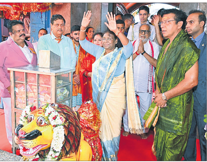
ମା' କଟକ ଚଣ୍ଡୀଙ୍କୁ ରାଷ୍ଟ୍ରପତି ଦର୍ଶନ କରି ଆଶୀର୍ଷ ଲିକ୍ଷା କରୁଛନ୍ତି।