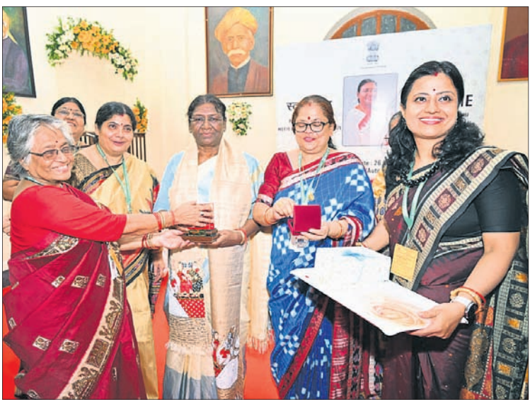
ଶୈଳବାଳା ମହିଳା ମହାବିଦ୍ୟାଳୟରେ ଅଧ୍ୟକ୍ଷା ଓ ଅଧ୍ୟାପିକାଙ୍କ ଗହଣରେ ରାଷ୍ଟ୍ରପତି।