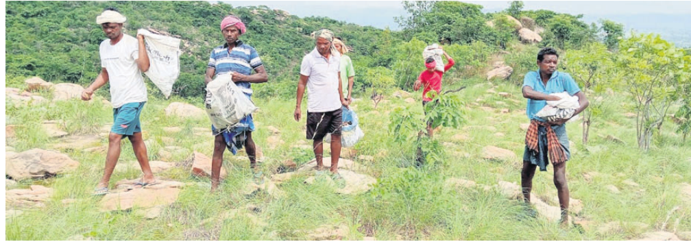
କୂଳ ସହଯୋଗରେ ପର୍ବତରେ ବାଜବଦନ କରୁଛନ୍ତି।