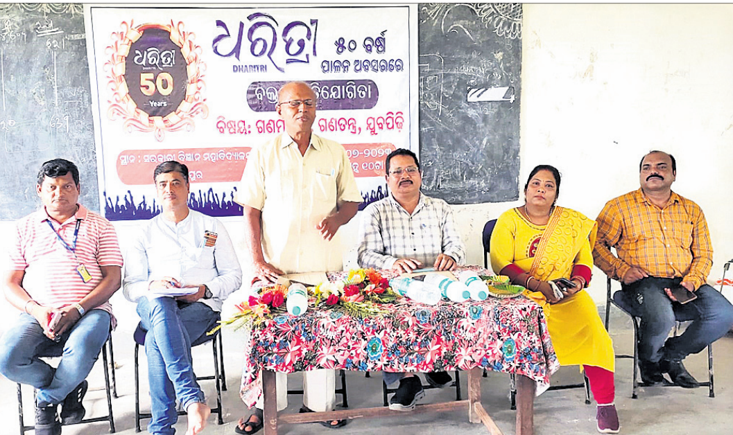
ମୁଖ୍ୟ ଅତିଥି ପୂର୍ବତନ ବିଧାୟକ ଅଶୋକ ଚୌଧୁରୀଙ୍କ ଉଦ୍‌ଘୋଷଣା

ଧରିତ୍ରୀର ୫୦ ବର୍ଷ ଉପଲକ୍ଷେ ବହୁତା ପ୍ରତିଯୋଗିତା