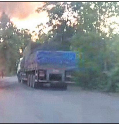
ନିଆଁଲାଗି ମିନିଷ୍ଟ୍ର କଲୁଛି।

ଜମନକିରା/ପଡ଼ିଆବାହାଲ, ୨୬୭ (ବିବାହ ପ୍ରସାଦ ବାରି/ରାଧାମୋହନ ଷ୍ଟୁଡ଼ିଂ) ୫୩ମଂ ଜାତୀୟ ରାଜପଥର ସମଲପୁର ଜିଲ୍ଲା ଜମନକିରା ଥାନା ଗୌଡ଼ପାଲି ଫାଣ୍ଡି ବଡ଼କୁଟଣ୍ଡସରା ପେଟ୍ରୋଲ ପମ୍ପ ବୁଲାର୍‌ଗିରେ ବୁଧବାର ସଡ଼କ ଦୁର୍ଘଟଣା ପରେ ଏକ ମିନିଷ୍ଟ୍ରକ୍ରେ ନିଆଁ ଲାଗିଯାଇଥିଲା। ଫଳରେ ଗାଡ଼ି ଜିତରେ