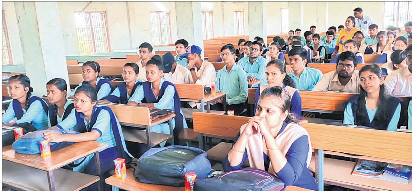
କାର୍ଯ୍ୟକ୍ରମରେ ଉପସ୍ଥିତ ଛାତ୍ରାଛାତ୍ରୀ

ଛତ୍ରପୁର, ୨୬/୭(ସଂକ୍ଷେପ ପାଠ) ଗଣମାଧ୍ୟମ ଗଣତାନ୍ତ୍ରିକ ମୂଲ୍ୟବାନ ମନୁଷ୍ୟ ଉତ୍ପାଦନ ପ୍ରକଳ୍ପର ଉପଲକ୍ଷେ ଧରିତ୍ରୀର ୫୦ ବର୍ଷ ଉପଲକ୍ଷେ ବହୁତା ପ୍ରତିଯୋଗିତା ପ୍ରତିଯୋଗିତାରେ ମୋଟ ୧୨ ଜଣ ଛାତ୍ରାଛାତ୍ରୀ ଭାଗ ନେଇଥିଲେ। ସେମାନଙ୍କ ମଧ୍ୟରୁ ମୁକ୍ତ ୨ ବିଜ୍ଞାନ ବିଭାଗର ୧୨ ଜଣ ଛାତ୍ର ଓ ୧୨ ଜଣ ଶାସ୍ତ୍ର ବିଭାଗର ୧୨ ଜଣ ଛାତ୍ର ଥିଲେ। ଏହି ପ୍ରତିଯୋଗିତାରେ ଧରିତ୍ରୀର ୫୦ ବର୍ଷ ଉପଲକ୍ଷେ ବହୁତା ପ୍ରତିଯୋଗିତା ପ୍ରତିଯୋଗିତାରେ ମୋଟ ୧୨ ଜଣ ଛାତ୍ରାଛାତ୍ରୀ ଭାଗ ନେଇଥିଲେ। ସେମାନଙ୍କ ମଧ୍ୟରୁ ମୁକ୍ତ ୨ ବିଜ୍ଞାନ ବିଭାଗର ୧୨ ଜଣ ଛାତ୍ର ଓ ୧୨ ଜଣ ଶାସ୍ତ୍ର ବିଭାଗର ୧୨ ଜଣ ଛାତ୍ର ଥିଲେ। ଏହି ପ୍ରତିଯୋଗିତାରେ ଧରିତ୍ରୀର ୫୦ ବର୍ଷ ଉପଲକ୍ଷେ ବହୁତା ପ୍ରତିଯୋଗିତା ପ୍ରତିଯୋଗିତାରେ ମୋଟ ୧୨ ଜଣ ଛାତ୍ରାଛାତ୍ରୀ ଭାଗ ନେଇଥିଲେ। ସେମାନଙ୍କ ମଧ୍ୟରୁ ମୁକ୍ତ ୨ ବିଜ୍ଞାନ ବିଭାଗର ୧୨ ଜଣ ଛାତ୍ର ଓ ୧୨ ଜଣ ଶାସ୍ତ୍ର ବିଭାଗର ୧୨ ଜଣ ଛାତ୍ର ଥିଲେ।