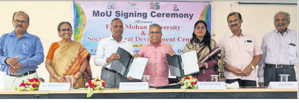
ବୁଝାମଣା ପତ୍ର ସ୍ଵାକ୍ଷର ଅବସରରେ ଉପସ୍ଥିତ କୁଳପତି ପ୍ରଫେସର ସତ୍ୟୋଷ କୁମାର ତ୍ରିପାଠୀ ଓ ଅନ୍ୟମାନେ ।