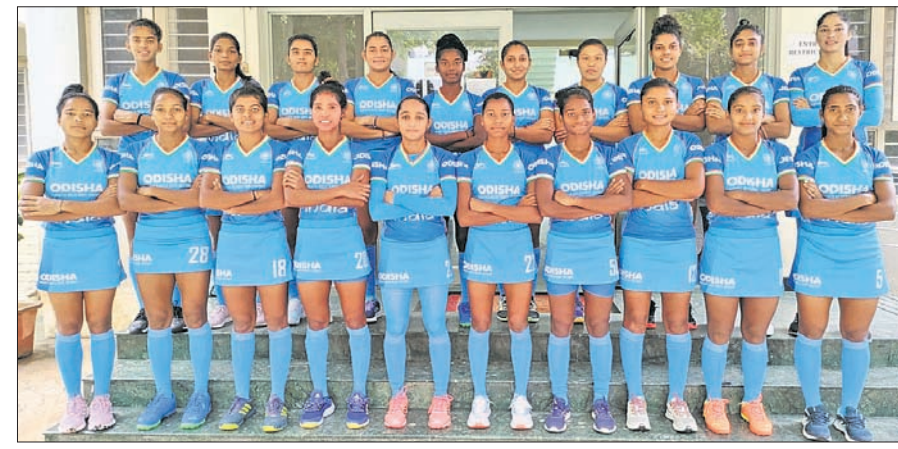
ଚତୁଃରାଷ୍ଟ୍ରୀୟ ଜୁନିୟର ମହିଳା ହକି ପାଇଁ ମନୋନୀତ ଭାରତୀୟ ଦଳ।

ଆନନ୍ଦିତ। ଗ୍ରୀଷ୍ମରେ ମୋର ପ୍ରଦର୍ଶନ ଭଲ ରହିଥିଲା। ମୋ ମତରେ ବଡ଼ ରୁନାମେଣ୍ଟକୁ ପାଇଁ ଗ୍ରୀଷ୍ମ ହେବା ଉଚିତ। ଏହାଦ୍ୱାରା ପ୍ରତ୍ୟେକ ଖେଳାଳି ସୁଯୋଗ ପାଇପାରିବେ। ମୁଁ ଖେଳାଳିମାନେ ମଧ୍ୟ ମୋତିଭେଦ ହୋଇପାରିବେ ଏବଂ ସେମାନଙ୍କ ପ୍ରଦର୍ଶନରେ ଉଚିତ ଆଶିବାକୁ ଚେଷ୍ଟା କରିବେ। ଏବେ ରୁନାମେଣ୍ଟକୁ ପ୍ରମୋଦ ସହିତ ଅପେକ୍ଷା କରିଛି” ବୋଲି ପ୍ରମୋଦ ପ୍ରକାଶ କରିଛନ୍ତି। ପ୍ରକାଶଯୋଗ୍ୟ ଯେ, ପ୍ରମୋଦଙ୍କ ପାଇଁ ଏସିଆନ ପାରା ଗେମ୍ ଯୋଗ୍ୟତା ଏହା ନୂଆ ନୁହେଁ। ୨୦୧୮ରେ ଜାକର୍ତ୍ତାରେ ଅନୁଷ୍ଠିତ ପ୍ରତିଯୋଗିତାରେ ସେ ସିଙ୍ଗଲ୍ରେ ସର୍ବ୍ଣ ଏବଂ ଡବଲ୍ରେ ଟ୍ରୋଫି ପଦକ ହାସଲ କରିଥିଲେ। ୨୦୧୪ରେ ଇଣ୍ଡିଆନରେ ଆୟୋଜିତ ପ୍ରତିଯୋଗିତାରେ ସେ ପୁରୁଷ ସିଙ୍ଗଲ୍ରେ ଟ୍ରୋଫି ପଦକ ପାଇଥିଲେ। ୨୦୨୦ ଚୋକିଓ ପାରାଲିମ୍ପିକ୍ସରେ ସର୍ବ୍ଣ ପଦକ ଅର୍ଜନ କରିଥିବା ପ୍ରମୋଦ ବିଶ୍ୱ ପାରା ବ୍ୟାଡମିଣ୍ଟନ ଚାମ୍ପିୟନଶିପରେ ୫ ସର୍ବ୍ଣ, ୨ ରୌପ୍ୟ ଓ ୧ ବ୍ରୋଞ୍ଜ ପଦକ ଅର୍ଜନ କରିଛନ୍ତି। ୨୦୧୧ରେ ସେ ଅର୍ଜୁନ ଏବଂ ରାଜ୍ୟର ସର୍ବୋଚ୍ଚ ବିଜୁ ପଦକାୟକ କ୍ରୀଡ଼ା ପୁରସ୍କାର ପାଇଥିଲେ। ୨୦୨୧ରେ ଖେଳରତ୍ନ ପୁରସ୍କାର ପାଇଥିବା ଏହି ପାରା ବ୍ୟାଡମିଣ୍ଟନ ତାରକା ୨୦୨୨ରେ ପଦ୍ମଶ୍ରୀ ସମ୍ମାନରେ ସମ୍ମାନିତ ହୋଇଥିଲେ।