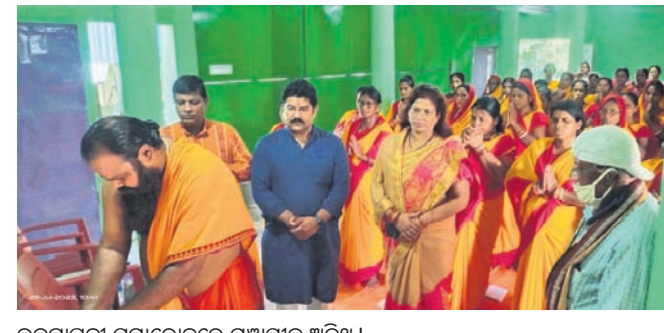
ଉଦ୍ଘାଟନା ସମାରୋହରେ ମଞ୍ଚାଧୀନ ଅତିଥି ।