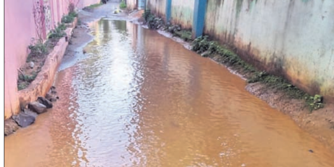
ରାସ୍ତାରେ ବର୍ଷା ପାଣି ଜମି ରହିଛି ।