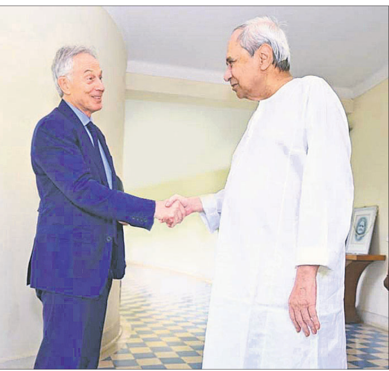
ବ୍ରିଟେନ୍ ପୂର୍ବତନ ପ୍ରଧାନମନ୍ତ୍ରୀ ଗୋନି କ୍ଲେୟାର ରୁଧିରାଣୀ ନବୀନ ନିବାସଠାରେ ମୁଖ୍ୟମନ୍ତ୍ରୀ ନବୀନ ପଟ୍ଟନାୟକଙ୍କୁ ସାକ୍ଷାତ କରୁଛନ୍ତି।

ରୁଧିରାଣୀ ଓଡ଼ିଶା ହାଇକୋର୍ଟର ୨୫ବର୍ଷ ପୂର୍ତ୍ତ ସମାରୋହରେ ମୁଖ୍ୟ ଅତିଥି ଭାବେ ରାଷ୍ଟ୍ରପତି ଯୋଗଦେଇ ଜୟ କରନ୍ତାଥ ସଭାସଭାକୁ ନିଜର ଅଭିଭାଷଣ ଆରମ୍ଭ କରିଥିଲେ। ଓଡ଼ିଶା ହାଇକୋର୍ଟ ଆରମ୍ଭ ସମୟର କଥା ଉପସ୍ଥାପନ କରି ରାଷ୍ଟ୍ରପତି କହିଲେ, କୌଣସି ଅନୁଷ୍ଠାନ ସମୟ ଅନୁସାରେ ନ ବଦଳିଲେ ପଛରେ ପଡ଼ିଯାଏ। ୪ ଜଣ ବିଚାରପତିଙ୍କୁ ନେଇ ଏହି ଉଚ୍ଚ ନ୍ୟାୟାଳୟ ଆରମ୍ଭ ହୋଇଥିଲା, ଏବେ ବିଚାରପତି ସଂଖ୍ୟା ୩୩କୁ ବୃଦ୍ଧି ପାଇଛି। ଗତ ୨୫ ବର୍ଷ ମଧ୍ୟରେ ଦ୍ୱିତୀୟ ନ୍ୟାୟ ପ୍ରଦାନ ଯୋଗୁ ଓଡ଼ିଶା ଉଚ୍ଚନ୍ୟାୟାଳୟର ବିଚାରାଧୀନ ମାମଲା ସଂଖ୍ୟା ଏକ ଚତୁର୍ଥାଂଶ ହ୍ରାସ ପାଇଛି। ନ୍ୟାୟ ପ୍ରଦାନ କ୍ଷେତ୍ରରେ ଫୁଲ୍-୪