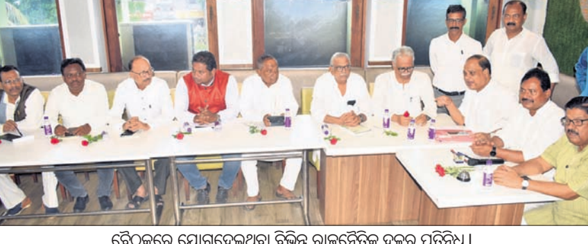
ବୈଠକରେ ଯୋଗଦେଇଥିବା ବିଭିନ୍ନ ରାଜନୈତିକ ଦଳର ପ୍ରତିନିଧି।