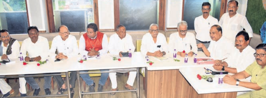
ବିଠକରେ ଯୋଗଦେଇଥିବା ବିଭିନ୍ନ ରାଜନୈତିକ ଦଳର ପ୍ରତିନିଧି।

ଭୁବନେଶ୍ୱର, ୨୬୭(ପୁନିବ ମିଶ୍ର) ବହୁ ଦୁର୍ଘଟଣାପୀନ ପରେ ପ୍ରଧାନମନ୍ତ୍ରୀ ଆବାସ ଯୋଜନାରେ ରାଜ୍ୟ ସରକାର ଗତ କୁନ୍ ୧୭ ରୁ କାର୍ଯ୍ୟାଦେଶ ପ୍ରଦାନ କରିଛନ୍ତି। ପ୍ରଥମ ପର୍ଯ୍ୟାୟରେ କାର୍ଯ୍ୟାଦେଶ ସହ ୪୦ ହଜାର ଟଙ୍କା ବେଞ୍ଚିବି ଏବଂ ଅବଶିଷ୍ଟ ରାଶି ୨ଟି କିସ୍ତରେ ଗୃହ କାର୍ଯ୍ୟର ଅଗ୍ରଗତି ନେଇ ପ୍ରଦାନ କରାଯିବାରୁ ନିଷ୍ପତ୍ତି ନେଇଛନ୍ତି।