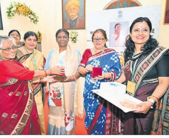
ଶୈଳବାଜୀ ମହିଳା ମହାବିଦ୍ୟାଳୟରେ ଅଧ୍ୟକ୍ଷା ଓ ଅଧ୍ୟାପିକାଙ୍କ ଗହଣରେ ରାଷ୍ଟ୍ରପତି।