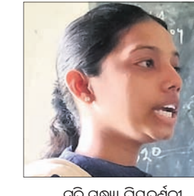
ସୁତି ସନ୍ଧ୍ୟା ପ୍ରିୟଦର୍ଶିନୀ