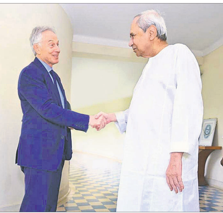
ବ୍ରିଟେନ୍ ପୂର୍ବତନ ପ୍ରଧାନମନ୍ତ୍ରୀ ଗୋନି କ୍ଲେୟାର ରୁଧିରୀ ନବୀନ ନିବାସଠାରେ ମୁଖ୍ୟମନ୍ତ୍ରୀ ନବୀନ ପଟ୍ଟନାୟକଙ୍କୁ ସାକ୍ଷାତ କରୁଛନ୍ତି।

ରୁଧିରୀ ଓଡ଼ିଶା ହାଇକୋର୍ଟର ୭୫ବର୍ଷ ପୂର୍ତ୍ତି ସମାରୋହରେ ମୁଖ୍ୟ ଅତିଥି ଭାବେ ରାଷ୍ଟ୍ରପତି ଯୋଗଦେଇ ଜୟ କରନ୍ତା ସମୟାଧିକାର ନିଜର ଅଭିଭାଷଣ ଆରମ୍ଭ କରିଥିଲେ। ଓଡ଼ିଶା ହାଇକୋର୍ଟ ଆରମ୍ଭ ସମୟର କଥା ଉପସ୍ଥାପନ କରି ରାଷ୍ଟ୍ରପତି କହିଲେ, କୌଣସି ଅନୁଷ୍ଠାନ ସମୟ ଅନୁସାରେ ନ ବଦଳିଲେ ପଛରେ ପଡ଼ିଯାଏ। ୪ ଜଣ ବିଚାରପତିଙ୍କୁ ନେଇ ଏହି ଉଚ୍ଚ ନ୍ୟାୟାଳୟ ଆରମ୍ଭ ହୋଇଥିଲା, ଏବେ ବିଚାରପତି ସଂଖ୍ୟା ୩୩କୁ ବୃଦ୍ଧି ପାଇଛି। ଗତ ୨୯ ବର୍ଷ ମଧ୍ୟରେ ଦ୍ୱିତୀୟ ନ୍ୟାୟ ପ୍ରଦାନ ଯୋଗୁ ଓଡ଼ିଶା ଉଚ୍ଚନ୍ୟାୟାଳୟର ବିଚାରାଧୀନ ମାମଲା ସଂଖ୍ୟା ଏକ ଚତୁର୍ଥାଂଶ ହ୍ରାସ ପାଇଛି। ନ୍ୟାୟ ପ୍ରଦାନ କ୍ଷେତ୍ରରେ ଫୁଲ୍-୪