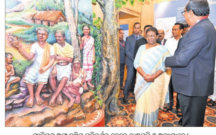
ମୁଖ୍ୟମନ୍ତ୍ରୀ ଅଫ୍ କର୍ଣ୍ଣାଟକ ପରିବର୍ତ୍ତନ ବେଳେ ରାଷ୍ଟ୍ରପତି ଓ ଅନ୍ୟମାନେ।