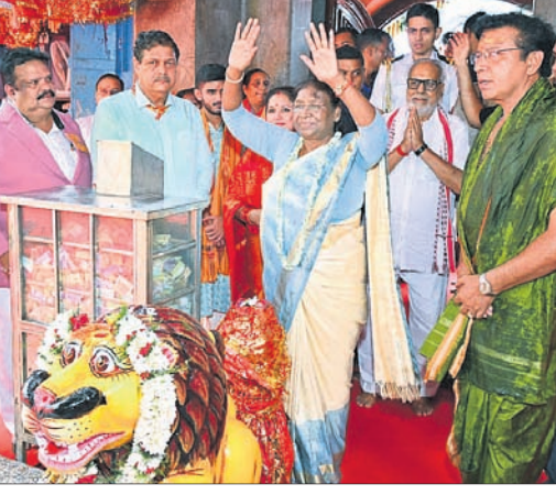
ମା' କଟକ ଚଣ୍ଡୀଙ୍କୁ ରାଷ୍ଟ୍ରପତି ଦର୍ଶନ କରି ଆଶିଷ ଭିକ୍ଷା କରୁଛନ୍ତି।