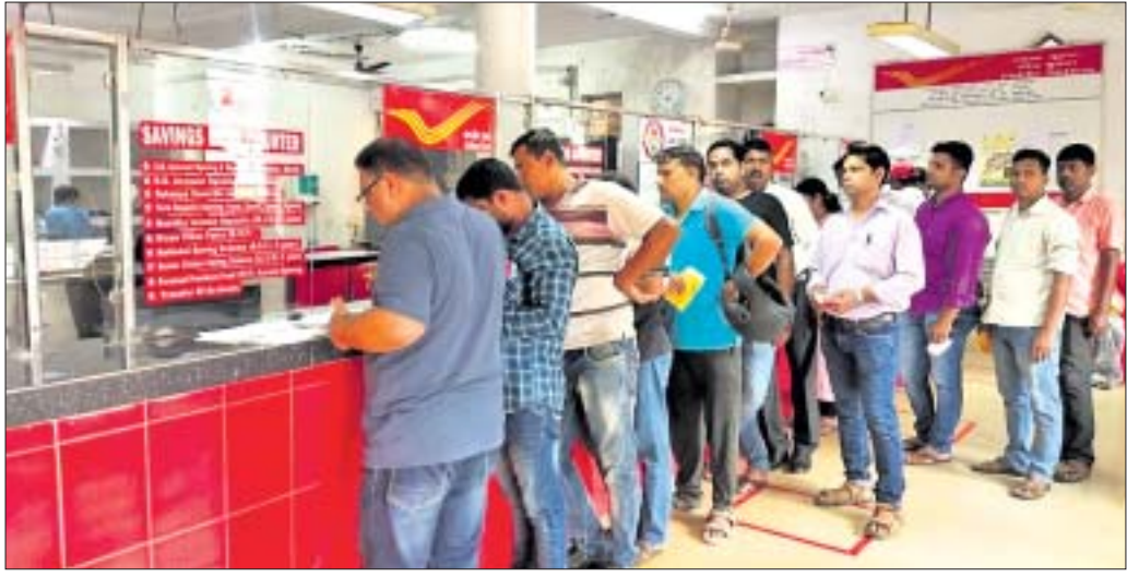
ବିଭିନ୍ନ କାମରେ ଆସିଥିବା ଗ୍ରାହକ ତାଳଘରରେ ଲାଗି କରାଯାଇଛି।

କେନ୍ଦ୍ର ସରକାର ତାଳଘରପୂର୍ତ୍ତିକୁ ଗୁରୁତ୍ୱ ଦେବାସହ ଚଳଚଞ୍ଚଳ କରିବା ପାଇଁ ବହୁ ଯୋଜନା କରିଛନ୍ତି। ତାଳ ବ୍ୟବସ୍ଥା କେବଳ ଟିପି ପ୍ରକାରରେ ସୀମିତ ନ ରହି ବହୁ ଆର୍ଥିକ କାରବାରର ମାଧ୍ୟମ ହୋଇଛି। ହେଲେ ତାଳ ବିଭାଗ ଯେଉଁ ଭଳି ଉତ୍ତମ ସେବା ଗ୍ରାହକଙ୍କୁ ଯୋଗାଇବା କଥା ତାହା ପ୍ରକୃତ ପକ୍ଷେ ପରିଲକ୍ଷିତ ହେଉନାହିଁ। ଏଭଳି ବ୍ୟତପ୍ରକୃତ ଦେଖିବାକୁ ମିଳିଛି ଯାଜପୁରରୋଡ଼ ଆର୍ବିଏମ୍ ପୁଖ୍ୟ ଡାକଘରରେ। ତୋଲିପୁର ଶାଖା ଡାକଘରଟି କାଳକ୍ରମେ ଯାଜପୁରରୋଡ଼ ଆର୍ବିଏମ୍ ପୁଖ୍ୟ ଡାକଘରର ମାନ୍ୟତା ପାଇ ଭଦ୍ରାପୁର ନିକଟ୍ତ କାର୍ଯ୍ୟାଳୟରେ କାର୍ଯ୍ୟ କରୁଛି। ପ୍ରାୟ ୬୦ ବର୍ଷରୁ ଉର୍ଦ୍ଧ୍ୱ ସମୟଧରି ଜନସାଧାରଣଙ୍କୁ ସେବା ଯୋଗାଇ ଆସୁଥିବା ଏହି ଡାକଘରଟି ଏବେ ହାଇ ସିଲେକ୍ସନ ଗ୍ରେଡ୍ ୧ରେ ପରିଣତ ହୋଇଛି। ଏହି ଡାକଘର ଅଧୀନରେ ୧୧ ଉପଡାକଘର ସହ ୧୯ ଶାଖା କାର୍ଯ୍ୟ କରୁଛି। ଦିନକୁ ଦିନ ଯାଜପୁରରୋଡ଼ ସହରର ଅଭିଭୂତ ଘଟିବା ସହ କଳିଙ୍ଗନଗର ଶିଳ୍ପାଞ୍ଚଳ ଯୋଗୁଁ ଏହି ଡାକଘରର କାର୍ଯ୍ୟଭାର ବୃଦ୍ଧି ପାଇଛି। ବିଭିନ୍ନ ପ୍ରକାର ଜମା, ସଞ୍ଚୟ, ମିଆଦି ଜମା ସହ କେନ୍ଦ୍ର ସରକାରଙ୍କ ବହୁ ଆର୍ଥିକ