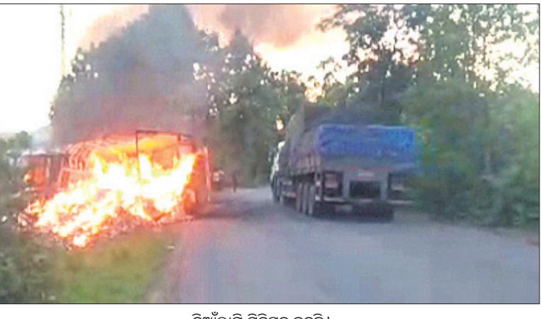
ନିଆଁଲାଗି ମିନିଷ୍ଟ୍ରି କଳୁଛି।

କମଳକିରୀ/ପଡ଼ିଆବାହାଳ, ୨୬/୭ (ବିବାହ ପ୍ରସାଦ ଦାମି/ରାଧାମୋହନ ଷ୍ଟାଲକୀ) ୫୩୯୯. ଜାତୀୟ ରାଜପଥର ସମ୍ବଲପୁର ଜିଲ୍ଲା କମଳକିରୀ ଥାନା ଗୌଡ଼ପାଳି ଫାଣ୍ଡି ବଡ଼କୁଟଣ୍ଡଇସରା ପେଟ୍ରୋଲ ପମ୍ପ ବୁଲାଣିରେ ରୁଧିରୀର ସଡ଼କ ଦୁର୍ଘଟଣା ପରେ ଏକ ମିନିଷ୍ଟ୍ରିକରେ ନିଆଁ ଲାଗିଯାଇଥିଲା। ଫଳରେ ଗାଡ଼ି ଭିତରେ ଥିବା ଚାଳକ ଜୀବନ୍ତ ଦସ୍ତ ହୋଇଯାଇଥିବାବେଳେ ହେଲପର ଗୁରୁତର ହୋଇଛନ୍ତି।