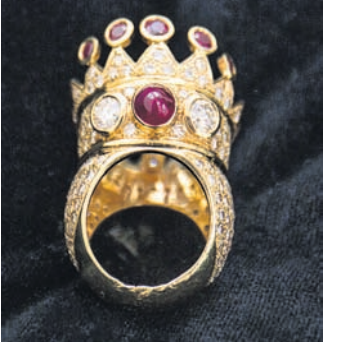
ଏହା ଏକ ନିଆରା କଳାକୃତି, ଯାହା ହିଂସ୍ର ଅପ ଉପରେ ପ୍ରକାଶ ବିସ୍ତାର କରେ।

ଏହି ମୁଦି 'ପାକ୍ ଆଣ୍ଡ ବାଦା ୧୯୯୭' ବ୍ରାଣ୍ଡରେ ଖୋଦିତ ହୋଇଛି। ଯାହା କ୍ରିସ୍ଟି କୋରୁ ଏବଂ ପେଟିଲିୟନଙ୍କ ଦ୍ୱି-କିବାଦା କୋରୁ ଏକ ସମ୍ପର୍କିତ ଦର୍ଶାଉଛି। ମୁଦିର ଏହି ତିନାଇନ ମୁଦିର ମଧ୍ୟମୁଖ୍ୟ ଡାକ୍ତାଙ୍କ ମୁଦି ଏବଂ ନିର୍ଦ୍ଦେଶକା ମାଟିଆଭେଲିଙ୍କ ରାଜନୈତିକ ପ୍ରୟତ୍ନ ଦ୍ୱିତୀୟ ପ୍ରଥମ ପଥ ଗୁହଁ କି ପାକ୍‌ର ଜିନିଷ ବିକ୍ରି ହେଉଛି। ମୁଦିରୁ ୨୦୧୮ରେ ଜେଲରେ ମାଡୋନାଙ୍କୁ ଲେଖାଯାଇଥିବା ଏକ ଚିଠି ଗୋଟା ହେବ ଉକ୍ ଏବଂ ରୋଲ ଆକ୍ସନ ହାତ୍ସ ବାଦା ବିକ୍ରି କରାଯାଇଥିଲା।