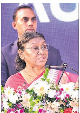
ଏସ୍‌ସି ମେଡିକାଲ କଲେଜ ଛାତ୍ର ସଂସଦର ବାର୍ଷିକ ଉତ୍ସବରେ ରାଷ୍ଟ୍ରପତି ଦ୍ରୌପଦୀ ମୁର୍ମୁ ଉଦ୍‌ଘୋଷଣା କହିଥିଲେ।

କାମ। ଶାସକ, ପ୍ରଶାସକ, ଜଞ୍ଜିନିୟର, ଅଧ୍ୟାପକମାନେ ଲୋକଙ୍କ ସେବା କରିପାରିବେ, ମାତ୍ର ତାଙ୍କୁ ସନ୍ତୁଷ୍ଟ କରିପାରିବେ ନାହିଁ। ଗାଁ ଗହଳିରେ ଲୋକେ ଡାକ୍ତର, ଓକିଲ ଓ ଶିକ୍ଷକଙ୍କୁ ଜଗଦୀନ ମାନନ୍ତି। ଡାକ୍ତରମାନେ ନିଷ୍ଠାର ସହିତ ସେବା କରି ରୋଗୀଙ୍କୁ ଭଲ କରିପାରନ୍ତି। ଜଗଦୀନଙ୍କୁ ଆମେ ଦେଖିପାରୁଁ, କିନ୍ତୁ ଡାକ୍ତରମାନେ ହେଉଛନ୍ତି ଚଳନ୍ତି ଠାକୁର। ପୂର୍ବାପେକ୍ଷା ମାତୃ ଓ ଶିଶୁ ମୃତ୍ୟୁହାର ବହୁ ପରିମାଣରେ ହ୍ରାସ ପାଇଛି। ଡାକ୍ତରଙ୍କ ସେବା ଯୋଗୁ ବହୁ ମୂଲ୍ୟବାନ ଜୀବନ ବଞ୍ଚିଯାଉଛି। ଯେତେବେଳେ କୋଭିଡ-୧୯ ବିଶ୍ୱକୁ ଦୋହଲାଇ ଦେଇଥିଲା ସେତେବେଳେ ଭାରତୀୟ ଚିକିତ୍ସକମାନେ ନିଜ ଜୀବନକୁ ଭୁକ୍ଷେପ ନ କରି ଓ ପରିବାରକୁ ଛାଡ଼ି ଯେଉଁ ସେବା କଲେ, ତାହା ବାସ୍ତବରେ ପ୍ରଶଂସନୀୟ ବୋଲି ରାଷ୍ଟ୍ରପତି କହିଛନ୍ତି। ମେଡିକାଲ ପିଲାମାନେ ଗବେଷଣା କ୍ଷେତ୍ରକୁ ମଧ୍ୟ ଆସିବା