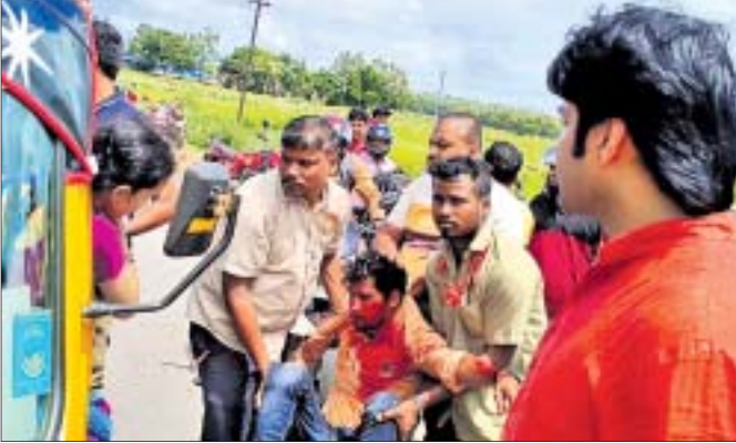
ଆହତଙ୍କୁ ହସ୍ପିଟାଲ ପଠାଯାଇଛି ।