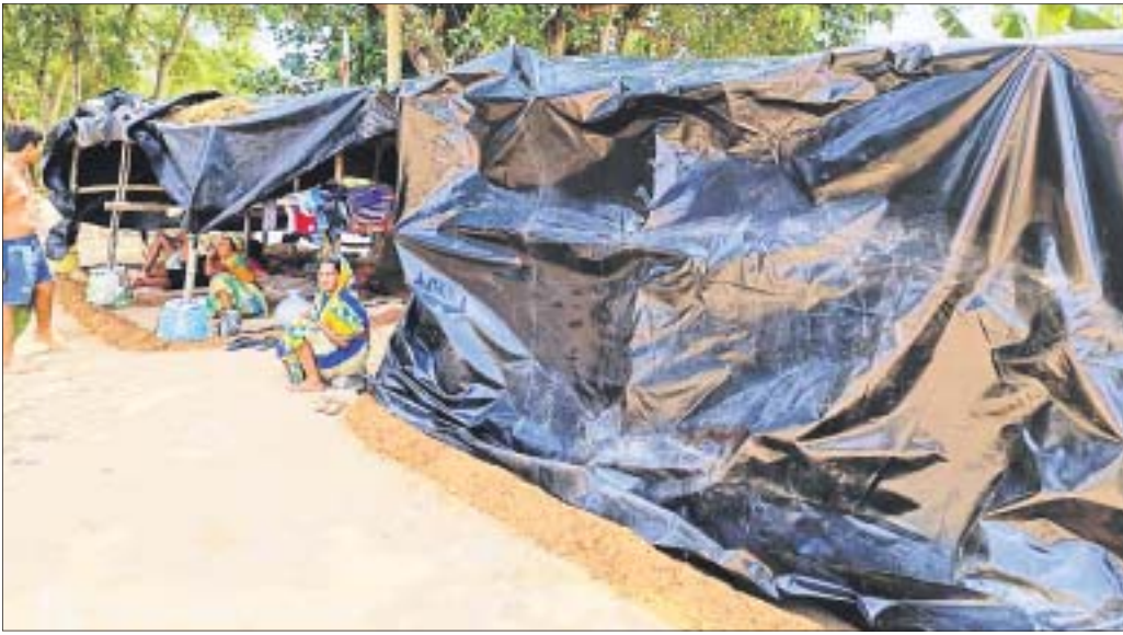
ବନ୍ୟା ସମୟରେ ନଦୀକୂଳରେ ଜୀବନ । (ଫାଇଲ ଫଟୋ)