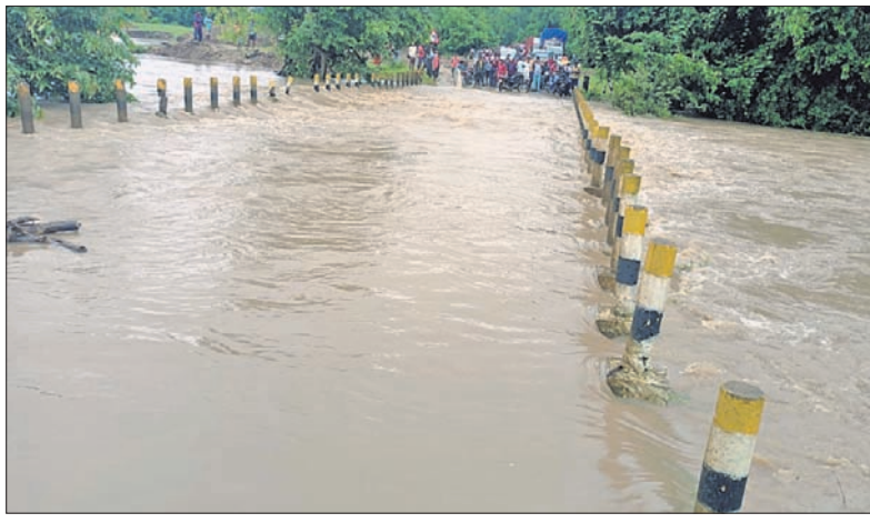
କାଳୁରୁକୋଣ୍ଡା ପୋଲ ଉପରେ ବର୍ଷା ଜଳ।

(ପୂର୍ଣ୍ଣ ପଦକାୟକ)/ବାଲିମେଳା (ଶିବପର ସାହୁ) କମାଳକାନଗିରି ଜିଲ୍ଲାରେ ମଞ୍ଜଳବାରଠାରୁ ପୁଣି ପ୍ରବଳ ବର୍ଷା ଆରମ୍ଭ ହୋଇଛି। ଫଳରେ ଜିଲ୍ଲାରେ ବନ୍ୟା ପରିସ୍ଥିତି ଦେଖାଦେଇଛି।