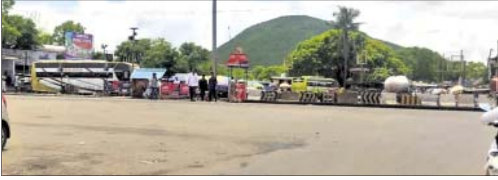
ଚଣ୍ଡିଖୋଲ ଟ୍ରାଫିକ୍ ପୋଷ୍ଟକୁ ବନ୍ଦ କରାଯାଇଛି।

ଯାଜପୁର ଜିଲାର ପୁଖାଶାଳାଭାବେ ପରିଚିତ ଚଣ୍ଡିଖୋଲ ଛକ। ଏହା ୨ ଜାତୀୟ ରାଜପଥର ମିଳନ ସ୍ଥଳ। ଦୀର୍ଘ ବର୍ଷ ହେଲା ଚଣ୍ଡିଖୋଲ ଛକର ଟ୍ରାଫିକ୍ ସମସ୍ୟା ନିୟନ୍ତ୍ରଣ ପାଇଁ ବୈଠକ ପରେପରେ ବୈଠକ ଚାଲିଛି। ହେଲେ ଆଜିଯାଏ ଏହାର ସମାଧାନ ବାଟ ବାହାରି ପାରିନାହିଁ। ଜିଲାପାଳ, ଆରକ୍ଷା ଅଧୀକ୍ଷକ, ଏନ୍‌ଏଫ୍‌ଆଇ ଓ ଜନପ୍ରତିନିଧିମାନେ ବିଗତ ୧୦ ବର୍ଷ ପର୍ଯ୍ୟନ୍ତ ୨୦ରୁ ଉର୍ଦ୍ଧ୍ୱ ଥର ବିଭିନ୍ନ ବୈଠକ କରି ଚଣ୍ଡିଖୋଲ ଟ୍ରାଫିକ୍ ସମସ୍ୟା ସମାଧାନ ପାଇଁ ଆଲୋଚନା କରିଛନ୍ତି। କିନ୍ତୁ ଫଳ ଶୂନ୍ୟ। ଏହାର ସମାଧାନ କରିବା ପରିବର୍ତ୍ତେ ଏବେ ସବୁଦିନ ପାଇଁ ଟ୍ରାଫିକ୍ ପୋଷ୍ଟକୁ ବନ୍ଦ କରିଦେଇଛନ୍ତି। ଏନେଇ ଗୁମାସ୍ତ ଅଞ୍ଚଳବାସୀ ଓ ବିଭିନ୍ନ ସଙ୍ଗଠନ ମଧ୍ୟ ଅନେକ ବାର ପ୍ରତିବାଦ କରିଛନ୍ତି। ହେଲେ ଟ୍ରାଫିକ୍ ସମସ୍ୟା ସୁଧୁରି ନାହିଁ ବରଂ ଟ୍ରାଫିକ୍ ଛକରେ ଏହି ୧୦ ବର୍ଷ ମଧ୍ୟରେ ବିଭିନ୍ନ ଦୁର୍ଘଟଣାରେ