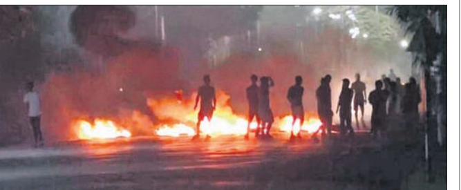
କାଳପୋକ୍ତିରେ ଉତ୍ତର ଲୋକେ ନିଆଁ ଲାଗାଇଦେଇଥିବା ବ୍ୟ୍.

କେତେଜଣ ନିଆଁ ଲାଗାଇ ଦେଇଥିଲେ। ମେଲିତି ଓ କ୍ଳିକି-କି ସମ୍ପ୍ରଦାୟ ମଧ୍ୟରେ ଲାଗି ରହିଥିବା ବିବାଦକୁ ନେଇ ଗଢ଼ାଏବ୍ୟାପୀ ଦେଖାଯାଇଥିବା ହିଂସାରେ ମୋଟ ୧୬୦ ଜଣଙ୍କ ମୃତ୍ୟୁ ଘଟିଛି। ଅନ୍ୟପକ୍ଷେ ବୁଲୁ ମହିଳାଙ୍କୁ ଉଲଗ୍ନ ପରେଡ଼ି କରାଯିବା ନେଇ ଭାରତୀୟ ଭିତ୍ତି ଅଧିକାର