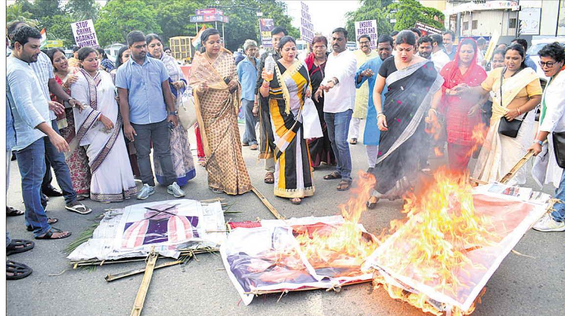
ମଣିପୁର ଘଟଣାକୁ ବିରୋଧ କରି ମାଷ୍ଟରକ୍ୟାଣ୍ଟିନ ଛକ ନିକଟରେ ରୁଧିରା ମହିଳା କଂଗ୍ରେସ ପକ୍ଷରୁ ପ୍ରଧାନମନ୍ତ୍ରୀ, ସ୍ୱରାଷ୍ଟ୍ର ମନ୍ତ୍ରୀ, କେନ୍ଦ୍ରମନ୍ତ୍ରୀ ସ୍ମୃତି ଇରାନୀ ଓ ମଣିପୁର ମୁଖ୍ୟମନ୍ତ୍ରୀଙ୍କ କୁଶପୁରୁଷିକା ଦାହ କରାଯାଇଛି।