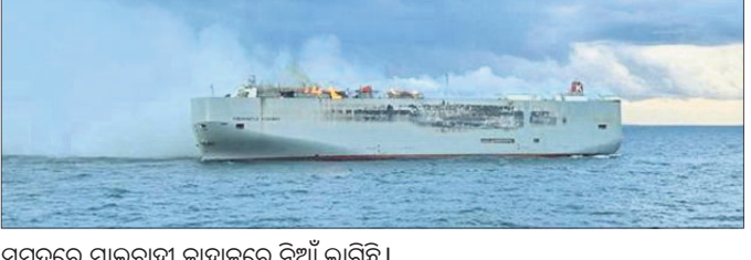
ସମୁଦ୍ରରେ ମାଲବାହୀ ଜାହାଜରେ ନିଆଁ ଲାଗିଛି।

ଆମେଲଣ୍ଡର ଡବ୍ ଆଇଲଣ୍ଡଠାରୁ ଉତ୍ତରରେ ୨୬ କି.ମି. ଦୂର ଉତ୍ତର ସମୁଦ୍ରରେ ୩,୦୦୦ କାର୍ ନେଇ ଯାଉଥିବା ଏକ ମାଲବାହୀ ଜାହାଜରେ ନିଆଁ ଲାଗିଯାଇଛି। ଉତ୍ତରରେ ଜଣକଙ୍କ ମୃତ୍ୟୁ ହୋଇଥିବାବେଳେ ଅନେକ ଆହତ ହୋଇଛନ୍ତି। ମଙ୍ଗଳବାର ରାତିରେ ଜାହାଜରେ ନିଆଁ ଲାଗିଯାଇଥିବାବେଳେ ବହୁ କ୍ରିକ୍ ମେମ୍ବର ଜୀବନ ରକ୍ଷା ପାଇଁ ପାଣିକୁ ଡେଇଁ ପଡ଼ିଥିଲେ। ଜାହାଜରେ