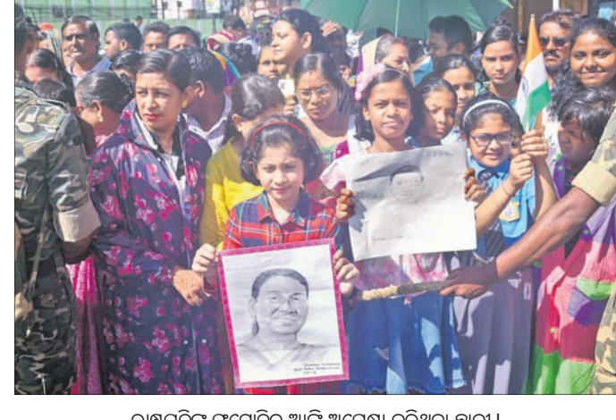
ରାଷ୍ଟ୍ରପତି ଫଟୋଟିଡୁ ଆଜି ଅପେକ୍ଷା କରିଥିବା ଛାତ୍ରୀ

ଭାରତ ସ୍ୱାଧୀନତାର ଶତବାର୍ଷିକା ପାଳନ କରିବା ସେତେବେଳକୁ ଭାରତ ପୂର୍ଣ୍ଣ ବିକଶିତ ଦେଶ ହେବା ଲକ୍ଷ୍ୟରେ କାମ କରିବା ଦରକାର। ଏହି ମେଡିକାଲ କଲେଜ ପ୍ରତିଷ୍ଠାରେ ମହାରାଜା ଶ୍ରୀରାମଚନ୍ଦ୍ର ଭଞ୍ଜଦେଓଙ୍କ ଅବଦାନ ଅତୁଳନୀୟ। ଏକ ଛୋଟ ଚାର୍ଯ୍ୟାଳୟ ଡାକ୍ତରଖାନାକୁ ଆରମ୍ଭ ହୋଇ ଆଜି ଏହା ଦେଶରେ ପୂରା ନାମ କରିଛି। ସବୁ ବର୍ଗର ଲୋକଙ୍କୁ ଏଠାରେ ନିଃଶୁଳ୍କ ଚିକିତ୍ସା ଦିଆଯାଉଛି। ଏହା ଏକ ସର୍ବଭାରତୀୟ ଅନୁଷ୍ଠାନ। ଦେଶର ବିଭିନ୍ନ ପ୍ରାନ୍ତରୁ ଡାକ୍ତରୀ ପଢ଼ିବାକୁ ପିଲାମାନେ ଏଠାକୁ ଆସୁଛନ୍ତି ବୋଲି ରାଷ୍ଟ୍ରପତି କହିଥିଲେ। ରାଜ୍ୟପାଳ ପ୍ରଫେସର ଗଣେଶ ଲାଲ କହିଥିଲେ, ହସ୍ପିଟାଲ ଅର୍ଥ ହସ୍ପିଟାଲିଟି। ରୋଗୀକୁ ଜଣେ ଡାକ୍ତର ନିଜ ଭିତରେ ଅନୁଭବ କରିବେ। ଡାକ୍ତର ରୋଗୀ ସ୍ତରକୁ ନ ଆସିଲେ ସେ କେବେ ଚିକିତ୍ସା କରିପାରିବେ ନାହିଁ। ତା'ହେଲେ ଯାଜ ଜଣେ ରୋଗୀକୁ ଉପଯୁକ୍ତ ଚିକିତ୍ସା