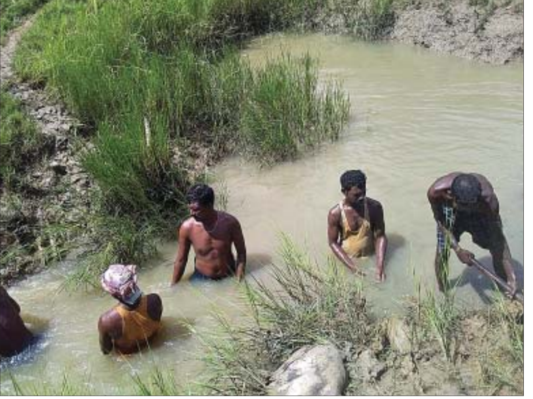
ଗ୍ରାମବାସୀ ଘାଇ ମରାମତି କରୁଛନ୍ତି ।