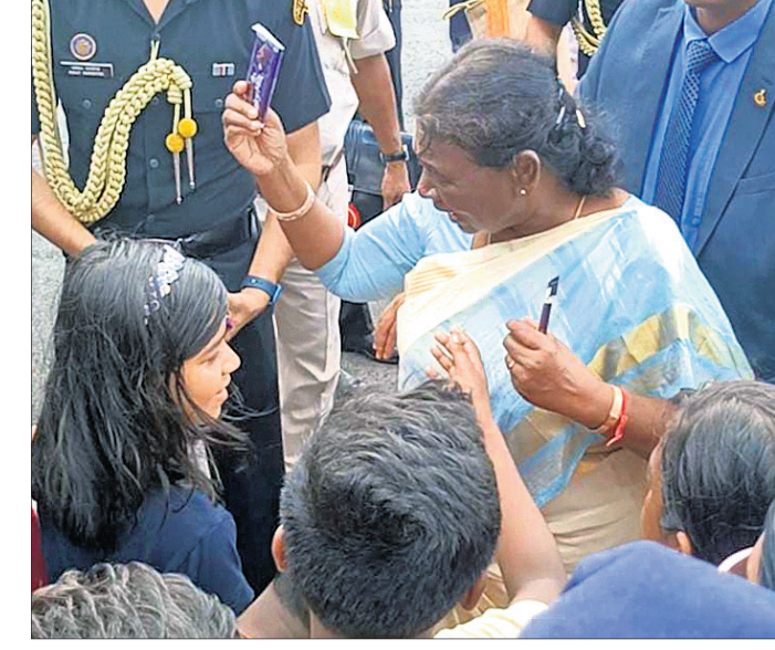
ପିଲାଙ୍କୁ ଚକୋଲେଟ୍ ବାଣ୍ଟୁଛନ୍ତି ରାଷ୍ଟ୍ରପତି।