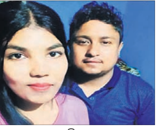
ସ୍ତ୍ରୀ ସଂଘର୍ଷରେ ଯୋଗକ ସହ ନାହିଁବାର ରହମାନ।

୯ ମାସର ପୁଅକୁ ଧରି ଥାନାରେ ଆତ୍ମହତ୍ୟା କଲେ ମହିଳା