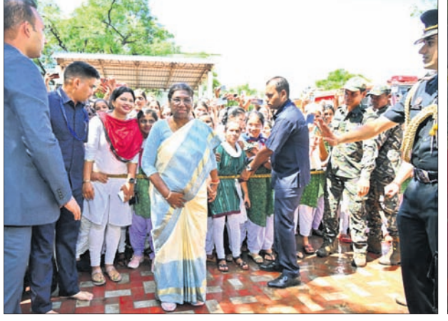
କାର୍ତ୍ତିକେଶ୍ୱରୁ ଓହ୍ଲାଇ ଲୋକଙ୍କ ଗହଣରେ ରାଷ୍ଟ୍ରପତି।