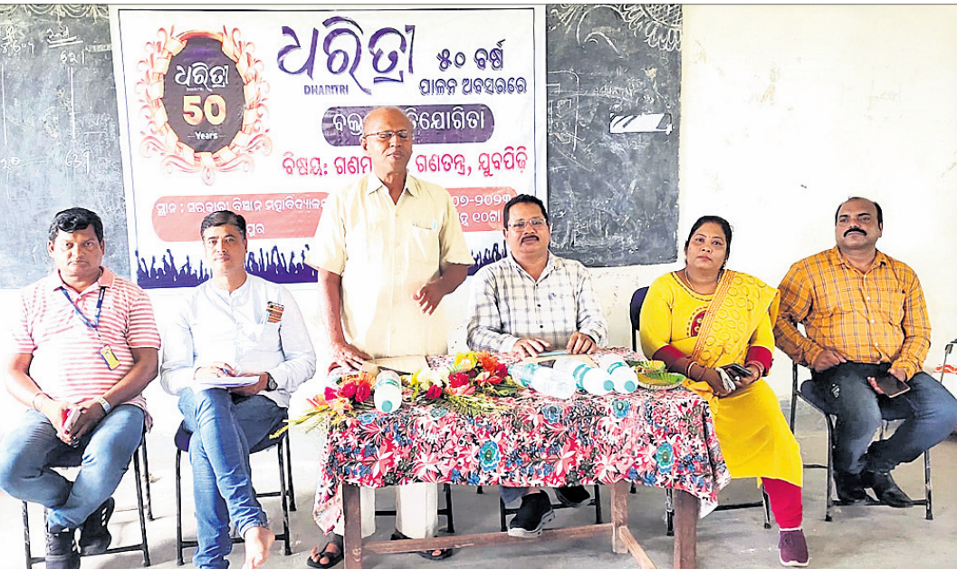
ମୁଖ୍ୟ ଅତିଥି ପୂର୍ବତନ ବିଧାୟକ ଅଶୋକ ଚୌଧୁରୀଙ୍କ ଉଦ୍‌ଘୋଷଣା