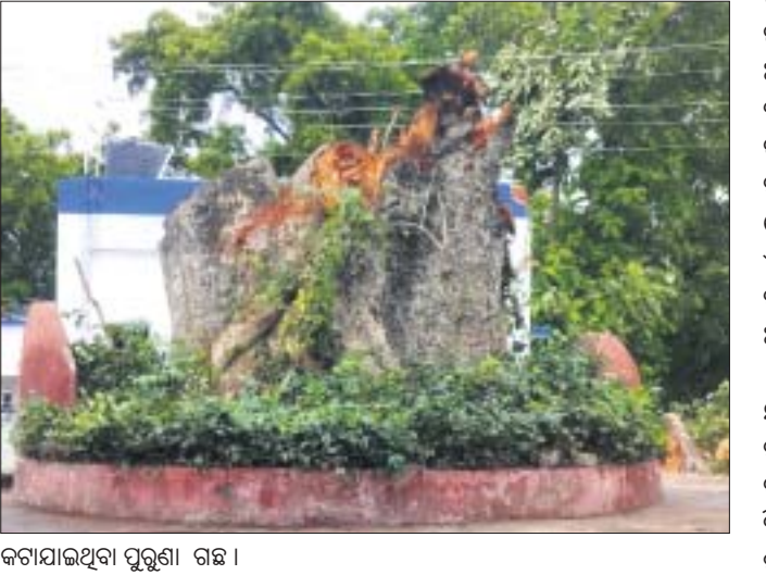
କଟାଯାଇଥିବା ପୁରୁଣା ଗଛ।

କାର୍ଯ୍ୟ କରୁଛି। କର୍ମଚାରୀ ଅଭାବରୁ ବିଭିନ୍ନ କାର୍ଯ୍ୟରେ ଆସୁଥିବା ଗ୍ରାହକ ଘଣ୍ଟାଘଣ୍ଟା ଧରି ଧାଡ଼ିରେ ଛିଡ଼ା ହୋଇ ଅସନ୍ତୁଷ୍ଟ ପ୍ରକାଶ କରୁଛନ୍ତି। ଏଟିଏମ୍ ସୁବିଧା ନ ଥିବାରୁ ମଧ୍ୟ ଅସୁବିଧା ହେଉଛି। ବହୁ ସମୟରେ 'ଲିଙ୍କ୍ ଫେଲ୍' ହେବୁ ବୃତ୍ତରୁ ଆସୁଥିବା ଗ୍ରାହକ ନିରାଶ ହୋଇ ଫେରିବାକୁ ବାଧ୍ୟ ହେଉଛନ୍ତି। ଶାରୀରିକ ଅସମ, ବୟସ ଓ ମହିଳାଙ୍କ ପାଇଁ ସ୍ୱତନ୍ତ୍ର ବ୍ୟବସ୍ଥା ନ ଥିବାରୁ ଗୋଟିଏ ଧାଡ଼ିରେ ସମସ୍ତଙ୍କୁ ଛିଡ଼ା ହୋଇ ଅପେକ୍ଷା କରିବାକୁ ପଡ଼ୁଛି। ଅନ୍ୟପକ୍ଷରେ ଡାକଘର କାନ୍ଧ ଓ ଛାତର ବହୁ ସ୍ଥାନରେ ଆବଶ୍ୟକତାପୂର୍ବକ ହେବ। ଏବେ ମାତ୍ର ୩୩ ଜଣ କର୍ମଚାରୀଙ୍କୁ ନେଇ ଏହି ଡାକଘର