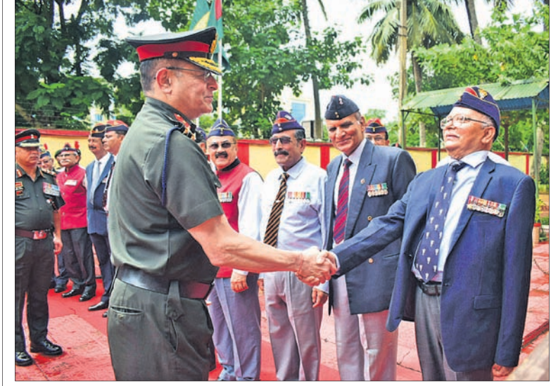
ଭୁବନେଶ୍ୱରସ୍ଥିତ ୧୨୦ ବାଟାଲିଅନଠାରେ ବୁଧବାର କାର୍ତ୍ତବିକା ବିଜୟ ଦିବସ ପାଳନ ଅବସରରେ ସେନା ଅଧିକାରୀ ଓ ଅତିଥିମାନେ ।