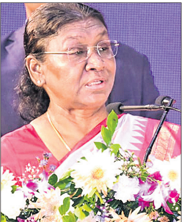
ଏସ୍‌ସିବି ମେଡିକାଲ କଲେଜ ଛାତ୍ର ସଂସଦର ବାର୍ଷିକ ଉତ୍ସବରେ ରାଷ୍ଟ୍ରପତି ଡ୍ରୌପଦୀ ମୁର୍ମୁ ଉଦ୍‌ବୋଧନ ଦେଉଛନ୍ତି।

ଡାକ୍ତରୀମାନେ ସେବା ବଳରେ ରୋଗୀଙ୍କୁ ଜୀବନ ଦାନ ଦିଅନ୍ତି। ସେବା ପ୍ରତି ଆନ୍ତରିକତା ନ ଥିଲେ, ସମାଜ ପ୍ରତି ପ୍ରତିବନ୍ଧକତା ନ ଥିଲେ ବା ଦୁଃଖୀ ମଣିଷର ଆଖିରୁ ଲୁହ ପୋଛିଦେବା ପାଇଁ ମନରେ ପ୍ରେରଣା ନ ଥିଲେ କଣେ ଭଲ ଡାକ୍ତର ହୋଇପାରିବେ ନାହିଁ। ଡାକ୍ତର ତାଙ୍କ ପାଠରେ ପ୍ରବାଣ ହେବା ସହିତ ତାଙ୍କ ମନରେ ଲୋକଙ୍କ ପ୍ରତି ଦୟା ରହିବା ଦରକାର। ଡାକ୍ତରୀ ଏକ ବୃତ୍ତି ନୁହେଁ, ବରଂ ଏହା ଏକ ବ୍ରତ। ଡାକ୍ତର ହେବା ପାଇଁ ପିଲାମାନେ ଯେଉଁ ବ୍ରତ ଧାରଣ କରିଥାନ୍ତି, ତାହା ଜୀବନ ସାରା ପାଳନ କରିଥାନ୍ତି ବୋଲି ଏସ୍‌ସିବି ମେଡିକାଲ କଲେଜ ଛାତ୍ର ସଂସଦର ବାର୍ଷିକ ଉତ୍ସବରେ ମୁଖ୍ୟ ଅତିଥି ଭାବେ ରାଷ୍ଟ୍ରପତି ରାଷ୍ଟ୍ରପତି ଡ୍ରୌପଦୀ ମୁର୍ମୁ ଡାକ୍ତରୀ ଛାତ୍ରାଛାତ୍ରଙ୍କ ଉଦ୍ଦେଶ୍ୟରେ କହିଥିଲେ।