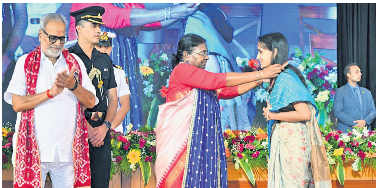
ରାଷ୍ଟ୍ରପତି ଡ୍ରୌପଦୀ ମୁର୍ମୁ କଟକସ୍ଥିତ ଆଇନ ବିଶ୍ୱବିଦ୍ୟାଳୟର ସମାବର୍ତ୍ତନ ଉତ୍ସବରେ ଅତିଥି ଭାବେ ଯୋଗଦେଇ ଜଣେ ଛାତ୍ରୀଙ୍କୁ ସମ୍ବର୍ଦ୍ଧିତ କରୁଛନ୍ତି।

ଭାରତ ଏକ ବିକାଶଶୀଳ ଦେଶରେ ପରିଣତ ହେବାକୁ ଯାଉଛି। ଦେଶ ଗଠନରେ ଆଇନ ପେଶାରେ ଥିବା ଛାତ୍ରୀଛାତ୍ରଙ୍କ ଭୂମିକା ଅତ୍ୟନ୍ତ ଗୁରୁତ୍ୱପୂର୍ଣ୍ଣ ବୋଲି ରାଷ୍ଟ୍ରପତି ଡ୍ରୌପଦୀ ମୁର୍ମୁ ମତବ୍ୟକ୍ତ କରିଛନ୍ତି। କୁସବାର ଜାତୀୟ ଆଇନ ବିଶ୍ୱବିଦ୍ୟାଳୟର ଦଶମ ସମାବର୍ତ୍ତନ ଉତ୍ସବରେ ରାଷ୍ଟ୍ରପତି ଡ୍ରୌପଦୀ ମୁର୍ମୁ ମୁଖ୍ୟ ଅତିଥି ଭାବେ ଯୋଗଦେଇ କହିଲେ, ଆଇନ ଓ ଆଇନ ସମ୍ପର୍କିତ ପାଠ ନ୍ୟାୟକୁ ଜାଣିବା ପାଇଁ ଉଦ୍ଦିଷ୍ଟ। ଆଇନ ଛାତ୍ରୀଛାତ୍ରମାନେ ସାମାଜିକ ସତେଜତା ମାଧ୍ୟମରେ ନିଜର କର୍ତ୍ତବ୍ୟ ସମ୍ପାଦନ କରନ୍ତୁ। ପ୍ରିଫିନୋଟ୍ ଭଳି ଜାତୀୟ ଆଇନ ବିଶ୍ୱବିଦ୍ୟାଳୟର ଲକ୍ଷ୍ୟ ନ୍ୟାୟ। ଭାରତୀୟ ସଂସ୍କୃତିରେ ଧର୍ମର କୌଣସି ସଂପ୍ରଦାୟ ନାହିଁ। ଏକ ସ୍ଥୁଳ ସମାଜ ଗଠନ ଦିଗରେ ଧର୍ମ ମଣିଷକୁ ନେଇଯାଏ। ବିଜୟ ସର୍ବଦା ଧର୍ମ ସାଥରେ ଥାଏ। ତ. ଆୟେତକରଙ୍କ କଥା ସ୍ମରଣ କରାଇ ଆଇନ କ୍ଷେତ୍ରରେ ତାଙ୍କର ବାନ୍ତିତାରୁ ରାଷ୍ଟ୍ରପତି ଅବତାରଣା କରିଥିଲେ। ଭାରତୀୟ ସ୍ୱାଧୀନତା ସଂଗ୍ରାମରେ ଆଇନଜୀବୀମାନଙ୍କ ଭୂମିକା ଉଲ୍ଲେଖନୀୟ ଥିଲା। ଉତ୍କଳଗୌରବ ମଧୁସୂଦନ ଦାସଙ୍କ ନାମ ପ୍ରଶିଦ୍ଧାନଯୋଗ୍ୟ, ଯାହାଙ୍କ କନ୍ଦହାରୀ ଆଇନଜୀବୀ ଦିବସ ଭାବେ ପାଳନ କରାଯାଉଛି ବୋଲି ରାଷ୍ଟ୍ରପତି