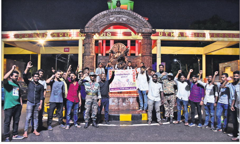
କାର୍ତ୍ତବିକା ବିଜୟ ଦିବସରେ ଅଧିକ ଭାରତୀୟ ବିଦ୍ୟାର୍ଥୀ ପରିଷଦ ପକ୍ଷରୁ ଉତ୍କଳ ବିଶ୍ୱବିଦ୍ୟାଳୟ ମୁଖ୍ୟ ଫାଟକ ସମ୍ମୁଖରେ ଦୀପାବଳି ଶହାହଳ ସ୍ମୃତିଚାରଣ କରାଯାଇଛି ।