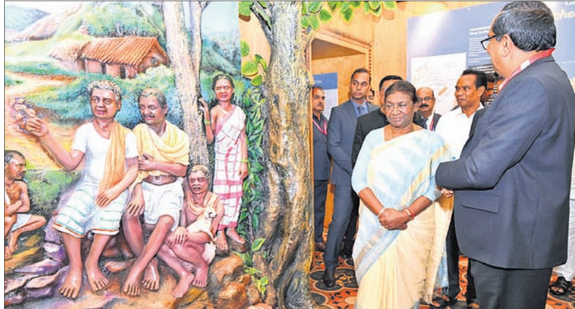
ମୁଖ୍ୟମନ୍ତ୍ରୀ ଅଫ୍ ଜଶ୍ୱ ପରିବର୍ତ୍ତନ ବେଳେ ରାଷ୍ଟ୍ରପତି ଓ ଅନ୍ୟମାନେ।