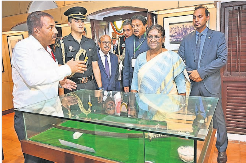
ଓଡ଼ିଆ ବଜାରସ୍ଥିତ ନେତାଜୀ ସୁବାସ ଚନ୍ଦ୍ର ବୋଷଙ୍କ କବ୍‌ଗ୍ରାମ ସଂଗ୍ରହାଳୟ ବୁଲି ଦେଖିଛନ୍ତି ରାଷ୍ଟ୍ରପତି।