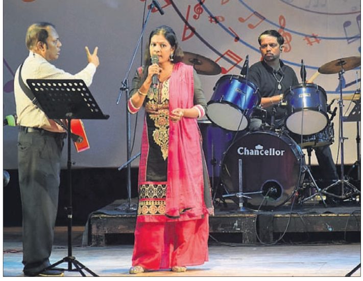
ଜାଲାଇ ମ୍ୟୁଜିକ୍ ସର୍କଲ ପକ୍ଷରୁ ଭୁବନେଶ୍ୱର ରବୀନ୍ଦ୍ର ମଣ୍ଡପରେ ଅନୁଷ୍ଠିତ ସଙ୍ଗୀତ ଭିତ୍ତିକ କାର୍ଯ୍ୟକ୍ରମରେ ଜଣେ କଣ୍ଠଶିଳ୍ପୀ ସଙ୍ଗୀତ ପରିବେଷଣ କରୁଛନ୍ତି ।