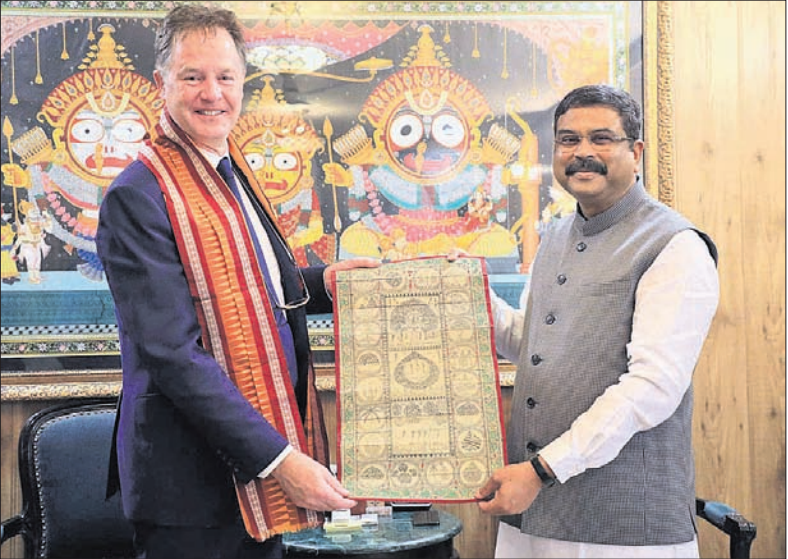
ଭୁବନେଶ୍ୱର, ୨୬।୭(ସ୍ଥାନିତ୍ ମିଶ୍ର)

୨ ହଜାର ଟଙ୍କା ଦେଇଥିଲେ । ତେବେ ଲାଞ୍ଚଖୋର ପୋଲିସ୍ ଅଧିକାରୀଙ୍କୁ ପାନେ ବେବା ପାଇଁ ସେ ବ୍ରହ୍ମପୁର ଜିଲ୍ଲାସ୍ତର ଖାରସ୍ତ ହୋଇଥିଲେ । ବୁଧବାର ବୌଦ୍ଧ ବସ୍ଷୁଣ୍ଡରେ ଅବଶିଷ୍ଟ ୮ ହଜାର ଟଙ୍କା ନେବାବେଳେ ପୂର୍ବ ଯୋଜନା ଅନୁଯାୟୀ ଜିଲ୍ଲାସ୍ତର ଟିଏ ଅଭିଯୁକ୍ତ ଏଏସଆଇଙ୍କୁ ମାଡ଼ି ବସିଥିଲା ।