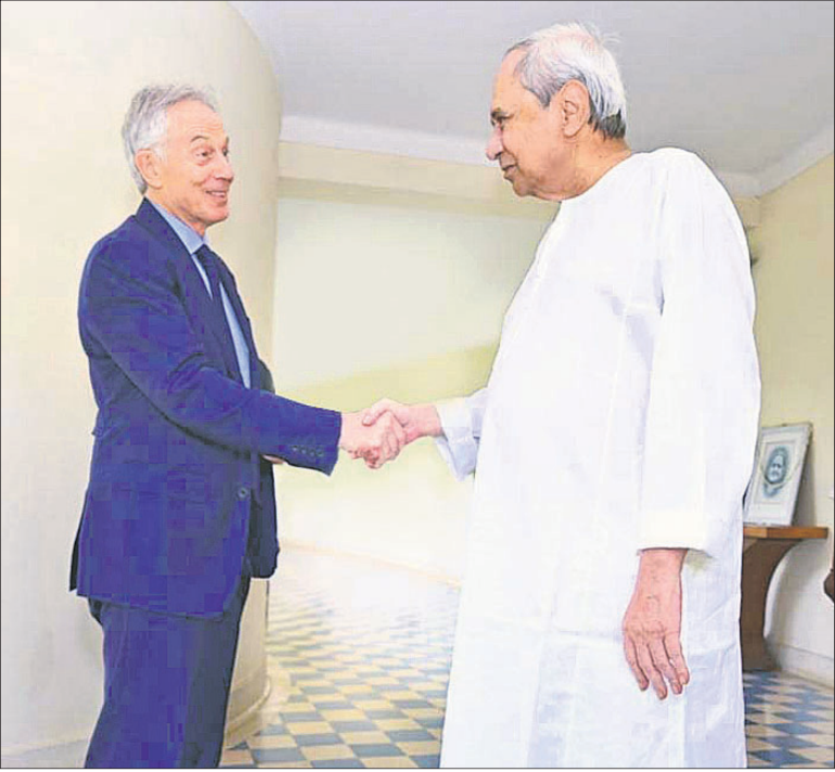
ବ୍ରିଟେନ୍‌ର ପୂର୍ବତନ ପ୍ରଧାନମନ୍ତ୍ରୀ ଟୋନି ବ୍ଲେୟାର ବୁଧବାର ନବୀନ ନିବାସଠାରେ ମୁଖ୍ୟମନ୍ତ୍ରୀ ନବୀନ ପଟ୍ଟନାୟକଙ୍କୁ ସାକ୍ଷାତ କରୁଛନ୍ତି।

ବୁଧବାର ଓଡ଼ିଶା ହାଇକୋର୍ଟର ୭୫ବର୍ଷ ପୂର୍ତ୍ତି ସମାରୋହରେ ମୁଖ୍ୟ ଅତିଥି ଭାବେ ରାଷ୍ଟ୍ରପତି ଯୋଗଦେଇ ଜୟ କରନ୍ତାଥ ସନ୍ଦେଶନାକୁ ନିଜର ଅଭିଭାଷଣ ଆରମ୍ଭ କରିଥିଲେ। ଓଡ଼ିଶା ହାଇକୋର୍ଟ ଆରମ୍ଭ ସମୟର କଥା ଉପସ୍ଥାପନ କରି ରାଷ୍ଟ୍ରପତି କହିଲେ, କୌଣସି ଅନୁଷ୍ଠାନ ସମୟ ଅନୁସାରେ ନ ବଦଳିଲେ ପଛରେ ପଡ଼ିଯାଏ। ୪ ଜଣ ବିଚାରପତିଙ୍କୁ ନେଇ ଏହି ଉଚ୍ଚ ନ୍ୟାୟାଳୟ ଆରମ୍ଭ ହୋଇଥିଲା, ଏବେ ବିଚାରପତି ସଂଖ୍ୟା ୩୩କୁ ବୃଦ୍ଧି ପାଇଛି। ଗତ ୨୫ବର୍ଷ ମଧ୍ୟରେ ହରିତ ନ୍ୟାୟ ପ୍ରଦାନ ଯୋଗୁ ଓଡ଼ିଶା ଉଚ୍ଚନ୍ୟାୟାଳୟର ବିଚାରାଧୀନ ମାମଲା ସଂଖ୍ୟା ଏକ ଚତୁର୍ଥାଂଶ ହ୍ରାସ ପାଇଛି। ନ୍ୟାୟ ପ୍ରଦାନ କ୍ଷେତ୍ରରେ ଫୁଷ୍ଟା-୪