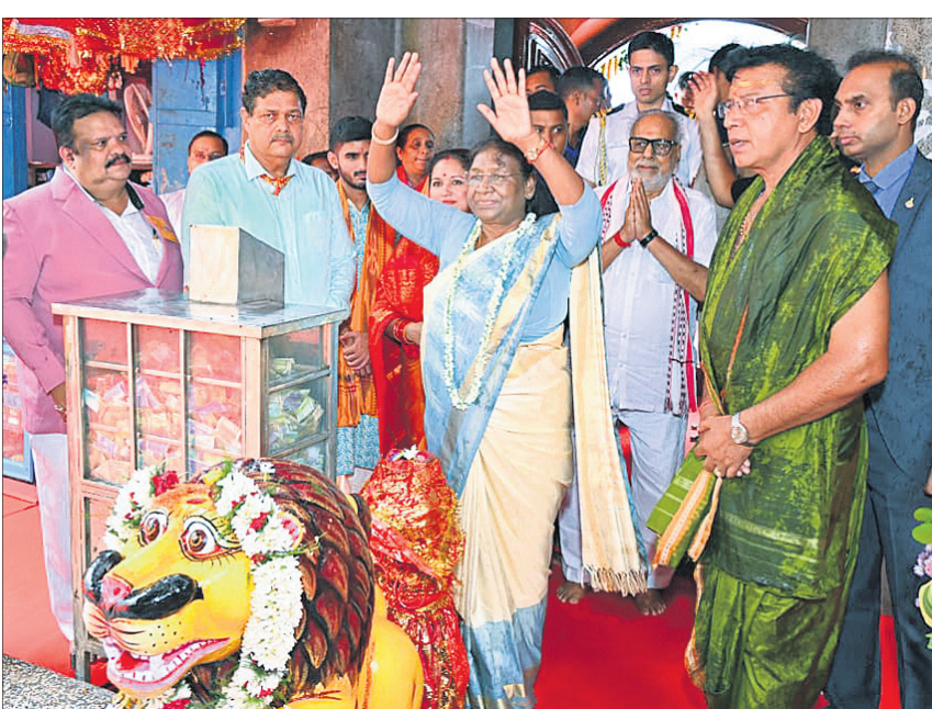
ମା’ କଟକ ଚଷମାଙ୍କୁ ରାଷ୍ଟ୍ରପତି ବର୍ତ୍ତନ କରି ଆଶିଷ ଭିକ୍ଷା କରୁଛନ୍ତି।