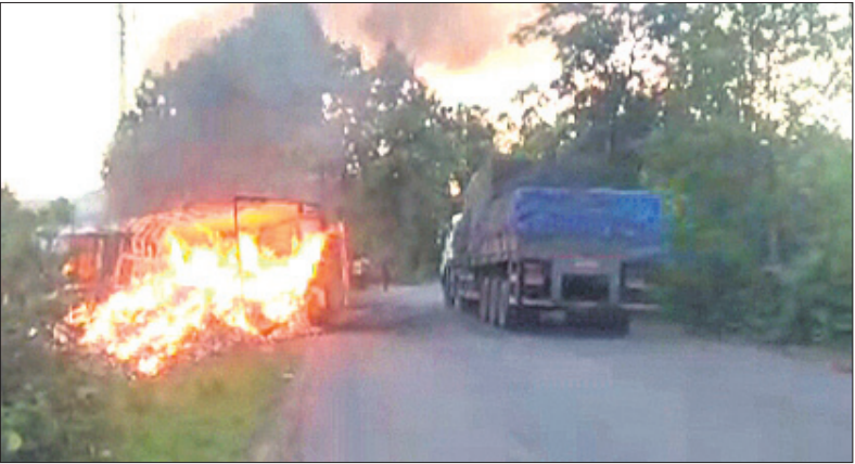
ନିଆଁଲାଗି ମିନିଷକୁ ଜଳୁଛି ।

କରାଯାଇପାରିବ ସେନେଇ କେନ୍ଦ୍ରମନ୍ତ୍ରୀ ଏହି ବୈଦେଶିକ ବିସ୍ତୃତ ଭାବେ ଆଲୋଚନା କରିଛନ୍ତି । ପ୍ରଧାନମନ୍ତ୍ରୀ ନରେନ୍ଦ୍ର ମୋଦିଙ୍କ ଦୂରଦୃଷ୍ଟି କାମାୟ ଶିକ୍ଷାନୀତି ଚେନ୍ନାଇଲୋଡି ଆଧାରିତ ଶିକ୍ଷାକୁ ପ୍ରୋତ୍ସାହନ ଦେଉଛି । ଷ୍ଟାର୍ଟଅପରେ ନିୟୋଜିତ ଥିବା ଯୁବ ଉଦ୍ୟୋଗୀମାନଙ୍କ କିଛି ସେମାନଙ୍କ ସ୍ୱପ୍ନସାଧାରଣ ଚେନ୍ନାଇଲୋଡି ମାଧ୍ୟମରେ ବଢ଼ାଇପାରିବେ ସେନେଇ ଅବଗତ କରାଇଛନ୍ତି । ସେହିପରି ଚେନ୍ନାଇଲୋଡି ଲନୋଭେସନ, ଉଦ୍ୟମିତା କ୍ଷେତ୍ରକୁ ଉପଯୋଗ କରିବା ଉପରେ ଚର୍ଚ୍ଚା ସହ ଡିଜିଟାଲ ଇଣ୍ଡିଆ ଏବଂ ସ୍କିଲ ଇଣ୍ଡିଆ ମିଶନ ସମ୍ବନ୍ଧ କରିବା ପାଇଁ କେନ୍ଦ୍ରମନ୍ତ୍ରୀ ମେଘାନ୍ତ୍ରୀ ନିମନ୍ତ୍ରଣ କରିଛନ୍ତି । ନିଜ କୈବର୍ତ୍ତ୍ୟ ଓଡ଼ିଶାର ପାରମ୍ପରିକ ପଦ୍ଧତିକୁ ପ୍ରଦାନ କରିବା ପ୍ରସାରରେ କେନ୍ଦ୍ରମନ୍ତ୍ରୀ ଓଡ଼ିଶାର ପ୍ରତିଭାସମ୍ପନ୍ନ ବ୍ୟକ୍ତି ଓ କଳାକାରଙ୍କ ସମେତ ରାଜ୍ୟର କଳା, ସଂସ୍କୃତି, ପରମ୍ପରା ଉପରେ ଚର୍ଚ୍ଚା କରିଛନ୍ତି । ଦେଶ ସମେତ ଓଡ଼ିଶା ଭଳି ରାଜ୍ୟରେ ମେଘା ଚେନ୍ନାଇଲୋଡି କିଛି ଯୁବ ପ୍ରତିଭାକୁ ଅଧିକ ଦମ୍ଭ କରିବା ସହ ସିଲ କ୍ଷେତ୍ରକୁ ମଜବୁତ କରିବ, ତାହା ଉପରେ କାର୍ଯ୍ୟ କରିବା ପାଇଁ କେନ୍ଦ୍ରମନ୍ତ୍ରୀ ପରାମର୍ଶ ଦେଇଛନ୍ତି ।