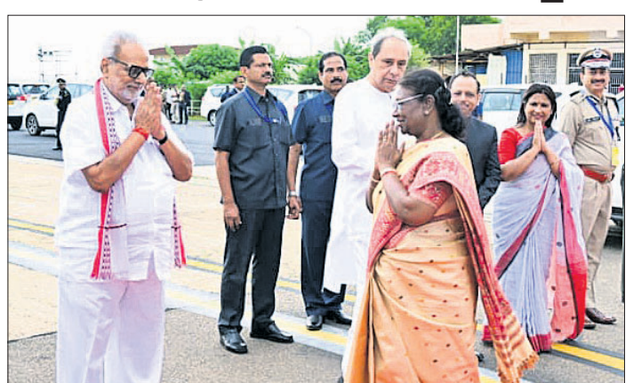
ଭୁବନେଶ୍ୱର ବିମାନବନ୍ଦରରେ ରାଷ୍ଟ୍ରପତିଙ୍କୁ ରାଜ୍ୟପାଳ ଏବଂ ମୁଖ୍ୟମନ୍ତ୍ରୀ ବିଦାୟ ଦେଉଛନ୍ତି।