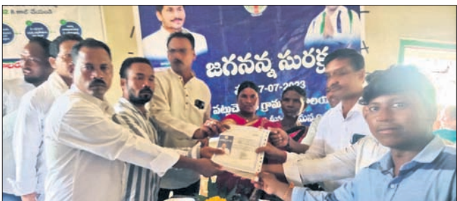
ଆନ୍ଧ୍ର ପକ୍ଷରୁ ଜଣେ ଗ୍ରାମବାସୀଙ୍କୁ ପ୍ରମାଣପତ୍ର ପ୍ରଦାନ କରାଯାଇଛି ।