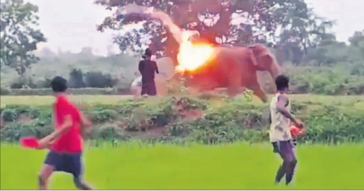
ମୟୂରଭଞ୍ଜ ଜିଲ୍ଲା କରାଞ୍ଜିଆ ବନଖଣ୍ଡ ଦୁଧିଆଣି ରେଖା ଅଞ୍ଚଳରେ ଜଣେ ଯୁବକ ମଶାଳ ନିଆଁରେ ହାତୀକୁ ପିରୁଛନ୍ତି। (ରିପୋର୍ଟ: ପୃଷ୍ଠା-୪)

ଅଭିନେତ୍ରୀ କ୍ୟାପ୍ଟିନା କୈଫ୍ଙ୍କ ସହ ତୁଳନା ହେବାରୁ ମୋ କ୍ୟାପ୍ଟିଭର ନଷ୍ଟ ହୋଇଗଲା ବୋଲି ନିକଟରେ ଏକ ସାକ୍ଷାତକାରରେ ଅଭିନେତ୍ରୀ ଜଣାଇ ଦେଇଛନ୍ତି।