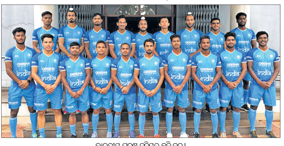
ଭାରତୀୟ ପୁରୁଷ କ୍ରିକେଟ ଦଳ।