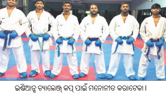
ଇଣ୍ଡିଆନ୍ ଟ୍ୟାଲେଣ୍ଟ୍ କର୍ପ୍ ପାଇଁ ମନୋନୀତ କରାଟେକା।