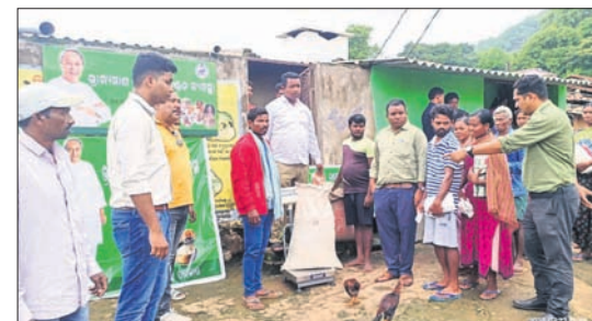
ଓଡ଼ିଶାର ପତାକା ବୃକ୍ଷ ପ୍ରଶାସନ ପକ୍ଷରୁ ଗ୍ରାମବାସୀଙ୍କୁ ଗରଜ ବଞ୍ଚନ କରାଯାଇଛି ।