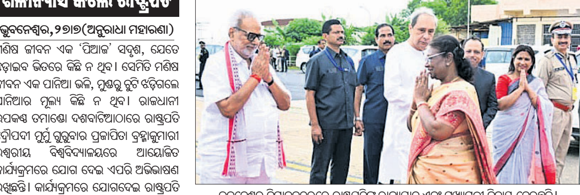
ଭୁବନେଶ୍ୱର ବିମାନବନ୍ଦରରେ ରାଷ୍ଟ୍ରପତିଙ୍କୁ ରାଜ୍ୟପାଳ ଏବଂ ମୁଖ୍ୟମନ୍ତ୍ରୀ ବିଦାୟ ଦେଉଛନ୍ତି।