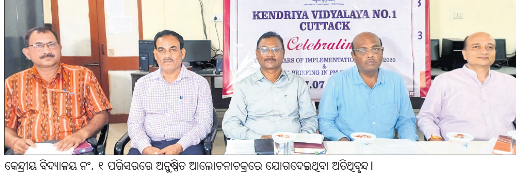
କେନ୍ଦ୍ରୀୟ ବିଦ୍ୟାଳୟ ନଂ. ୧ ପରିସରରେ ଅନୁଷ୍ଠିତ ଆଲୋଚନାଚକ୍ରରେ ଯୋଗଦେଇଥିବା ଅତିଥିଗୁଡ଼ିକ।