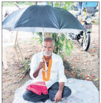
କୌଣସି ସୁବିଧା ପାଇ ନ ଥିବାରୁ ଗୋପ ପକ୍ଷରୁ ଆବାସ ଗୃହ ପାଇବା ଆଶାରେ ରୁକ୍ମ ଅନ୍ତର୍ଗତ ବାରିବେ ପଞ୍ଚାୟତ ଅଧୀନ ରିଡିମ୍ ଗ୍ରାମର କୃଷକମାନଙ୍କୁ ସାକ୍ଷୀଙ୍କ ଘର ଉପରେ ଦୂର୍ଭିକ୍ଷରେ ବିତର୍କ ଥର ଲାଗି ଚଳୁଛି ।

ଗୋପ ରୁକ୍ମ ପ୍ରଶାସନ ପ୍ରତିଷ୍ଠିତ ନ ରଖିବାରୁ ଆବାସ ଗୃହ ପାଇବା ଆଶାରେ ରୁକ୍ମ ଅନ୍ତର୍ଗତ ବାରିବେ ପଞ୍ଚାୟତ ଅଧୀନ ରିଡିମ୍ ଗ୍ରାମର କୃଷକମାନଙ୍କୁ ସାକ୍ଷୀଙ୍କ ଘର ଉପରେ ଦୂର୍ଭିକ୍ଷରେ ବିତର୍କ ଥର ଲାଗି ଚଳୁଛି । ଏହି ଅନଶନକୁ ନେଇ ଗୋପ ଥାନା ପକ୍ଷରୁ ପୋଲିସ୍ ଯୁକ୍ତମାନଙ୍କୁ ଯୋଗାଯୋଗ କରିଥିଲେ । ପ୍ରକାଶ ଯେ, ପରିବାରର ଦାବୀକୁ କୃଷକମାନଙ୍କୁ ହାତ ଦେବାକୁ କୋଣାର୍କ ପୋଲିସ୍ ୧୧୪/୨୩ରେ ଏକ ମାମଲା ଗଢ଼ି କରି ତଦନ୍ତ ଆରମ୍ଭ କରିଥିଲେ । ଗୋପ ଥାନାରେ ଆବାସ ଗୃହ ପାଇବା ଆଶାରେ ରୁକ୍ମ ଅନ୍ତର୍ଗତ ବାରିବେ ପଞ୍ଚାୟତ ଅଧୀନ ରିଡିମ୍ ଗ୍ରାମର କୃଷକମାନଙ୍କୁ ସାକ୍ଷୀଙ୍କ ଘର ଉପରେ ଦୂର୍ଭିକ୍ଷରେ ବିତର୍କ ଥର ଲାଗି ଚଳୁଛି । ଏହି ଅନଶନକୁ ନେଇ ଗୋପ ଥାନା ପକ୍ଷରୁ ପୋଲିସ୍ ଯୁକ୍ତମାନଙ୍କୁ ଯୋଗାଯୋଗ କରିଥିଲେ ।