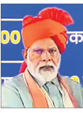
କଂଗ୍ରେସର 'ଲୁଚ୍ ବୋକାନ'ର ନୂଆ ସାମଗ୍ରୀ ବିଧାନସଭା ନିର୍ବାଚନ ହେବାକୁ