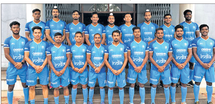
ଭାରତୀୟ ପୁରୁଷ କ୍ରୀଡ଼ା ଦଳ।