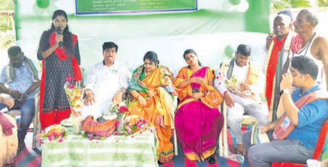
ବିହାରୀନା ବାଳିକା ଉଚ୍ଚ ବିଦ୍ୟାଳୟରେ ଆୟୋଜିତ ଶିଳାନ୍ୟାସ କାର୍ଯ୍ୟକ୍ରମରେ ମନ୍ତ୍ରୀ ରଣେନ୍ଦ୍ର ପ୍ରତାପ ସାହି ଓ ଅନ୍ୟମାନେ ।