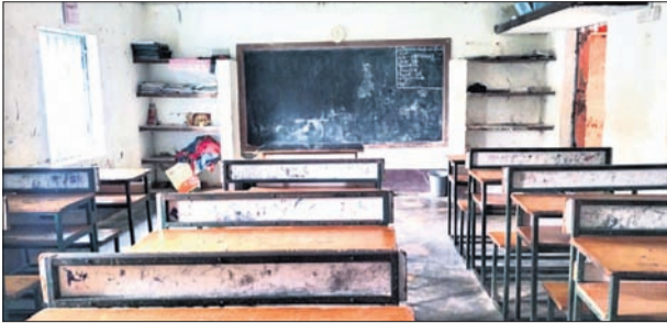
ସ୍କୁଲକୁ ପିଲାମାନେ ପଢ଼ିବାକୁ ଆସୁ ନ ଥିବାରୁ ଶିକ୍ଷକମାନେ କାର୍ଯ୍ୟାଳୟରେ ବସି ରହିଛନ୍ତି ।