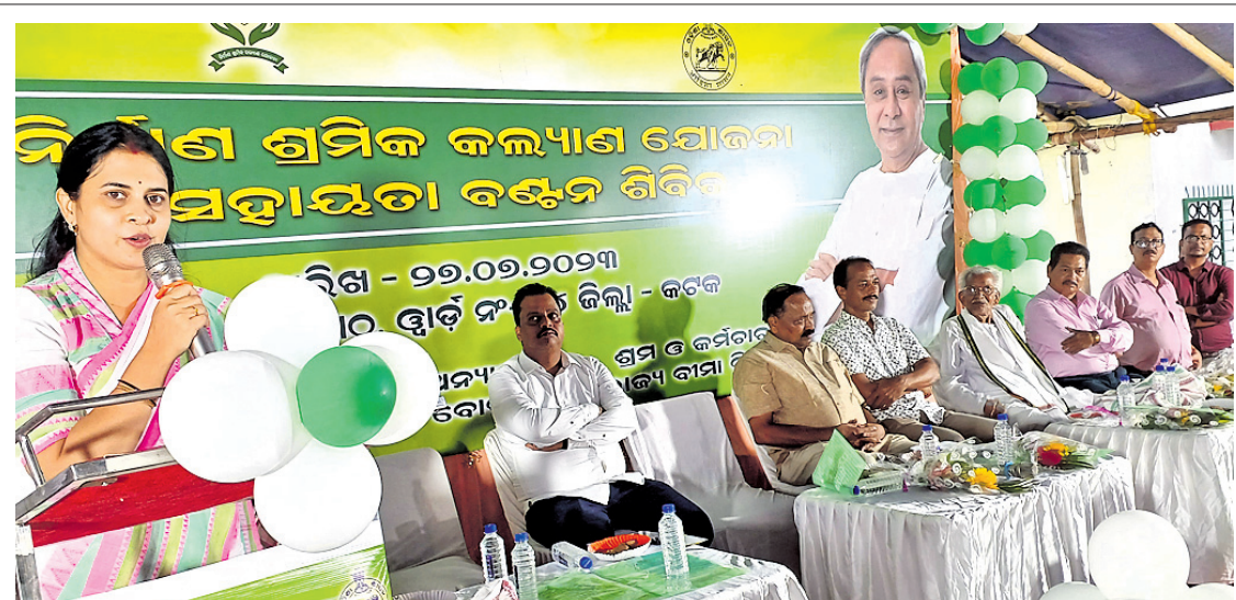
ସିଏମ୍‌ସି ଖାଡ଼ି ନମ୍ବର ୧୪ ଲାଲ୍ ମଠାରେ ଗୁରୁବାର ଅନୁଷ୍ଠିତ ନିର୍ମାଣ ଶ୍ରମିକ କଲ୍ୟାଣ ଯୋଜନା ସହାୟତା ବନ୍ଧନ ଶିବିରରେ ଉପସ୍ଥିତ ଅତିଥିଗୁଡ଼ିକ।