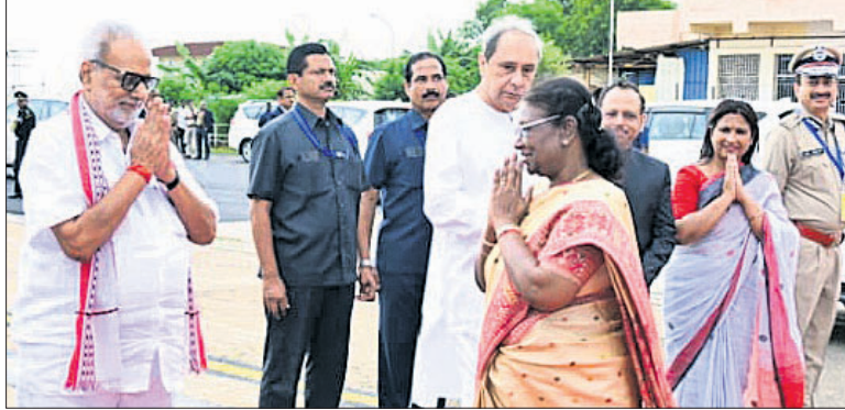
ଭୁବନେଶ୍ୱର ବିମାନବନ୍ଦରରେ ରାଷ୍ଟ୍ରପତିଙ୍କୁ ରାଜ୍ୟପାଳ ଏବଂ ମୁଖ୍ୟମନ୍ତ୍ରୀ ବିଦାୟ ଦେଉଛନ୍ତି।