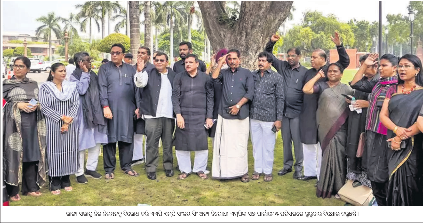
ରାଜ୍ୟ ସଭାକୁ ନିଜ ନିର୍ବାଚନ ବିରୋଧ କରି ଏପିଏ ଏମ୍ପି ସଂଜ୍ଞା ଦେଇଥିବା ଅଧ୍ୟକ୍ଷ ବିରୋଧୀ ଏମ୍ପିଙ୍କ ସହ ପାଇଲୋଟ ପରିସରରେ ରୁକୁଣାର ବିଶେଷ କରୁଛନ୍ତି।