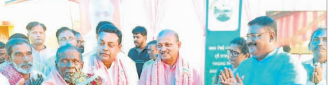
କିଶାନ ଯୋଜନା ଉଦ୍‌ଘାଟିତ ହେବା ପରେ ସମାବେଶରେ ଅତିଥିମାନେ।

ପୁରୀ ଜିଲ୍ଲାରେ କୃଷକଙ୍କ ସଶକ୍ତୀକରଣ ପାଇଁ ବିଭିନ୍ନ କ୍ରମରେ ପ୍ରୟାସ କରାଯାଉଛି। କର୍ମୀମାନଙ୍କୁ ତାହାର ସମୀପ ସମ୍ପର୍କ ରଖିବାକୁ ଆହ୍ୱାନ କରାଯାଇଛି।