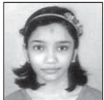
ଅନ୍ୱେଷା ଅନୌଷା ପରିବାରବର୍ଗ

ପରାବଦନ: ଏହି ସ୍ତମ୍ଭଟି କେବଳ ଭୁବନେଶ୍ୱର, ଧାରତ୍ରୀ, ବି-୨୬, ଉତ୍କଳରତ୍ନ ଶିଳ୍ପାଳୟ, ଭୁବନେଶ୍ୱର-୭୫୦୦୧୦ରେ ପଢ଼ାଯିବାର ସୁଯୋଗ ଅଟେ।