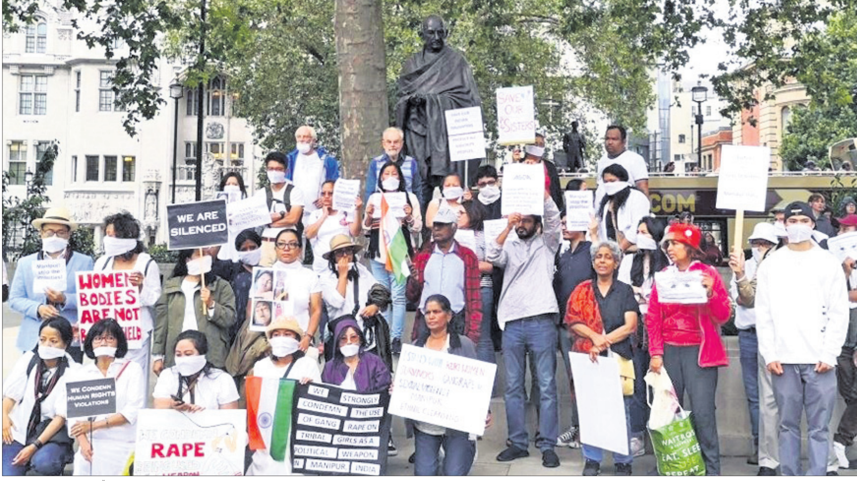
ଲଣ୍ଡନରେ ନୀରବ ବିକ୍ଷୋଭ