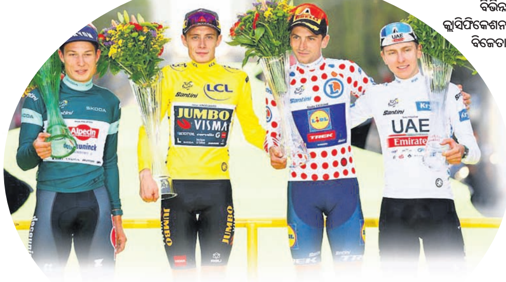
ବିଜିତ କ୍ଲ୍ୟାସିଫିକେଶନ ବିଜେତା