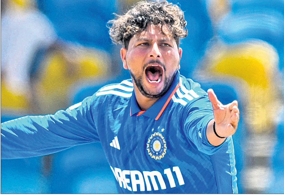
ପ୍ଲେୟର ଅଫ୍ ଦି ମ୍ୟାଚ କୁଲଦୀପ ଯାଦବ।

ବାର୍ଦ୍ଧମା, ୨୭/୭ ବାର୍ଦ୍ଧମାରେ କେନ୍ଦ୍ରୀୟ ପ୍ରଥମ ଅନ୍ତର୍ଜାତୀୟ ଦିନିକିଆ କ୍ରିକେଟ ମ୍ୟାଚକୁ ୫ ଉତ୍ତରକୋଚରେ ଜିତି ନେଇଛି ଭାରତ। କୁଲଦୀପ ଯାଦବ ଓ ରବୀନ୍ଦ୍ର ଜାଡେଜାଙ୍କ ଘାତକ ବୋଲିଂ ବଳରେ ଖେଳାଳିଙ୍କ ମାତ୍ର ୧୧୪ ରନ୍ରେ ଅଲଆଉଟ ହୋଇଥିଲା। କଟାକରେ ୨୨.୫ ଓଭରରେ ଜଣାଣ କିଶନଙ୍କ ଅର୍ଦ୍ଧଶତକ ବଳରେ ଭାରତ ୫ ଉତ୍ତରକୋଚ ବିନମୟରେ ବିଜୟ ଲକ୍ଷ୍ୟ ହାସଲ କରି ନେଇଥିଲା। ମହମ୍ମଦ ପ୍ରଥମ ଦିନିକିଆ