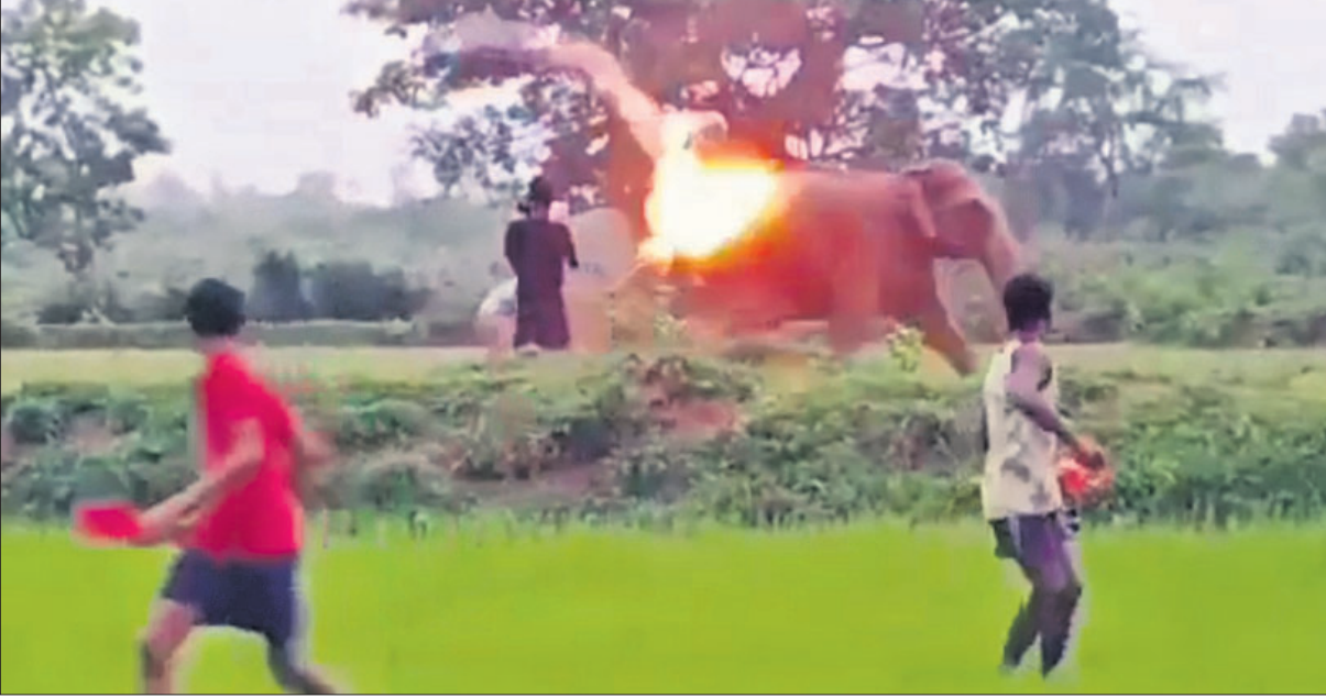
ମୟୂରଭଞ୍ଜ ଜିଲ୍ଲା କରଖିଆ ବନଖଣ୍ଡ ଦୁଧିଆଣି ରେଖା ଅଞ୍ଚଳରେ ଜଣେ ଯୁବକ ମଶାଳ ନିଆଁରେ ହାତୀକୁ ପିଟୁଛନ୍ତି।