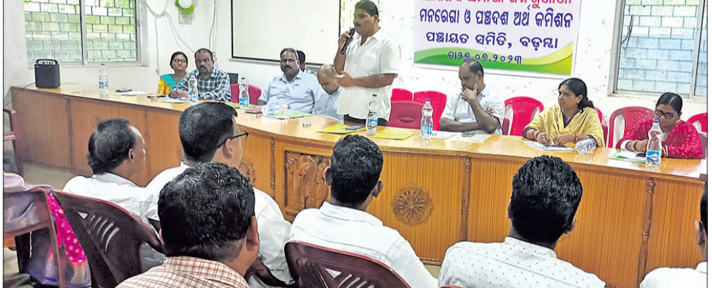
ରୁକ୍ମସୁରାୟ ସାମାଜିକ ସମାଜ୍ୟ ଜନଶୁଣାଣୀରେ ଉପସ୍ଥିତ ଜନପ୍ରତିନିଧି ଓ ପ୍ରଶାସନିକ ଅଧିକାରୀମାନେ ।