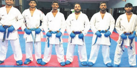
ଇଣ୍ଡିଆନ୍ ଟ୍ୟାଲେଣ୍ଟ କର୍ପ ପାଇଁ ମନୋନୀତ କରାଟେକା।

ଭୁବନେଶ୍ୱର, ୨୭/୭ (ତପନ ସାହୁ) ଚଳିତ ମାସ ୨୯ ଓ ୩୦ ତାରିଖ ଦୁଇଦିନଧରି କୋଲକାତାରେ ନେତାଜୀ ଇନ୍ଡୋର ଷ୍ଟାଡ଼ିୟମରେ ୬ମ 'ଇଣ୍ଡିଆନ୍ ଟ୍ୟାଲେଣ୍ଟ ଇଣ୍ଡିଆନ୍ ଟ୍ୟାଲେଣ୍ଟ କର୍ପ' ଅନ୍ତର୍ଜାତୀୟ କରାଟେ