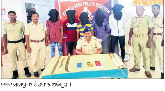
ଜବତ ସାମଗ୍ରୀ ଓ ଗିରଫ ୫ ଅଭିଯୁକ୍ତ ।