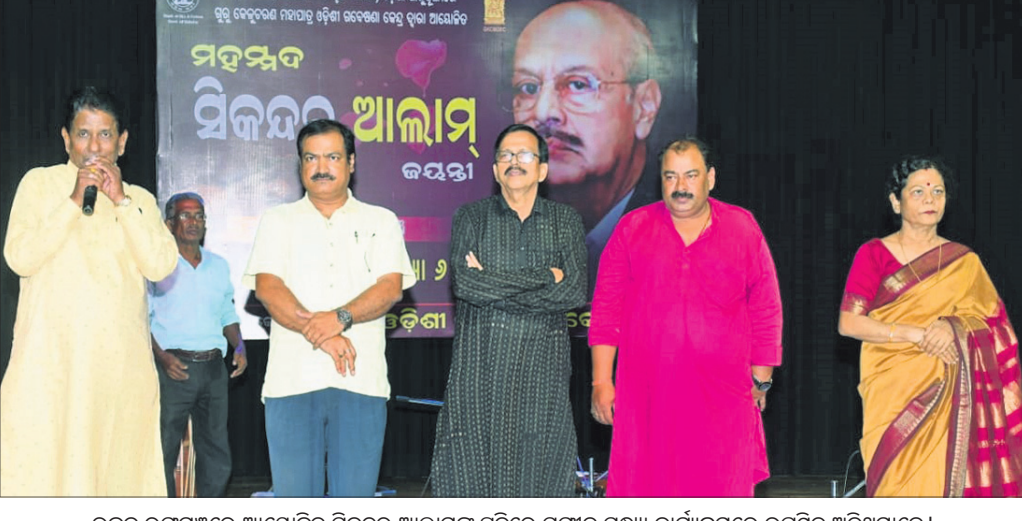
ଭୁବନେଶ୍ୱରରେ ଆୟୋଜିତ ଶିକ୍ଷଣ ଆରମ୍ଭରେ ଅଧିକାରୀଙ୍କ ସମେତ ଉପସ୍ଥିତ ଅତିଥିମାନେ।

କରାଯାଇଛି। ସେମାନଙ୍କ ବିରୋଧରେ ଦୃଢ଼ କାର୍ଯ୍ୟାନୁଷ୍ଠାନ ନେବା ପାଇଁ କୋର୍ଟରେ ସମିତିର ସମ୍ପର୍କିତ ମହାପାତ୍ରଙ୍କ ଠରଫଳୁ ନିଆଯାଇଛି।