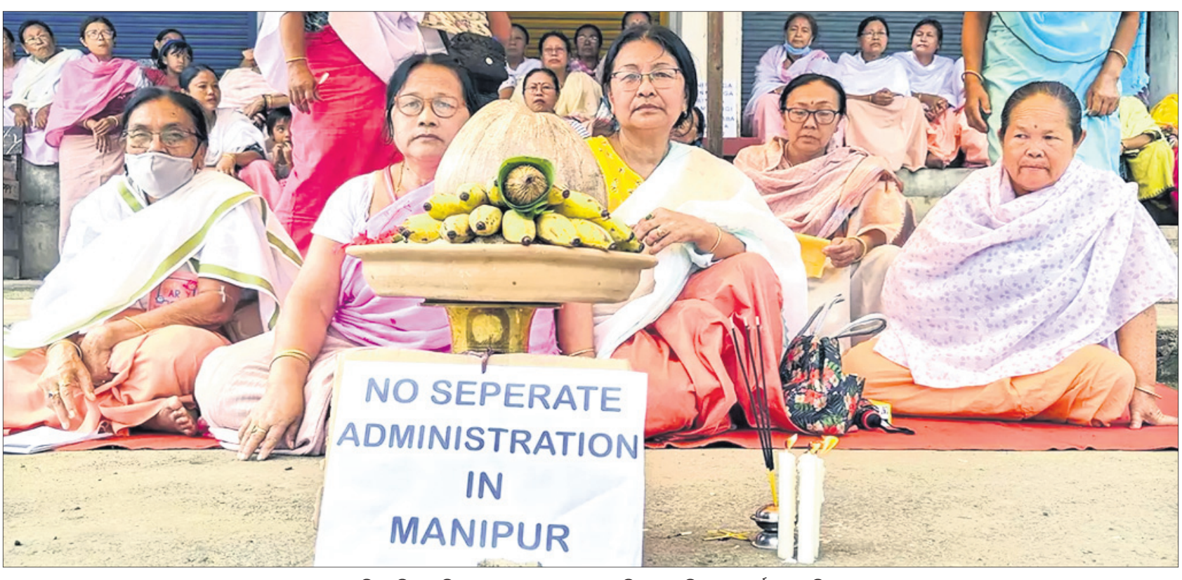
ମଣିପୁର ହିଂସା ପ୍ରତିବାଦରେ ଗୁରୁବାର ଇମ୍ଫାଲରେ ମହିଳାମାନେ ବିକ୍ଷୋଭ ପ୍ରଦର୍ଶନ କରୁଛନ୍ତି ।

ଶ୍ରୀନଗର, ୨୭ତମ : ଜନ୍ମ-ଜନ୍ମାଗର ଶ୍ରୀନଗରରେ ୩ର୍ଥ ୩ ଦଶନ୍ଧିରୁ ଉର୍ଦ୍ଧ୍ୱ ବର୍ଷ ପରେ ଶିୟା ସମ୍ପ୍ରଦାୟ ପକ୍ଷରୁ ଗୁରୁବାର ମହରମ ଶୋଭାଯାତ୍ରା ବାହାର କରାଯାଇଛି । କଡ଼ା ସୁରକ୍ଷା ମଧ୍ୟରେ ଆୟୋଜିତ ଶୋଭାଯାତ୍ରାରେ ହଜାର ହଜାର ଲୋକ ସାମିଲ ହୋଇଛନ୍ତି । ଲାଲ୍‌ଗୌଳ ଅଞ୍ଚଳ ଦେଇ ଏହା ଅତିକ୍ରମ କରିବା ସମ୍ଭାଳ ୬୦୮ ମଧ୍ୟରେ ଶୋଭାଯାତ୍ରା ବାହାର କରିବା ଲାଗି ପ୍ରଶାସନ ବ୍ୟବସ୍ଥା ଅନୁମତି ଦେଇଥିଲା । ଆତଙ୍କବାଦ ଯୋଗୁ ୮ର୍ଥବର୍ଷ ହେଲା ଶୋଭାଯାତ୍ରା ବାହାରି ପାରୁ ନ ଥିଲା । ଏବେ ସ୍ଥିତିରେ ଉକ୍ତ ଆସିଥିବାରୁ ମହରମର ଅଷ୍ଟମ ଦିନରେ ଶୋଭାଯାତ୍ରା ପାଇଁ ଅନୁମତି ମିଳିଛି ।