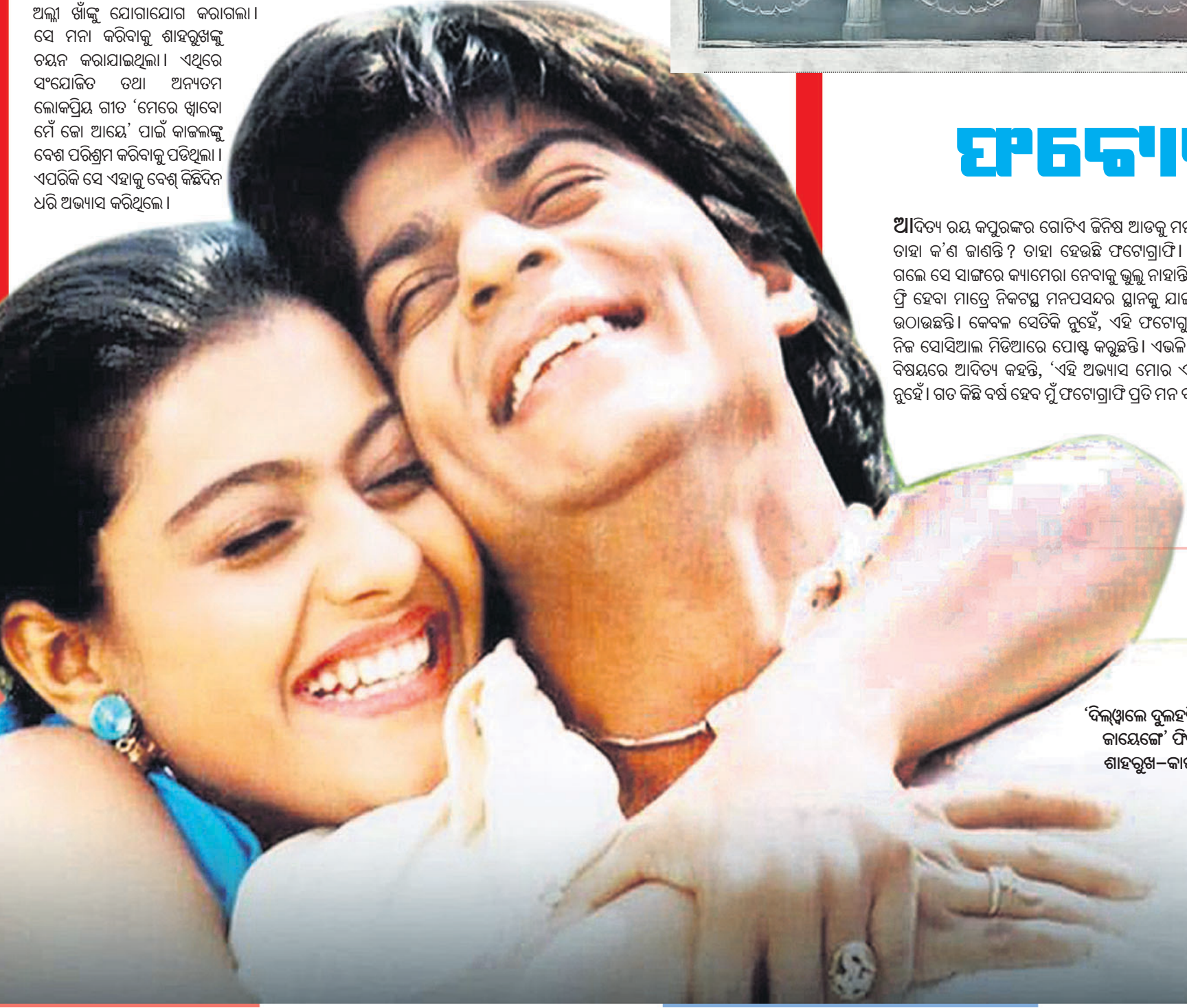
'ଦିଲ୍‌ଘାଲେ ଦୁଲହନିୟାଁ ଲେ କାୟେଜେ' ଫିଲ୍ମରେ ଶାହରୁଖ-କାଜଲ ।

ଅବା ଶର୍ମା ପ୍ରତିଦିନ ସକାଳୁ ଗୋଟିଏ କଥା କରିବାକୁ ଆସିବେ ଭୁଲି ନାହିଁ । ତାହା ହେଉଛି ବିଛଣା ଛାଡି ନିତ୍ୟକର୍ମ ଶେଷ କରିବା ପରେ ଅଳ୍ପ ଲୁଣିମିଶ୍ରିତ ପାଣି ପିଇ ସେ ବସି ଯାଆନ୍ତି ମେଡିଟେସନ୍ କରିବାକୁ । ନିଜକୁ କିପରି ଫିଟ୍ ଆଣି ପାଇଁ ରଖିପାରିବେ ସେ ନେଇ ଅବା ବେଶ୍ ସଚେତନ । ଏ ନେଇ ସେ କହନ୍ତି, 'ପ୍ରତିଦିନ ସକାଳୁ ମୁଁ ଯେମିତି ହେଲେ ମେଡିଟେସନ୍ କରେ । ଏହା ମୋ ପାଇଁ ଉପକାରୀ ସାବ୍ୟସ୍ତ ହୋଇଛି । ତା' ସହ ଖାଦ୍ୟପେୟ ପ୍ରତି ମଧ୍ୟ ସତର୍କ ରହେ ।' ଚର୍ଚ୍ଚିତ 'ଦ କେରଳା ଷ୍ଟୋରି' ଫିଲ୍ମରେ ନିଖୁଣ ଅଭିନୟ କରି ସେ ଚର୍ଚ୍ଚାକୁ ଆସିଥିଲେ । ଅଭିନୟ ବ୍ୟତୀତ ସେ ଜଣେ କଥକ ଡ୍ୟାନ୍ସର । କେବଳ ସେତିକି ନୁହେଁ, ମାର୍ଗଲ ଆର୍ଟରେ ମଧ୍ୟ ସେ ବେଶ୍ ସିକ୍ସସ୍ଟ୍ରା । ଅଦାକ୍ ଅଭିନୀତ ଆଗାମୀ ଫିଲ୍ମଟିର ଟାଇଟଲ୍ ହେଉଛି 'ଦ ଗେମ୍ ଅଫ ରିଭର୍ସ' । ଏଥିରେ ତାଙ୍କ ଅପୋଜିଟରେ ଅଛନ୍ତି ଶ୍ରେୟସ୍ ତଲପାଡେ ।