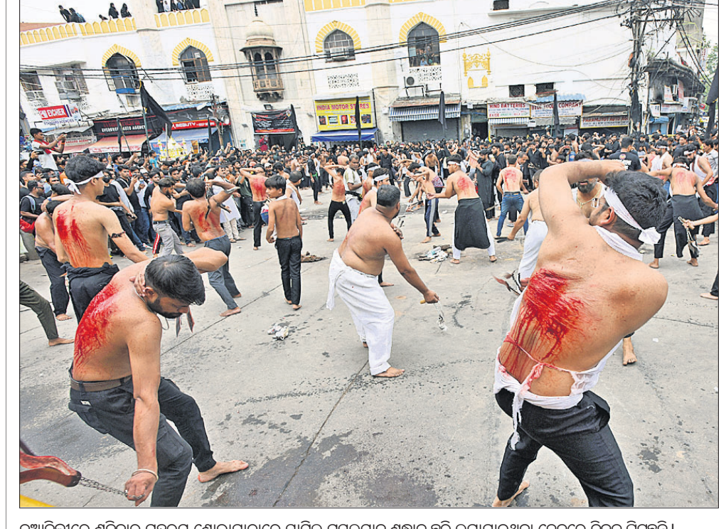
ନୂଆଦିଲ୍ଲୀରେ ଶନିବାର ମହରମ ଶୋଭାଯାତ୍ରାରେ ସାମିଲ ମୁସଲମାନ ଶ୍ରଦ୍ଧାଳୁଙ୍କୁ ହୁରି ଲଗାଯାଇଥିବା ଚେନ୍ଦରେ ନିଜକୁ ପିଟୁଛନ୍ତି।