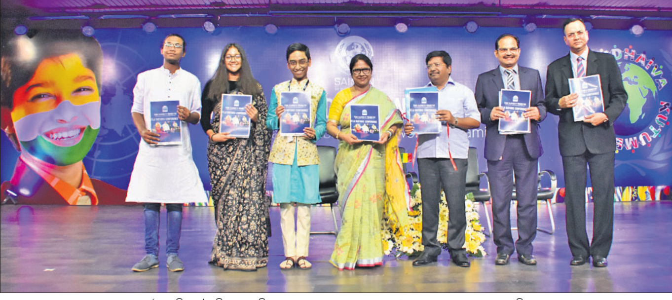
'ସାଇ ଟ୍ରିବ୍ୟୁନ୍' ପୁସ୍ତିକାକୁ ଉଦ୍ଘୋଷଣା ମନ୍ତ୍ରୀ ଅତରୁ ସଦ୍ୟସାଗୀ ନାୟକ ଓ ଅନ୍ୟମାନେ ଉଦ୍ଘୋଷଣା କରୁଛନ୍ତି।