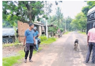
ସନ୍ଦେହୀ କୁହୁର ସହାୟତାରେ ପୋଲିସ୍ ଘଟଣାର ତଦନ୍ତ କରୁଛି।