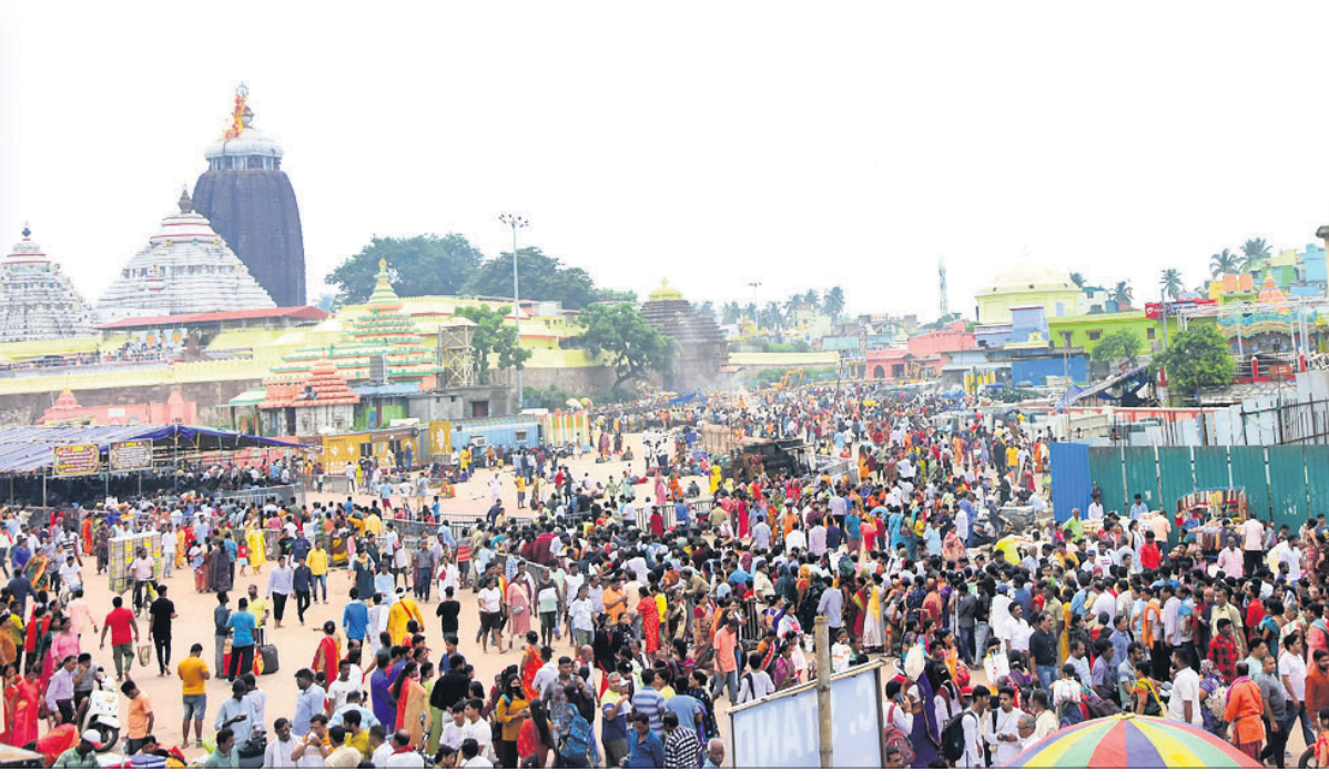
ଶୟନ ଏକାଦଶୀ ଅବସରରେ ଶନିବାର ମହାପ୍ରଭୁଙ୍କ ଦର୍ଶନ ପାଇଁ ଶ୍ରୀମନ୍ଦିର ସମ୍ମୁଖରେ ଶ୍ରଦ୍ଧାଳୁଙ୍କ ଭିଡ଼ ।