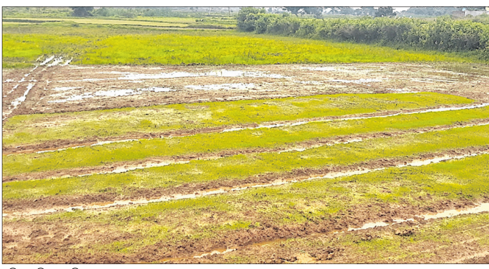
ପଡ଼ିଆ ପଡ଼ିଆ କମି ।

ଭୁବନେଶ୍ୱର ନିଅଣ୍ଟିଆ ରହିଲା, ମୌସୁମୀ ବର୍ଷା ଯେତିକି ହେବା କଥା ସେତିକି ହେଲାନାହିଁ। ସାତାଦିକଠାରୁ ପ୍ରାୟ ୩୦ ପ୍ରତିଶତ କମ୍ ବର୍ଷା ହୋଇଥିଲା। ବର୍ଷା ଅଭାବରୁ ଜମି ଶୁଖିଲା ପଡ଼ିଲା। ନିଅଣ୍ଟିଆ ବର୍ଷା ଯୋଗୁ ଜିଲ୍ଲାରେ ଗାଈକାର୍ଯ୍ୟ ବାଧାପ୍ରାପ୍ତ ହୋଇଛି। ଜିଲ୍ଲାରେ ମଧ୍ୟ ସମାନ ସ୍ଥିତି ଆବଶ୍ୟକ ବର୍ଷା ଅଭାବରୁ ଗାଈ ମୁଣ୍ଡରେ ହାତ ଦେଇ ବସିଛି। ଗୋଟିଏପଟେ ପ୍ରାକୃତିକ ବିପର୍ଯ୍ୟୟ ଗାଈର ପିଛା ଛାଡ଼ି ନ ଥିବାବେଳେ ନିଅଣ୍ଟିଆ ବର୍ଷା ଯୋଗୁ ଗାଈମାନେ ମେରୁଦେଶ ଦୋହଳିଗଲାଣି। ବିଳମ୍ବିତ ମୌସୁମୀ ଯୋଗୁ ୨୦ ପ୍ରତିଶତ ନିଅଣ୍ଟିଆ ବର୍ଷାରେ ଭୁବ୍ ସରିଲା। ଜିଲ୍ଲାରେ ଭଲ ବର୍ଷା ହେବା ନେଇ ପାଣିପାଗ ବିଭାଗ ଅନୁମାନ କରିଥିବାବେଳେ ସାତାଦିକଠାରୁ କମ୍ ବର୍ଷା ଗାଈଙ୍କ ଚିନ୍ତା ବଢ଼ାଇଛି। ଜିଲ୍ଲା ସୂକ୍ଷ୍ମ ୩୦୪ ମିମି ବର୍ଷା ହେବାର ରେକର୍ଡ ଲାଭ୍ୟ। ରହିଥିବାବେଳେ ୨୫ ଚାରିଶ ପୁଞ୍ଜା ୨୪୦ ମିମି ବର୍ଷା ହୋଇଥିବା ଜଣାପଡ଼ିଛି। ଜିଲ୍ଲା ଶେଷହେବାକୁ ଆସୁଥିବାବେଳେ ୨୨ ପ୍ରତିଶତ କମ୍ ରହିଛି। ପାଣିପାଗ ଅନୁମାନ ଗାଈଙ୍କୁ ପାଇଁ ଆଶ୍ୱସ୍ତି ଆଣିଥିବା ବେଳେ ଜିଲ୍ଲାରେ ନିଅଣ୍ଟିଆ ବର୍ଷା ଗାଈଙ୍କ ସମସ୍ୟାକୁ ଦୃଷ୍ଟିକୋଣ କରିଛି। ଭୁବ୍ ବୋଲି ଗାଈ ଆଶା କରିଥିଲେ। ତେବେ ଗାଈଙ୍କ ସବୁ ଆଶା ଫସର ଫାଟିଗଲା। ଆଗକୁ ବର୍ଷା ସାତାଦିକ ନ ହେଲେ ଗାଈକାର୍ଯ୍ୟ ବାଧାପ୍ରାପ୍ତ ହେବା ଆଶଙ୍କା ସୃଷ୍ଟି ହୋଇଛି। ରାଜ୍ୟରେ ଏବେ ନିଅଣ୍ଟିଆ ବର୍ଷା ଲାଗି ରହିଛି। ଜିଲ୍ଲା ପ୍ରଥମ ଓ