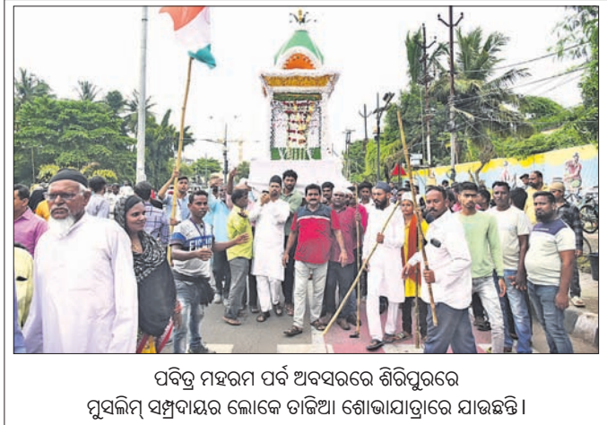
ପବିତ୍ର ମହରମ ପର୍ବ ଅବସରରେ ଶିରିପୁରରେ ମୁସଲିମ୍ ସମ୍ପ୍ରଦାୟର ଲୋକେ ତାଜିଆ ଶୋଭାଯାତ୍ରାରେ ଯାଉଛନ୍ତି।

ଭୋଗଦଖଲକାରୀମାନେ ପୂର୍ବକ ଭାବେ ଖଜଣା ପଠଠ କରି ରହିବୁ କାରୁଥିଲେ। ହେଲେ ଏବେ ତାହା ସମ୍ଭବ ହେଉନାହିଁ। ସେହି ଖାତା ଅନ୍ତର୍ଗତ କୌଣସି ନିଜ ଖଜଣା ପୂର୍ବକ ଭାବେ ଦେବାକୁ ଚାହଁଲେ ଦେଇପାରୁନାହାନ୍ତି। ଆଂଶିକ ଖଜଣା ଦେବା ନିମନ୍ତେ ଅନୁଲାଇନ୍‌ରେ କୌଣସି ବ୍ୟବସ୍ଥା ନାହିଁ। ପୁରୀ ଖାତାର ଖଜଣା ଦେବାକୁ ପଦ୍ଧତିକୁ ପ୍ରତ୍ୟେକ ଅଂଶଦାନ ଭୋଗଦଖଲକାରୀ ଏଥିପାଇଁ ଅମଙ୍ଗ ହେଉଛନ୍ତି। ଆଂଶିକ ଦେଇ ଦାଖଲ ନିମନ୍ତେ ସାତଭଉଣୀ ଆରୁଆଇ ଓ ଭଦ୍ରକ ତହସିଲଦାରଙ୍କୁ ଆବେଦନକାରୀ ଅନୁରୋଧ କରିଥିଲେ ମଧ୍ୟ ସେ ଏ ଦିଗରେ ନିଜର ଅକ୍ଷମତା ପ୍ରକାଶ କରିଛନ୍ତି। ଏଭଳି ଦୁର୍ଦ୍ଦିନୀତ୍ୟ ବ୍ୟବସ୍ଥା ଦ୍ୱାରା ଖଜଣା ଆଦାୟ ହୋଇ ନ ପାରି ରାଜ୍ୟ ସରକାରଙ୍କର ବହୁ ପରିମାଣର ରାଜସ୍ୱ ହାନି ହେଉଛି। ତେଣୁ ସରକାର ଏ ଦିଗରେ ଦୃଷ୍ଟି ଦେଇ ପଦକ୍ଷେପ ନେବାକୁ ଆବେଦନକାରୀ ଦାବି କରିଛନ୍ତି।