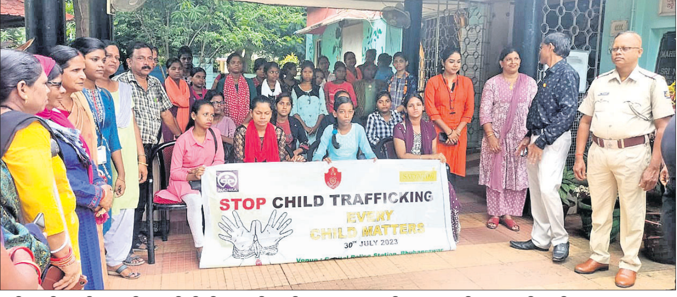
କ୍ୟାପିଟାଲ ହରିଶୟନ ପରିସରରେ ଶନିବାର ଅନୁଷ୍ଠିତ ବିଶ୍ଵ ଶିଶୁ ଚାଲାଣ ନିରୋଧ ଦିବସ ପାଳନ ଅବସରରେ ଶିଶୁଙ୍କ ଗହଣରେ କମିଶନରଟ ପୋଲିସର ବରିଷ୍ଠ ଅଧିକାରୀ ଓ ଅନ୍ୟମାନେ।

ଶ୍ରୀବତ୍ସ ମାସ ମଳ ଶୁକ୍ଳପକ୍ଷ ଏକାଦଶୀ ଅବସରରେ ଶନିବାର ଶ୍ରୀମନ୍ଦିରରେ ହରିଶୟନ ଏକାଦଶୀ ନୀତି ସମ୍ପନ୍ନ ହୋଇଛି। ପୌରାଣିକ କଥା ଅନୁଯାୟୀ, ଏହି ଦିନଠାରୁ ଦୀର୍ଘ ୪ ମାସ ପର୍ଯ୍ୟନ୍ତ ମହାପ୍ରଭୁ ଶୟନ କରିଥାନ୍ତି। ସେହିପରି ମହାପ୍ରଭୁଙ୍କ ଶୟନ କାଳ ମଣିଷଙ୍କ ପାଇଁ ଅଶୁଭ କାଳ ଭାବେ ଗ୍ରହଣ କରାଯାଏ। ଏହି ସମୟରେ କୋଟିକ୍ଷ ଶାସ୍ତ୍ରମତେ ପୂର୍ବକ ଦକ୍ଷିଣାୟନ ଯୋଗୁ କୌଣସି ଶୁଭକାର୍ଯ୍ୟ କରାଯାଏନାହିଁ। ତେଣୁ ବିବାହ, ବ୍ରତଘର ଆଦି କାର୍ଯ୍ୟ ଏହି ୪ମାସ ପର୍ଯ୍ୟନ୍ତ ହୋଇ ନ ଥାଏ। କାର୍ତ୍ତିକ ମାସ ଏକାଦଶୀ ପରେ ଠାକୁର ଶୟନରୁ ଉଠିଲେ ଶୁଭ କାର୍ଯ୍ୟ କରାଯାଇଥାଏ। ଆଷାଢ଼ ମାସ ଶୁକ୍ଳପକ୍ଷ ଏକାଦଶୀ ଅବସରରେ ରଥ ଉପରେ ଠାକୁର ଥିବା ସମୟରେ ହରିଶୟନ ଏକାଦଶୀ ନୀତି ସମ୍ପନ୍ନ ହୋଇଥାଏ। ଚଳିତ ବର୍ଷ ଯୋଡ଼ା ଶ୍ରୀବତ୍ସ ପଦ୍ମପୁରୀ ପରମ୍ପରା ଅନୁଯାୟୀ ଆଷାଢ଼ରେ ହରିଶୟନ ଏକାଦଶୀ ନୀତି ନ ହୋଇ ଶ୍ରୀବତ୍ସ ମଳ ଶୁକ୍ଳ ଏକାଦଶୀରେ ଶ୍ରୀମନ୍ଦିରରେ ମହାପ୍ରଭୁଙ୍କ ହରିଶୟନ ଏକାଦଶୀ ନୀତି ପାଳନ ହୋଇଛି।