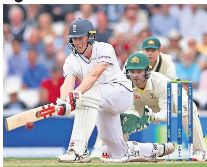
ପୁଲ୍‌ସ୍ ଶର୍ ଖେଳୁଛନ୍ତି କ୍ୟାକ୍ କ୍ରୁଲି।