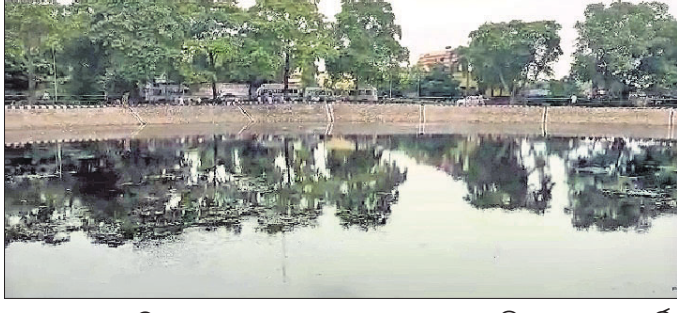
ପାଣିରେ ବୁଡ଼ିଗଲା ପାଉଁଶ୍ଵେନ

ବାରଙ୍ଗ, ୨୯।୭(ଲିଙ୍ଗରାଜ ରାଉତ): ଲଗାଯାଇଥିଲା। କିନ୍ତୁ ବହୁତଳ ପାର୍ଟି ନନ୍ଦନକାନନକୁ ବିଶ୍ଵସ୍ତରାୟ କରିବାକୁ ଉଦ୍ୟମ ଆରମ୍ଭ ହୋଇଛି। ଏଥିନିମନ୍ତେ କେନ୍ଦ୍ର ଓ ରାଜ୍ୟ ସରକାରଙ୍କ ପକ୍ଷରୁ ଆହୁତ୍ଵା ଅନୁଦାନ ନନ୍ଦନକାନନ ବିକାଶ ପାଇଁ ଖର୍ଚ୍ଚ କରାଯାଉଛି। ତେବେ ହେଉଥିବା କାମକୁ ଠିକ ଭାବେ ତଦାରଖ କରା ଯିବାରୁ ନନ୍ଦନକାନନକୁ ବହୁ ସମୟରେ ବଦନାମ ହେବାକୁ ପଡ଼ିଛି। ଏହାର ଏକ ଉଦାହରଣ ନନ୍ଦନକାନନ ପକ୍ଷରୁ ଚତୁର୍ଥପାର୍ଶ୍ଵରେ ହୋଇଥିବା ଘାସଗାଳିତା କରାଯାଇଥିବା ବହୁତଳ ପାର୍ଟି ସ୍ଥଳରେ ଦେଖିବାକୁ ମିଳିଛି। ପ୍ରକାଶ ଯେ, ବହୁତଳ ପାର୍ଟି ସ୍ଥଳରେ ଏକ ପୁଷ୍ପିରୀ କରାଯାଇ ସେଥିରେ ପାଉଁଶ୍ଵେନ ବ୍ୟବସ୍ଥା ହୋଇଥିଲା। ଏଥିନିମନ୍ତେ ଜଣେ ଅଧିକାରୀଙ୍କ ତତ୍ଵାବଧାନରେ ଠିକାଦାର ତୟନ କରାଯାଇ ୨୬ଲକ୍ଷ ଟଙ୍କା ବ୍ୟୟ ବଦାବରେ ନୂଆ ପାଉଁଶ୍ଵେନ