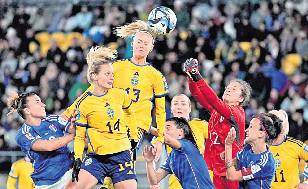
ଫୁଲ୍‌ଫୁଲ୍‌ରେ ଇଟାଲୀ ମଧ୍ୟରେ ଅନୁଷ୍ଠିତ ମ୍ୟାଚ୍‌ର ଏକ ଉଲ୍ଲେଖନୀୟ ପୂର୍ଣ୍ଣ ପୃଷ୍ଠା।

ଫ୍ରାନ୍ସ ଏହି ମ୍ୟାଚ୍‌ରେ ବିଜୟ ଲାଭ କରିବା ଦ୍ୱାରା ୨ଟି ମ୍ୟାଚ୍‌ରୁ ୪ପଏଣ୍ଟ୍ ହାସଲ କରି ଗ୍ରୁପ୍ ଖ୍ୟାତିରେ ପ୍ରଥମ ସ୍ଥାନରେ ରହିଛି। ଜାମାଇକା ପ୍ରଥମ ସ୍ଥାନରେ ରହିଛି। ଜାମାଇକା ପ୍ରଥମ ସ୍ଥାନରେ ରହିଛି। ଜାମାଇକା ପ୍ରଥମ ସ୍ଥାନରେ ରହିଛି।