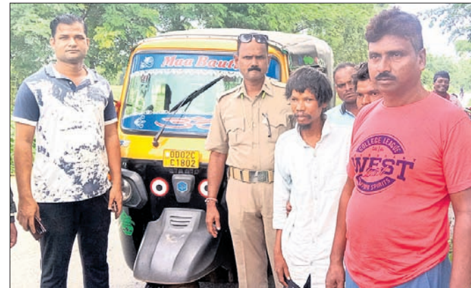
ସୂର୍ଯ୍ୟକାନ୍ତକୁ ପରିବାର ଲୋକେ ନେବାବେଳେ ପୋଲିସ୍, ସରପଞ୍ଚ ଏବଂ ଗ୍ରାମବାସୀ ଉପସ୍ଥିତ।

ପାର୍କରେ ଗୋଟିଏ ଲେଖାଏ ପ୍ରବେଶ ଓ ପ୍ରସ୍ଥାନ ରହିବ। ଆଗୋପ୍ରମୋଦ ବ୍ୟବସ୍ଥା ସହ ସ୍ୱାଧୀନତା ସଂଗ୍ରାମୀଙ୍କ ପ୍ରତିମୂର୍ତ୍ତି ରଖାଯିବାର ଯୋଜନା ରହିଛି।