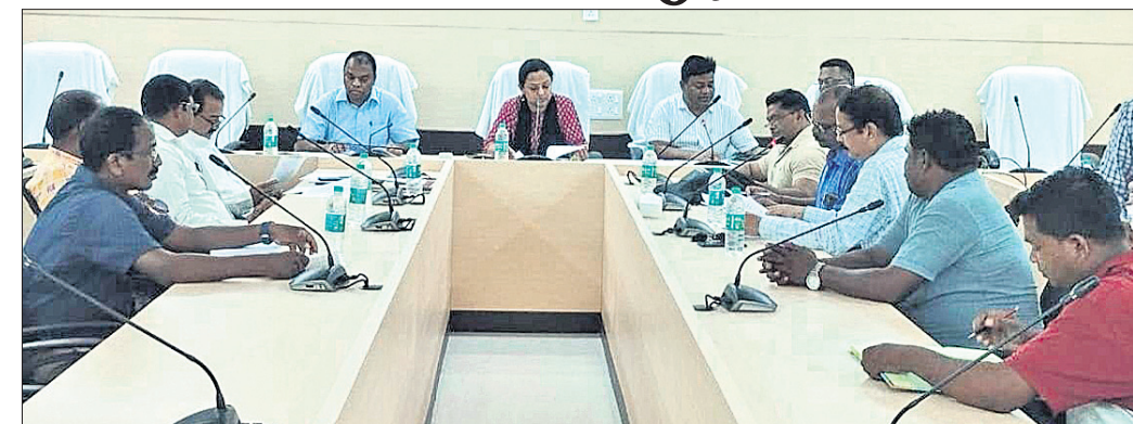
ସାଧାରଣ ନିର୍ବାଚନକୁ ନେଇ ସର୍ବଦଳାୟ ଚୈତ୍ତ ।