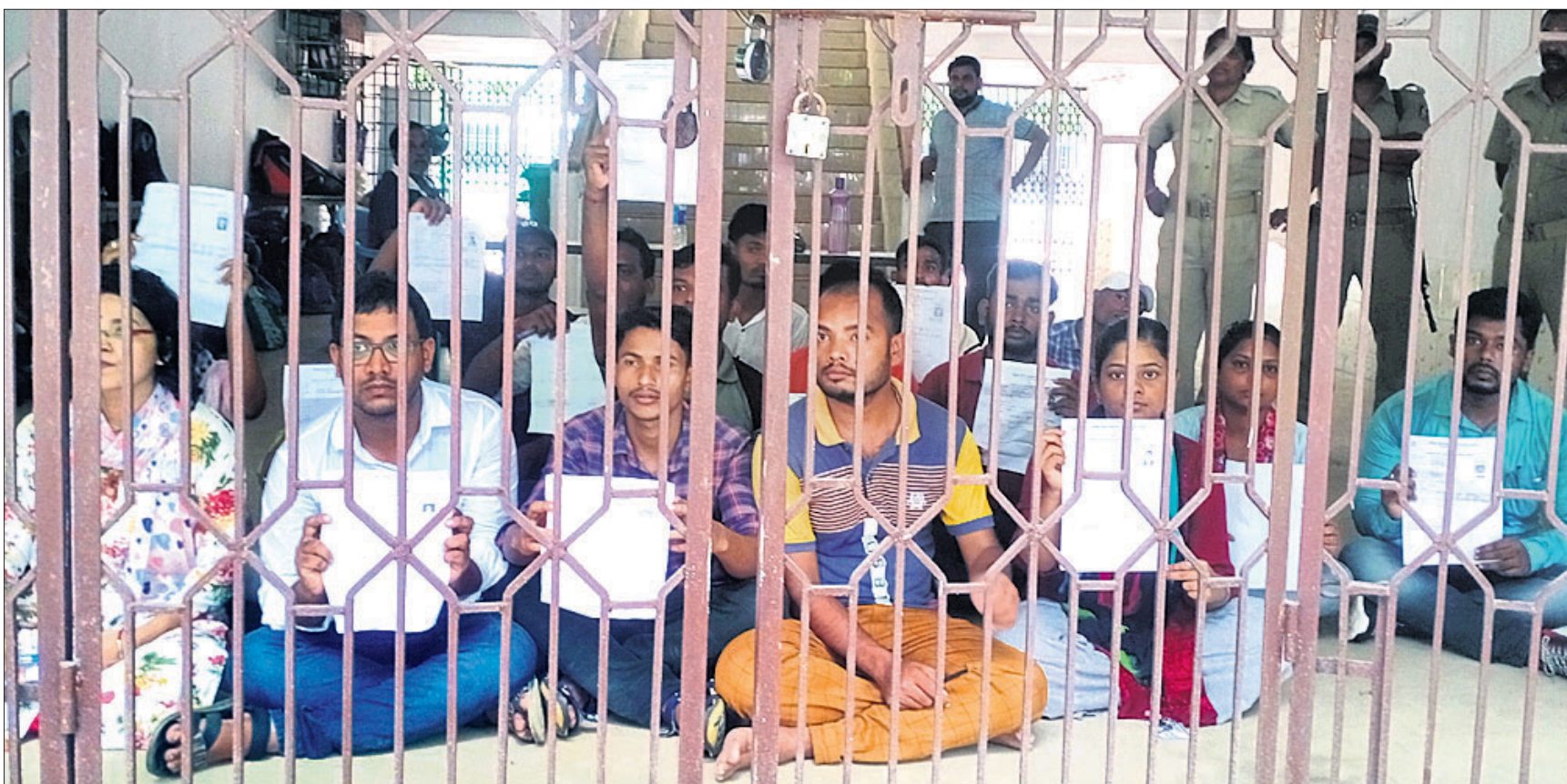
ଓଏସ୍‌ସ୍‌ସି ଦ୍ୱାରା ପରିଚାଳିତ ସୁଧାକୃତି ଆକାରଣ୍ୟ ପଦବୀ ପରୀକ୍ଷା ପ୍ରଶ୍ନପତ୍ର ଲିକ୍ ଅଭିଯୋଗରେ ରବିବାର ଭଦ୍ରକ କଲେଜ ପରିସରରେ ପରୀକ୍ଷାର୍ଥୀମାନେ ଧାରଣାରେ ବସିଛନ୍ତି।

ନିକଟରେ ଅନ୍ତର୍ଜାତୀୟ ମୁଦ୍ରାପାଣ୍ଠି (ଆଇଏମ୍ଏଫ୍) ଭାରତ ସମ୍ବନ୍ଧରେ ଏକ ସମୀକ୍ଷା ରିପୋର୍ଟ ପ୍ରକାଶ କରିଛି। ସେଥିରେ ଉଲ୍ଲେଖ କରାଯାଇଛି ଯେ, ଚଳିତ ଆର୍ଥିକ ବର୍ଷରେ ଭାରତୀୟ ଅର୍ଥନୀତି ୬ ପ୍ରତିଶତ ବୃଦ୍ଧି ପାଇବ। 'ବିରାଡ଼ି କପାଳକୁ ଶିକା ଛିଡ଼ିଲା' ଭଳି କେନ୍ଦ୍ର ସରକାର ଏବେ ଏହି ଆକଳନ ରିପୋର୍ଟକୁ ଅନ୍ତର୍ଜାତୀୟ ସ୍ତରକୁ ଉପାଦାନ କରିବାକୁ ଚାହୁଁଛନ୍ତି। କୁହାଯାଇପାରେ ଯେ, ଆଇଏମ୍ଏଫ୍ ଏହି ଆଶାବାଦୀ ରିପୋର୍ଟ ନୀତି ପ୍ରସ୍ତୁତକାରୀଙ୍କୁ ମୁଦ୍ରାଞ୍ଚଳ ଓ ବେକାରି ଭଳି ସମସ୍ୟାକୁ କମାଇବା ଲାଗି ସେମାନଙ୍କ ମଧ୍ୟରେ ଦୃଢ଼ ବିଶ୍ୱାସ ସୃଷ୍ଟି କରିବ। କିନ୍ତୁ ଭାରତରେ ଅଧିକାଂଶ ନୀତିକାର ଓ ଗବେଷକ ରାଜନୈତିକ ବ୍ୟକ୍ତି, ବିଶେଷକରି ସରକାରଙ୍କ ନିର୍ଦ୍ଦେଶ ଅନୁଯାୟୀ ପରିଚାଳିତ ହୋଇଥାଆନ୍ତି। ଏଠାରେ କୁହାଯାଇପାରେ ଯେ, ଦେଶ ଭିତରୁ ଯଦି କୌଣସି ଅସ୍ପୃଶ୍ୟକର ତଥ୍ୟ ଉପରେ ଆଧାରିତ ରିପୋର୍ଟ ପ୍ରକାଶ ପାଇଛି, ତେବେ ସେଥିରେ କଡ଼ିତ ଅର୍ଥସର କିମ୍ବା ପରିସଂଖ୍ୟାନବିତ୍ତକୁ ଚାଲିବୁ ବିଦା କରିବା ସହିତ କେଳକୁ ପଠାଇ ଦିଆଯାଉଛି। ସେହିଭଳି ବିଦେଶରୁ ଭାରତ ସମ୍ପର୍କରେ ପ୍ରକାଶ ପାଉଥିବା ତଥ୍ୟ ଯଦି ସରକାରଙ୍କୁ ସୁହାଉନାହିଁ, ତେବେ ତାହାକୁ ଆଭ୍ୟନ୍ତରୀଣ କାର୍ଯ୍ୟରେ ବାହ୍ୟଶକ୍ତିର ହସ୍ତକ୍ଷେପ କହି ନାକତ କରି ଦିଆଯାଉଛି। ଅର୍ଥାତ୍ ବାସ୍ତବତାକୁ ସ୍ୱୀକାର କରି ତା' ଉପରେ ପ୍ରତିକାରମୂଳକ ପଦକ୍ଷେପ ନେବାକୁ ଆଜିର ସରକାର ଅନୁକୂଳ ବୋଲି କୁହାଯାଉଛି। ପରିସଂଖ୍ୟାନ ଠିକ୍ ରହିଲେ ଦେଶବାସୀଙ୍କ ପାଇଁ ପ୍ରଶଂସନୀୟ ହେଉଥିବା ନୀତି ସେମାନଙ୍କୁ କାର୍ଯ୍ୟରେ ଲାଗିଥାଏ। କିନ୍ତୁ ଭାରତରେ ପରିସଂଖ୍ୟାନର ବୁଢ଼ାବାପା ଭାବେ ପରିଚିତ ଜନଗଣନା ଦାମ୍ ଦାମ ସ୍ଥିତିର ରଖାଯିବା ଫଳରେ ମୂଳକୁ ପ୍ରତ୍ୟେକକରି କାର୍ଯ୍ୟ ଏବଂ ଯୋଜନା ତ୍ରୁଟିପୂର୍ଣ୍ଣ ହେଉଛି।