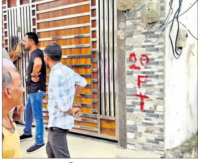
ସାମାଜିକ ସେବା ୨୦୧୯ର କବରଦଖଲ ।