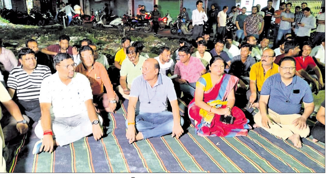
ଉଚ୍ଚପ୍ରତିପତ୍ତିରେ ରାସ୍ତା ଉପରେ ଧାରଣା ।

ବରଗଡ଼, ୩୦।୭ (ପ୍ରେମାନନ୍ଦ ଖମାରୀ) ବରଗଡ଼ ସହରରେ ଲୋକ୍ଷୁ ମିଶ୍ର ଛକରୁ ନୂଆ ଜିରା ବ୍ରିକ ପର୍ଯ୍ୟନ୍ତ ରାସ୍ତା ପାର୍ଶ୍ୱ ଜବରଦଖଲ ଉଚ୍ଚପ୍ରତିପତ୍ତି ପୂର୍ଣ୍ଣ ପ୍ରସଙ୍ଗ ପାଇଛି। ଏହାକୁ ନେଇ ସହର ଉଚ୍ଚପ୍ରତିପତ୍ତି ପୂର୍ଣ୍ଣ ଅଞ୍ଚଳକୁ ଜବରଦଖଲ ଉଚ୍ଚପ୍ରତିପତ୍ତି ଦାମିନିର ଦାବି ହୋଇଥିବାରୁ ସହରବାସୀ ସଙ୍ଗଠିତ ହୋଇଛନ୍ତି। ପ୍ରଶାସନ ଉଚ୍ଚପ୍ରତିପତ୍ତି କରି ନ ଥିଲେ ପୁଣି ସାମାଜିକ ସେବା ସହିତ ଜବରଦଖଲ ସ୍ଥାନ ଖାଲି କରିବାକୁ ତାକଲାଜି ଯନ୍ତ୍ରରେ ସୂଚନା ଦେଇ ସାରିଛି। ପ୍ରଶାସନର ସୂଚନାମତେ ୪୮ଘଣ୍ଟା ଅବଧି ରହିବାର ସୂଚନା ଦେଇଛି। ସାମାଜିକ ସଙ୍ଗଠିତ ରୂପ ଦେଇଥିଲେ। କାର୍ଯ୍ୟକ୍ରମରେ ମାଝିଙ୍କ ପ୍ରକାଶିତ ପୁସ୍ତକର ପ୍ରଦର୍ଶନା କରାଯାଇଥିଲା। ଡ. ଶେଷାନ ବିଶି ଧନ୍ୟବାଦ ଅର୍ପଣ କରିଥିଲେ।