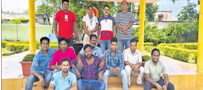
ସମଲପୁରୀ ଦିନ ପାଳନ ନେଇ ପ୍ରସ୍ତୁତି ବୈଠକରେ ଯୋଗ ଦେଇଥିବା କର୍ମକର୍ତ୍ତା ।