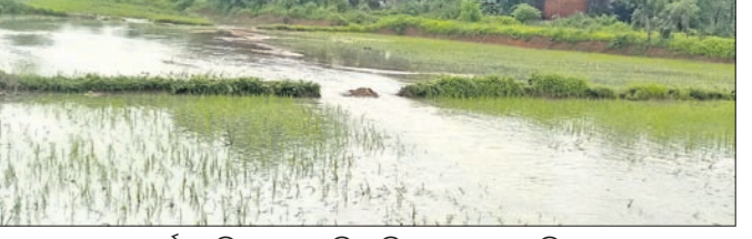
ବର୍ଷା ପାଣିରେ ଚାଷଜମି ବାଲିଚର ହୋଇଯାଇଛି ।