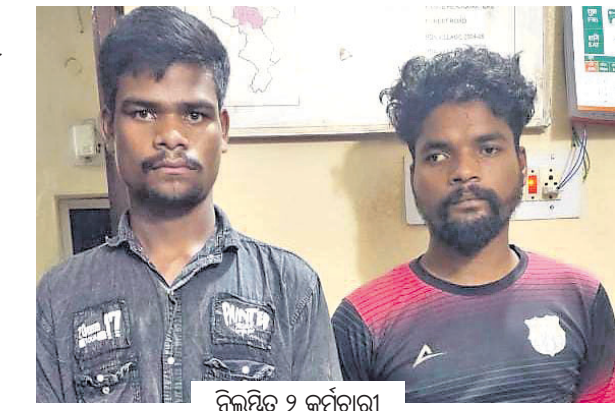
ନିଲମ୍ବିତ ୨ କର୍ମଚାରୀ

କେନ୍ଦ୍ର ଓ ଝାଡ଼ଖଣ୍ଡ ଅଞ୍ଚଳକୁ ଆସିଥିବା ହାତୀପଲଙ୍କୁ ଘରଢ଼ାଳବା ନିମନ୍ତେ ହାତୀ ପିଠିରେ ନିଆଁଲୁଣା ପକାଇବା ଦୃଶ୍ୟର ଏକ ଭିଡିଓ ସୋସିଆଲ ମିଡିଆରେ ଭାଇରାଲ ହୋଇଥିଲା। ଏହାକୁ ନେଇ ବନ ବିଭାଗ ତଦନ୍ତପୂର୍ବକ କାର୍ଯ୍ୟାନୁଷ୍ଠାନ ଗ୍ରହଣ କରିଛି। ହାତୀ ପ୍ରତି କୌଣସି ଅନାବଦ୍ୟ ବ୍ୟବହାର କିମ୍ବା ବିରକ୍ତିକର ଆଚରଣ କରା ନ ଯିବାକୁ ପୁସ୍ତିକା କୋର୍ଟକ ନିର୍ଦ୍ଦେଶ ରହିଛି। ଏ ନେଇ ଘଟଣା ପରେ କେଉଁ କାରଣରୁ ଏପରି କାର୍ଯ୍ୟ କରିଥିଲେ ବୋଲି ବୁଲ୍ କର୍ମଚାରୀଙ୍କୁ ରିପୋର୍ଟ ମଗାଯାଇଥିଲା। ଉଭୟ ଦୋଷ ସାକାର କରିବାରୁ ଆଇନ ଅନୁଯାୟୀ କାର୍ଯ୍ୟାନୁଷ୍ଠାନ ଗ୍ରହଣ କରାଯାଇଛି ବୋଲି ବନଖଣ୍ଡ ଅଧିକାରୀ ଶ୍ରୀକାନ୍ତ ନାୟକ ପ୍ରକାଶ କରିଛନ୍ତି।