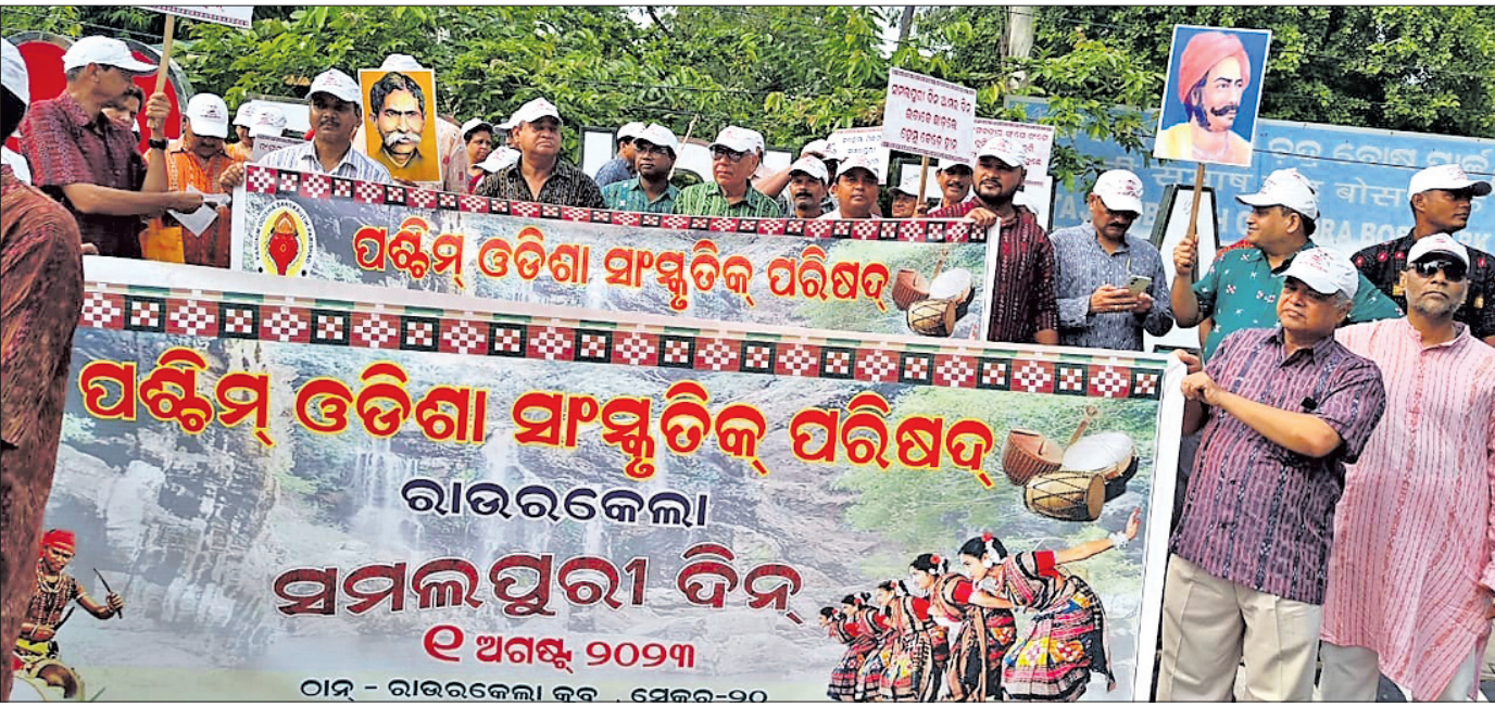
ଆସକ୍ତା ଅଗଷ୍ଟ ୧ତାରିଖରେ ରାଉରକେଲାରେ ସମଲପୁରା ଦିନ ପାଳନ ପାଇଁ ରବିବାର ଶୋଭାଯାତ୍ରା କରାଯାଇଛି।

ରାଉରକେଲା, ୩୦।୭(ବିପ୍ଳବ ରଞ୍ଜନ ଦାଶ) ରାଉରକେଲା ବାସନ୍ତୀ କଲୋନାସ୍ଥିତ ସରକାରୀ ସ୍ୱାସ୍ଥ୍ୟ ଆରୋଗ୍ୟ କେନ୍ଦ୍ରରେ ଥିବା ଉଚ୍ଚ ଶକ୍ତିସମ୍ପନ୍ନ ବିଦ୍ୟୁତ୍ ଗ୍ରାହ୍ୟତ୍ୱର ବିପଦସଙ୍କୁଳ ଅବସ୍ଥାରେ ରହିଛି। ଅଧିକାଂଶ ସମୟରେ ଶକ୍ତିସର୍ବ୍ବତ ହୋଇ ନିଆଁ ବାହାରୁଛି। ବର୍ଷା ହେଲେ ଗ୍ରାହ୍ୟତ୍ୱର ପାଖରେ ବର୍ଷାପାଣି ଜମି ରହୁଛି। ଫଳରେ ବର୍ଷା ସମୟରେ ରୋଗୀମାନେ ଅସୁବିଧାର ସମ୍ମୁଖୀନ ହେଉଛନ୍ତି। ଏଣୁ ସ୍ୱାସ୍ଥ୍ୟକେନ୍ଦ୍ର ପରିସରରୁ ଗ୍ରାହ୍ୟତ୍ୱର ପ୍ରାଧିକାର କରିବାକୁ ଦାବି ହେଉଛି। ସେହିପରି ରୋଗୀମାନଙ୍କ ବସିବା ପାଇଁ ସ୍ୱାସ୍ଥ୍ୟକେନ୍ଦ୍ର ସମ୍ମୁଖ ରୁଟ୍ଟୁ ସିଗ୍ନେଲ ଫ୍ୟାନ ନାହିଁ କି ବସିବା ପାଇଁ ଟୋକି ବ୍ୟବସ୍ଥା ନାହିଁ। ଫଳରେ ରୋଗୀମାନେ ବାଧ୍ୟହୋଇ ଛିପିଟି ଆଗରେ ବସୁଛନ୍ତି ନଚେତ୍ ହିତା ହୋଇ ରହୁଛନ୍ତି। ଏ ନେଇ ମେଡିକାଲ ଅଫିସର କ୍ୟୋଡି ମୁକୁ ପଚାରିବାକୁ ସେ କହିଲେ, କେନ୍ଦ୍ର ପରିସରରୁ ବିଦ୍ୟୁତ୍ ଗ୍ରାହ୍ୟତ୍ୱର ଯେଉଁ ଶାସ୍ତ୍ର ସ୍ଥାନାନ୍ତର ହେବ ସେ ନେଇ ଉଚ୍ଚ କର୍ତ୍ତୃପକ୍ଷଙ୍କୁ ଜଣାଇବି। ଏହାସହ ଅନ୍ୟ ସମସ୍ୟା ଉପରେ ବିହିତ ପଦକ୍ଷେପ ଗ୍ରହଣ କରାଯିବ ବୋଲି ସେ କହିଥିଲେ।