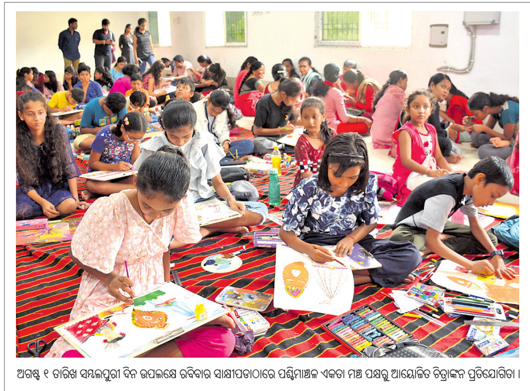
ଅଗଷ୍ଟ ୧ ତାରିଖ ସମ୍ବଲପୁରୀ ଦିନ ଉପଲକ୍ଷେ ରବିବାର ସାକ୍ଷୀପତାଠାରେ ପଶୁମାଞ୍ଚ ଏକତା ମଞ୍ଚ ପକ୍ଷରୁ ଆୟୋଜିତ ତିତ୍ତାଳନ ପ୍ରତିଯୋଗିତା।

ସେଲ୍‌ଫି ପଠାଇବା ସମୟରେ ନିଜର ନାମ ଏବଂ ମୋବାଇଲ ନମ୍ବର ଦେବାକୁ ଭୁଲନ୍ତୁ ନାହିଁ। ଯୋଗ୍ୟବିବେଚିତ ଫଟୋ ପ୍ରକାଶ ପାଇବ।