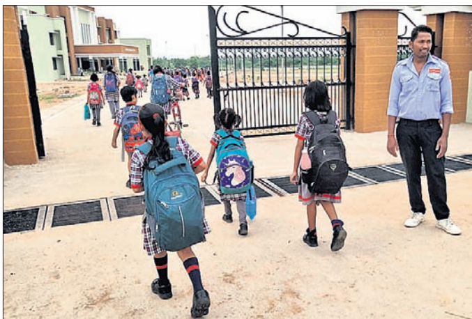
ଛାତ୍ରଛାତ୍ରୀମାନେ ଅଧିକ ଓଜନର ସ୍କୁଲ ବ୍ୟାଗ୍ କାରଣରେ ବୋହୁଛନ୍ତି ।

ସ୍କୁଲ ପିଲାଙ୍କ ଉପରେ ବହି, ଖାତା ବୋର୍ଡ ଲାଗି ଦିଆଯାଇଛି । କୋଳକାମି ଛାତ୍ରଛାତ୍ରୀମାନେ ବାଧ୍ୟ ହୋଇ ଅଧିକ ଓଜନର ସ୍କୁଲ ବ୍ୟାଗ୍ କାରଣରେ ବୋହୁଛନ୍ତି । ଉଚ୍ଚ ନ୍ୟାୟାଳୟ ଓ କେନ୍ଦ୍ର ଶିକ୍ଷା ବିଭାଗ ସ୍କୁଲ ଛାତ୍ରଛାତ୍ରୀଙ୍କୁ ବ୍ୟାଗ୍ ଓଜନ ଉପରେ କଟକଣା ଲାଗୁ କରିଛନ୍ତି । ମାତ୍ର ସୁବର୍ଣ୍ଣପୁର ଜିଲ୍ଲାରେ ଏହି ନିୟମ ପାଳନ ହେଉନାହିଁ । ସ୍କୁଲ ବ୍ୟାଗ୍ ଓଜନ ମାପି ହେଉ ନ ଥିବାରୁ ଛାତ୍ରଛାତ୍ରୀ ତଥା ଅଭିଭାବକଙ୍କ ମଧ୍ୟରେ ଅସନ୍ତୋଷ ପ୍ରକାଶ ପାଉଛି ।