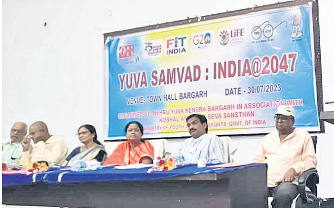
ଯୁବ ସମାଜ କାର୍ଯ୍ୟକ୍ରମରେ ମଞ୍ଚାସନ ଅତିଥିବୃନ୍ଦ ।

ବରଗଡ଼, ୩୦।୭ (ପ୍ରେମାନନ୍ଦ ଖମାରୀ) ଯୁବଶକ୍ତି ରାଷ୍ଟ୍ରର ମେରୁଦଣ୍ଡ। ଏହାର ଅବକ୍ଷୟ ହେଲେ ରାଷ୍ଟ୍ର ଦୁର୍ବଳ ହୁଏ। ତେଣୁ ଯୁବଶକ୍ତି ଉଚିତ ମାର୍ଗରେ ଯାଇ ରାଷ୍ଟ୍ର ନିର୍ମାଣରେ ଭାଗୀଦାର ହେବା ଉଚିତ। ଭାରତ ରାଷ୍ଟ୍ର ନିର୍ମାଣରେ ଯୁବଶକ୍ତିର ଯୋଗଦାନ ଆବଶ୍ୟକତା ରହିଛି ବୋଲି ରବିବାର ବରଗଡ଼ ନେହେରୁ ଯୁବକେନ୍ଦ୍ର ପକ୍ଷରୁ ରବିବାର ସ୍ଥାନୀୟ ବିଜୁ ପଟ୍ଟନାୟକ ତାଉନ ହଲରେ ଅନୁଷ୍ଠିତ ଯୁବ ସମାଜ ଏବଂ