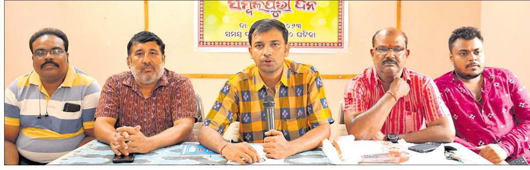
ଖବରଦାତା ସମ୍ମିଳନୀରେ ସମ୍ବଲପୁର ଏକତାମଞ୍ଚ କର୍ମକର୍ତ୍ତା।

ସମ୍ବଲପୁର, ୩୦।୭ (ଶୁଭାଶିଷ ପାଠୀ) ପକ୍ଷପତ୍ରେ ଯୋଗ ଦେଇ ଖୁସି ମନାଇ ସମ୍ବଲପୁର ପ୍ରଚାର ପ୍ରସାର କରିବାରେ ସହଯୋଗ କରନ୍ତୁ ବୋଲି ସାଧାସିଦ୍ଧ ଅଗଷ୍ଟ ୧ ତାରିଖରେ ସମ୍ବଲପୁରୀ ଦିନ ପାଳନ ହେବ। ସମ୍ବଲପୁର ପୁସ୍ତିକାଳୟ ଛକସ୍ଥିତ ଗଙ୍ଗାଧର ପୁସ୍ତିକାଳୟ କଳାକାରଙ୍କ ମହାମିଳନ ହେବ। ଦୁର୍ଲଭ ମଞ୍ଚ, ବରିଷ୍ଠ ସ୍ତବ, ପ୍ରତିଷ୍ଠିତ କଳାକାରମାନେ ପ୍ରଦର୍ଶନ କରି ମଞ୍ଚକୁ ସୁଲୁକାଇବେ। ସମ୍ବଲପୁର ବସ୍ତ୍ର ପରିଧାନ କରିବା ସହ ସମ୍ବଲପୁରୀ ଗୀତ, ନୃତ୍ୟ ସମ୍ପର୍କ ହେବ। ସମ୍ବଲପୁରବାସୀ ଏହି ଦିନରେ ଉଚ୍ଚ