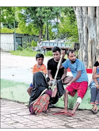
ଆହତ ଶ୍ରମିକ ଆପୋସ ସମାଧାନ ପାଇଁ ଆନାରେ ଉପସ୍ଥିତ ।

ଶିଳ୍ପ ସହର ରାଉରକେଲାରେ ନିର୍ମାଣ କାର୍ଯ୍ୟ ଅହରହ କରାଯାଉଛି। ରାଉରକେଲା ଇନ୍ଦ୍ରାଜିତ କାରଖାନା ବ୍ୟତୀତ ଶତାଧିକ ଘରୋଇ ଓ ବେସରକାରୀ ସଂସ୍ଥାରେ ଲକ୍ଷାଧିକ ନିର୍ମାଣ ଶ୍ରମିକ କାମ କରୁଛନ୍ତି। ଏହାସହ ବିଭିନ୍ନ ନିର୍ମାଣ କାର୍ଯ୍ୟରେ ନିଯୋଜିତ ଶ୍ରମିକଙ୍କ ସମସ୍ତ ସୁବିଧା ପାଇଁ ରାଜ୍ୟ ସରକାର ପଦକ୍ଷେପ ନେଉଥିବା ବେଳେ ସୁରକ୍ଷା ପାଇଁ କଡ଼ା ନିୟମ ଲାଗୁ କରିଛନ୍ତି। ହେଲେ ଶ୍ରମିକଙ୍କ କାର୍ଯ୍ୟସ୍ଥଳରେ ହେଉଥିବା ଆଇନ ଉଲ୍ଲଙ୍ଘନ ସମ୍ପର୍କରେ କେହି ନିନ୍ଦା ଦେଉନାହାନ୍ତି। ଏପରିକି ନିର୍ମାଣ କାର୍ଯ୍ୟସ୍ଥଳରେ ସୁରକ୍ଷା ଅବହେଳା ଯୋଗୁ ଦୁର୍ଘଟଣା ବୃଦ୍ଧି ପାଉଛି। ପ୍ରାୟ ଏକ ମାସ ମଧ୍ୟରେ କୋଏଲନଗର, ଜଗଦା, ଝିରପାଣି ଅଞ୍ଚଳରେ ୩ ଜଣ ଶ୍ରମିକ ଆହତ ହୋଇଥିବା ବେଳେ ଜଣେ ମୃତ୍ୟୁବରଣ କରିଥିବା ପୂର୍ବନା ମିଳିଛି। ଜୁଲାଇ ୨ ତାରିଖରେ ଜଗଦା ଅଞ୍ଚଳରେ ଏକ ବାସଗୃହ ନିର୍ମାଣ ବେଳେ ଜଣେ ମହିଳା ଶ୍ରମିକଙ୍କ ଗୋଡ଼ ଖସି ଉଦ୍‌ଯାପନା ଯୋଷଣା କରିଥିଲେ। ତେବେ ଗତ