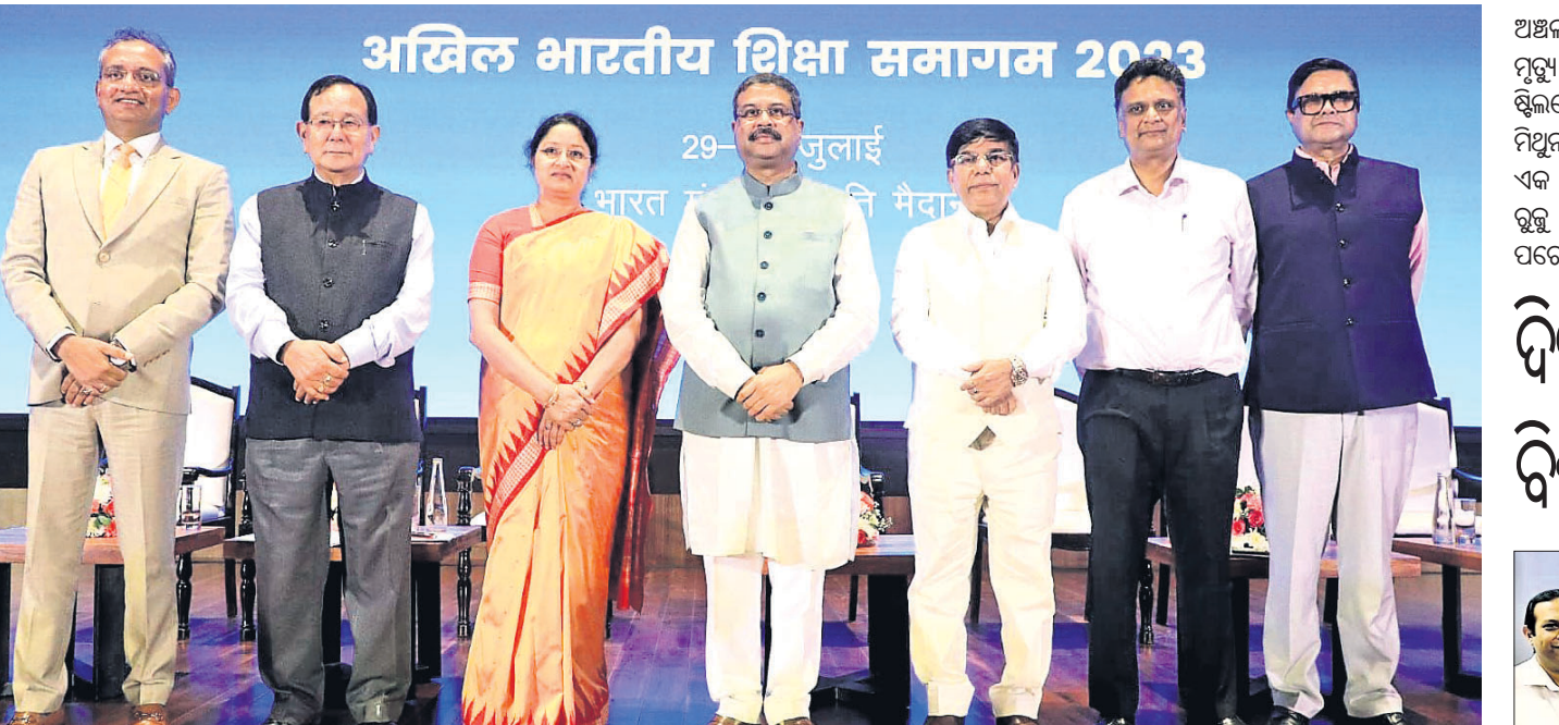
ଅଧିକ ଭାରତୀୟ ଶିକ୍ଷା ସମାଗମର ଉଦ୍ଘୋଷଣା ସମାବେଶରେ କେନ୍ଦ୍ରମନ୍ତ୍ରୀ ଧର୍ମେନ୍ଦ୍ର ପ୍ରଧାନ ଯୋଗ ଦେବା ଅବସରରେ ।