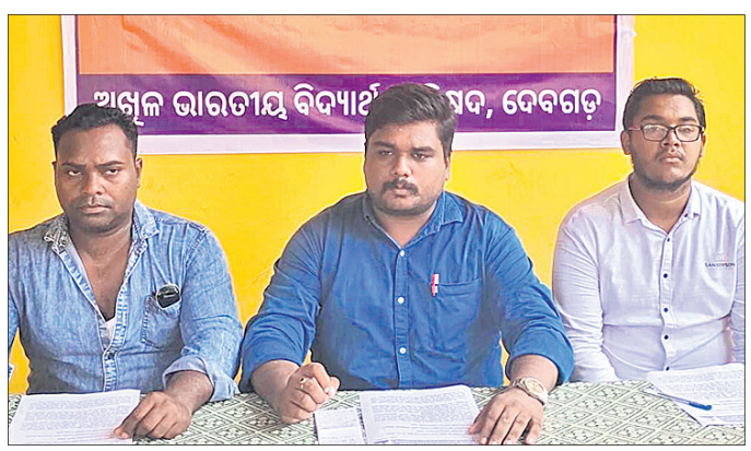
ଖବରଦାତା ସମ୍ମିଳନୀରେ ଅଖିଳ ଭାରତୀୟ ବିଦ୍ୟାର୍ଥୀ ପରିଷଦର କର୍ମକର୍ତ୍ତା।

ରାଜ୍ୟରେ ଛାତ୍ର ସଂସଦ ନିର୍ବାଚନ ପାଇଁ ରାଜ୍ୟ ସରକାର ତାରିଖ ଘୋଷଣା କରନ୍ତୁ ବୋଲି ଅଖିଳ ଭାରତୀୟ ବିଦ୍ୟାର୍ଥୀ ପରିଷଦ ପକ୍ଷରୁ ଦାବି କରାଯାଇଛି। ଦେବଗଡ଼ ସହର ଗୋପାଳଜୀର ମନ୍ଦିର ପରିସରରେ ଆୟୋଜିତ ଏକ ଖବରଦାତା ସମ୍ମିଳନୀରେ ଅଖିଳ ଭାରତୀୟ ବିଦ୍ୟାର୍ଥୀ ପରିଷଦର କର୍ମକର୍ତ୍ତା ଏହି ଦାବି କରି କହିଥିଲେ ଯେ, ଶୈକ୍ଷିକ ବାତାବରଣ ଚନ୍ଦ୍ର ନ ଥିବା ଦଶାଳ ରାଜ୍ୟ ସରକାର ଦାୟିତ୍ୱ ଗ୍ରହଣ କରିବା ପାଇଁ ଅନୁରୋଧ କରିବା ପାଇଁ ଶୈକ୍ଷିକ ବାତାବରଣ ସୃଷ୍ଟି କରନ୍ତୁ ବୋଲି ପ୍ରଶ୍ନ ଉଠାଇଛନ୍ତି। ନିଜ ଦଳକୁ ସୁହାଇଲା ଭଳି ବିଜେଡି ପଦକ୍ଷେପ ଗ୍ରହଣ କରୁଥିବାରୁ ରାଜ୍ୟରେ ଶିକ୍ଷା ବ୍ୟବସ୍ଥା ବିପର୍ଯ୍ୟୟ ହୋଇପଡ଼ିଛି। ଗତ କିଛିଦିନ