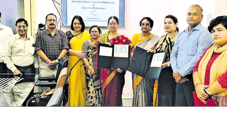
ଦିବ୍ୟାଙ୍ଗ ଛାତ୍ରୀଙ୍କ ବିକାଶ ପାଇଁ ରମାଦେବୀ ବିଶ୍ୱବିଦ୍ୟାଳୟ ଓ ଡିଏସ୍ଟି ମଧ୍ୟରେ ଏମ୍‌ଓୟୁ ସ୍ୱାକ୍ଷରିତ ହୋଇଛି ।