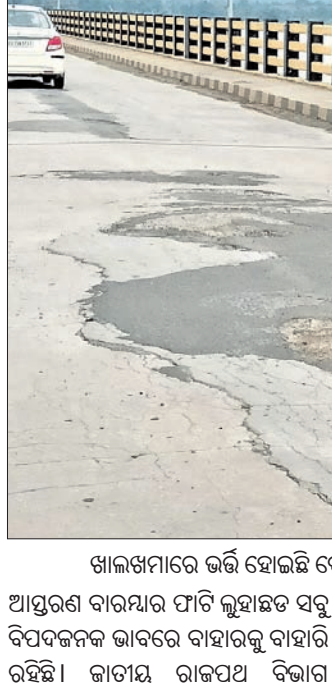
ଖାଲଖାଳରେ ଭରି ହୋଇଛି ବୌଦ୍ଧ-କିଆକଟା ମହାନଦୀ ସେତୁ ।

ବାହାରି ଖାଲ ସୃଷ୍ଟି ହୋଇଯାଉଥିବା ଦେଖାଯାଉଛି । ଏହି ସେତୁ ଉପରେ ବାରମ୍ବାର ଦୁର୍ଘଟଣା ଘଟି ଅନେକ ଧନ କ୍ଷତି ହୋଇଛି । ହେଲେ ସେତୁ ଉପରେ ସୃଷ୍ଟି ହୋଇଥିବା ଖାଲର ଘାଣ୍ଟା ମରାମତି କରାଯାଉ ନ ଥିବାରୁ ସୁବର୍ଣ୍ଣପୁର ଦୁର୍ଘଟଣା ଘଟୁଛି । ଦୁଇବର୍ଷ ପୂର୍ବରୁ ଏହି ସେତୁର ଆଲୋଚନା କରଣ କରାଯାଇଥିଲା । ବର୍ତ୍ତମାନ ଲାଜତ ଜଳ ନ ଥିବା ଦେଖିବାକୁ ମିଳିଛି । ଜିଲ୍ଲାରେ ମହାନଦୀ ଉପରେ ଧଳପୁର-ଆଠମଲିକ ଓ ବୌଦ୍ଧ-ମଙ୍ଗାକୁଦ ମଧ୍ୟରେ ଦୁଇଗୋଟି ସେତୁ ନିର୍ମାଣ କରାଯାଇ ଉଦ୍ଘାଟନ ଅପେକ୍ଷାରେ ଥିବା ବେଳେ ମାତ୍ର ୨୯ ବର୍ଷ ତଳେ ନିର୍ମିତ ବୌଦ୍ଧ କିଆକଟା ସେତୁର ପୁରୁଣା ପ୍ରତି ଜାତୀୟ ଉତ୍ତମ ବିଭାଗ ପକ୍ଷରୁ ଦୃଷ୍ଟି ଦିଆ ନ ଯିବା ବିତର୍କର ବିଷୟ । ଯଥାଶୀଘ୍ର ଏ ଦିଗରେ ବିହତ ପଦକ୍ଷେପ ଗ୍ରହଣ କରାଯିବାରୁ ଅଞ୍ଚଳବାସୀଙ୍କ ପକ୍ଷରୁ ଦାବି ହେଉଛି ।