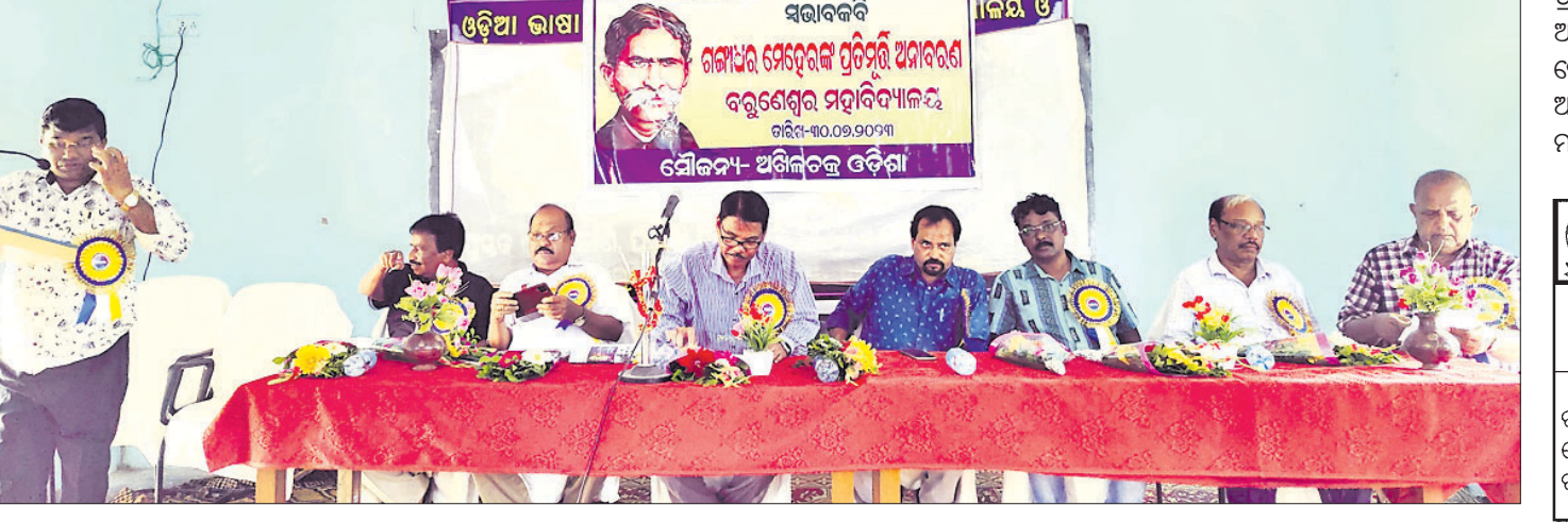
ଯାଜପୁର, ୩୦.୭