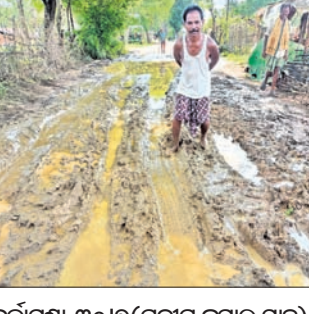
କଳାପୁଣ୍ଡା, ୩୦୧୭ (ପ୍ରଦୀପ କୁମାର ସାହୁ)