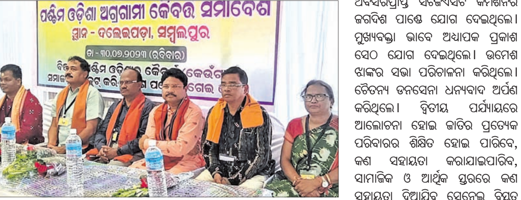
ସମ୍ବଲପୁର କୈବର୍ତ୍ତ ସମାଜର ପଶ୍ଚିମ ଓଡ଼ିଶା ସୁରକ୍ଷା ସମାବେଶରେ ଅତିଥି କର୍ମକର୍ତ୍ତା।

ମଣିଷ ଭିନ୍ନ ସମୟରେ ଭିନ୍ନ ଦାବି କରିଥାଏ। ଦାବିର ଆଭିମୁଖ୍ୟ ସମାଜର ମଙ୍ଗଳ ପାଇଁ ହୋଇଥିଲେ ଆଲୋଚନାର ବିଷୟ ପାଲଟିଥାଏ। ରାଜରାସ୍ତ୍ରକୁ ଓହ୍ଲାଇ କାଟି ପାଇଁ ସମସ୍ତେ ଏକକୃତ ହୋଇ ଲଢ଼େଇ କରିବାର ଆବଶ୍ୟକତା ରହିଛି। ଫଳରେ କାଟିର ଉତ୍ଥାନ ହୋଇଥାଏ। କାଟି ଶକ୍ତିଶାଳି ହୋଇଥାଏ। କାଟିର ଏକତା ମହାନ ଅଟେ। କାଟିକୁ କାଟି କେବଳ