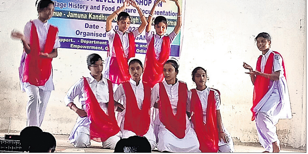
ଛାତ୍ରାଛାତ୍ରୀମାନେ ନୃତ୍ୟ ପରିବେଷଣ କରୁଛନ୍ତି ।