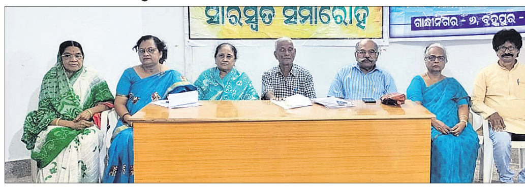
ସାହିତ୍ୟ ଆସରରେ ଉପସ୍ଥିତ ଅତିଥି ଓ ଅନ୍ୟମାନେ।