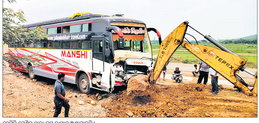
ଜେସିବି ମେଣ୍ଡିନ ବାବା ବସ୍ ରାସ୍ତାକୁ ଅଣାଯାଇଛି।

ଗଞ୍ଜାମ, ୩୦୭(ବିଦ୍ୟାଧର ସାହୁ ଗଞ୍ଜାମ) ଗଞ୍ଜାମ ବ୍ଲକ ସୁବଳୟା ୧୬୨୦. ଜାତୀୟ ରାଜପଥରେ ରବିବାର ଏକ ତୀର୍ଥଯାତ୍ରୀ ବସ୍ ଦୁର୍ଘଟଣାଗ୍ରସ୍ତ ହୋଇଛି। ଯୌତାଗାନ୍ଧ୍ୟବନ୍ଧୁତ୍ୱ ସମସ୍ତ ଯାତ୍ରୀ ସୁରକ୍ଷିତ ଅଛନ୍ତି। ଗ୍ଲାନାୟ ଲୋକେ ଦୁର୍ଘଟଣାଗ୍ରସ୍ତ ବସ୍କୁ ୫୦ରୁ ଉର୍ଦ୍ଧ୍ୱ ଯାତ୍ରୀଙ୍କୁ ସୁରକ୍ଷିତ ଅବସ୍ଥାରେ ଉଦ୍ଧାର କରିବା ପରେ ସୁବଳୟା ପଞ୍ଚାୟତ ଗୃହକୁ ନେଇଥିଲେ। ପ୍ରକାଶ ସେ, ମଧ୍ୟପ୍ରଦେଶରୁ 'ମାନସୀ' ନାମକ ବସ୍ (ଏଏଏ୧୦୧୦