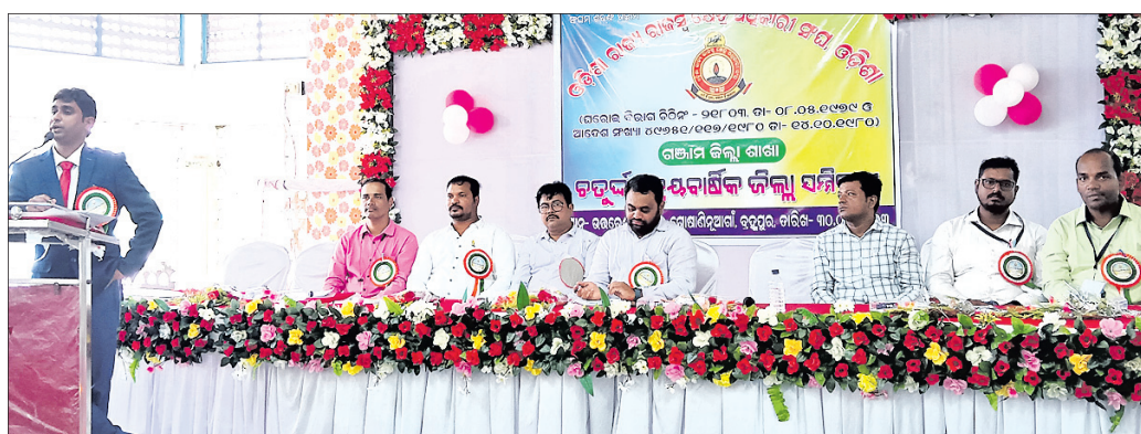
ସମ୍ମିଳନୀରେ ଉପସ୍ଥିତ ସଂଘର ସଭ୍ୟ ଦ୍ୱୟ।