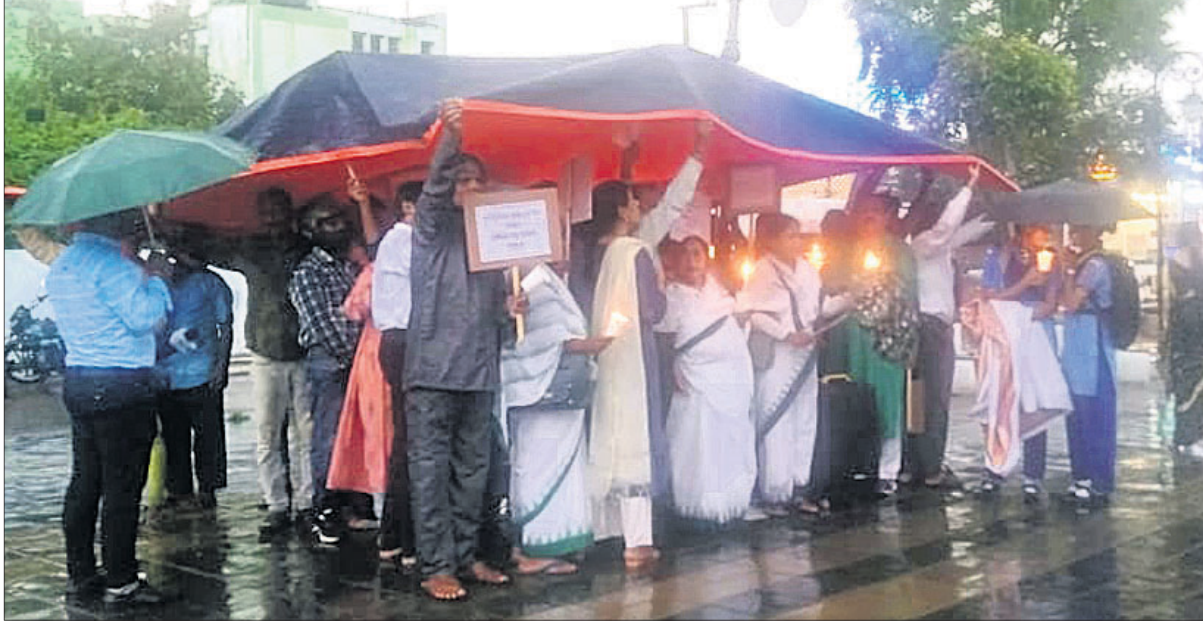
ମଣିପୁରରେ ଶାନ୍ତି ଓ ସନ୍ଦର୍ଭନା ଫୋରାଲ ଆଣିବା ପାଇଁ ରବିବାର ଭୁବନେଶ୍ୱର ମାଷ୍ଟରକ୍ୟାଣ୍ଟିନଠାରେ ଓଡ଼ିଶା ନାଗରିକ ସଂଗଠନ ସମୂହ ଏବଂ ବୁଦ୍ଧିଜୀବୀମାନେ ପ୍ରବଳ ବର୍ଷା ସତ୍ତ୍ୱେ କ୍ୟାଣ୍ଟେଲ କାଳି ଶାନ୍ତି ପ୍ରତିଷ୍ଠା ପାଇଁ ନିବେଦନ କରୁଛନ୍ତି ।

ଓଡ଼ିଆ ଜଗତମାଳି ଓ ରୁଚି ପ୍ରୟୋଗ - ଏ.କେ. ମିଶ୍ର ପବ୍ଲିଶର୍ସ ପ୍ରା.ଲିଃ