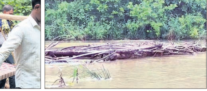
ଧୋଇ ହୋଇଯାଇଥିବା ଅସ୍ଥାୟୀ ପୋଲ।