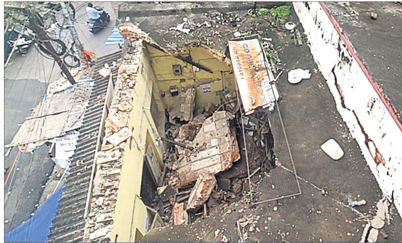
ସମ୍ବଲପୁର କୁଞ୍ଜଳପଡ଼ା ବ୍ୟାଙ୍କର ଛାତ ଭୁଙ୍ଗି ପଡ଼ିଛି।