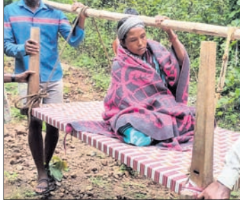
ରୋଗୀଙ୍କୁ ଝଟିଆରେ ବୋହି ନିଆଯାଇଛି।

ସରକାର ପୂର୍ବମ୍ଭ ଅଞ୍ଚଳର ଅଧିବାସୀମାନଙ୍କୁ ବିକାଶ ନିମନ୍ତେ ଅନେକ ଯୋଜନା କରି କୋଟି କୋଟି ଟଙ୍କା ଖର୍ଚ୍ଚ କରୁଛନ୍ତି। କିନ୍ତୁ ତାହା ସଠିକ୍ ମାର୍ଗରେ ଲୋକଙ୍କ ପାଖରେ ପହଞ୍ଚି ପାରୁନଥିବା ନଜର ଆସୁଛି। ଗଜପତି ଜିଲ୍ଲା ମୋହନା ବ୍ଲକର ଲିମବାଡ଼ ରାସ୍ତା ସମ୍ପୂର୍ଣ୍ଣକାରୁ ଅହୋଇଥିବା ବେଳେ ଲଗାଶ