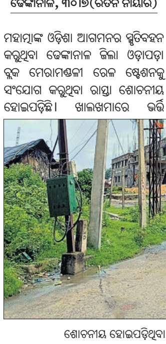
ଶୋଚନୀୟ ହୋଇପଡ଼ିଥିବା ମେରାମଣ୍ଡଳୀ ଷ୍ଟେଶନ ରାସ୍ତା।