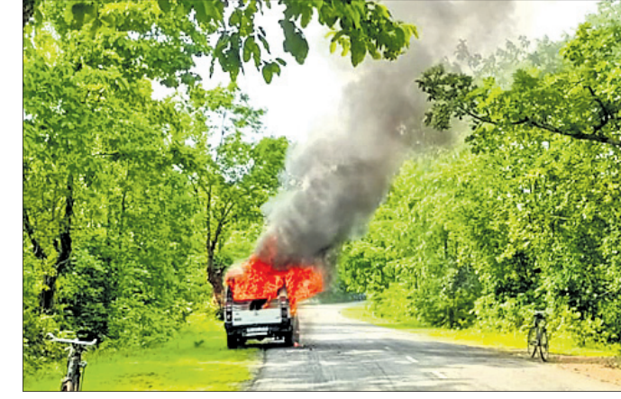
ଭରେଣୀ ବେଳେ ପୋଡ଼ି ଦିଆଯାଇଥିବା କିଆକଟା ଥାନା ଗାଡ଼ି।

ଭୋଇପଡ଼ା, ବରେଣୀ ଆଦି ଅଞ୍ଚଳର ୩୨୬ ଜଣ ଏହି କାଣ୍ଡ ଭିଆଇଛନ୍ତି। ସେମାନଙ୍କ ମଧ୍ୟରୁ ୧୬ ଜଣଙ୍କ ନାମ