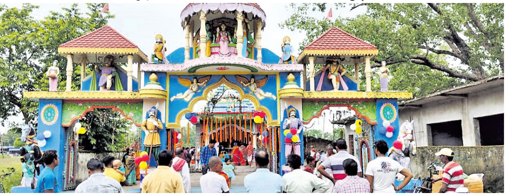
ପୀଠରେ ଶ୍ରଦ୍ଧାଳୁଙ୍କ ଭିଡ଼।

ବଅଁରପାଳ, ୩୦/୭ (ଉପେନ୍ଦ୍ର ରାଉତ) ବଅଁରପାଳ ରୁକ୍ଷସାପାଳ ଓ ଗଡ଼ସନ୍ତା ଗାଁର ଅଧିଷ୍ଠାତ୍ରୀ ଦେବୀ ମା' ଲୋଭୀ ଠାକୁରାଣୀଙ୍କ ନୂଆଖାଇ ପର୍ବ ରବିବାର ପାଳିତ ହୋଇଯାଇଛି।