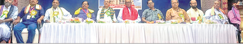
ସୌର ବ୍ରାହ୍ମଣ ପରିଷଦର ପ୍ରଥମ ସ୍ୱନସ୍ତ୍ର ସମାବେଶରେ ଯୋଗଦେଇଥିବା ଅତିଥିମାନେ।