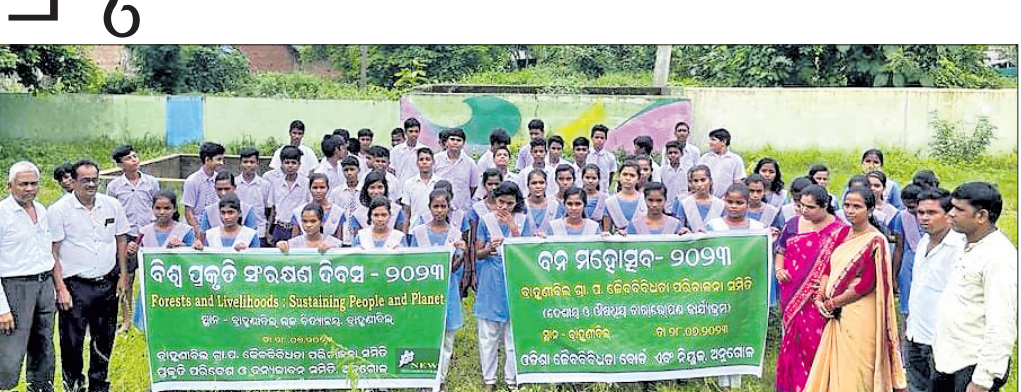
କାର୍ଯ୍ୟକ୍ରମରେ ଭାଗ ନେଇଥିବା ଅତିଥିକ ସହ ଛାତ୍ରାଛାତ୍ରୀମାନେ।

ଛେଡ଼ିପଦା, ୩୦/୭ (ଅଜିତ ଧଳ) ଛେଡ଼ିପଦା ରୁକ୍ଷ ବ୍ରାହ୍ମଣାଦିଲ ଉଚ୍ଚ ବିଦ୍ୟାଳୟରେ ବିଶ୍ୱ ପ୍ରକୃତି ସଂରକ୍ଷଣ ଦିବସ ପାଳନ ଅବସରରେ ଏକ ସଚେତନତା କାର୍ଯ୍ୟକ୍ରମ ଅନୁଷ୍ଠିତ ହୋଇଯାଇଛି।