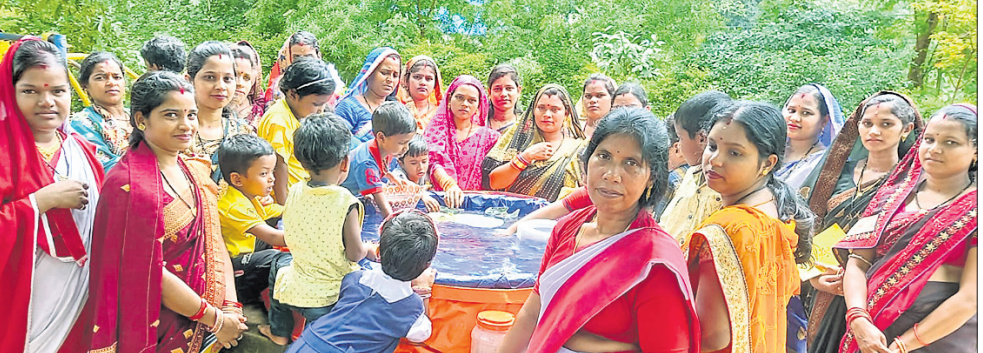
କର୍ମଶାଳାରେ ଯୋଗଦେଇଥିବା ଆରାମ୍ୟ, ଶିକ୍ଷାନୁଷ୍ଠାନର ଆରାମ୍ୟ, ଛାତ୍ରାଛାତ୍ରୀମାନେ।

ଡେକାନାଲ, ୩୦/୭ (ରତନ ନାୟର) ଡେକାନାଲ ସଦର ରୁକ୍ଷ ଅନ୍ତର୍ଗତ ଗଉଡିଆ ଖମ୍ବାର ସରସ୍ୱତୀ ଶିଶୁ ବିଦ୍ୟାଳୟରେ ମା'ମାନଙ୍କୁ ନେଇ 'ଶିଶୁବିକା ମାତୃ କର୍ମଶାଳା' ରବିବାର ଅନୁଷ୍ଠିତ ହୋଇଯାଇଛି।