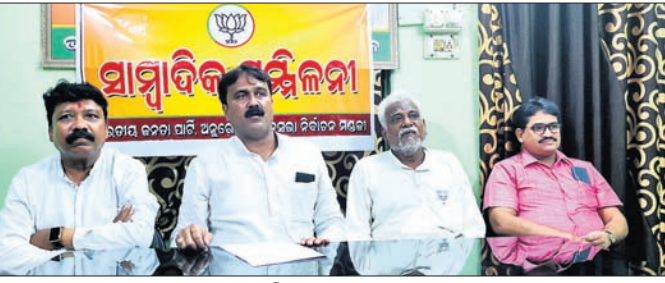
ଖବରଦାତା ସମ୍ମିଳନୀରେ ଭାଗପା ନେତୃବୃନ୍ଦ।

ଅନୁଗୋଳ, ୩୦/୭ (ଅମିତ ସାହୁ) ଆପଦା ଡିସେମ୍ବର ସୁଦ୍ଧା କଟକ-ସମ୍ବଲପୁର ୫୫ ନଂ. ଜାତୀୟ ରାଜପଥର ସମ୍ପୂର୍ଣ୍ଣ କାର୍ଯ୍ୟ ସମ୍ପୂର୍ଣ୍ଣ ହେବ।