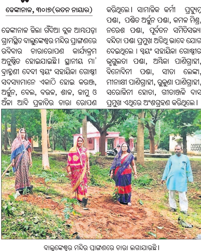
ବାଲୁକେଶ୍ୱର ମନ୍ଦିର ପ୍ରାଙ୍ଗଣରେ ଚାରା ଲଗାଯାଇଛି।