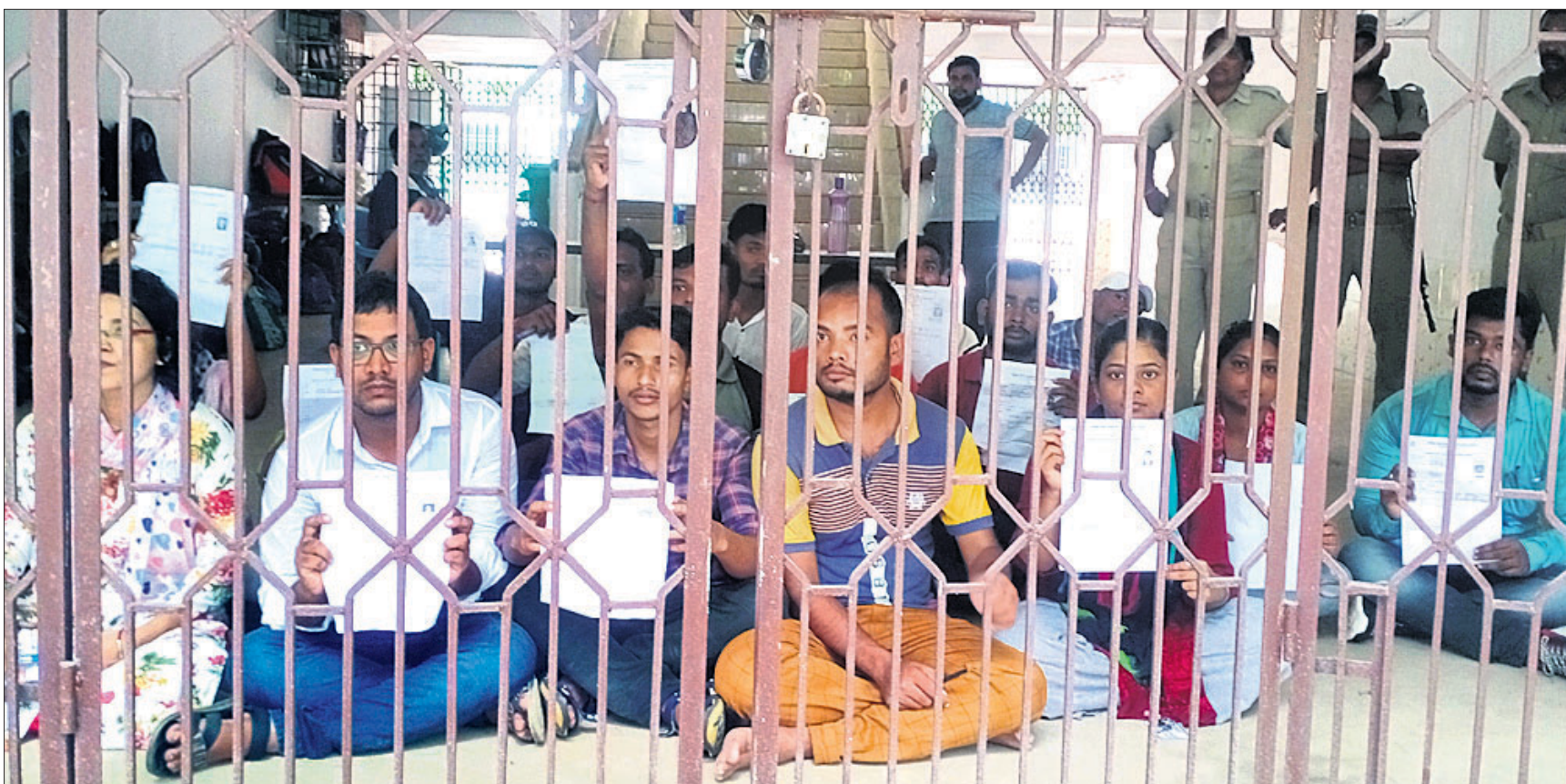
ଓଏସ୍‌ସ୍‌ସି ଦ୍ୱାରା ପରିଚାଳିତ ସୁଧୁଲ୍‌ବି ଆକାଉଣ୍ଟସ୍ ପଦବୀ ପରୀକ୍ଷା ପ୍ରଶ୍ନପତ୍ର ଲିକ୍ ଅଭିଯୋଗରେ ରବିବାର ଭଦ୍ରକ କଲେଜ ପରିସରରେ ପରୀକ୍ଷାର୍ଥୀମାନେ ଧାରଣାରେ ବସିଛନ୍ତି।