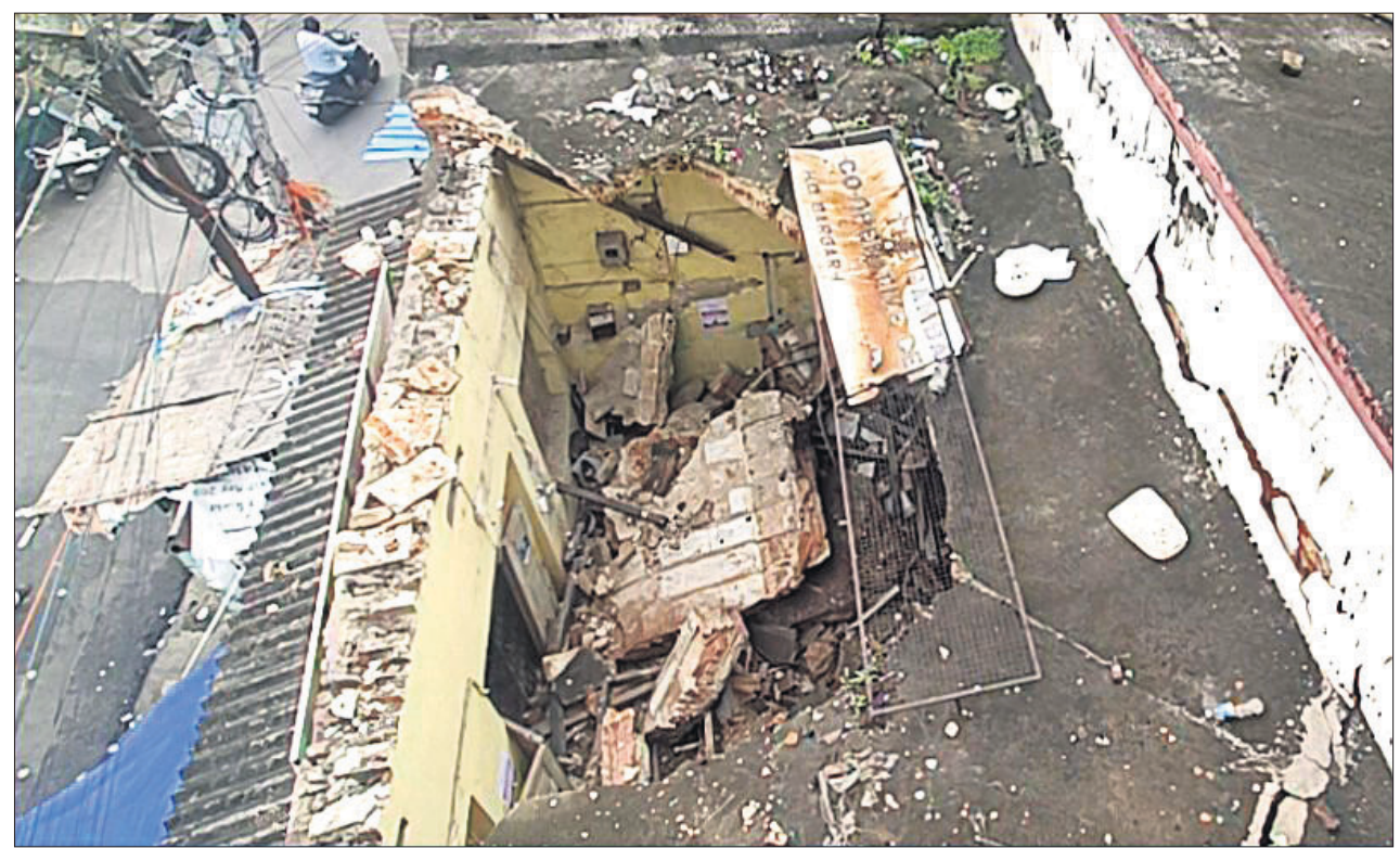
ସମ୍ବଲପୁର କୁଞ୍ଜଳପଡ଼ା ବ୍ୟାଙ୍କ ଛାଡ଼ ଭୁଞ୍ଜି ପଡ଼ିଛି।