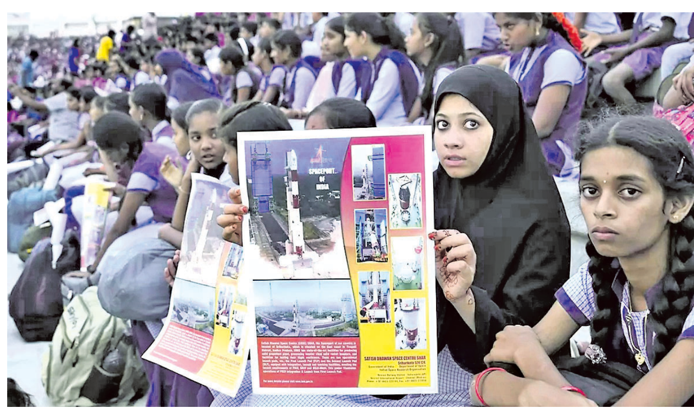
ଶ୍ରୀହରିକୋଟାର ସତୀଶ ଧାଢ଼ନ ମହାକାଶ କେନ୍ଦ୍ରରେ ପିଏସ୍‌ଏଲ୍‌ସି-୨୫୨ର ଉଦ୍ଦେଶ୍ୟକୁ ଛାତ୍ରାଛାତ୍ରୀ ଦେଖୁଛନ୍ତି।

ଶ୍ରୀହରିକୋଟା, ୩୦.୭: ଭାରତୀୟ ମହାକାଶ ଗବେଷଣା ସଂଗଠନ (ଇସ୍ରୋ) ଏହାର ପିଏସ୍‌ଏଲ୍‌ସି ରକେଟ ସହାୟତାରେ ରବିବାର ସିଙ୍ଗାପୁରର ୭ଟି ଉପଗ୍ରହକୁ ନିର୍ଦ୍ଧାରିତ କକ୍ଷପଥରେ ସଫଳତାର ସହ ଅବସ୍ଥାପିତ କରିଛି। ଆନ୍ଧ୍ରପ୍ରଦେଶ ଶ୍ରୀହରିକୋଟାର ସତୀଶ ଧାଢ଼ନ ମହାକାଶ କେନ୍ଦ୍ରକୁ ସକାଳ ୬ଟା ୩୧ ମିନିଟ୍ରେ ପିଏସ୍‌ଏଲ୍‌ସି ରକେଟ୍‌ରେ ଲାନ୍ଚ କରାଯାଇଥିଲା। ଏହାର ପ୍ରାୟ ୨୩ ମିନିଟ୍ ପରେ ପ୍ରଥମେ ମୁଖ୍ୟ ସାଟେଲାଇଟ୍ ଡିଏସ୍-ଏସ୍‌ଏଆର୍ ରକେଟ୍‌କୁ ଅଲଗା ହୋଇଥିଲା। ପରେ ପରେ ଅନ୍ୟ ୬ଟି ସାଟେଲାଇଟ୍ ଅଲଗା ହୋଇ ସେମାନଙ୍କ କକ୍ଷପଥରେ ଅବସ୍ଥାପିତ ହୋଇଥିଲେ। ଏହି ମିଶନ ସମୟରେ ବୈଜ୍ଞାନିକମାନେ ରକେଟ୍‌ର ଚତୁର୍ଥ ଷ୍ଟେଜ୍ ଉପରେ ଏକ୍ସପ୍ଲୋଜିଭ୍ କରିବାକୁ ନିଷ୍ପତ୍ତି ନେଇଥିଲେ। ବିଦେଶୀ ସାଟେଲାଇଟ୍‌ଗୁଡ଼ିକୁ ୫୩୭ କିଲୋମିଟର ଉଚ୍ଚ କକ୍ଷପଥରେ ଅବସ୍ଥାପିତ କରିବା ପରେ ରକେଟ୍ ମହାକାଶ ବର୍ଷ ସମସ୍ୟାର ସମାଧାନ ପାଇଁ ୩୦୦ କିଲୋମିଟର ନିମ୍ନ କକ୍ଷପଥକୁ ଓହ୍ଲାଇ ବୋଲି ଇସ୍ରୋ ଅଧିକାରୀ ସୂଚନା ଦେଇଛନ୍ତି।