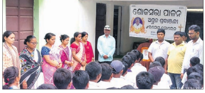
ଶୋକସଭାରେ ଉପସ୍ଥିତ ଶିକ୍ଷୟତ୍ରୀ, ଶିକ୍ଷକ ଓ ଛାତ୍ରଛାତ୍ରୀ ।