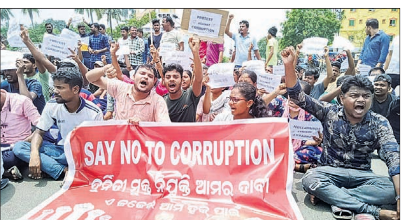
ବାଲେଶ୍ୱର ଜିଲ୍ଲାପାଳଙ୍କ ଅଧିକ ସମ୍ମୁଖରେ ଛାତ୍ରାଛାତ୍ରୀଙ୍କ ବିକ୍ଷୋଭ।

ବାଲେଶ୍ୱର, ୩୧୧୭ (ମାନ୍ୟ ବିଶ୍ୱାଳ) ଓଡ଼ିଶା ଷ୍ଟାଫ୍ ସିଲେକ୍ସନ କମିଶନ (ଓଏସ୍‌ଏସ୍‌ସି) ଦ୍ୱାରା ପରିଚାଳିତ ଜେଇଇ ସିଲିଲ୍ ମେନ ପରୀକ୍ଷାର ପ୍ରଶ୍ନପତ୍ର ଲିକ୍ ନେଇ ସାରା ରାଜ୍ୟରେ ଅପତୋଷ ବୁଦ୍ଧି ପାଉଥିବା ବେଳେ ଆଶାୟୀ ଛାତ୍ରାଛାତ୍ରୀମାନେ ଆନ୍ଦୋଳନମୁହାଁ ହୋଇଛନ୍ତି। ସୋମବାର ବାଲେଶ୍ୱର ଜିଲ୍ଲାପାଳଙ୍କ ଅଧିକ ସମ୍ମୁଖରେ ବାଲେଶ୍ୱର, ଭଦ୍ରକ ଓ ମୟୂରଭଞ୍ଜ ଜିଲ୍ଲାର ଶତାଧିକ ଆଶାୟୀ ଛାତ୍ରାଛାତ୍ରୀ ଏକାଠି ହୋଇ ହୋଇଛନ୍ତି। ଏହି ମାମଲାରେ କଢ଼ିତ ଦୋଷୀଙ୍କ ବିରୋଧରେ ଦୃଢ଼ କାର୍ଯ୍ୟାନୁଷ୍ଠାନ ଦାବି କରିଛନ୍ତି। କେବଳ ଜେଇଇ ସିଲିଲ୍ ମେନ ପରୀକ୍ଷା ରୁହେଁ,