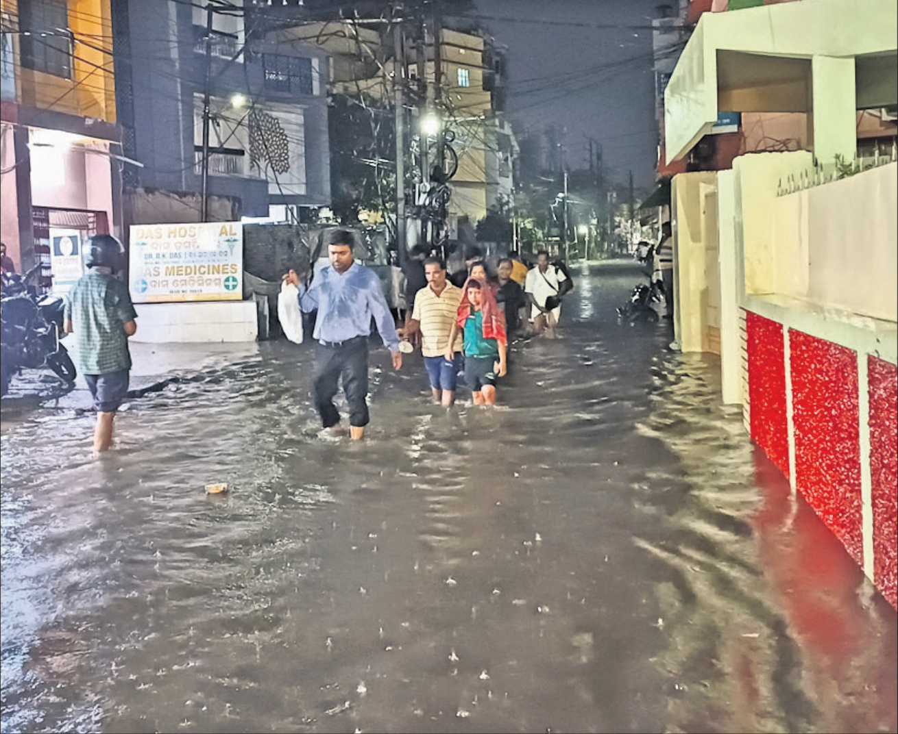
ସୋନୁଙ୍କୁ ଆପତ୍ତ୍ୟୁ ହୋଇଥିବା ବର୍ଷାରେ କଟକ ଫ୍ରେଣ୍ଡସ କଲୋନୀ ରାସ୍ତାରେ ପାଣିର ସୁଅ ଛୁଟୁଛି। ଲୋକେ ପାଣିରେ ପଶି ଯାତାୟାତ କରୁଛନ୍ତି।

ଅଭିନେତା ସୋନୁ ସୁଦ୍ଧଙ୍କ ଶନିବାର ଜନ୍ମଦିନ ଅବସରରେ ପ୍ରଶଂସକମାନେ ତାଙ୍କ ପାଇଁ ୧ ଲକ୍ଷ ୧୬ ହଜାର ବର୍ଗ ଫୁଟର ଏକ ପଦ ଆର୍ଥ ଉପହାର ସ୍ୱରୂପ ଦେଇଛନ୍ତି।