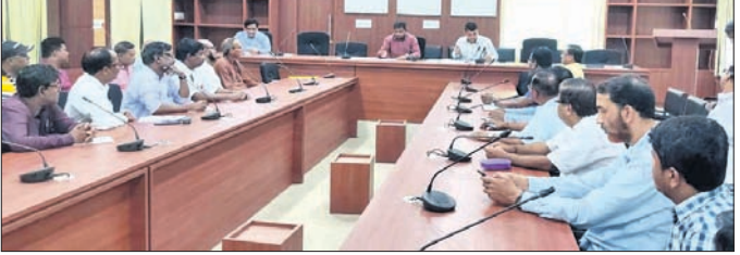
ବୈଠକରେ ଉପସ୍ଥିତ ପ୍ରଶାସନିକ ଅଧିକାରୀମାନେ।

୮.୧୫ ରେ ଜାତୀୟ ପତା ମହାମ୍ଫା ଗାନ୍ଧୀଙ୍କ ପ୍ରତିମୂର୍ତ୍ତି ନିକଟରେ ପତାକା ଉତ୍ତୋଳନ, ମହାପୁରୁଷଙ୍କୁ ପୁଷ୍ପମାଳ୍ୟ ଅର୍ପଣ ଓ ସକାଳ ୯ ଘଟିକା ସମୟରେ ସ୍ଥାନୀୟ ନେତୃତ୍ୱ ସ୍ଵାଭିମ୍ବନରେ ଜାତୀୟ ପତାକା ଉତ୍ତୋଳନ କରାଯିବ ବୋଲି ନିଶ୍ଚିତ ହୋଇଛି। କାର୍ଯ୍ୟକ୍ରମକୁ ଉପଖଣ୍ଡ ସଭାପତିତ୍ୱରେ ସ୍ଵାଧୀନତା ଦିବସକୁ ଜାତୀୟ ଚେତନା ସହ ପାଳନ କରିବା ପାଇଁ ଉପଜିଲ୍ଲାପାଳ ଆହ୍ଵାନ ଦେଇଥିଲେ। ବିଭିନ୍ନ ବିଭାଗକୁ ଦାୟିତ୍ୱ ହସ୍ତାନ୍ତର କରାଯାଇଥିଲା। ସମସ୍ତ ସରକାରୀ ଓ ବେସରକାରୀ ଅନୁଷ୍ଠାନରେ ସକାଳ ୭.୩୦ ସୁଦ୍ଧା ଜାତୀୟ ପତାକା ଉତ୍ତୋଳନ,