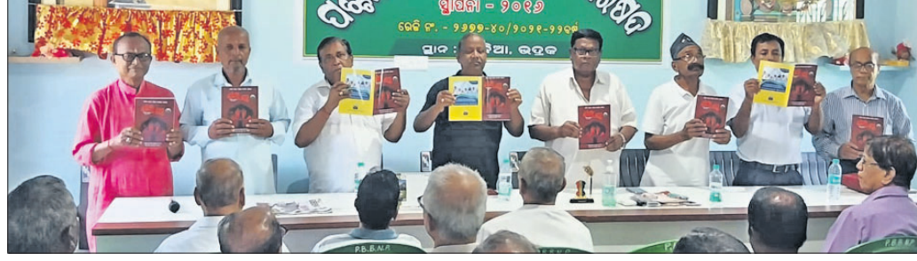
ପଶ୍ଚିମ ଭଦ୍ରକ ବରିଷ୍ଠ ନାଗରିକ ପରିଷଦର ବାର୍ଷିକ ଉତ୍ସବରେ ଅତିଥିମାନେ ପୁସ୍ତକ ଉନ୍ମୋଚନ କରୁଛନ୍ତି ।