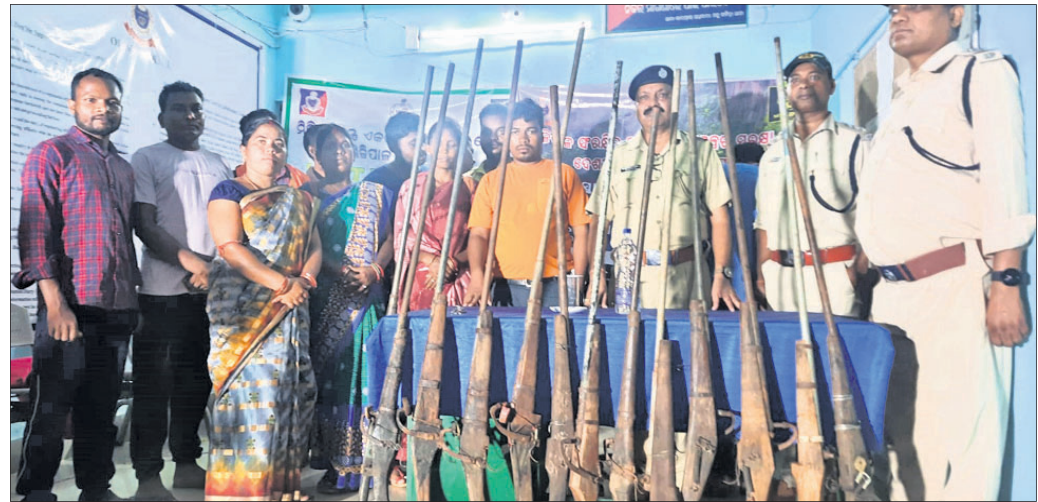
ମହୁଲଡ଼ିହା ଥାନା ଜମା ଦିଆଯାଇଥିବା ଦେଶୀ ବନ୍ଧୁକ ।

ଶିମିଳିପାଲର ସୁରକ୍ଷା ପାଇଁ ବନ୍ଧୁକ ସମର୍ପଣ ଅଭିଯାନରେ କିଛିଟା ସଫଳତା ମିଳିଛି । ପୋଲିସ ପକ୍ଷରୁ ଧାର୍ଯ୍ୟ ଶେଷ ତାରିଖରେ ମହୁଲଡ଼ିହା ଥାନା ଅଞ୍ଚଳର ଶିକାରୀମାନେ ମୋଟ ୧୮ ଠାକୁରପୁଣ୍ଡା ଥାନା ଅଞ୍ଚଳର ଶିକାରୀ ଗୋଟିଏ ଦେଶୀ ବନ୍ଧୁକକୁ ମିଶାଇ ମୋଟ ୧୯ ବନ୍ଧୁକ ନିଜ ନିଜ ପଞ୍ଚାୟତ ସରପଞ୍ଚମାନଙ୍କ ନିକଟରେ ସମର୍ପଣ କରିଛନ୍ତି । ଶିକାରୀମାନେ ଏତେ ସଂଖ୍ୟକ ବନ୍ଧୁକ ଫେରାଇବା ଘଟଣା ଆଗାମୀ ଦିନରେ ଶିମିଳିପାଲ ସୁରକ୍ଷା ଦିଗରେ ସହାୟକ ହେବ ବୋଲି ବନ ବିଭାଗ ଆଶାବ୍ୟକ୍ତ କରିଛି ।