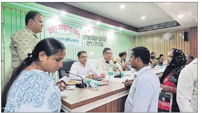
ଜନଶୁଣାଣି ଶିବିରରେ ଲୋକଙ୍କ ଅଭିଯୋଗ ଶୁଣୁଛନ୍ତି ଅଧିକାରୀ ।