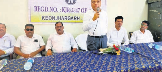
ଉପସ୍ଥିତ ଆଇନଜୀବୀମାନେ ।

କେନ୍ଦୁଝର, ୩୧।୭ (ନରେଶ ଚନ୍ଦ୍ର ପଟ୍ଟନାୟକ/ବାପକ ମିଶ୍ର)