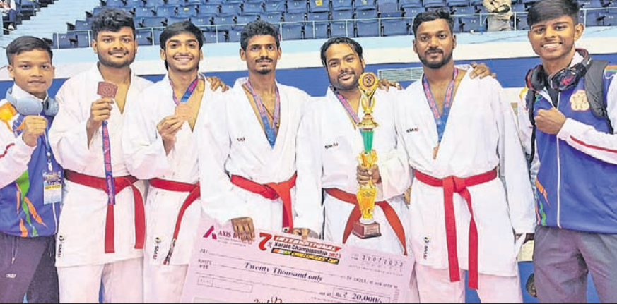
ଇଣ୍ଡିଆନ୍ ଚ୍ୟାଲେଞ୍ଜ୍ କପ୍ ଅନ୍ତର୍ଜାତୀୟ କରାଚେରେ ଅଂଶଗ୍ରହଣ କରିଥିବା ଓଡ଼ିଶା କରାଚେକା।