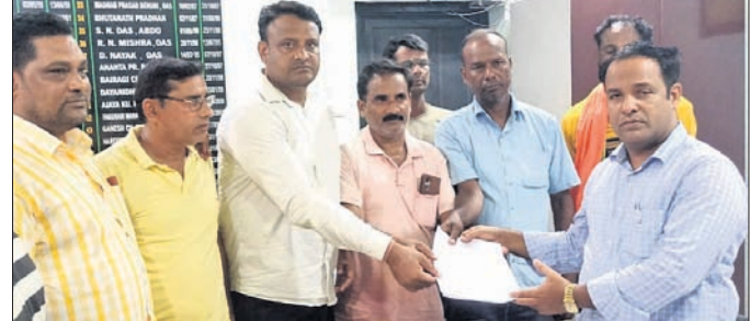
ବିତିଓ ସଂଖ୍ୟାଧିକ ରାଉତକୁ ଦାବିପତ୍ର ପ୍ରଦାନ କରାଯାଇଛି।