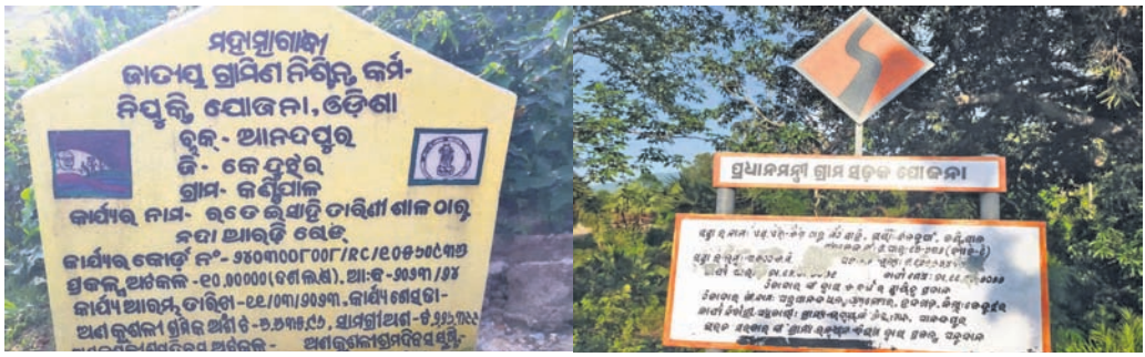
ଗୋଟିଏ ରାସ୍ତା ପାଇଁ ଲାଗିଥିବା ଦୁଇ ଯୋଜନାର ଫଳକ ।

ଆନନ୍ଦପୁର/କଟକ, ୩୧।୭ (ସଂକ୍ଷେପ ରାଜତ/ସୁଶାନ୍ତ କୁମାର ସାହୁ)