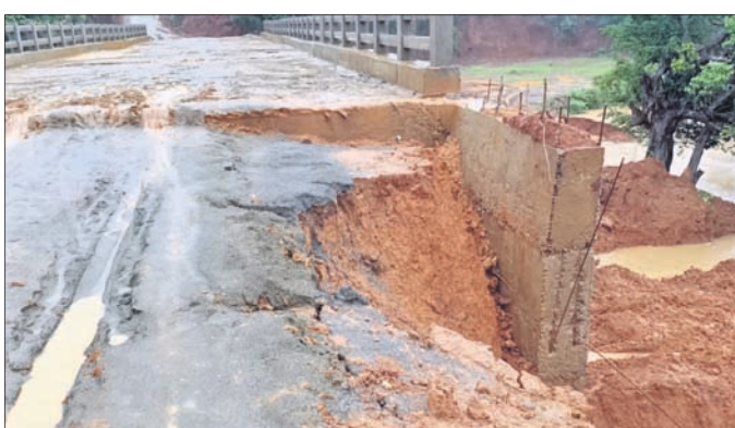
ନିର୍ମାଣାଧୀନ ପୋଲର ଆସ୍ତ୍ରୋର୍ ରାସ୍ତା ଦବିଯାଇଛି ।

କଳାହାଣ୍ଡି ଜିଲ୍ଲା ଥୁଆମୁଳ ରାମପୁର ବ୍ଲକ୍ ଅନ୍ତର୍ଗତ ବିଶାଳଗିରି-ତଳଖାପି ମଧ୍ୟରେ ଥିବା ଚଞ୍ଚରା ନାଳରେ ନିର୍ମାଣାଧୀନ ପୋଲର ଆସ୍ତ୍ରୋର୍ ରାସ୍ତା ବର୍ଷା ଯୋଗୁ ଦବିଯାଇଥିବା ଦେଖିବାକୁ ମିଳିଛି । ଫଳରେ ପୋଲର ଘାୟିତ୍ୱକୁ ନେଇ ଏବେ ସାଧାରଣରେ ପ୍ରଶ୍ନବାଚୀ ସୃଷ୍ଟି ହୋଇଛି । ଗ୍ରାମ୍ୟ ଉନ୍ନୟନ ବିଭାଗ ପକ୍ଷରୁ ଏହି ପୋଲ ନିର୍ମାଣ କରାଯାଇଥିବା ବେଳେ ନିମ୍ନମାନର କାର୍ଯ୍ୟ ହୋଇଥିବା ଅଭିଯୋଗ ହୋଇଛି । ଯାହାର ପ୍ରମାଣ ଗୋଟିଏ ବର୍ଷାରେ ପୋଲର ଆସ୍ତ୍ରୋର୍ ରାସ୍ତା ଦବିଯିବା ଘଟଣାରୁ ଜଣାପଡ଼ିଛି । ତେବେ