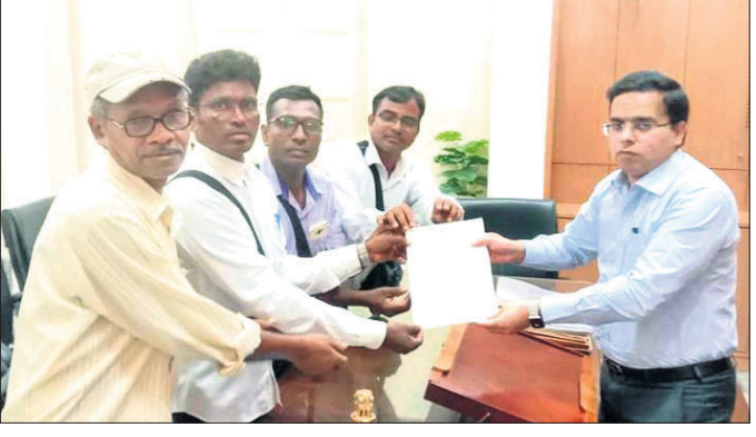
ଜିଲ୍ଲାପାଳ ବିନୀତ ଭରଦ୍ୱାଜଙ୍କୁ ଦାବିପତ୍ର ପ୍ରଦାନ କରାଯାଇଛି।