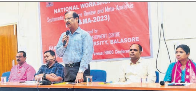
କର୍ମଶାଳାରେ ଉପସ୍ଥିତ ଅତିଥିଗଣ।

ବାଲେଶ୍ଵର ଫକୀରମୋହନ ବିଶ୍ଵବିଦ୍ୟାଳୟର ମାନବ ସମ୍ବଳ ବିକାଶ କେନ୍ଦ୍ର ଆନୁକୂଲ୍ୟରେ ‘ବ୍ୟବସ୍ଥିତ ସାହିତ୍ୟାନୁଶୀଳନ ଓ ଅଧି-ସମୀକ୍ଷା’ ଶୀର୍ଷକ ପଞ୍ଚଦିନିଆ ଜାତୀୟ କର୍ମଶାଳା ସୋମବାର ଉଦଘାଟିତ ହୋଇଛି। ଏଥିରେ ଫକୀରମୋହନ ବିଶ୍ଵବିଦ୍ୟାଳୟ ସମେତ ଉତ୍କଳ ବିଶ୍ଵବିଦ୍ୟାଳୟ, ସମ୍ବଲପୁର ବିଶ୍ଵବିଦ୍ୟାଳୟ, ଗଙ୍ଗାଧର ମେହେର ବିଶ୍ଵବିଦ୍ୟାଳୟ, ସାମୀ ବିଦେଶୀୟ ପୁନର୍ବାସ ପ୍ରଶିକ୍ଷଣ ଓ ଅନୁସନ୍ଧାନ ପ୍ରତିଷ୍ଠାନ କଟକ, ନ୍ୟାଶନାଲ ଇନଷ୍ଟିଚ୍ୟୁଟ୍ ଅଫ୍ ଟେକ୍ନୋଲୋଜି ରାଉରକେଲା, ରାଷ୍ଟ୍ର ବିଶ୍ଵବିଦ୍ୟାଳୟ