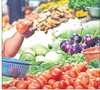
ଅଧିକ ସମୟ ଯାଏ, ସେମାନଙ୍କୁ ଜମିରେ ଅଧିକ ପରିଶ୍ରମ, କଳସେଚନଠାରୁ ସବୁ ଖର୍ଚ୍ଚ ଅଧିକ ପଡ଼ିଥାଏ। ଏପରିକି ଯେତେବେଳେ ଗଛ ଭୂତଳ ଓଜୋନକୁ ଅଧିକ ପରିମାଣରେ ଶୋଷଣ କରେ, ସେବେ ଆଲୋକ ସଂଶ୍ଳେଷଣ ପ୍ରକ୍ରିୟା ବାଧାପ୍ରାପ୍ତ ହୁଏ। ଫଳସ୍ୱରୂପ ଫସଲ ଠିକ୍ ଭାବରେ ବଢ଼ିପାରେନି ଓ ରୋଗଯୋଗ ସହଜରେ ହୋଇପାରେନାହିଁ। ଜଳବାୟୁ ପରିବର୍ତ୍ତନ ଜଙ୍ଗଲ ନିଆଁ ଉପରେ ବି ଅଧିକ ପ୍ରଭାବ ପକାଇଥାଏ। ଫଳସ୍ୱରୂପ ଏହା ଆଖପାଖ ଚାଷ ଜମି ଓ ଗୋଡ଼ର ଜମି ନଷ୍ଟ କରିବାର ସାହାଯ୍ୟ କରିଥାଏ। ଚଳିତ ବର୍ଷ ରାଜ୍ୟରେ ଅଧିକ ଚାପମାତ୍ରା ଅନୁଭବ କରିଛେ। ଚାପମାତ୍ରାରେ ପରିବର୍ତ୍ତନ ଯୋଗୁ କୃଷି କାର୍ଯ୍ୟରେ ନାହିଁ ନ ଥିବା ଅସୁବିଧା ଦେଖିବାକୁ ମିଳୁଛି। ଅଧିକ ଚାପମାତ୍ରାକୁ

ସହ୍ୟ କରି ଚାଷୀଟିଏ ନିଜ ଜମିରେ ଚାଷ କରେ, ରୋଗଯୋଗ ଅଧିକ ଲାଗିଲେ କାତନାଶକ ଷ୍ଟେ କରିବା ଯୋଗୁ ପରିବେଶ ସବୁଜ ନଷ୍ଟ ହୁଏ। ଏବେ ବଜାରକୁ ପରିବା ଜିଣିବାକୁ ଗଲେ ପରିବରଣର ତତ୍ତା ଦର ବିଷୟରେ ଶୁଣି ଆଶ୍ଚର୍ଯ୍ୟ ହେଉଥିବେ ନିଶ୍ଚୟ। ସବୁ ଖବରରେ ପରିବା ଦର ଆକଶମୁଖୀ ଏମିତି ଶୀର୍ଷକ ପୃଷ୍ଠା ମଣ୍ଡନ କରୁଛି। କିନ୍ତୁ ଚାଷୀଟିଏ ଫସଲ ଉତ୍ପାଦନ କରି ଲାଭ ପାଇପାରନ୍ତି। ଜଳବାୟୁ ପରିବର୍ତ୍ତନ ଗୋଟିଏ ପଟେ ଉତ୍ପାଦ କମାଇଥିବା ବେଳେ ଲୋକମାନଙ୍କ ମନରେ ଚାଷ ପାଇଁ ଉତ୍ସାହ ଓ ଆଗ୍ରହ ବି ସମପରିମାଣରେ କମିଛି। ଆମେ ସହରୀକରଣ ଚାଷୀରେ ଆଉ ନିଜ ବାଡ଼ିରେ ପରିବରଣଟିଏ ବି ଲଗାଉନାହିଁ। ପାକଶାଳା ବଗିଚା ଆଉ ରୁଟିଫର୍ମ ଗାଡ଼େନିଂ ଆଜି କେବଳ କଥାରେ ସୀମିତ ରହିଯାଇଛି। ସହରରେ ରହିଲେ ମଧ୍ୟ ଆମେ ଛାତ ଉପରେ ବାଲଗଣ, ଲାକା ପରି ଅନେକ ଫସଲ କରିପାରିବା, ଯାହା ଆମ ନିତ୍ୟ ବ୍ୟବହାର ପାଇଁ ଉପଯୋଗ ହୋଇପାରିବ। ଉତ୍ପାଦନ ବଢ଼ାଇବାରେ ସାହାଯ୍ୟ କରିଥିବା ବୃକ୍ଷଜାତିକ ଚାଷ ବା କଣ୍ଟାକୁ ଫାର୍ମିଂ। ଆଜି ସମସ୍ତ କୃଷିତ ଚାଷୀମାନେ ହେଉଛନ୍ତି। ଉଦ୍ୟୋଗୀମାନେ କେବଳ ନୂଆ ଫଳ କି ପରିବା ରୁହେଁ ବରଂ ନେତ୍ରହୀନ, ପଲିଭାଉସ କରି ଅର୍ଥ ବିକ୍ରମ ଚାଷ ଉପରେ ଗୁରୁତ୍ୱ ଦେବା ଦରକାର। ରାଜ୍ୟରେ ଶୀତକଞ୍ଚାଭରଣ ଅବ୍ୟବସ୍ଥା ମଧ୍ୟ ଦରଦାମ ବୃଦ୍ଧିର ଅନ୍ୟ ଏକ କାରଣ। ଆମେ ଉତ୍ପାଦ କରୁଛେ ସତ କିନ୍ତୁ ଗଠିତ କରି ରଖିବା ପାଇଁ ଆମ ପାଖରେ ଶୀତକଞ୍ଚାଭରଣ ଅଭାବ ରହୁଛି। ଆମେ ଅନ୍ୟ ରାଜ୍ୟ ଉପରେ ନିର୍ଭର କରୁଛୁ। କୃଷି ଉଦ୍ୟୋଗୀମାନେ କିପରି ନିଜ ରାଜ୍ୟରେ ବୈଜ୍ଞାନିକ ଜ୍ଞାନବୈଶିଷ୍ଟ୍ୟକୁ ପ୍ରୟୋଗ କରି ଚାଷ କରାଯାଇପାରିବ, ସେ ଦିଗରେ ଧ୍ୟାନ ଦେବାର ସମୟ ଅଛି। ନିଜ ବାଡ଼ିବଗିଚାକୁ ଖାଲି ନ ପକାଇ ସେଥିରେ କିଛିଟା ଫସଲ ଲଗାନ୍ତୁ। ଆମକୁ ଆର୍ଥିକନିର୍ଭରଶୀଳ ହେବାକୁ ପଡ଼ିବ। ଏକ ସବୁଜମାନସ ପୃଥ୍ୱୀ ଗଠନରେ ନିଜକୁ ସାମିଲ କରିବାକୁ ହେବ। ଏହା ଆମ ସମଗ୍ର ପାଇଁ ଆଶ୍ୱାନ।