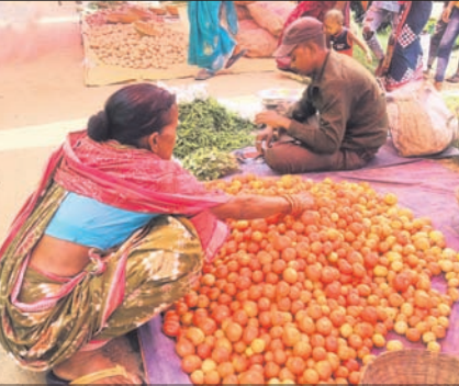
ଟମାଟୋ ବିକ୍ରି କରୁଛନ୍ତି ଜଣେ ଖୁନ୍ତରା ବ୍ୟବସାୟୀ।

ସମ୍ବଲପୁର, ୩୧୧୭ (ଶୁଭାଶିଷ ପାଠୀ) ଗତ ଭୁବ୍ ମାସରୁ ରାଜ୍ୟରେ ଟମାଟୋ ଦର ଅନିୟନ୍ତ୍ରିତ ହୋଇରହିଛି। ଜିଲା ସ୍ତରରେ ଏହାର ଦର ଭଲ ରହୁଛି। ପାଣିପାଗରେ ଅନିୟମିତତା, ଅଧିକ ଖରା ଯୋଗୁ ଉତ୍ପାଦନ ହ୍ରାସ, ବର୍ଷା, ବନ୍ୟା, ରାସ୍ତା ସମସ୍ୟା ସହ ଗାଡ଼ି ଭଙ୍ଗା ବୃଦ୍ଧି ଯୋଗୁ ଟମାଟୋ ଦର ଉଚ୍ଚ ରହୁଥିବା କୁହାଯାଉଛି। ହେଲେ ସାପ୍ତାହିକ ଦର ନିୟନ୍ତ୍ରଣ କରିବା ନେଇ ପ୍ରଶାସନିକ ସ୍ତରରେ ଉଦ୍ୟମ କରାଯାଇ ନାହିଁ। ପ୍ରତିଦିନ ଟମାଟୋର ଉଚ୍ଚ ଦର ଖାଉଟିକାରୀଙ୍କୁ ଆହୁରି ତେଣୁ ଏହି ବ୍ୟବସାୟୀ ସହ ଜଡ଼ିତ ମଧ୍ୟମାନେ ଲାଭବାନ ହେଉଥିବା ବେଳେ ଖାଉଟି ଆର୍ଥିକ ଗୋଝରେ ବେହାଲ ହେଉଛି। କୁନ୍ତରେ ଜିଲାରେ ଟମାଟୋ କିଲୋ ପ୍ରତି ୪୦ରୁ ୬୦ ଟଙ୍କା ପର୍ଯ୍ୟନ୍ତ ରହିଥିବା ବେଳେ ଜିଲାରେ ଏହା ବୃଦ୍ଧି ପାଇ ଯୋଗଦାନ ୨୬୦ ଟଙ୍କାରେ ପହଞ୍ଚିଛି। ମାନେଶ୍ୱର ସାପ୍ତାହିକ ବଜାରରେ ଏହି ଦରକୁ ନେଇ ଖାଉଟି ଆଶ୍ଚର୍ଯ୍ୟଚକିତ ହୋଇଯାଇଥିଲେ। କେବଳ ମାନେଶ୍ୱର ରୁହେଁ, ସମ୍ବଲପୁର ସହରର ବିଭିନ୍ନ ଖୁନ୍ତରା ବ୍ୟବସାୟୀ ଏହି ଦରରେ ବିକ୍ରି କରୁଥିଲେ। ଦର ବୃଦ୍ଧି ଯୋଗୁ ବଜାରରେ ଟମାଟୋ ଗାହକୀ ହ୍ରାସ ପାଇଛି। କେତେକଙ୍କ ହାତଗଣତି ଅଣଓଡ଼ିଆ ବେପାରୀ ଏହା ବିକ୍ରି କରୁଥିବା ଦେଖାଯାଇଥିଲା। ରାଜ୍ୟକୁ ଟମାଟୋ ବିଶେଷକରି ଆନ୍ଧ୍ରପ୍ରଦେଶ, କର୍ନାଟକ ଓ ମହାରାଷ୍ଟ୍ରର ଗଣ୍ୟକାରୀ ଆସିଥାଏ। ଦରଦାମ ନିୟନ୍ତ୍ରଣ କରିବା ପାଇଁ ଜିଲା ସ୍ତରରେ ଯୋଗାଣ ବିଭାଗ ଅଧିକାରୀ ନିୟୋଜିତ ଅଛନ୍ତି। ପ୍ରତିଦିନ କେତେ ଦରରେ ଟମାଟୋ ଜିଲାକୁ ଆସୁଛି, କେଉଁ ଭଲରମାନଙ୍କ କଟିଆରେ ଖୁନ୍ତରା ବେପାରୀଙ୍କୁ ଦିଆଗଲା ଏସବୁ ରିପୋର୍ଟ ମଧ୍ୟ ତିଆରି କରାଯାଉଛି। ହେଲେ ଖୁନ୍ତରା ବେପାରୀ ବଜାରରେ ଖାଉଟିମାନଙ୍କୁ ବିକ୍ରିକରିବା ସମୟରେ ଅଧିକ ଲାଭ ରଖୁଛନ୍ତି। ବିଶେଷକରି ଜୁଲାଇ-ଅଗଷ୍ଟ ଓ ଅକ୍ଟୋବର-ନଭେମ୍ବରରେ ଟମାଟୋ ଉତ୍ପାଦନ କମ୍ ହୋଇଥାଏ।