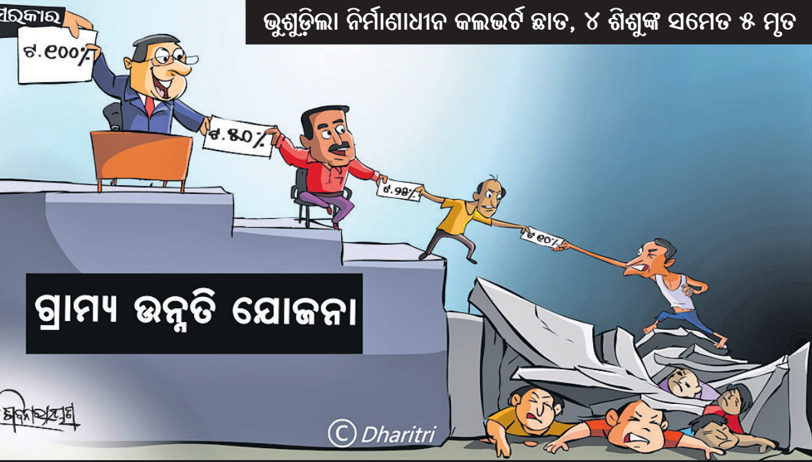
ଭୁଗୁଣ୍ଡିଲା ନିର୍ମାଣାଧୀନ କଲଭର୍ ଛାତ, ୪ ଶିଶୁଙ୍କ ସମେତ ୫ ମୃତ