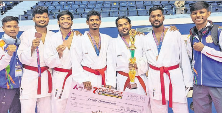
ଇଣ୍ଡିଆନ୍ ଚ୍ୟାଲେଞ୍ଜ୍ କପ୍ ଅନ୍ତର୍ଜାତୀୟ କରାଚେରେ ଅଂଶଗ୍ରହଣ କରିଥିବା ଓଡ଼ିଶା କରାଚେକା।