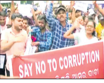
କର୍ତ୍ତୃପକ୍ଷଙ୍କ ପାଖକୁ ପ୍ରତିଶ୍ରୁତି ଚାହୁଁଛନ୍ତି।

ଦଲାଲକୁ ଚିରଫ କରିବା ଖବର ରାଜ୍ୟରେ ଚଳୁଛି ପକାଇଦେଇଛି। ଏହା ଉପରେ ସତ୍ୟର ମୋହର ଲଗାଇଛି ଓଡ଼ିଶା କର୍ମଚାରୀ ପ୍ରବରଣ ଆନ୍ଦୋଳ (ଓଏସଏସଏସ)। ପ୍ରଶ୍ନପତ୍ର ପ୍ରସ୍ତୁତକୁ ସ୍ୱୀକାର କରିନେଇ କେଜ ବିଭିନ୍ନ ମୁଖ୍ୟ ପରୀକ୍ଷାକୁ ରଦ୍ଦ କରିଦିଆ ଯାଇଛି ଏବଂ ପୁନର୍ବାର ପରୀକ୍ଷା ହେବ ବୋଲି ଘୋଷଣା କରାଯାଇଛି। ଏତିକିରେ କଥାଟି ଅମିତାଳ ନାହିଁ। ଓଏସଏସଏସ କାର୍ଯ୍ୟାଳୟ ସମ୍ମୁଖରେ କିଛି ପରୀକ୍ଷାପତ୍ର ବିକ୍ରୟ କରୁଛନ୍ତି। ଘଟଣାରେ ପୁନରାବୃତ୍ତି ନ ଘଟୁ ଦାବି କରୁଛନ୍ତି। କର୍ତ୍ତୃପକ୍ଷଙ୍କ ପାଖକୁ ପ୍ରତିଶ୍ରୁତି ଚାହୁଁଛନ୍ତି। କିନ୍ତୁ ଦୁର୍ଭାଗ୍ୟ ବିଷୟ ହେଉଛି ଏହି ଛାତ୍ରାଛାତ୍ରୀଙ୍କ ସହ ଆଲୋଚନା ମଧ୍ୟ କରାଗଲା ନାହିଁ। ସତେ ଯେମିତି ଏହା ଏକ ମାମୁଲି କଥା! କେ କେ କୁହାକୁହି ହେଲେଣି ପ୍ରଶ୍ନପତ୍ର ପ୍ରସ୍ତୁତ ହେବାରୁ କଥା ରୁହେଁ। ଏହା ପୂର୍ବରୁ ବହୁବାର ପ୍ରଶ୍ନପତ୍ର ପ୍ରସ୍ତୁତ ହୋଇଛି। ବିଭିନ୍ନ ସ୍ୱାକ୍ଷରକେତ ପରୀକ୍ଷାରେ ଏହା ହେଉଥିଲା। ଯେତେବେଳେ ଏହା ବାଣ୍ଟରେ ପଡ଼ି ହାତରେ ଗଡ଼େ ପରୀକ୍ଷା ବାତିଲ କରିଦିଆଯାଏ। ଆଉ କେତେବେଳେ ଏହାକୁ ଅସ୍ୱୀକାର କରି ଛାତ୍ରାଛାତ୍ରୀଙ୍କ ସମସ୍ତ ଆପଣ ଅଭିଯୋଗକୁ ପ୍ରତ୍ୟାଖ୍ୟାନ କରିଦିଆଯାଏ। ସମସ୍ତ ଉପରେ ଏହାର କୁପ୍ରଭାବ ପଡ଼ିବା କଥାଟିକୁ ଏତାଳ ଦିଆଯାଇପାରିବ ନାହିଁ। ଏକରୁ ଆରମ୍ଭ ହୁଏ କମ୍ ପରିଶ୍ରମ କରି ଅଧିକ ପ୍ରାପ୍ତ ହେବାର ପ୍ରବଣତା। କିନ୍ତୁ ନିୟୁତ ପାଇଁ ଉଦ୍ଦିଷ୍ଟ ପ୍ରତିଯୋଗିତାମୂଳକ ପରୀକ୍ଷାରେ ପ୍ରଶ୍ନପତ୍ର ପ୍ରସ୍ତୁତ ହେବା କଥାଟିକୁ ସହଜରେ ହଜମ କରିହେଉ ନାହିଁ। ଏହା ପଛରେ ଏକ ବଡ଼ ଧରଣର ଝାମ୍ପ ହୋଇଥାଏ। ସରକାରୀ ଓ ବେସରକାରୀ ବହୁ ଦାମାମାନୀ ଲୋକଙ୍କର ସମ୍ପୂର୍ଣ୍ଣ ଆଧାର ଅଥଚ