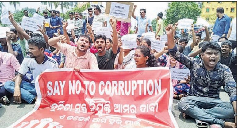
ବାଲେଶ୍ୱର ଜିଲ୍ଲାପାଳଙ୍କ ଅଧିକ ସମ୍ମୁଖରେ ଛାତ୍ରାଛାତ୍ରୀଙ୍କ ବିକ୍ଷୋଭ।

ବାଲେଶ୍ୱର, ୩୧୧୭ (ମାନ୍ୟ ବିଶ୍ୱାଳ) ଓଡ଼ିଶା ସ୍ୱାସ୍ଥ୍ୟ ସେଲେକ୍ସନ କମିଶନ (ଓଏସ୍‌ଏସ୍‌ସି) ଦ୍ୱାରା ପରିଚାଳିତ ଜେଲ ସିଲିଲ୍ ମେନ ପରୀକ୍ଷାର ପ୍ରଶ୍ନପତ୍ର ଲିକ୍ ନେଇ ସାରା ରାଜ୍ୟରେ ଅପତୋଷ ବୃଦ୍ଧି ପାଇଥିବା ବେଳେ ଆଶାୟୀ ଛାତ୍ରାଛାତ୍ରୀମାନେ ଆନ୍ଦୋଳନମୁହାଁ ହୋଇଛନ୍ତି। ସୋମବାର ବାଲେଶ୍ୱର ଜିଲ୍ଲାପାଳଙ୍କ ଅଧିକ ସମ୍ମୁଖରେ ବାଲେଶ୍ୱର, ଭଦ୍ରକ ଓ ମୟୂରଭଞ୍ଜ ଜିଲ୍ଲାର ଶତାଧିକ ଆଶାୟୀ ଛାତ୍ରାଛାତ୍ରୀ ଏକାଠି ହୋଇ ହୋଇଛନ୍ତି। ଏହି ମାମଲାରେ କଢ଼ିତ ଦୋଷୀଙ୍କ ବିରୋଧରେ ଦୃଢ଼ କାର୍ଯ୍ୟାନୁଷ୍ଠାନ ଦାବି କରିଛନ୍ତି। କେବଳ ଜେଲ ସିଲିଲ୍ ମେନ ପରୀକ୍ଷା ରୁହେଁ,