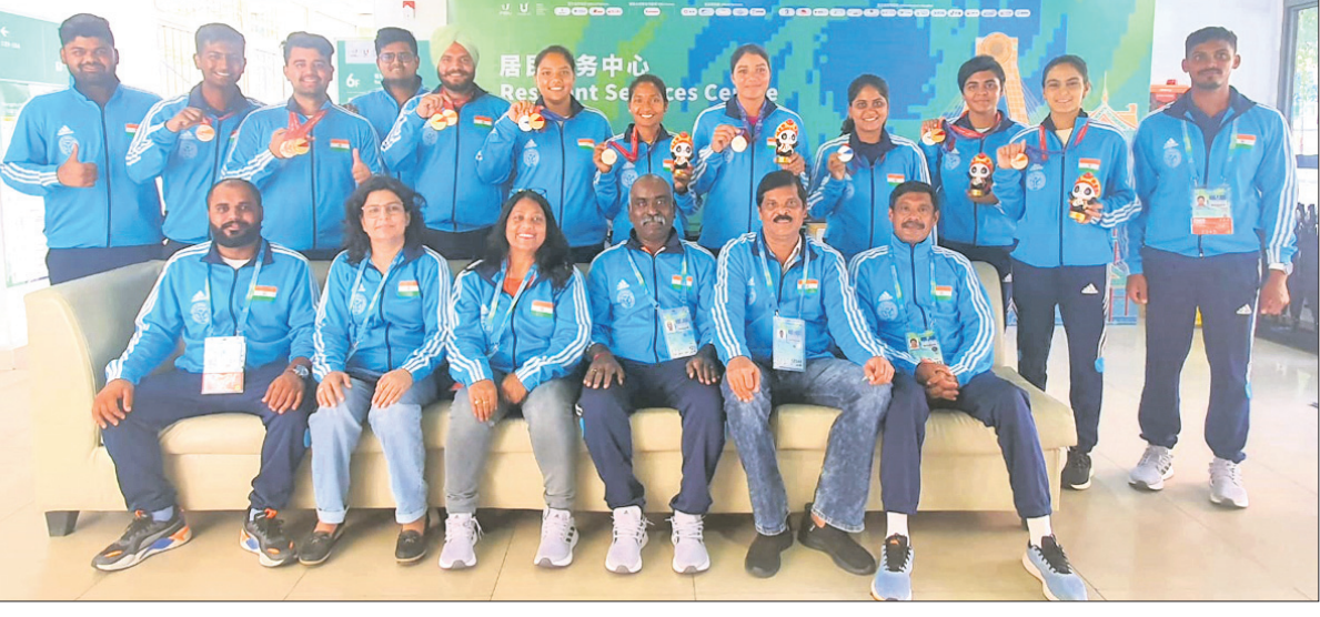
ପଦକ ସହ ଭାରତୀୟ ଚାରମାଜ ଦଳ।