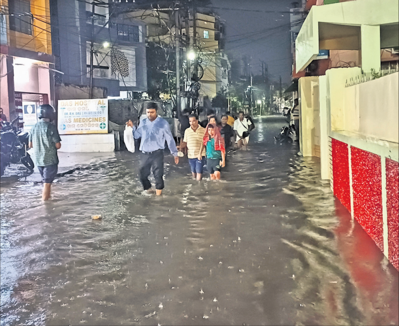
ସୋମବାର ଅପରାହ୍ନ ହୋଇଥିବା ବର୍ଷାରେ କଟକ ଫ୍ରେଣ୍ଡସ କଲୋନୀ ରାସ୍ତାରେ ପାଣିର ସୁଅ ଛୁଟୁଛି। ଲୋକେ ପାଣିରେ ପଶି ଯାତାୟାତ କରୁଛନ୍ତି।

ଅଭିନେତା ସୋନୁ ସୁଦ୍ଧଙ୍କ ଶନିବାର ଜନ୍ମଦିନ ଅବସରରେ ପ୍ରଶଂସକମାନେ ତାଙ୍କ ପାଇଁ ୧ ଲକ୍ଷ ୧୬ ହଜାର ବର୍ଗ ଫୁଟର ଏକ ପଦ୍ ଆର୍ତ୍ତ ଉପହାର ସ୍ୱରୂପ ଦେଇଛନ୍ତି।