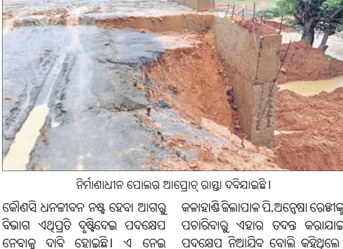
ନିର୍ମାଣାଧୀନ ପୋଲର ଆପ୍ରୋଚ ରାସ୍ତା ଦବିଯାଇଛି ।

କଳାହାଣ୍ଡି ଜିଲ୍ଲା ଥୁଆମୁଳ ରାମପୁର ବ୍ଲକ୍ ଅନ୍ତର୍ଗତ ବିଶାଳଗିରି-ତଳଖାପି ମଧ୍ୟରେ ଥିବା ଚଞ୍ଚରା ନାଳରେ ନିର୍ମାଣାଧୀନ ପୋଲର ଆପ୍ରୋଚ ରାସ୍ତା ବର୍ଷା ଯୋଗୁ ଦବିଯାଇଥିବା ଦେଖିବାକୁ ମିଳିଛି । ଫଳରେ ପୋଲର ଗ୍ଲାୟିଭୁ ନେଇ ଏବେ ସାଧାରଣରେ ପ୍ରଶ୍ନବାଚୀ ସୃଷ୍ଟି ହୋଇଛି । ଗ୍ରାମ୍ୟ ଉନ୍ନୟନ ବିଭାଗ ପକ୍ଷରୁ ଏହି ପୋଲ ନିର୍ମାଣ କରାଯାଇଥିବା ବେଳେ ନିମ୍ନମାନର କାର୍ଯ୍ୟ ହୋଇଥିବା ଅଭିଯୋଗ ହୋଇଛି । ଯାହାର ପ୍ରମାଣ ଗୋଟିଏ ବର୍ଷାରେ ପୋଲର ଆପ୍ରୋଚ ରାସ୍ତା ଦବିଯିବା ଘଟଣାରୁ ଜଣାପଡ଼ିଛି । ତେବେ