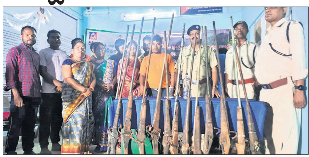
ମହୁଲଡ଼ିଆ ଥାନା ଜମା ଦିଆଯାଇଥିବା ଦେଶୀ ବନ୍ଧୁକ ।

ଶିମିଳିପାଲର ସୁରକ୍ଷା ପାଇଁ ବନ୍ଧୁକ ସମର୍ପଣ ଅଭିଯାନରେ କିଛିଟା ସଫଳତା ମିଳିଛି । ପୋଲିସ ପକ୍ଷରୁ ଧାର୍ଯ୍ୟ ଶେଷ ତାରିଖରେ ମହୁଲଡ଼ିଆ ଥାନା ଅଞ୍ଚଳର ଶିକାରୀମାନେ ମୋଟ ୧୮ ଠାକୁରପୁଣ୍ଡା ଥାନା ଅଞ୍ଚଳର ଶିକାରୀ ଗୋଟିଏ ଦେଶୀ ବନ୍ଧୁକକୁ ମିଶାଇ ମୋଟ ୧୯ ବନ୍ଧୁକ ନିଜ ନିଜ ପଞ୍ଚାୟତ ସରପଞ୍ଚମାନଙ୍କ ନିକଟରେ ସମର୍ପଣ କରିଛନ୍ତି । ଶିକାରୀମାନେ ଏତେ ସଂଖ୍ୟକ ବନ୍ଧୁକ ଫେରାଇବା ଘଟଣା ଆଗାମୀ ଦିନରେ ଶିମିଳିପାଲ ସୁରକ୍ଷା ବିଭାଗ ସହାୟକ ହେବ ବୋଲି ବନ ବିଭାଗ ଆଶାବାସୀ କରିଛନ୍ତି ।