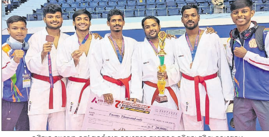
ଇଣ୍ଡିଆନ୍ ଟ୍ୟାଲେଣ୍ଟ୍ କପ୍ ଅନ୍ତର୍ଜାତୀୟ କରାଚେରେ ଅଂଶଗ୍ରହଣ କରିଥିବା ଓଡ଼ିଶା କରାଚେକା।