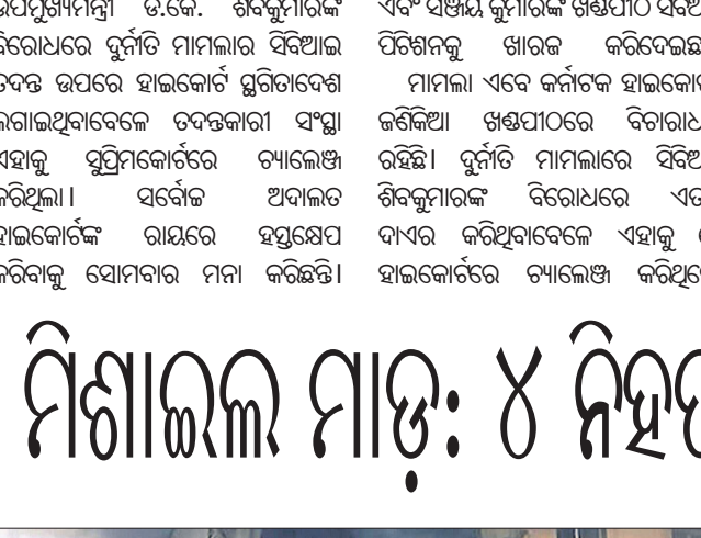
କ୍ଷେପଣାସ୍ତ୍ର ମାଡ଼ରେ ଆପାର୍ଟମେଣ୍ଟର କିଛି ଅଂଶ ଭାଙ୍ଗିଯାଇଛି।

ମିଳିଛି। ବିଲ୍ଡିଂ ବାହାରେ ଥିବା କେତେକ କାର୍ ମଧ୍ୟ ଜଳିଯାଇଛି। ମୃତକଙ୍କ ମଧ୍ୟରେ ଜଣେ ୧୦ ବର୍ଷୀୟ ବାଳିକା ରହିଛନ୍ତି। ସକାଳେ ଅନ୍ୟ ଏକ କ୍ଷେପଣାସ୍ତ୍ର ମାଡ଼ରେ ୪ ମହଲା ଯୁନିଭର୍ସିଟି ବିଲ୍ଡିଂର କିଛି ଅଂଶ ଭାଙ୍ଗିଯାଇଥିଲା। ତୋନେଥ୍ ପ୍ରଦେଶର ଅନେକ ଅଞ୍ଚଳକୁ ରୁଷିଆ ଅଭିଆର କରିଥିବାବେଳେ ସେଠାରେ ସୁକ୍ରେନ୍‌ର କମାଣ ଆକ୍ରମଣରେ ୨ ଜଣଙ୍କ ମୃତ୍ୟୁ ଘଟିବା ସହ ୬ ଆହତ ହୋଇଛନ୍ତି। ସେହିପରି ସୁକ୍ରେନ୍‌ ସେନାର ସେଲ୍ ମାଡ଼ରେ ଏକ ବସ୍ ଷ୍ଟରିଗ୍ରାଫ ହୋଇଛି।