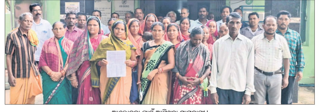
ଆଲୋଚନା ପାଇଁ ଆସିଥିବା ଗ୍ରାମବାସୀ।

ଜମିନକିରା ବୁକ କଟକପାଣି ପଞ୍ଚାୟତର କଟକପାଣି ଗ୍ରାମରେ ଅଜ୍ଞାନଖାତି କୋଠା ନିର୍ମାଣ ସ୍ଥାନକୁ ନେଇ ବିବାଦ ଦେଖାଦେଇଛି। ନୂତନ କୋଠା ନିର୍ମାଣ ଆଇନଟିଏ ଦ୍ୱାରା ପରିଚାଳିତ ହେଉଥିବାବେଳେ ତିଆରିତସ୍ଥୁ ସ୍ଥଳ ପରିସରରେ ହେଉଥିବାକୁ ଏହାକୁ ବିରୋଧ କରି ଶତାଧିକ ଗ୍ରାମବାସୀ ସୋମବାର କୁଟିଆ ଆଇନଟିଏ ପ୍ରକଳ୍ପ ପ୍ରଶାସକଙ୍କ ଦ୍ୱାରସ୍ଥ ହୋଇଛନ୍ତି। ୭୩୧୭ ଖାର୍ତ୍ତରେ ଏହା ହେବାକୁ ସେମାନେ ଦାବି କରିଛନ୍ତି। ପ୍ରାୟ ସୂତନା ଅନୁଯାୟୀ, କଟକପାଣି ଗ୍ରାମରେ ୨ଗୋଟି ଅଜ୍ଞାନଖାତି କେନ୍ଦ୍ର 'କ' ଓ 'ଖ' ନାମରେ ପରିଚାଳିତ ହେଉଛି। ୭୩୧୭ ଖାର୍ତ୍ତରେ 'କ' ଅଜ୍ଞାନଖାତି କେନ୍ଦ୍ର ରହିଥିବା ବେଳେ 'ଖ' କେନ୍ଦ୍ର ଖାର୍ତ୍ତ ନମ୍ବର ୮ରେ ରହିଛି। 'କ' ଅଜ୍ଞାନଖାତି କେନ୍ଦ୍ର ଅବସ୍ଥା ଭଲ ନ ଥିବାରୁ ଏକ ପରିବାର ବର୍ତ୍ତମାନ ପୋଲିସ ହସ୍ତାନ୍ତର କରିଛି।