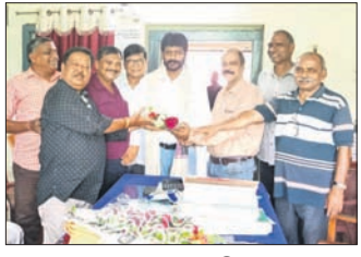
ସମ୍ବଲପୁର, ୩୧୧୭ (ବି.ଶଙ୍କର)

ଜନସ୍ୱାସ୍ଥ୍ୟ ବିଭାଗରେ ସମ୍ବର୍ଦ୍ଧନା କାର୍ଯ୍ୟକ୍ରମ