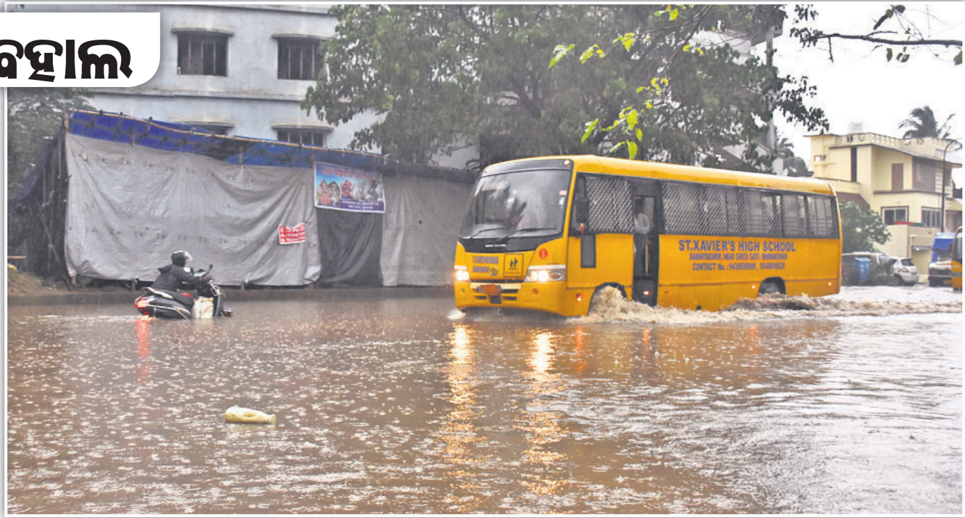
ସୋମବାର ବର୍ଷାରେ କେନ୍ଦ୍ରାପଡ଼ା କୋର୍ଟ ସମ୍ମୁଖ ରାସ୍ତାରେ ପାଣି ଜମିଥିବାବେଳେ ପିଲାମାନେ ସ୍କୁଲ ଛୁଟିପରେ ସେଥିରେ ପଶି ଯାଉଛନ୍ତି ।