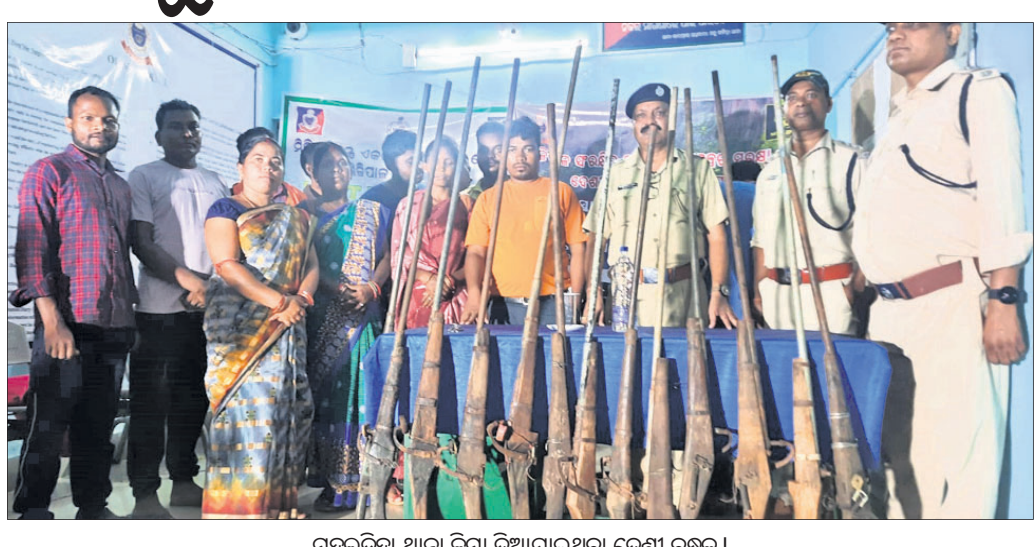
ମହୁଲଡ଼ିଆ ଥାନା ଜମା ଦିଆଯାଇଥିବା ଦେଶୀ ବନ୍ଧୁକ ।

ଶିମିଳିପାଲର ସୁରକ୍ଷା ପାଇଁ ବନ୍ଧୁକ ସମର୍ପଣ ଅଭିଯାନରେ କିଛିଟା ସଫଳତା ମିଳିଛି । ପୋଲିସ୍ ପକ୍ଷରୁ ଧାର୍ଯ୍ୟ ଶେଷ ତାରିଖରେ ମହୁଲଡ଼ିଆ ଥାନା ଅଞ୍ଚଳର ଶିକାରୀମାନେ ମୋଟ ୧୮ ଠାକୁରପୁଣ୍ଡା ଥାନା ଅଞ୍ଚଳର ଶିକାରୀ ଗୋଟିଏ ଦେଶୀ ବନ୍ଧୁକକୁ ମିଶାଇ ମୋଟ ୧୯ ବନ୍ଧୁକ ନିଜ ନିଜ ପଞ୍ଚାୟତ ସରପଞ୍ଚମାନଙ୍କ ନିକଟରେ ସମର୍ପଣ କରିଛନ୍ତି । ଶିକାରୀମାନେ ଏତେ ସଂଖ୍ୟକ ବନ୍ଧୁକ ଫେରାଇବା ଘଟଣା ଆଗାମୀ ଦିନରେ ଶିମିଳିପାଲ ସୁରକ୍ଷା ବିଭାଗ ସହାୟକ ହେବ ବୋଲି ବନ ବିଭାଗ ଆଶାବାସୀ କରିଛନ୍ତି ।