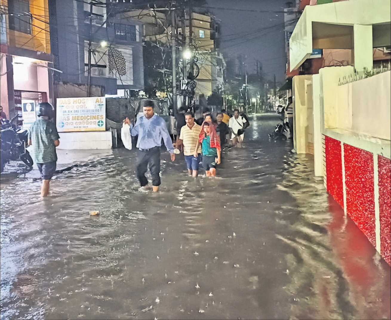
ସୋମବାର ଅପରାହ୍ନ ହୋଇଥିବା ବର୍ଷାରେ କଟକ ଫ୍ରେଣ୍ଡସ କଲୋନୀ ରାସ୍ତାରେ ପାଣିର ସୁଅ ଛୁଟୁଛି। ଲୋକେ ପାଣିରେ ପଶି ଯାତାୟାତ କରୁଛନ୍ତି।

ଅଭିନେତା ସୋନୁ ସୁଦ୍ଧ ଶନିବାର ଜନ୍ମଦିନ ଅବସରରେ ପ୍ରଶଂସକମାନେ ତାଙ୍କ ପାଇଁ ୧ ଲକ୍ଷ ୧୬ ହଜାର ବର୍ଗ ଫୁଟର ଏକ ପଦ୍ ଆର୍ଡ଼ ଉପହାର ସ୍ୱରୂପ ଦେଇଛନ୍ତି।