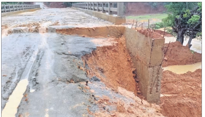
ନିର୍ମାଣାଧୀନ ପୋଲର ଆସ୍ତ୍ରୋର୍ ରାସ୍ତା ଦବିଯାଇଛି ।

କଳାହାଣ୍ଡି ଜିଲ୍ଲା ଥୁଆମୁଳ ରାମପୁର ବ୍ଲକ୍ ଅନ୍ତର୍ଗତ ବିଶାଳଗିରି-ତଳଖାପି ମଧ୍ୟରେ ଥିବା ଚଞ୍ଚରା ନାଳରେ ନିର୍ମାଣାଧୀନ ପୋଲର ଆସ୍ତ୍ରୋର୍ ରାସ୍ତା ବର୍ଷା ଯୋଗୁ ଦବିଯାଇଥିବା ଦେଖିବାକୁ ମିଳିଛି । ଫଳରେ ପୋଲର ଗୁଣ୍ଠିଗୁଣ୍ଠି ନେଇ ଏବେ ସାଧାରଣରେ ପ୍ରଶ୍ନବାଚୀ ସୃଷ୍ଟି ହୋଇଛି । ଗ୍ରାମ୍ୟ ଉନ୍ନୟନ ବିଭାଗ ପକ୍ଷରୁ ଏହି ପୋଲ ନିର୍ମାଣ କରାଯାଇଥିବା ବେଳେ ନିମ୍ନମାନର କାର୍ଯ୍ୟ ହୋଇଥିବା ଅଭିଯୋଗ ହୋଇଛି । ଯାହାର ପ୍ରମାଣ ଗୋଟିଏ ବର୍ଷାରେ ପୋଲର ଆସ୍ତ୍ରୋର୍ ରାସ୍ତା ଦବିଯିବା ଘଟଣାରୁ ଜଣାପଡ଼ିଛି । ତେବେ