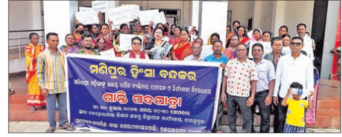
ପଦଯାତ୍ରାରେ ବାହାରିଥିବା ନାଗରିକ ମଞ୍ଚ କର୍ମକର୍ତ୍ତା।

ଦୀର୍ଘଦିନ ଧରି ମଣିପୁରରେ ଲାଗିରହିଥିବା ହିଂସା ରୋକିବା ଓ ସେଠାରେ ଶାନ୍ତି ପ୍ରତିଷ୍ଠା ଉଦ୍ଦେଶ୍ୟରେ ସୋମବାର ଝାରସୁଗୁଡ଼ା ଜିଲ୍ଲା ବ୍ରଜରାଜନଗର ପୌରାଞ୍ଚଳର ସଚେତନ ନାଗରିକ ମଞ୍ଚ ତରଫରୁ ଜିଲାପାଳଙ୍କୁ ଦାବିପତ୍ର ପ୍ରଦାନ କରାଯାଇଛି। ମଞ୍ଚର ଶତାଧିକ ମହିଳାପୁରୁଷ ଶାନ୍ତି ପଦଯାତ୍ରାରେ ସ୍ଥାନୀୟ ବେହେରାମାଲ ଛକଠାରୁ ଜିଲାପାଳଙ୍କ କାର୍ଯ୍ୟାଳୟ ପର୍ଯ୍ୟନ୍ତ ଯାଇଥିଲେ। ଦୁଇଜଣ ମହିଳାଙ୍କୁ ଅସମ୍ମାନିତ କରି ରାକରାସ୍ତାରେ