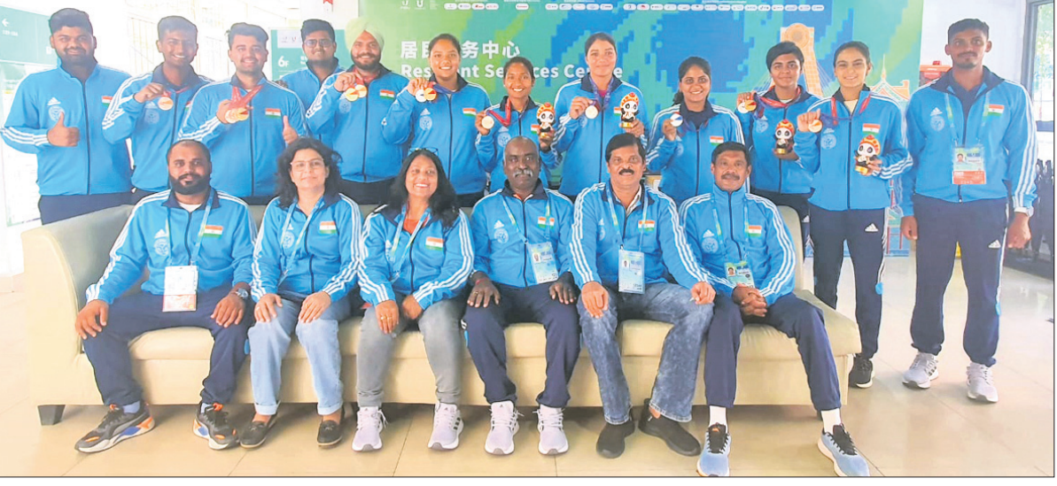
ପଦକ ସହ ଭାରତୀୟ ଚାରମାଜ ଦଳ।