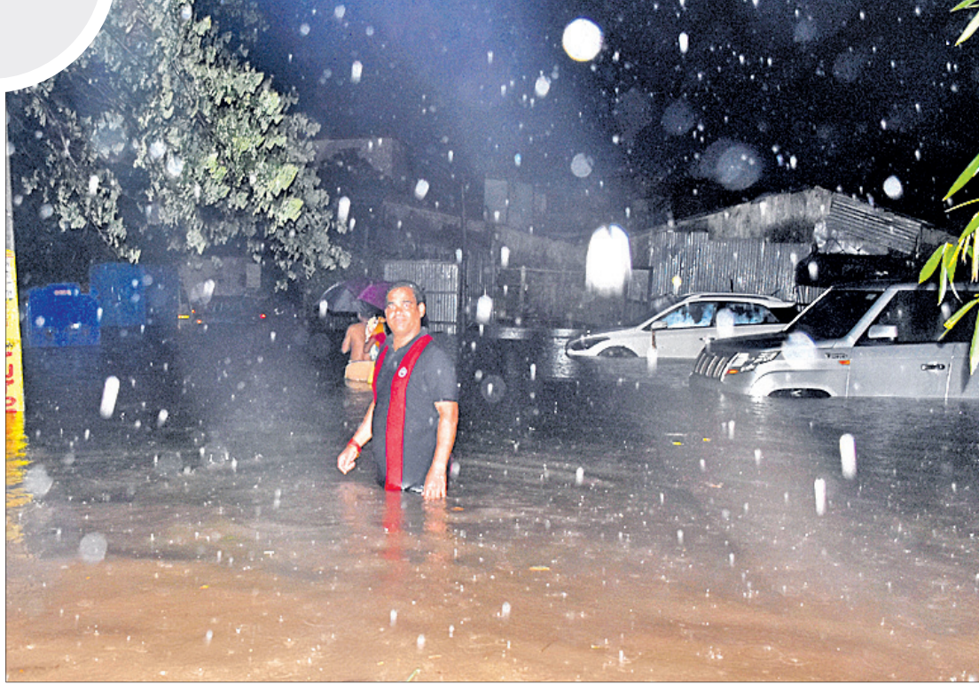
ଭୁବନେଶ୍ୱର ଲକ୍ଷ୍ମୀସାଗର ଦାଣ୍ଡସାହି ରାସ୍ତାରେ ଜମିଥିବା ପାଣିରେ ଗାଡ଼ିମୋଟର ଅଧା ବୁଡ଼ିଯାଇଥିବାବେଳେ ଲୋକେ ପାଣିରେ ପଶି ଯାତାୟତ କରୁଛନ୍ତି