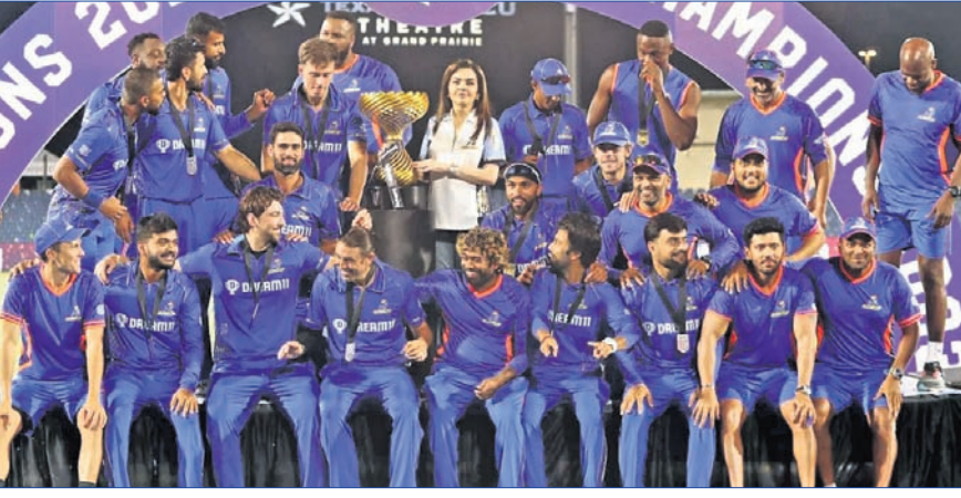
ମେଜର କ୍ରିକେଟ ଲିଗ୍ ଚାମ୍ପିୟନ ଏମ୍ଆଇ ଫୁଲ୍ ଲିଗ୍ ଦଳ।

ରଚିର୍ ଅଫିସର ଭାବେ ନିଯୁକ୍ତି ପାଇଛନ୍ତି। ପ୍ରାର୍ଥାପତ୍ର ଦାଖଲ ଶେଷ ତାରିଖ ଅଗଷ୍ଟ ୭ ତାରିଖ ରଖାଯାଇଛି। ଜଣ୍ଟିସ୍ କୁମାରଙ୍କ ସୂଚନା ଅନୁସାରେ ସଭାପତି ପାଇଁ ୪ଜଣ ପ୍ରାର୍ଥା ରହିଛନ୍ତି। ସେହିପରି ସିନିୟର ଉପସଭାପତି ପାଇଁ ୩, ଉପସଭାପତି ଲାଗି ୬, ସାଧାରଣ ସମ୍ପାଦକ ପାଇଁ ୩, କୋଷାଧ୍ୟକ୍ଷ ଲାଗି ୨, ଯୁଗ୍ମ ସମ୍ପାଦକ ପାଇଁ ୩ ଏବଂ ୫ କାର୍ଯ୍ୟନିର୍ବାହୀ ସଦସ୍ୟ