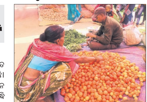
ଟମାଟୋ ବିକ୍ରି କରୁଛନ୍ତି ଜଣେ ଖୁନ୍ତରା ବ୍ୟବସାୟୀ।

ଗତ ଭୁବ୍ ମାସରୁ ରାଜ୍ୟରେ ଟମାଟୋ ଦର ଅନିୟନ୍ତ୍ରିତ ହୋଇରହିଛି। ଜିଲ୍ଲା ସ୍ତରରେ ଏହାର ଦର ଭିନ୍ନ ରହୁଛି। ପାଣିପାଗରେ ଅନିୟମିତତା, ଅଧିକ ଖରା ଯୋଗୁ ଉତ୍ପାଦନ ହ୍ରାସ, ବର୍ଷା, ବନ୍ୟା, ରାସ୍ତା ସମସ୍ୟା ସହ ଗାଢ଼ି ଭଡ଼ା ବୃଦ୍ଧି ଯୋଗୁ ଟମାଟୋ ଦର ଉଚ୍ଚ ରଖିଥିବା କୁହାଯାଉଛି। ହେଲେ ବାସ୍ତବରେ ଦର ନିୟନ୍ତ୍ରଣ କରିବା ନେଇ ପ୍ରଶାସନିକ ସ୍ତରରେ ଉଦ୍ୟମ କରାଯାଇ ନାହିଁ। ପ୍ରତିଦିନ ଟମାଟୋର ଉଚ୍ଚ ଦର ଖାଉଟିକାରୀମାନଙ୍କୁ ଆଘାତ କରୁଛି। ତେଣୁ ଏହି ବ୍ୟବସାୟ ସହ ଜଡ଼ିତ ମତ୍ସ୍ୟମାନେ ଲାଭବାନ ହେଉଥିବାବେଳେ ଖାଉଟି ଆର୍ଥିକ ବୋଝରେ ବେହାର ହେଉଛି। ଭୁବ୍ରେ ଜିଲ୍ଲରେ ଟମାଟୋ କିଲୋ ପ୍ରତି ୪୦ରୁ ୬୦ ଟଙ୍କା ପର୍ଯ୍ୟନ୍ତ ରହିଥିବା ବେଳେ ଜିଲ୍ଲାରେ ଏହା ବୃଦ୍ଧି ପାଇ ଯୋଗଦାନ ୨୬୦ ଟଙ୍କାରେ ପହଞ୍ଚିଛି। ମାନେଶ୍ୱର ସାମୁଦ୍ରିକ ବଜାରରେ ଏହି ଦରକୁ ନେଇ ଖାଉଟି ଆଶ୍ଚର୍ଯ୍ୟଚକିତ ହୋଇଯାଇଥିଲେ। କେବଳ ମାନେଶ୍ୱର ରୁହେଁ, ସମ୍ବଲପୁର ସହରର ବିଭିନ୍ନ ଖୁନ୍ତରା ବ୍ୟବସାୟୀ ଏହି ଦରରେ ବିକ୍ରି କରୁଥିଲେ। ଦର ବୃଦ୍ଧି ଯୋଗୁ ବଜାରରେ ଟମାଟୋର ଚାହିଦା ହ୍ରାସ ପାଇଛି। କେତେକଙ୍କ ହାତରଖିତ ଅଣାଓଡ଼ିଆ ବେପାରୀ ଏହା ବିକ୍ରି କରୁଥିବା ଦେଖାଯାଇଥିଲା।