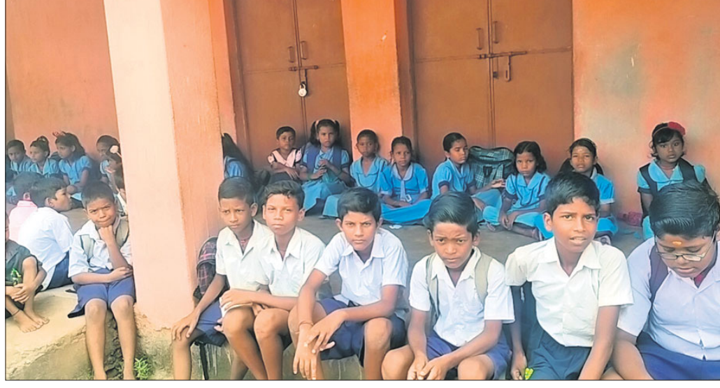
ସ୍କୁଲ ଫାଟକରେ ତାଲା ପଡିଥିବାରୁ ଛାତ୍ରଛାତ୍ରୀମାନେ ବାରଣ୍ଡାରେ ବସିଛନ୍ତି।