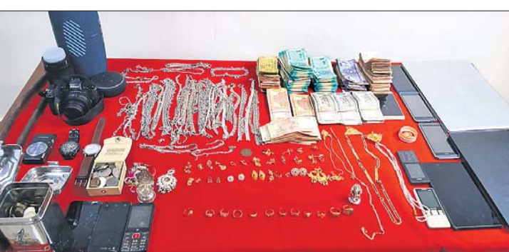
ଜବତ ଅଳଙ୍କାର ଓ ଗିରଫ ଅଭିଯୁକ୍ତ।