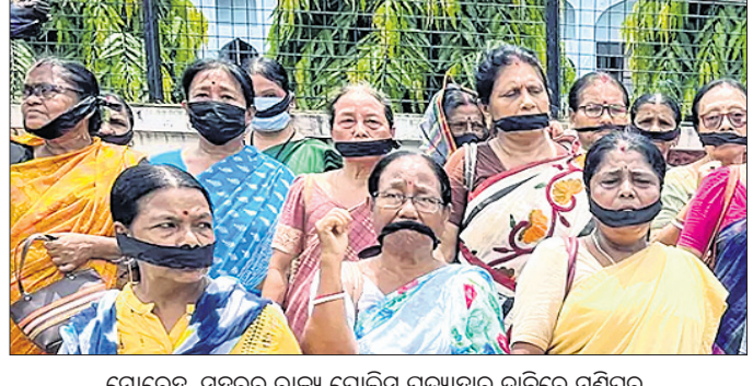
ମୋରେଇ ସହରରୁ ରାଜ୍ୟ ପୋଲିସ ପ୍ରତ୍ୟାହାର ଦାବିରେ ମଣିପୁର ମହିଳାମାନେ ସୋମବାର ଭୁବନେଶ୍ୱରରେ ବିଶୋଭ ପ୍ରଦର୍ଶନ କରୁଛନ୍ତି। ଫୋରମ୍ (ଆଇଟିଏଲ୍‌ଏସ୍) ସୋମବାର ବିଶୋଭ ପ୍ରଦର୍ଶନ କରୁଛନ୍ତି। ବଳ ହଟିବା ଆବଶ୍ୟକ। ତାହା ନ ହେଲେ ଆମେ ଜନଆନ୍ଦୋଳନ କରିବାକୁ ବାଧ୍ୟ ହେବୁ ବୋଲି ଆଇଏଲ୍‌ଏସ୍ କହିଛି।

କମ୍ପାଳ, ୩୧।୭ ମ୍ୟାନ୍‌ମାର ସୀମାକୁ ଲାଗିଥିବା ମଣିପୁରର ମୋରେଇ ସହରରୁ ପୋଲିସ ଫୋର୍ସ ପ୍ରତ୍ୟାହାର ଦାବିରେ ୧,୦୦୦ରୁ ଊର୍ଦ୍ଧ୍ୱ ମହିଳା ସୋମବାର ଭୁବନେଶ୍ୱରରେ ବିଶୋଭ ପ୍ରଦର୍ଶନ କରିଛନ୍ତି। ଭୁବନେଶ୍ୱର ରାଜ୍ୟ ପୋଲିସକୁ ପ୍ରତ୍ୟାହାର କରି ନିଆ ନ ଗଲେ ମଣିପୁରର ସମସ୍ତ ଆଦିବାସୀ ଜିଲ୍ଲାରେ ଆନ୍ଦୋଳନ କରାଯିବ ବୋଲି ଉଦ୍ଦେଶ୍ୟ ସ୍ୱାଭାବିକ ଭାବେ ପୋଲିସକୁ ପ୍ରତ୍ୟାହାର କରି ନିଆ ନ ଗଲେ ମଣିପୁରର ସମସ୍ତ ଆଦିବାସୀ ଜିଲ୍ଲାରେ ଆନ୍ଦୋଳନ କରାଯିବ ବୋଲି ଉଦ୍ଦେଶ୍ୟ ସ୍ୱାଭାବିକ ଭାବେ