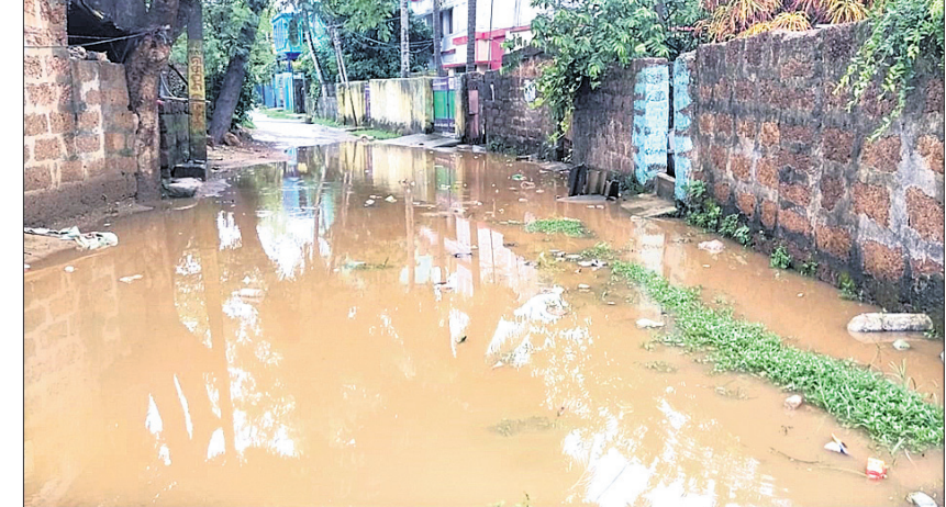
ରାସ୍ତାରେ ଜମି ରହିଥିବା ବର୍ଷାଜଳ।

ବର୍ଷାଦିନ ପୂର୍ବରୁ ଡ୍ରେନ୍ ସଫାକାର ଓ ମରାମତି ଉପରେ ଖୋର୍ଦ୍ଧା ପୌର ପ୍ରଶାସନ ପକ୍ଷରୁ ଗୁରୁତ୍ୱ ଦିଆଗଲା ନାହିଁ। ଫଳରେ ସୋମବାର ଲଗାଣ ବର୍ଷାରେ ଖୋର୍ଦ୍ଧା ସହରର ସାହି, ଗଳିକନ୍ଦି, ପୁଣ୍ୟ ରାସ୍ତାରେ ପାଣି ଜମିରହିଥିଲା। ଆବର୍ଜନା ଭାସିବା ସହ ଯାତାୟତ କରିବାରେ ଲୋକେ ନାହିଁ ନ ଥିବା ଅସୁବିଧାର ସମ୍ମୁଖୀନ ହୋଇଥିଲେ। ଅନ୍ୟପକ୍ଷେ ପୁଣ୍ୟ ରାସ୍ତାକୁ ବାଦ୍ ଦେଲେ ସାହିଗଳିକନ୍ଦିରୁ ଅଳିଆ ହରୁଡ଼ି ଫଳରେ ବର୍ଷାଦିନେ ପାଣି ଜମି ତେଜୁକୁ ଆମନ୍ତ୍ରଣ କରୁଛି ବୋଲି ସାଧାରଣରେ ଅଭିଯୋଗ ହୋଇଛି।