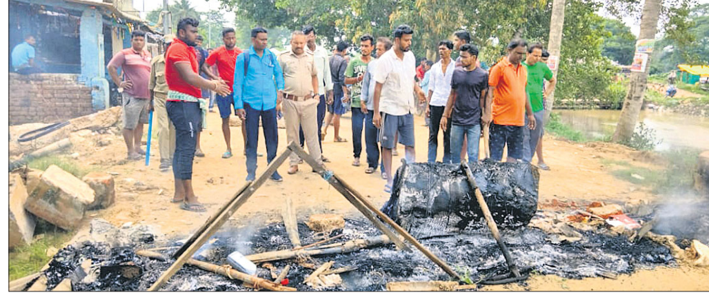
ତ୍ରିବେଣୀଶ୍ୱର ପୂର୍ବ କେନାଲ ବନ୍ଧ ରାସ୍ତା ଉପରେ ଲୋକେ ଚାନ୍ଦୀରେ କାଳି ପ୍ରତିବାଦ କରୁଛନ୍ତି।

ମାହାଙ୍ଗା କୁଳ କୁଆଁପାଳ-ପାବା ପୂର୍ବ ରାସ୍ତାର ତ୍ରିବେଣୀଶ୍ୱର ପକ୍ଷପୁଣ୍ୟ କେନାଲବନ୍ଧ ରାସ୍ତା ନିର୍ମାଣରେ ବିଳମ୍ବ ହେଉଛି। ଏଥିସହ ସେଠାରେ ମାଟି ପକାଯାଉଥିବାରୁ ଯାତାୟତରେ ସମସ୍ୟା ହେଉଥିବା ଅଭିଯୋଗ କରି ତ୍ରିବେଣୀଶ୍ୱର ପୂର୍ବ କେନାଲବନ୍ଧ ରାସ୍ତା ଉପରେ ଲୋକେ ଚାନ୍ଦୀରେ କାଳି ପ୍ରତିବାଦ କରିଥିଲେ। ଫଳରେ ୪ ଘଣ୍ଟା ଧରି ରାସ୍ତାରେ ଯାତାୟତ ଠକ୍ ହୋଇଯାଇଥିଲା। ଉତ୍ତମ ଛାତ୍ରାଛାତ୍ର ଅଭିଯୋଗ ଅନୁଯାୟୀ, ଏହି ରାସ୍ତା ଉପରେ କଟକ, ଚାଲି, ପାଗା, ଛତିଆ, କୁଆଁପାଳ, ବାଲିଚନ୍ଦ୍ରପୁର, ସାଲେପୁର, ବଡ଼ଚଣା ଅଞ୍ଚଳର ଲୋକେ ନିର୍ଭରଶୀଳ। କିଛି ଦିନ ପୂର୍ବେ ତ୍ରିବେଣୀଶ୍ୱରରେ ୨ ଶହ ଚୋରି କରିଥିବା ସ୍ୱୀକାର କରିଥିଲେ।