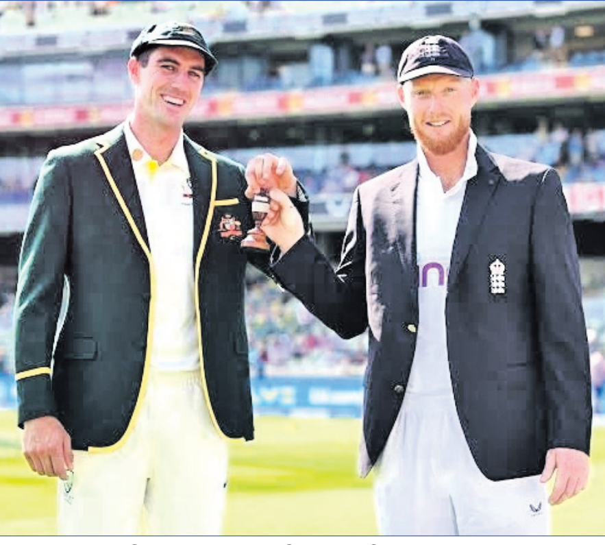
ଆଶେସ୍ ଚମ୍ପି ସହ ଦୁଇ ଅଧିନାୟକ ଅଷ୍ଟ୍ରେଲିଆର ପ୍ୟାଟ୍ କୁମ୍ବିଓ ଓ ଇଂଲଣ୍ଡର ବେନ୍ ସ୍ଟୋକ୍ସ।