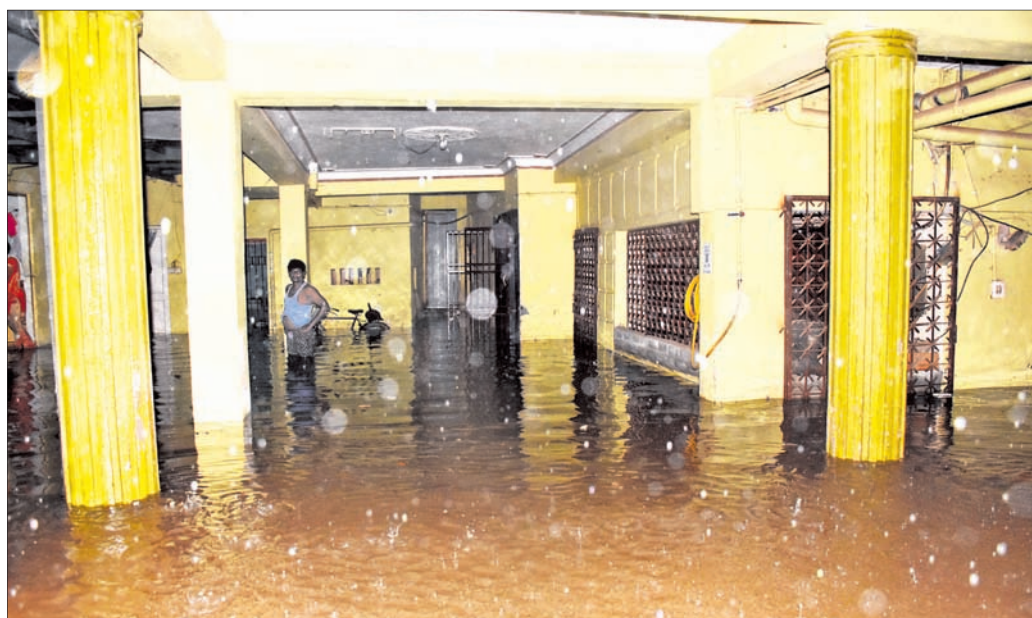
ଭୁବନେଶ୍ୱର ଝାରପଡ଼ା କେନାଲ ରୋଡ଼ରୁ ଚିନ୍ତାମଣିଶ୍ୱର ମନ୍ଦିର ଯିବା ରାସ୍ତାରେ ଜଣକ ଘରେ ପଶିଥିବା ବର୍ଷା ପାଣି