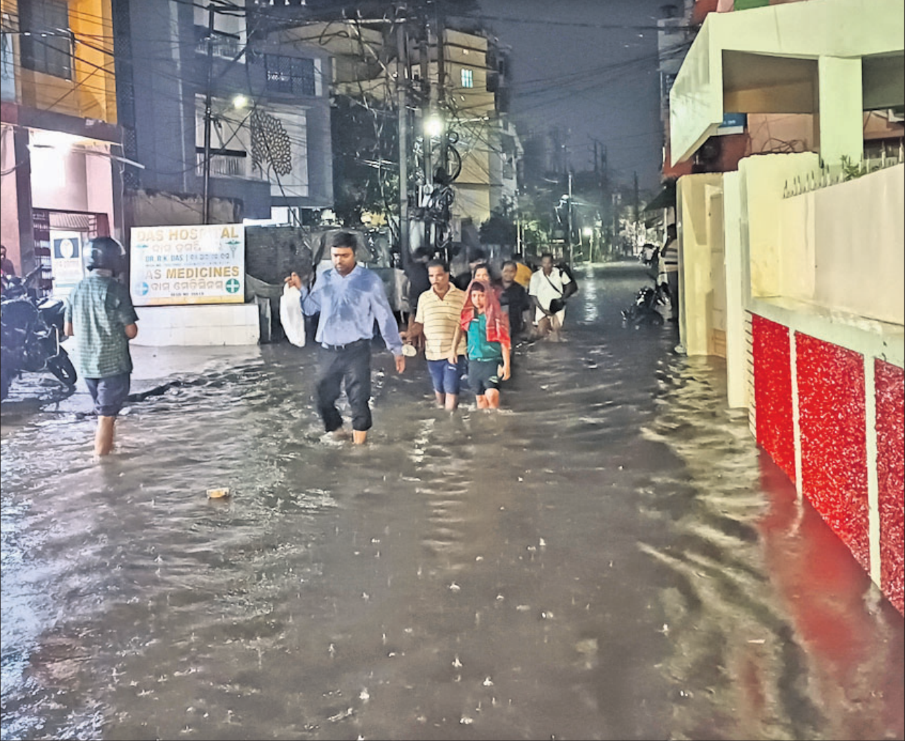
ସୋମବାର ଅପରାହ୍ନ ହୋଇଥିବା ବର୍ଷାରେ କଟକ ଫ୍ରେଣ୍ଡସ କଲୋନୀ ରାସ୍ତାରେ ପାଣିର ସୁଅ ଛୁଇଁଛି। ଲୋକେ ପାଣିରେ ପଶି ଯାତାୟାତ କରୁଛନ୍ତି।

ଅଭିନେତା ସୋନୁ ସୁଦ୍ଧ ଶନିବାର ଜରୁରି ଅବସରରେ ପ୍ରଶଂସକମାନେ ତାଙ୍କ ପାଇଁ ୧ ଲକ୍ଷ ୧୭ ହଜାର ବର୍ଗ ଫୁଟର ଏକ ପଦ୍ ଆର୍ତ୍ତ ଉପହାର ସ୍ୱପ୍ନ ଦେଇଛନ୍ତି।