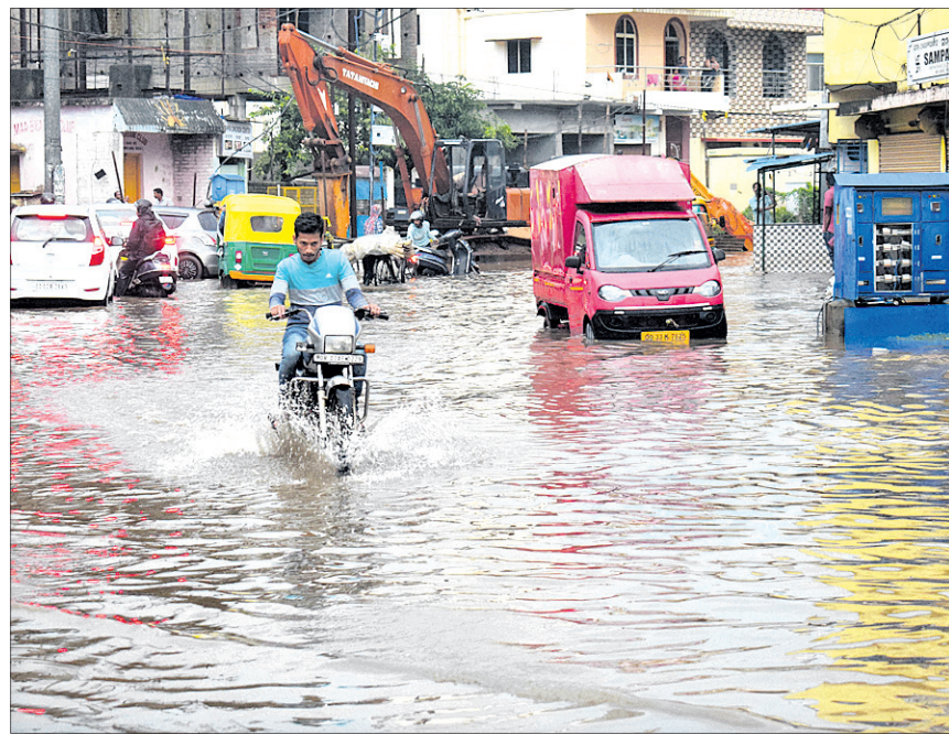
ପୁରୁଣା ଭୁବନେଶ୍ୱରର ଗୋସାଗୋରେଶ୍ୱର ଛକ ଜଳାଶୁଷ୍କ