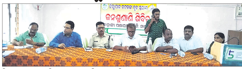
ଜିଲାପାଳ ଓ ଅନ୍ୟ ପ୍ରଶାସନିକ ଅଧିକାରୀମାନେ ଅଭିଯୋଗ ଶୁଣୁଛନ୍ତି।