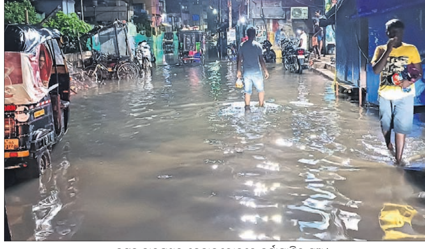
କଟକ ବାରପଡ଼ର କୋନାଲରେ ବର୍ଷାପାଣିର ସୁଅ ।