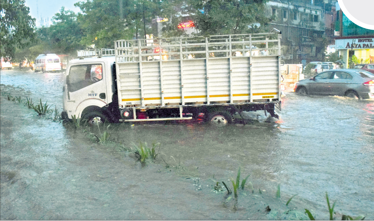
ଭୁବନେଶ୍ୱର ରାଜମହଲ ଛକରୁ ମାଷୁରକ୍ୟାଣ୍ଡିନ୍ ଯିବା ରାସ୍ତା ବର୍ଷା ପାଣିରେ ଭରିଯାଇଛି