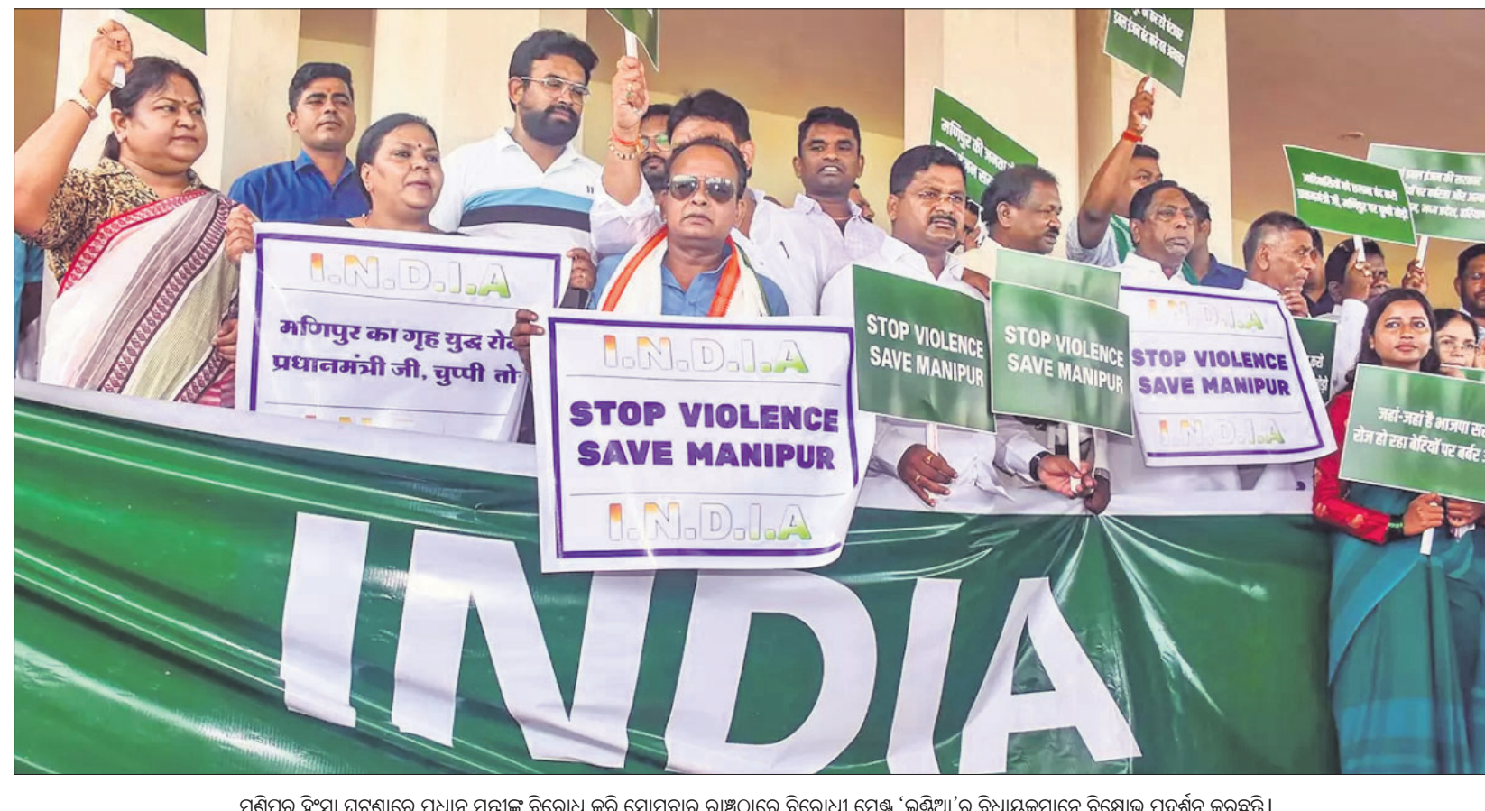
ମଣିପୁର ହିଂସା ଘଟଣାରେ ପ୍ରଧାନ ମନ୍ତ୍ରୀଙ୍କୁ ବିରୋଧ କରି ସୋମବାର ରାତ୍ରିରେ ବିରୋଧୀ ମେଣ୍ଟ 'ଇଣ୍ଡିଆ'ର ବିଧାୟକମାନେ ବିରୋଧ ପ୍ରଦର୍ଶନ କରୁଛନ୍ତି ।

ଗାଁରେ ସ୍ଥାପନ କରାଯାଇଥିବା ବେଳେ ଆକାଶ୍ୟା ଜିଲ୍ଲା କଭରେଜ ପରିଯୋଜନାରେ ୧୪୯ ଗାଁରେ ସ୍ଥାପନା କରାଯାଇଛି । ସେହିଭଳି ବିସୟନ-୯୩୩୩ ୨-୧ ଜି ନେଟ୍‌ୱାର୍କ ୪-୧ରେ ପରିବର୍ତ୍ତନ କରାଯିବା ସହ ଏକତରଫା-୧ ପରିଯୋଜନାରେ ମଧ୍ୟ ସମାନ କାମ ହାତକୁ ନିଆଯାଇଛି ବୋଲି ମନ୍ତ୍ରୀ କହିଛନ୍ତି । ପୂର୍ବରୁ ବିଭିନ୍ନ ସମୟରେ ରାଜ୍ୟରେ ନେଟ୍‌ୱାର୍କ ସାମଗ୍ରୀ ବ୍ୟବହାରକୁ ପୁଣ୍ୟମନ୍ତ୍ରୀ କେନ୍ଦ୍ର ସରକାରଙ୍କ ନିକଟରେ ଦାବି କରିଆସିଥିଲେ ।