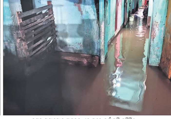
କଟକ ପଟାପୋଲ ଅଞ୍ଚଳର ଏକ ଘରେ ବର୍ଷାପାଣି ପଶିଛି ।