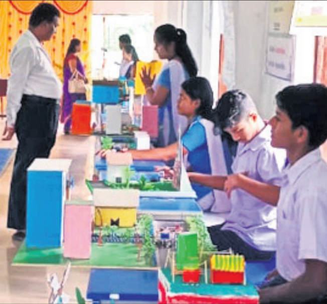
ଅତିଥିମାନେ ବିଭିନ୍ନ ପ୍ରକଳ୍ପ ବୁଲି ଦେଖୁଛନ୍ତି।