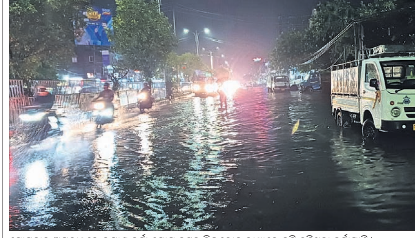
ସୋମବାର ଅପରାହ୍ନରେ ଲଗାଣ ବର୍ଷା ଯୋଗୁ କଟକ ଲିକ୍‌ରୋଡ଼ ରାସ୍ତାରେ ଜମି ରହିଥିବା ବର୍ଷାପାଣି ।