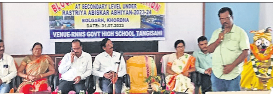
କୁଳସ୍ତରୀୟ ବିଜ୍ଞାନମେଳାରେ ମଞ୍ଚାସୀନ ଅତିଥି।