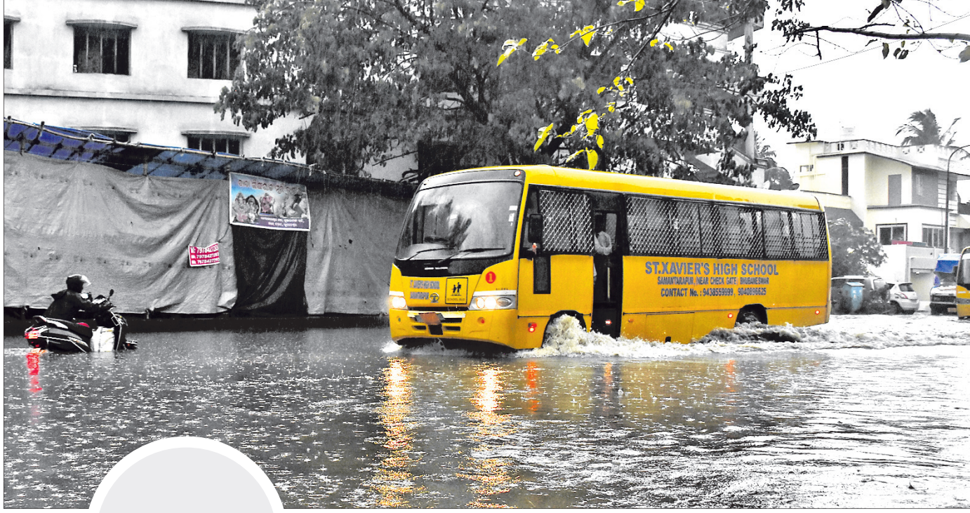
ପୁରୁଣାଭୁବନେଶ୍ୱରର ରଥ ରୋଡ଼ରେ ଆଣ୍ଟୁସ ଉଜର ପାଣି ଚାଲୁଛି