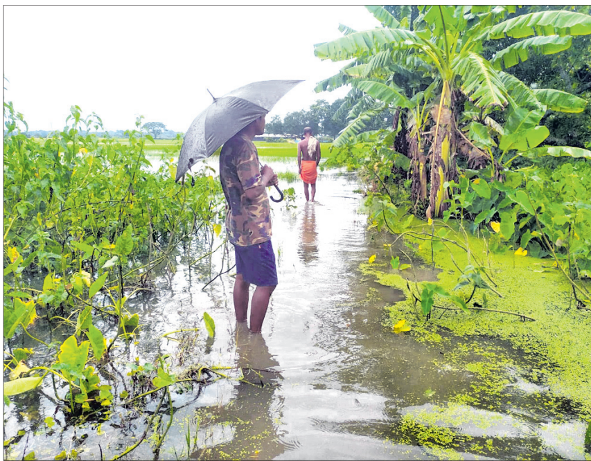
କେନ୍ଦ୍ରାପଡ଼ା ଜିଲା ଗରବପୁର ରାସ୍ତା ଉପରେ ପାଣି