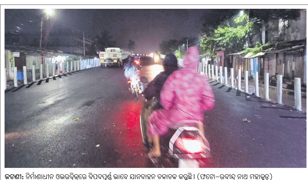
କଟଣା: ନିର୍ମାଣାଧୀନ ଓଭରବ୍ରିଜ୍ରେ ବିପଦପୂର୍ଣ୍ଣ ଭାବେ ଯାନବାହନ ଚଳାଚଳ କରୁଛି।