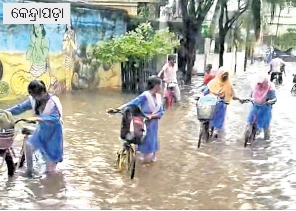
ସୋମବାର ବର୍ଷାରେ କେନ୍ଦ୍ରାପଡ଼ା କୋର୍ଟ ସମ୍ମୁଖ ରାସ୍ତାରେ ପାଣି ଜମିଥିବାବେଳେ ପିଲାମାନେ ସ୍କୁଲ ଛୁଟିପରେ ସେଥିରେ ପଶି ଯାଇଛନ୍ତି