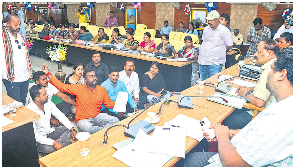
ସିଏମ୍‌ସି କାର୍ଯ୍ୟକ୍ରମ ବୈଠକରେ ଭାଗ୍ୟ ଓ କର୍ପୋରେଟରମାନେ ଧାରଣାରେ ବସିଛନ୍ତି ।

ବିଭାଗ ପାଖରେ ହୋଇଥିବା ସଂସ୍ଥା ସମ୍ପର୍କରେ ଚର୍ଚ୍ଚା ହେଉଛି । ଏପରି କି ହାଇକୋର୍ଟ ନିର୍ଦ୍ଦେଶକୁ ଅବମାନନା କରାଯାଇ ବିଭିନ୍ନ ସ୍ଥାନରେ ହୋଇଥିବା ବିଭିନ୍ନ ରାଜସ୍ୱ ପାଠ୍ୟପୁସ୍ତକ ପାଇଁ କର୍ପୋରେଟରଙ୍କୁ ନିର୍ଦ୍ଦେଶ ଦିଆଯାଇଥିଲା ।