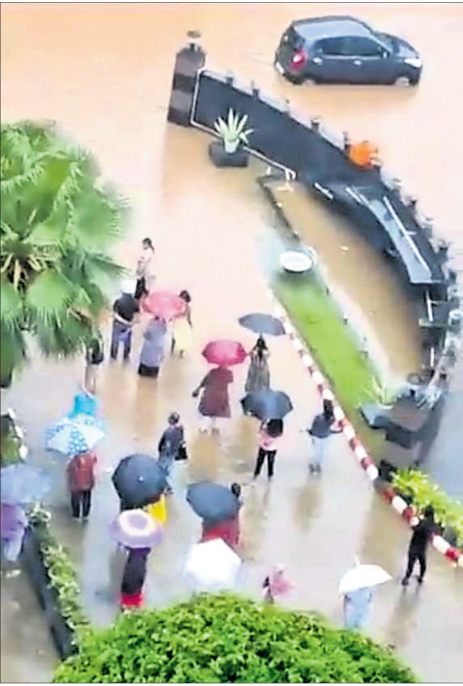
ଭୁବନେଶ୍ୱର କସ୍ମୋପଲିସ୍ ଅଞ୍ଚଳରେ ଜମି ରହିଥିବା ପାଣି