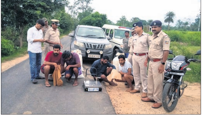
ଗିରଫ ଅଭିଯୁକ୍ତ ସହ ଜବତ ଗଞ୍ଜୋଇ ।