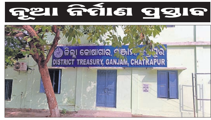
ଚେଜେରି ଅଫିସ୍ ।

ଗଞ୍ଜାମ ଜିଲ୍ଲା ହେଡକ୍ୱାର୍ଟର ଛତ୍ରପୁରଠାରେ ଥିବା ୧୨୩ ବର୍ଷ ପୁରୁଣା ଜିଲ୍ଲା ଟ୍ରେଜରୀ ଅଫିସ୍ ସ୍ତମ୍ଭରୁ ଅସୁରକ୍ଷିତ ହୋଇ ପଡିଛି। ସ୍ତମ୍ଭରୁ ଛାଡିଯାଇଥିବା ବସ୍ତୁ ବାରମ୍ବାର ମରାମତି କରାଯାଇଛି। ତଥାପି ଏଠାରେ ଥିବା ସରକାରୀ ସମ୍ପତ୍ତି ନଷ୍ଟ ହେବା ଆଶଙ୍କା ଦେଖାଦେଇଛି । ତେଣୁ ଉଚ୍ଚ ସ୍ତମ୍ଭରୁ ଭାଙ୍ଗି ନୂଆ ନିର୍ମାଣ କରିବା ନିହାତି ଆବଶ୍ୟକ ହୋଇପଡିଛି ଏ ନେଇ ଜିଲ୍ଲା ଟ୍ରେଜରୀ ଅଫିସରଙ୍କ ପକ୍ଷରୁ ବ୍ରହ୍ମପୁରସ୍ଥିତ ରାସ୍ତା ଓ କୋଠାବାଡି ଡିଭିଜନ-୨ର ଅଧ୍ୟକ୍ଷ ଯନ୍ମାଙ୍କୁ ଗତ ୨୮ ତାରିଖରେ ଚିଠି ଲେଖି ଜଣାଇ ଦିଆଯାଇଛି। ଏଥିସହ ସ୍ତମ୍ଭରୁ ସମ୍ପୂର୍ଣ୍ଣ ରିପୋର୍ଟ, ଭାଙ୍ଗିବା ଲାଗି ପ୍ରାୟୋଗ, ସେଫ୍ଟି ସାଫ୍ଟିକେଟ୍ ଓ ନୂଆ ସ୍ତମ୍ଭରୁ ନିର୍ମାଣ ଲାଗି ପ୍ଲାନ୍ ଓ ଏଣ୍ଟିମେନ୍ଟ୍ ଦେବାକୁ ଉଚ୍ଚ ଡିଭିଜନ ଅନୁରୋଧ କରାଯାଇଛି। ଆଗକୁ ସାଧାରଣ ନିର୍ବାଚନ ଥିବାରୁ ନୂତନ