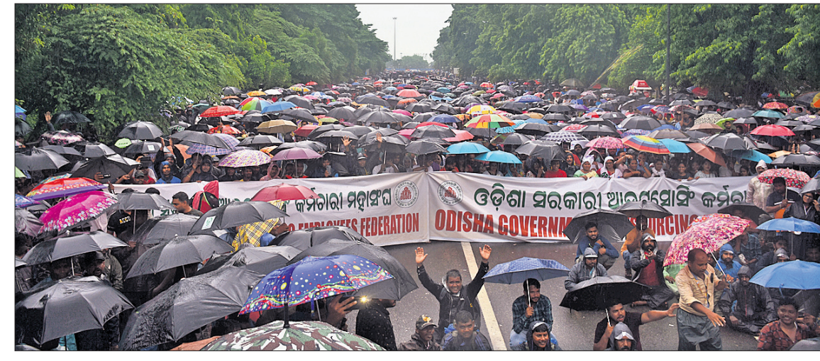
ନବୀନ ନିବାସ ଅଭିଯୁକ୍ତ ଯିବା ପୂର୍ବରୁ ଓଡ଼ିଶା ସରକାର ଆଇନ୍ ସୋଡ଼ି କର୍ମଚାରୀମାନେ ଲୋକପ୍ରତିଷ୍ଠା ପ୍ରଦାନ କରୁଛନ୍ତି।