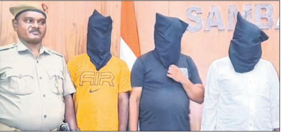
ଗିରଫ ୩ ଅଭିଯୁକ୍ତ ଓ ଜବତ ଚୁଲି।

ସମ୍ବଲପୁରରେ ଆପରାଧିକ କାର୍ଯ୍ୟରେ ବନ୍ଧୁକ ବ୍ୟବହାର କରୁଥିବା ଅପରାଧୀ। ଏଭଳି ପୁରୀ ମିଳିବା ପରେ ପୋଲିସ୍ ମଙ୍ଗଳବାର ସ୍ୱତନ୍ତ୍ର ଭାବେ ଚଢ଼ାଇ କରି ୩ ଅଭିଯୁକ୍ତଙ୍କୁ ଗିରଫ କରିବା ସହ ସେମାନଙ୍କଠାରୁ ବନ୍ଧୁକ, ଜାବତ ଚୁଲି ଓ ଅନ୍ୟ ସାମଗ୍ରୀ ଜବତ କରିଛି। ଜିଲ୍ଲା ଅପରାଧମୁକ୍ତ କରିବାକୁ ଏଭଳି ଚକ୍ରାଭି ଚାଲି ରହିବ ବୋଲି ଏସ୍ପି ପୁରୀ କହିଛନ୍ତି। ଏସ୍ପି ଅପିଏରେ ଆୟୋଜିତ ଖବରଦାତା ସମ୍ମିଳନୀରେ ପୁରୀ ବୋଲିଛନ୍ତି। ସେ ଆହୁରି କହିଛନ୍ତି, ବିଶେଷ ପୁରୁଷ ଖବର ମିଳିବା ପରେ ପୋଲିସ୍