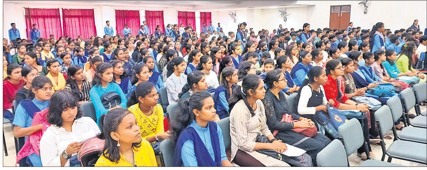
କଟକସ୍ଥିତ ରେଭେନ୍ସା କୁଳିୟର କଲେଜରେ ମଙ୍ଗଳବାର ଅନୁଷ୍ଠିତ ସ୍ୱାଗତ ଉତ୍ସବରେ ମୁକ୍ତ ୨ ପ୍ରଥମବର୍ଷର ଛାତ୍ରାଛାତ୍ରୀ

ବାଲେଶ୍ୱର ଜିଲ୍ଲା ବାହାନଗା ବଜାର ଷ୍ଟେସନରେ ଭୟଙ୍କର ଟ୍ରେନ୍ ଦୁର୍ଘଟଣା ଘଟିଥିଲା। ହାଡ଼ିଫୁଲ ଟ୍ରେନର ଅଭିମୁଖେ ଯାଉଥିବା କରମଣ୍ଡଳ ଏକପ୍ରେସ୍ ଲୁପ୍ ଲାଇନରେ ଛିଡ଼ା ହୋଇଥିବା ମାଲବାହୀ ଟ୍ରେନ୍ କୁ ଧକ୍କା ଦେବା ପରେ ଏହାର କେତେକ ବରି ଅନ୍ୟତମ ଗ୍ରାହକରେ ପଡିଥିଲା।