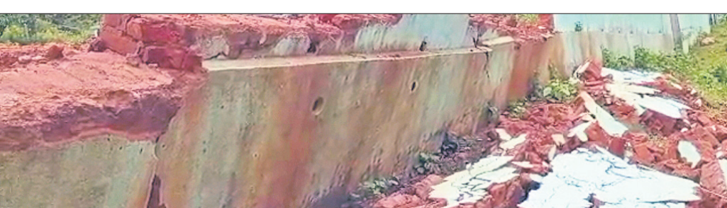
ଭୁଞ୍ଜିତଯାଇଥିବା ସ୍କୁଲ ପାଟେରି ।

କର୍ତ୍ତୃକ୍ତ ଜିଲ୍ଲା ଦାରିଙ୍ଗପାଡି କୁଳ କୁଡ଼ାଗୁଡା ସରକାରୀ ଉନ୍ନତ ଉଚ୍ଚ ବିଦ୍ୟାଳୟର ୪୦ ରୁ ୫୦ ଫୁଟ ପାଟେରୀ ଭୁଞ୍ଜିତ ଧରାଖାଣ୍ଡ ହୋଇଛି । ରାଜ୍ୟ ସରକାର ଶିକ୍ଷାର ବିକାଶ ପାଇଁ ଉଚ୍ଚ ବିଦ୍ୟାଳୟ ଗୁଡିକୁ ସ୍ଥାନୀୟ ପରିଶ୍ରମ କରୁଛନ୍ତି ଏଥିପାଇଁ ପଚାଶ ଲକ୍ଷ ଟଙ୍କା ପର୍ଯ୍ୟନ୍ତ ଅନୁଦାନ ଦେବା ସହ ଛାତ୍ରଛାତ୍ରୀଙ୍କୁ ସାମାଜିକ ସୁରକ୍ଷା ଦେବାପାଇଁ ବିଦ୍ୟାଳୟ ଚାରିପଟେ ସୁରକ୍ଷିତ ପାଇଁ ଲକ୍ଷ ଲକ୍ଷ ଅନୁଦାନ ଦେଇ ପାଟେରୀ ନିର୍ମାଣ କରୁଛନ୍ତି । ହେଲେ ଠିକାଦାର ଓ ସରକାରୀ ଯନ୍ତ୍ରାଳୟ ବେପାରୀ କାର୍ଯ୍ୟ ଯୋଗୁ ଦୀର୍ଘ ଦିନ ଯାଉନି କୋଉଠି ଦଶ ବର୍ଷରେ ଛାତ୍ର ଭୁଞ୍ଜିତ ତ କେଉଁଠି ବିଦ୍ୟାଳୟ ପାଟେରୀ ଭୁଞ୍ଜିତା ଘଟଣା ଅଞ୍ଚଳର ବିକାଶ ରେ ବଡ଼ କ୍ଷତି ସୃଷ୍ଟିଥିବା ନେଇ ଜନ ଅସନ୍ତୋଷ ଦେଖାଯାଇଛି । ଏଭଳି ରାଜ୍ୟ ସରକାର ଉଚ୍ଚ କୁଳର କୁଡ଼ାଗୁଡା