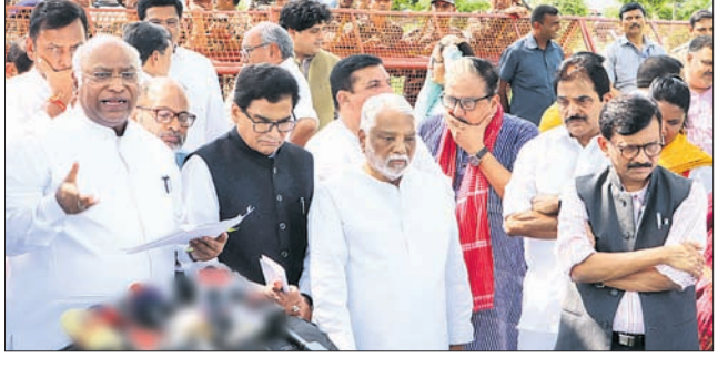
ନୂଆଦିଲ୍ଲୀର ବିକେୟ ଚୌକରେ ଆୟୋଜିତ ଖବରଦାତା ସମ୍ମିଳନୀରେ କଂଗ୍ରେସ ଅଧ୍ୟକ୍ଷ ମଲ୍ଲିକାର୍ଜୁନ ଖାର୍ଗେଙ୍କ ସହ 'ଇଣ୍ଡିଆ' ନେତୃତ୍ୱ।

ମଣିପୁର ପ୍ରସଙ୍ଗରେ ବିରୋଧୀ ଦଳଗୁଡ଼ିକ ପକ୍ଷରୁ ସାକ୍ଷାତ ପାଇଁ ରାଷ୍ଟ୍ରପତି ଶ୍ରୀପଦା ମୁର୍ତ୍ତୁକୁ ମଙ୍ଗଳବାର ସମୟ ମାଗିଛନ୍ତି କଂଗ୍ରେସ ଅଧ୍ୟକ୍ଷ ମଲ୍ଲିକାର୍ଜୁନ ଖାର୍ଗେ। ତେବେ ସାକ୍ଷାତ ପାଇଁ ରାଷ୍ଟ୍ରପତି ଏଯାବତ୍ ତାଙ୍କୁ ସମୟ ଦେଇନାହାନ୍ତି। ମଣିପୁର ହିନ୍ଦୀକୁ ନେଇ