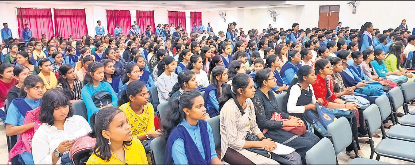
କଟକସ୍ଥିତ ରେଭେନ୍‌ସା କୁଳିୟର କଲେଜରେ ମଙ୍ଗଳବାର ଅନୁଷ୍ଠିତ ସ୍ୱାଗତ ଉତ୍ସବରେ ମୁକ୍ତ ୨ ପ୍ରଥମବର୍ଷର ଛାତ୍ରାଛାତ୍ରୀ

ବାଲେଶ୍ୱର ଜିଲ୍ଲା ବାହାନଗା ବଜାର ଷ୍ଟେଶନରେ ଭୟଙ୍କର ଟ୍ରେନ୍ ଦୁର୍ଘଟଣା ଘଟିଥିଲା। ହାଡ଼ିଠାରୁ ଟେନାଇ ଅଭିମୁଖେ ଯାଉଥିବା କରମଣ୍ଡଳ ଏକପ୍ରେସ୍ ଲୁପ୍ ଲାଇନରେ ଛିଡ଼ା ହୋଇଥିବା ମାଲବାହୀ ଟ୍ରେନ୍‌କୁ ଧକ୍କା ଦେବା ପରେ ଏହାର କେତେକ ବରି ଅନ୍ୟତକ ଗ୍ରାକ୍‌ରେ ପଡ଼ିଥିଲା।