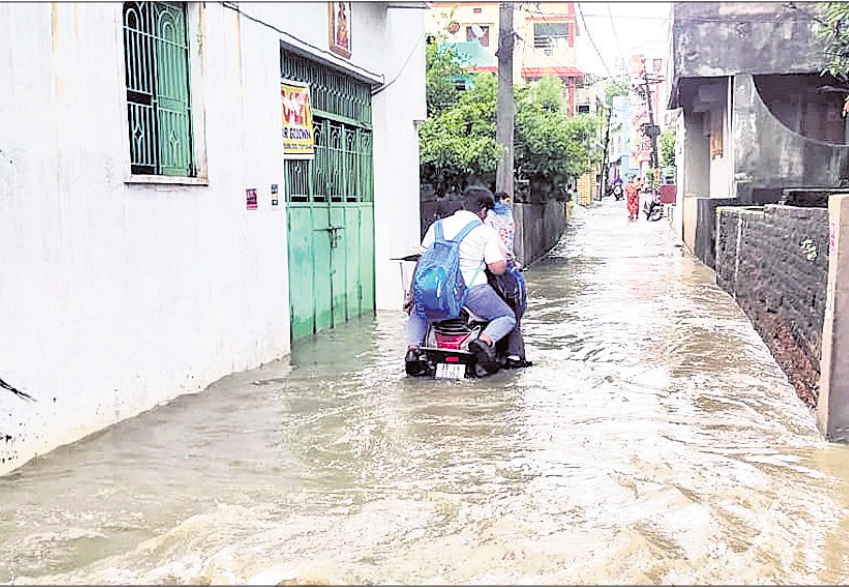
ଅନୁଗୋଳ ସହରର ବ୍ରାହ୍ମଣାବେଳ ପଡ଼ାର ବିଭିନ୍ନ ଘରେ ଆଖୁଏ ଲେଖାଏ ପାଣି ପଶିଛି।