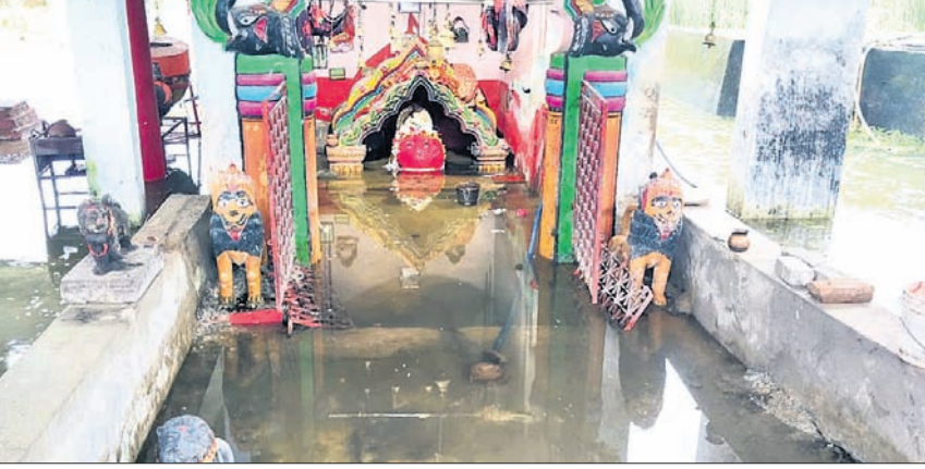
ଅନୁଗୋଳରେ ମଙ୍ଗଳବାର ପ୍ରବଳ ବର୍ଷା ଯୋଗୁଁ ୧୦୦୦ ଓଡ଼ିଆ ଥିବା ଠାକୁରାଣୀ ପାଣି ଭିତରେ ଅଛନ୍ତି।

ଲୁହା ପାଇପ୍ ବୋଝେଇ ଗାଡ଼ି ଜବତ ହେଉଥିବା, ୧୮ (ଅଧିକ ଧଳ): ଛେଡ଼ିପଦା ବ୍ଲକ୍ ନିଶା ଶିଳ୍ପାଞ୍ଚଳ ଥାନା ମଝିକା-ବଡ଼କେରକାଙ୍ଗ ରାସ୍ତାରୁ ସୋମବାର ଏକ ଚୋରା ଲୁହା ପାଇପ୍ ନେଇ ଯାଉଥିବା ଗାଡ଼ିକୁ ପୁଲିସ୍ ଜବତ କରିଛି। ପୋଲିସ୍ ପାଟ୍ରୋଲିଂ କରୁଥିବାବେଳେ ଉଚ୍ଚ ଗାଡ଼ି ସମ୍ପର୍କରେ ଖବରପାଇ ସାନକେରକାଙ୍ଗ ଛକଠାରେ ଜରି ରହିଥିଲା। ଗାଡ଼ି ଅଧିକାରୀ ଯାକ ଚାକର ଓ ଅନ୍ୟ ଜଣେ ବ୍ୟକ୍ତି ଦୌଡ଼ି ପଳାଇ ଯାଇଥିଲେ। ପୋଲିସ୍ ଗାଡ଼ି ସହ ୨ଟି ଅଧିକ ଓଜନର ୧୨ଟି ଲୁହା ପାଇପ୍ ଜବତ କରିଥିଲା। ଏ ନେଇ ନଂ. ୧୩୪/୨୩ରେ ଏକ ମାମଲା ରୁଜୁ କରି ଘଟଣାର ତଦନ୍ତ କରାଯାଇଛି।