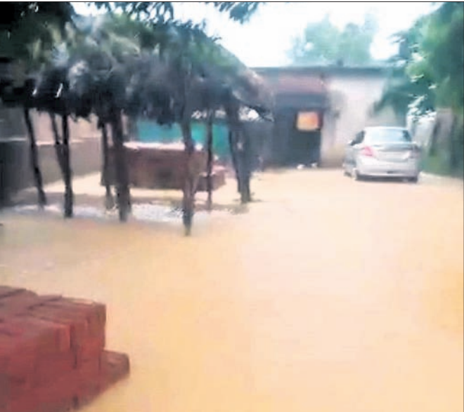
ଘର ଭିତରେ ପଶିଲା ବର୍ଷା ପାଣି : ଆଠମଲିକ ବ୍ଲକ୍ ବାସୁଦେବପୁର ପଞ୍ଚାୟତର ଗୋଲପଡ଼ା ଗ୍ରାମ ସୁମତ୍ର ମହାସ୍ତ୍ରୋକ ଘରେ ମଙ୍ଗଳବାର ବର୍ଷା ପାଣି ପଶିଯାଇଛି। ବ୍ୟବସ୍ଥିତ ଜଙ୍ଗଲରେ ଭେଦ ନିର୍ମାଣ ହୋଇ ନ ଥିବାରୁ ଉଚ୍ଚ ପରିବାର ଅଧିକାଂଶ ସମ୍ପୂର୍ଣ୍ଣାନ୍ ହେଉଛନ୍ତି।

ଉପର ମୁଣ୍ଡରେ ଲଗାଣ ବର୍ଷା ଯୋଗୁଁ ଆଠମଲିକ ବ୍ଲକ୍ ମାଧପୁର ନିକଟ ମାନଜୋରର ସେତପ୍ରକଳ୍ପର ଗୋଟିଏ ଗେଟ୍ ମଙ୍ଗଳବାର ଖୋଲା ଯାଇଛି। ଏହି ସେତ ପ୍ରକଳ୍ପର ଜଳଧାରଣ କ୍ଷମତା ୧୨୦ ମିଟର ଥିବାବେଳେ ଉପରମୁଣ୍ଡରୁ ଯେତେକ ଜଳ ପ୍ରବେଶ କରୁଛି, ସେହି ଅନୁସାରେ ଗୋଟିଏ ଗେଟ୍ ଦେଇ ଜଳ ନିଷ୍କାସନ କରାଯାଇଛି। ଫଳରେ ପ୍ରକଳ୍ପର ଜଳସ୍ତର ୧୧୯.୩ ମିଟରରେ ଥିବାରୁ ଜଣାଯାଇଛି। ଅଧିକାରୀ ଯତ୍ନ ଗ୍ରହଣ କରି ଜଳଧାରଣ କ୍ଷମତା ବୃଦ୍ଧି କରିବା ପାଇଁ ଯତ୍ନ ଗ୍ରହଣ କରିଛନ୍ତି।