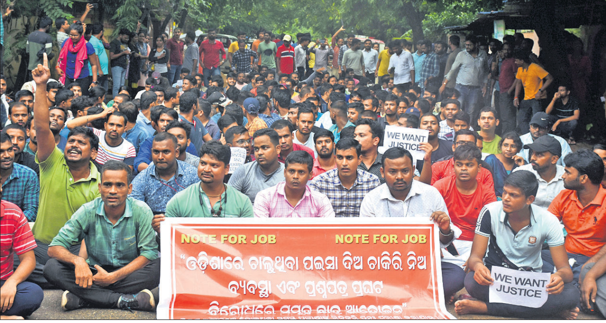
ସୁଧାକର ଆକାଶଂଷ୍ଟ ଏବଂ ଜେଲ (ସିଦ୍ଧିଲ) ପରୀକ୍ଷାପତ୍ର ଲିକ୍ସ ଘଟଣାର ବିବିଧାଳ ତଦନ୍ତ ସମେତ ଅନ୍ୟ କେତେକ ଦାବିରେ ପରୀକ୍ଷାର୍ଥୀମାନେ ମଙ୍ଗଳବାର ଭୁବନେଶ୍ୱରସ୍ଥିତ ଓଡ଼ିଶା ସ୍ୱାଧିକାରୀ କମିଶନ କାର୍ଯ୍ୟାଳୟ ସମ୍ମୁଖରେ ବିକ୍ରୋଧ କରୁଛନ୍ତି। (ରିପୋର୍ଟ: ପୃଷ୍ଠା-୪)

ପଶ୍ଚିମାଞ୍ଚଳ ବିପକ୍ଷ ଦେଖିବ ଗୁଫ୍ଟି କ୍ରିକେଟ ମ୍ୟାଚରେ ପୂର୍ବାଞ୍ଚଳର ରିୟାନ୍ ପରାଗ ଶତକ ହାସଲ କରିଛନ୍ତି।