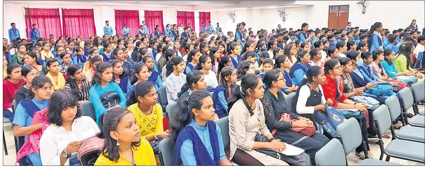
କଟକସ୍ଥିତ ରେଭେନ୍ସା କୁଳିୟର କଲେଜରେ ମଙ୍ଗଳବାର ଅନୁଷ୍ଠିତ ସ୍ୱାଗତ ଉତ୍ସବରେ ମୁକ୍ତ ୨ ପ୍ରଥମବର୍ଷର ଛାତ୍ରାଛାତ୍ରୀ

ବାଲେଶ୍ୱର ଜିଲ୍ଲା ବାହାନଗା ବଜାର ଷ୍ଟେଶନରେ ଭୟଙ୍କର ଟ୍ରେନ୍ ଦୁର୍ଘଟଣା ଘଟିଥିଲା। ହାଡ଼ିଫା ଟ୍ରେନର ଅଭିମୁଖେ ଯାଉଥିବା କରମଣ୍ଡଳ ଏକପ୍ରେସ୍ ଲୁପ୍ ଲାଇନରେ ଛିଡ଼ା ହୋଇଥିବା ମାଲବାହୀ ଟ୍ରେନ୍କୁ ଧକ୍କା ଦେବା ପରେ ଏହାର କେତେକ ବରି ଅନ୍ୟତକ ଗ୍ରାକ୍ସରେ ପଡିଥିଲା।