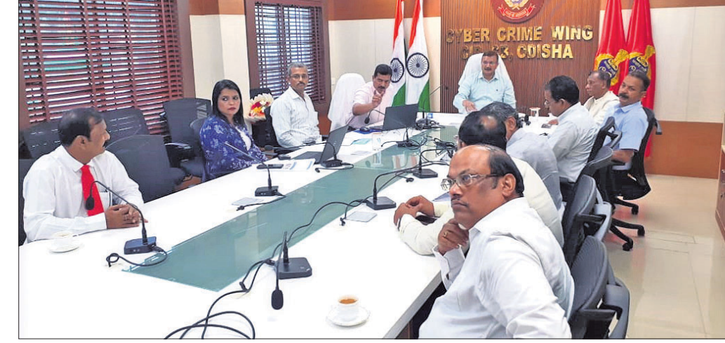
କଟକସ୍ଥିତ ରେଭେନ୍ସା କୁଳିୟର କଲେଜରେ ମଙ୍ଗଳବାର ଅନୁଷ୍ଠିତ ସ୍ୱାଗତ ଉତ୍ସବରେ ମୁକ୍ତ ୨ ପ୍ରଥମବର୍ଷର ଛାତ୍ରାଛାତ୍ରୀ