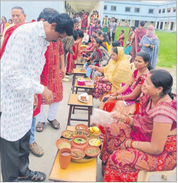
ସମ୍ବଲପୁରା ବିନ୍ଦୁ ଅବସରରେ ମଙ୍ଗଳବାର ସମ୍ବଲପୁର ଗାଉଁ ଜଳଠାରେ ସୁଆଦିଆ ଖାଦ୍ୟ ପରସାଯାଉଛି।