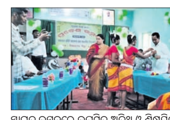
ସ୍ୱାଗତ ଉତ୍ସବରେ ଉପସ୍ଥିତ ଅତିଥି ଓ ଶିକ୍ଷୟିତ୍ରୀଶିକ୍ଷକ ।