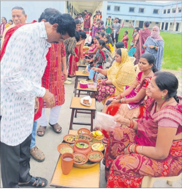
ସମ୍ବଲପୁରା ବିନ୍ଦୁ ଅବସରରେ ମଙ୍ଗଳବାର ସମ୍ବଲପୁର ଗାଉଁ ଜଲ୍ଡ଼ାରେ ସୁଆଦିଆ ଖାଦ୍ୟ ପରସାଯାଉଛି।