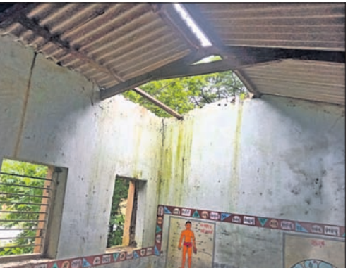
ସ୍କୁଲ ଗୃହ ଆକବେଷ୍ଟ ଏକ୍ସିଭିଟିଭିଟି ।

ବାଲିମେଳା, ୧୮୮ (ଶିବନୟ ସାହୁ) ■ ୮ ରୁ ୬ ଶ୍ରେଣୀ ଛାତ୍ର ଗଲୁଛି ପାଣି ■ ବାରଣ୍ଡାରେ ପଢୁଛନ୍ତି ଛାତ୍ରାଛାତ୍ରୀ ■ ବହୁବାର ହୋଇଛି ଚୋରି ପିଲାମାନଙ୍କ ପାଇଁ ରହିଛି ମାତ୍ର ୮ ଶ୍ରେଣୀ ଗୁରୁ । କିନ୍ତୁ ଦୀର୍ଘବର୍ଷ ହେଲା ବର୍ଷା ଦିନ ୮ ଟିକି ୬ ଟି ଶ୍ରେଣୀ ଗୁରୁର ଛାତ୍ରର ପାଣି ଗଲୁଥିବା ଯୋଗୁ ପିଲାମାନେ ସେଠାରେ ପଢିବାରେ ଅଧିକାଂଶ ସମସ୍ୟା ହେଉଛି ।