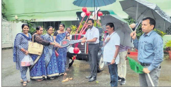
ଜିଲ୍ଲାପାଳ ଏସଏଚ୍‌ଜି ମହିଳାଙ୍କୁ ଗ୍ରାହକ ଚାବି ପ୍ରଦାନ କରୁଛନ୍ତି।

ନବରଙ୍ଗପୁର, ୧୮ (ସଦାଶିବ ପ୍ରହରାଜ) ନବରଙ୍ଗପୁର ମମତା ମହିଳା ସ୍ୱୟଂ ସହାୟକ ଗୋଷ୍ଠୀର କଷ୍ଟମ ହାଇରିଂ ସେଣ୍ଟର ଉଦ୍‌ଘାଟନ କରାଯାଇଛି।