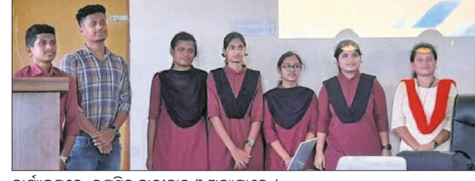
କାର୍ଯ୍ୟକ୍ରମରେ ଉପସ୍ଥିତ ଛାତ୍ରାଛାତ୍ରୀ ଓ ଅନ୍ୟମାନେ।

ନବରଙ୍ଗପୁର, ୧୮ (ସଦାଶିବ ପ୍ରହରାଜ) ମଡେଲ ଡିଗ୍ରୀ କଲେଜର ପ୍ରାଣୀବିଜ୍ଞାନ ବିଭାଗ ପକ୍ଷରୁ ଏକ ସେମିନାର କରାଯାଇଛି।