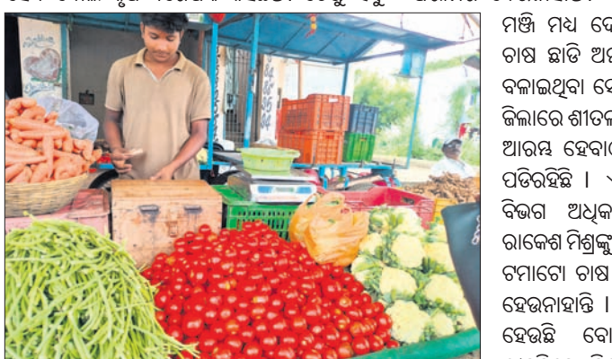
ରାୟଗଡ଼ାର ଏକ ଦୋକାନରେ ଥିବା ପରିପରିବା ।