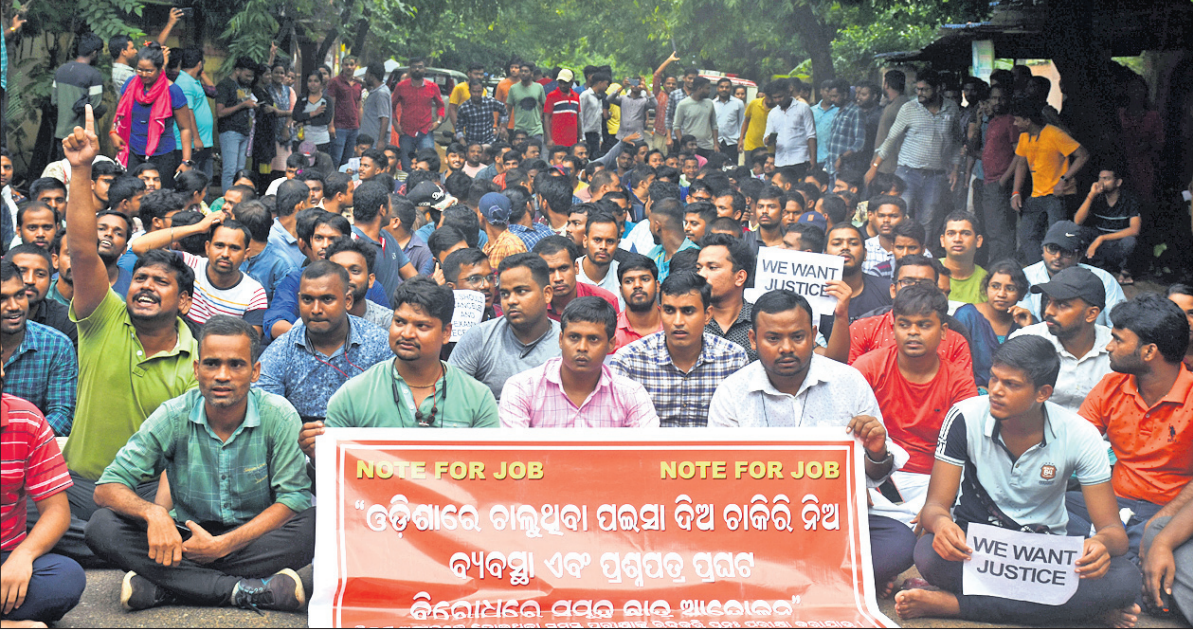
ସୁଧାକର ଆକାଶଂଷ୍ଟ ଏବଂ ଜେଲ (ସିଦ୍ଧିଲ) ପରାମର୍ଶପତ୍ର ଲିଜ୍ ଘଟଣାର ବିବିଧାଳ ତଦନ୍ତ ସମେତ ଅନ୍ୟ କେତେକ ଦାବିରେ ପରାମର୍ଥାମାନେ ମଙ୍ଗଳବାର ଭୁବନେଶ୍ୱରସ୍ଥିତ ଓଡ଼ିଶା ସ୍ୱାଧିକାରୀ କମିଶନ କାର୍ଯ୍ୟାଳୟ ସମ୍ମୁଖରେ ବିରୋଧ କରୁଛନ୍ତି। (ରିପୋର୍ଟ: ପୃଷ୍ଠା-୪)

ପଶ୍ଚିମାଞ୍ଚଳ ବିପକ୍ଷ ଦେଖିବ ଟ୍ୱେଣ୍ଟି ଟ୍ରିକେଟ ମ୍ୟାଚରେ ପୂର୍ବାଞ୍ଚଳର ରିୟାନ୍ ପରାଗ ଶତକ ହାସଲ କରିଛନ୍ତି।