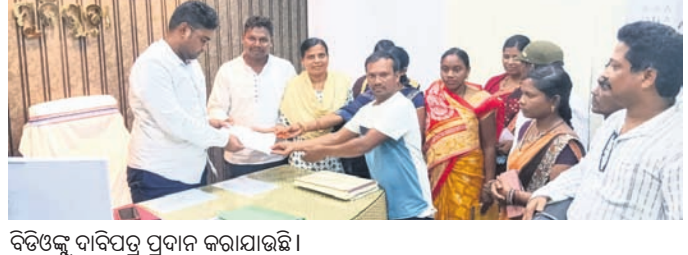
ବିତିଖିଳ ଦାବିପତ୍ର ପ୍ରଦାନ କରାଯାଇଛି।

ରାୟଗଡ଼ା ଜିଲ୍ଲା ମୁନିସିପାଲ କଲେକ୍ଟର ରାଜ୍ୟ ସରକାରଙ୍କ 'ଆମ ଓଡ଼ିଶା, ନବୀନ ଓଡ଼ିଶା' ଯୋଜନା ଖସଡ଼ା ପ୍ରସ୍ତୁତିରେ ଅନିୟମିତତା ହୋଇଥିବା ଅଭିଯୋଗ ହୋଇଛି।