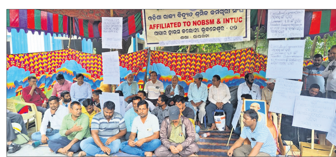
ବିଦ୍ୟୁତ୍ ଶ୍ରମିକ ସଂଘର କର୍ମକର୍ତ୍ତା ଧାରଣାରେ ବସିଛନ୍ତି ।

ଗାଟା ପାଞ୍ଜିର ଦାୟିତ୍ୱ ନେବା ପରେ ବିଭିନ୍ନ ପଦବୀରେ ପୁରୁଣା କର୍ମଚାରୀଙ୍କୁ ପଦୋଚ୍ଚତା ଦେବା ବଦଳରେ ନୂତନ କର୍ମଚାରୀଙ୍କୁ ନିଯୁକ୍ତି ଦେବା, ନିର୍ବାହୀ ଯନ୍ତ୍ରୀ ଓ ଅଧ୍ୟକ୍ଷଙ୍କ ଯନ୍ତ୍ରଣା କ୍ଷମପତ୍ରକୁ ସ୍ୱୀକୃତି କରି ସମସ୍ତ ଏକତାରେ ଆ