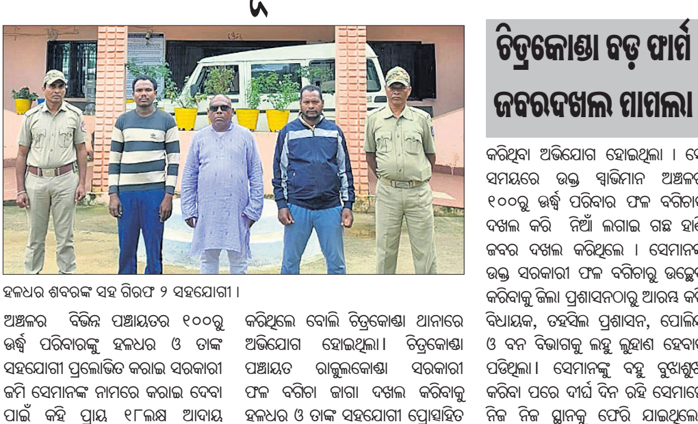
ଅଞ୍ଚଳର ଶବ୍ଦରକ ସହ ଚିତ୍ରକୋଣା ୨ ସହଯୋଗୀ ।