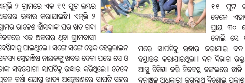
ଊତ୍ତରକୁ ଚାଲି ଆସିଥିବା ନାୟକ କହିଥିଲେ ।