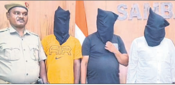
ଗିରଫ ୩ ଅଭିଯୁକ୍ତ ଓ ଜବତ ଚୁଲି।

ସମ୍ବଲପୁର, ୧।୮ (ଶୁଭାଶିଷ ପାଠୀ) ସମ୍ବଲପୁରରେ ଆପରାଧିକ କାର୍ଯ୍ୟରେ ବନ୍ଧୁକ ବ୍ୟବହାର କରୁଛନ୍ତି ଅପରାଧୀ। ଏଭଳି ସୂଚନା ମିଳିବା ପରେ ପୋଲିସ୍ ମଙ୍ଗଳବାର ସ୍ୱତନ୍ତ୍ର ଭାବେ ଚଢ଼ାଉ କରି ୩ ଅଭିଯୁକ୍ତଙ୍କୁ ଗିରଫ କରିବା ସହ ସେମାନଙ୍କଠାରୁ ବନ୍ଧୁକ, ଜାବତ ଚୁଲି ଓ ଅନ୍ୟ ସାମଗ୍ରୀ ଜବତ କରିଛି। ଜିଲ୍ଲା ଅପରାଧମୁକ୍ତ କରିବାକୁ ଏଭଳି ଚଢ଼ାଉ ଜାରି ରହିବ ବୋଲି ଏସ୍‌ପି ପୁରକଣ ଭାଦ୍ରୁ ଏସ୍‌ପି ଅପ୍‌ସରେ ଆନ୍ଦୋଳିତ ଖବରଦାର ସମ୍ମିଳନୀରେ ସୂଚନା ଦେଇଛନ୍ତି। ସେ ଆହୁରି କହିଛନ୍ତି, ବିଶେଷ ପୁସ୍ତକ ଖବର ମିଳିବା ପରେ ପୋଲିସ୍