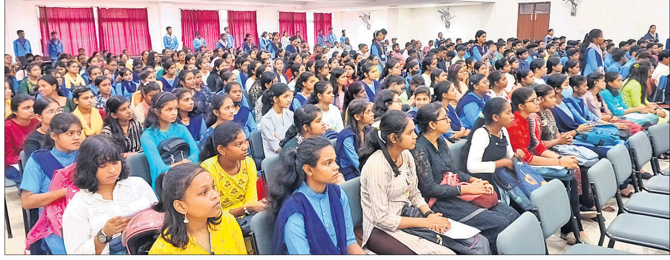
କଟକସ୍ଥିତ ରେଭେନ୍ସା କୁନିୟର କଲେଜରେ ମଙ୍ଗଳବାର ଅନୁଷ୍ଠିତ ସ୍ୱାଗତ ଉତ୍ସବରେ ଯୁକ୍ତ ୨ ପ୍ରଥମବର୍ଷର ଛାତ୍ରାଛାତ୍ରୀ।