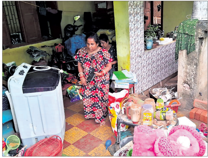
ରାଜୀବନଗରରେ ଏକ ପରିବାର ଘର ଛାଡ଼ୁଛନ୍ତି ।

ଅଞ୍ଚଳରେ ରହିଥିଲେ, ହେଲେ ଏମିତି ଅବସ୍ଥା ହେବ ବୋଲି ଭାବି ନ ଥିଲେ । ସୋମବାରଠାରୁ ଘରେ ବର୍ଷା ଓ ଥଣ୍ଡା ପାଣି ପଶିବା ପରେ ସବୁ ସ୍ୱପ୍ନ ଭାଙ୍ଗି ଯାଇଛି । ଭୋକ, ଶୋଷ, ଅନିଦ୍ରାରେ ରହିବା ପରେ ଜଳବନ୍ଦୀ ଅଞ୍ଚଳର ବହୁ ପରିବାର ଏବେ ଘର ଛାଡ଼ିବା ଆରମ୍ଭ କରିଛନ୍ତି । ଅଧିକାଂଶ ଗାଁ ମୁହାଁ ହୋଇଥିବାବେଳେ ଆଉ କେତେକ ପରିବାର ସମ୍ପୂର୍ଣ୍ଣ ଘର ଆଶ୍ରୟ ନେଇଛନ୍ତି । ଘର ଛାଡ଼ୁଥିବା ଲୋକଙ୍କ ମୁହଁରେ ଦେଖିବାକୁ ମିଳୁଥିଲା ଦୁଃଖ ଓ ଶୋଭା । କେହି କେହି ଭୁବନେଶ୍ୱର ମହାନଗର ନିଗମ (ବିଏମ୍‌ସି)ର କାର୍ଯ୍ୟାଳୟକୁ ନେଇ ଅସନ୍ତୋଷ ପ୍ରକାଶ କରୁଥିବାବେଳେ ଆଉକେହି ଏଭଳି