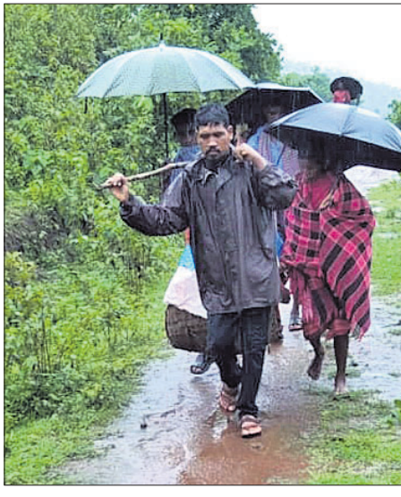
ତାଙ୍କୁ କୋରାପୁଟରୁ ଶିହୀବ ଲକ୍ଷ୍ମଣ ନାୟକ ମେଡିକାଲ କଲେଜ ଓ ହସ୍ପିଟାଲକୁ ଅଣାଯାଇଛି।