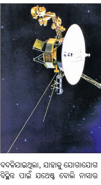
ବଳିଯାଇଥିଲା, ଯାହାକୁ ଯୋଗାଯୋଗ ବିଚ୍ଛିନ୍ନ ପାଇଁ ଯଥେଷ୍ଟ ବୋଲି ନାସାର

ଆମେରିକାର ମହାକାଶ ଗବେଷଣା ସଂସ୍ଥା ନାସାର ଭୁଲ୍ କମାଣ୍ଡ ଯୋଗୁ ୧୨.୩ ବିଲିୟନ ମାଲ୍ଲ (୧୯୯୦ କୋଟି କିଲୋମିଟର) ଦୂରରେ ଥିବା ଭୟଜର-୨ ପ୍ରୋଏ ସହ ଏହାର ଯୋଗାଯୋଗ ବିଚ୍ଛିନ୍ନ ହୋଇଛି । ୧୯୭୭ରେ ଭୟଜର-୨ ଲଞ୍ଚ କରାଯାଇଥିଲା ଏବଂ ୨୦୧୮ରେ ଏହାର ଯମଜ ସହ ସାମିଲ ହୋଇଥିଲା । ମହାକାଶକୁ ଏପର୍ଯ୍ୟନ୍ତ ପଠାଯାଇଥିବା ଦସ୍ତୁ ମଧ୍ୟରୁ ଭୟଜର-୨ ସର୍ବାଧିକ ଦୂରତାରେ ରହିଛି । ଯୋଜନା ଅନୁଯାୟୀ ବୈଜ୍ଞାନିକମାନେ ଜୁଲାଇ ୨୧ରେ କେତେକ କମାଣ୍ଡ ଦେଉଥିବାବେଳେ ଭୁଲ୍‌ରେ ଭୟଜର-୨ର ଆଖିନୀର ବିନା ପୃଥିବୀଠାରୁ ୨ ପ୍ରତିଶତ