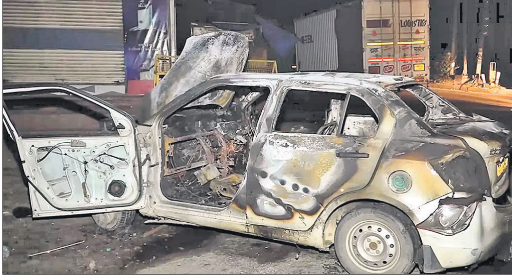
ଗୁରୁଗ୍ରାମର ସୋହନାରେ ଦଙ୍ଗାକାରୀମାନେ କାର୍ କାଳି ଦେଇଛନ୍ତି ।