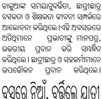
ନିରାକାରପୁର, ୧୮ (ମାନସ ଚନ୍ଦ୍ର ପଟ୍ଟନାୟକ)

ଖୋର୍ଦ୍ଧା ଜିଲ୍ଲା ଜଳିଆ ଥାନା ଅନ୍ତର୍ଗତ ଗନ୍ଧାବନ୍ଧ ଛକ ୧୬ ନମ୍ବର ଜାତୀୟ ଉଚ୍ଚପଥରେ ମଙ୍ଗଳବାର ଏକ ଅଭାବନାୟ ଘଟଣା ଘଟିଛି। ଅପରାହ୍ଣରେ ବୁଢ଼ପୁରରୁ ଭୁବନେଶ୍ୱରକୁ ଅଭିଯୁକ୍ତ ଯାତ୍ରୀଙ୍କୁ ଏକ ଯାତ୍ରାବାହୀ ବସରେ କୌଣସି କାରଣରୁ ନିଆଁ ଲାଗିଯାଇଥିଲା। ଏହା ଦେଖି ସଙ୍ଗେ ରାଜକ ଗାଡ଼ିକୁ ଅଟକାଇଥିଲେ। ଯାତ୍ରୀମାନେ ବାହାରକୁ ଆସିବା ପରେ ଘାଆ ଲୋକଙ୍କ ସହାୟତାରେ ନିଆଁକୁ ଆୟତ୍ତ କରାଯାଇଥିଲା। ଫଳରେ ଏକ ବଡ଼ ଦୁର୍ଘଟଣା ଚଳି ଯାଇଥିଲା। ଯାତ୍ରୀମାନଙ୍କୁ ଅନ୍ୟ ଏକ ବସରେ ଗନ୍ଧାବନ୍ଧକୁ ପଠାଯାଇଥିଲା।