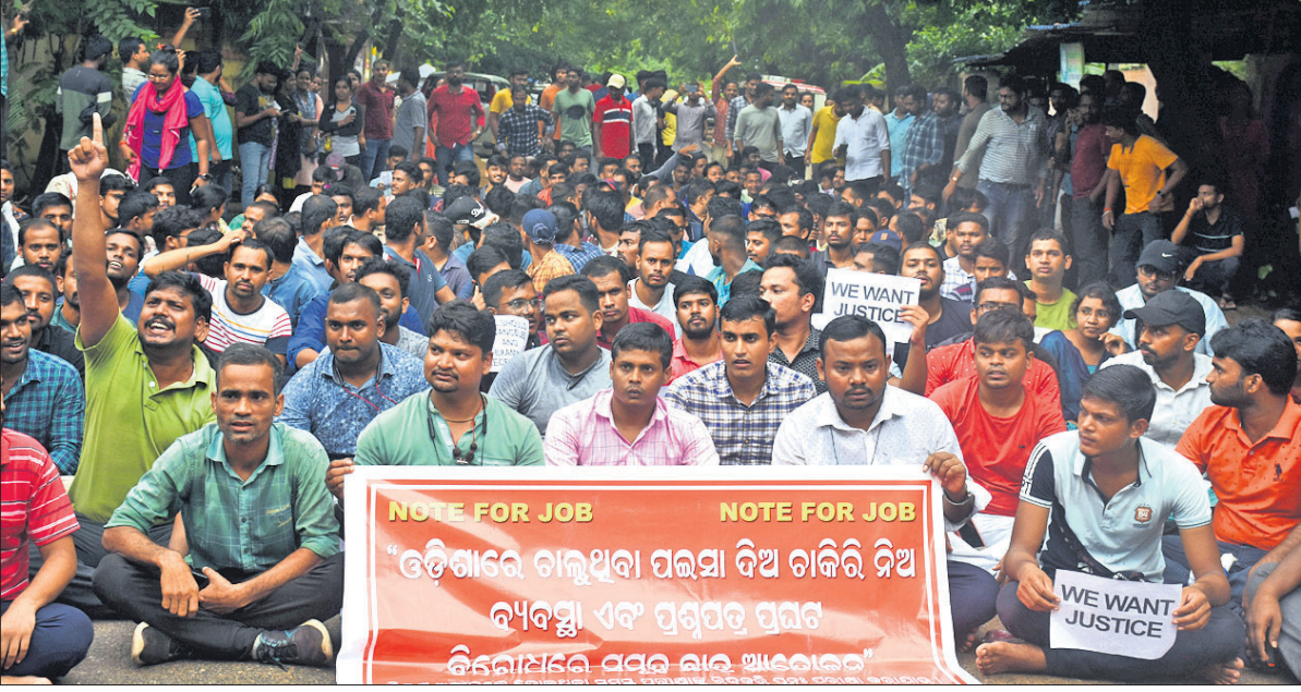
ସୁଧାକର୍ ବିଆକରଙ୍କ ଏବଂ କେ.ଏ.ଏ. (ସି.ଏ.ଏ.) ପରାମର୍ଶପତ୍ର ଲିଜ୍ ଘରଣୀର ବିବିଧାଳ ତଦନୁସାରେ ଅନ୍ୟ କେତେକ ଦାବିରେ ପରାମର୍ଶାମାନେ ମଙ୍ଗଳବାର ଭୁବନେଶ୍ୱରସ୍ଥ ଉଡ଼ିଶା ସ୍ମାର୍ଟ ସିଲେକ୍ସନ କମିଶନ କାର୍ଯ୍ୟାଳୟ ସମ୍ମୁଖରେ ବିରୋଧ କରୁଛନ୍ତି। (ରିପୋର୍ଟ: ପୃଷ୍ଠା-୪)

ପଶ୍ଚିମାଞ୍ଚଳ ବିପକ୍ଷ ଦେଖିବ ଗୁଫ୍ଟି କ୍ରିକେଟ ମ୍ୟାଚରେ ପୂର୍ବାଞ୍ଚଳର ରିୟାନ୍ ପରାଗ ଶତକ ହାସଲ କରିଛନ୍ତି।