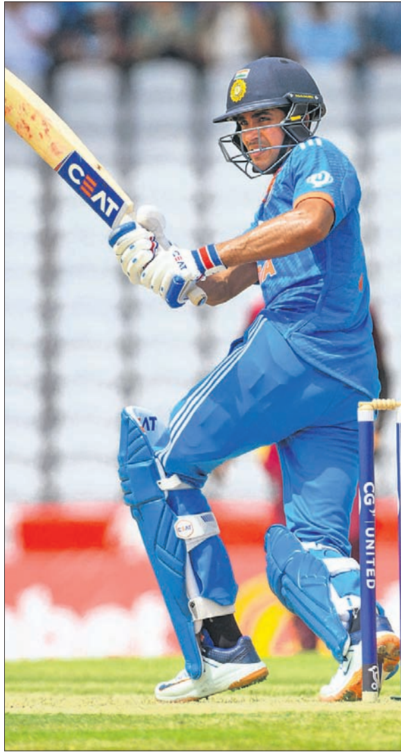
ଅର୍ଦ୍ଧଶତକୀୟ ଲନିଂସ ଅବସରରେ ଶୁବମାନ ରିଲ୍ ।

ଲେଖାଏ ଉଇକେଟ ନେଇଛନ୍ତି । ୩୫୨ ରନ ଲକ୍ଷ୍ୟର ଗାପ ଆରମ୍ଭରୁ ସ୍ୱସ୍ତ ହୋଇଥିଲା । ଫ୍ରେଷ୍ଟଲଣ୍ଡି ୧୭ ରନରେ ପ୍ରଥମ ୩ ଉଇକେଟ ହରାଇଥିଲା । ମୁକେଶ କୁମାର ପ୍ରଥମ ୩ ଉଇକେଟ ନେଇଥିଲେ । ପରେ ଶାର୍ଦ୍ଦୁଳ ଠାକୁର ୨ ଓ ଜୟଦେବ ଉନାଦକଟ ଗୋଟିଏ ଉଇକେଟ ନେବାକୁ ଯତ୍ନକଲେ । ଦଳ ୫୦ ରନରେ ୬ ଉଇକେଟ ହରାଇଥିଲା । ଏକମାତ୍ର ଖେଳାଳି ଭାବରେ ଆଲିନ୍ ଅଧାନଜେ ଦୁଇ ଅଙ୍କ ଘୋରରେ ପହଞ୍ଚିଥିଲେ । ଭାରତ ପକ୍ଷରୁ ମୁକେଶ କୁମାର ୩, ଶାର୍ଦ୍ଦୁଳ ୨ ଓ ଉନାଦକଟ ଗୋଟିଏ ଉଇକେଟ ଅକ୍ତିଆର କରିଛନ୍ତି । ସଂକ୍ଷିପ୍ତ ସ୍ୱୋର ଭାରତ ୫୦ ଓଭରରେ ୩୫୧/୫ (ଶୁବମାନ ରିଲ୍-୮୫, ଇଶାନ୍ କିଶନ-୭୭, ହାର୍ଦ୍ଦିକ ପାଣ୍ଡା-୭୦, ରୋମାରିଓ ଶେଫର୍ଡ୍-୨/୭୩, ଆଲଜାରି ଯୋଶେଫ୍-୧/୭୭, ଯାନିକ୍ କାରିଆ-୧/୫୮) । ଫ୍ରେଷ୍ଟଲଣ୍ଡି ୧୮ ଓଭରରେ ୭୨/୬ (ଆଲିନ୍ ଅଧାନଜେ-୨୪, ମୁକେଶ କୁମାର-୩/୧୫, ଶାର୍ଦ୍ଦୁଳ ଠାକୁର-୨/୨୪, ଜୟଦେବ ୧ ନା।ତକଟ-୧/୧୦) ।