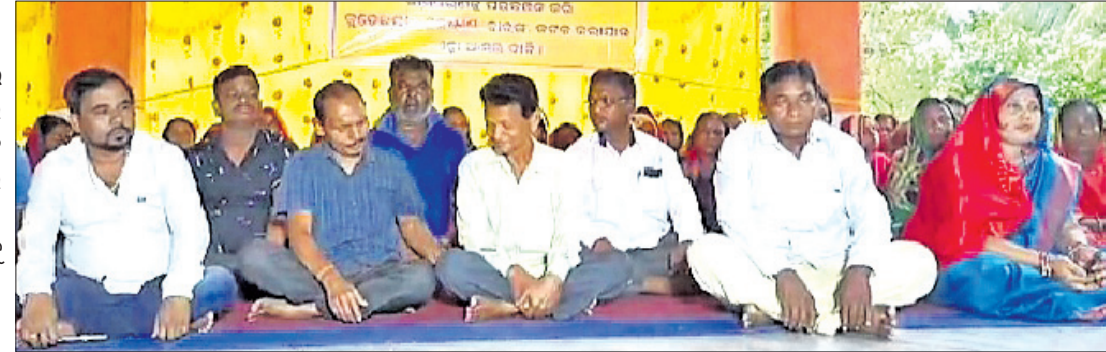
ଖବରଦାତା ସମ୍ମିଳନୀରେ ଉପସ୍ଥିତ ଗ୍ରାମବାସୀ।