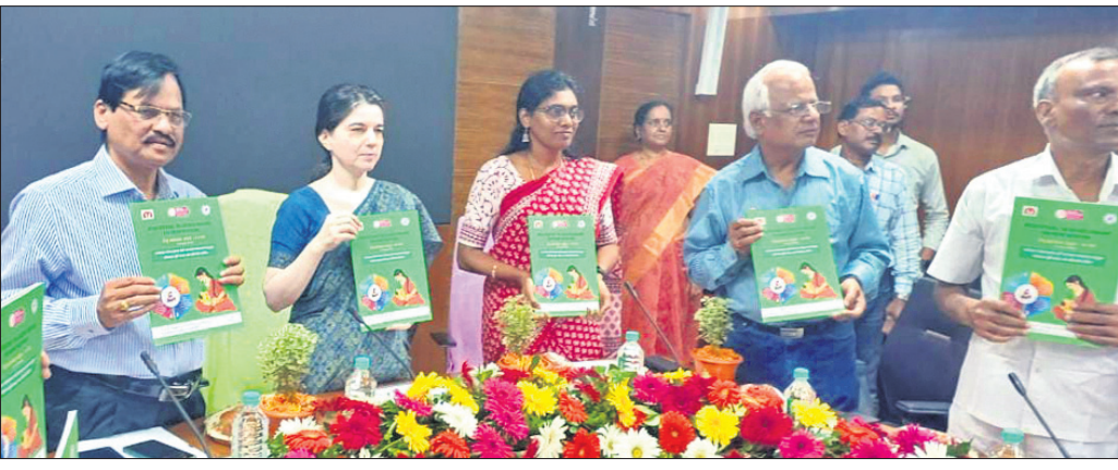
ବିଶ୍ୱ ସ୍ତ୍ରୀମାନଙ୍କ ସଂଗ୍ରହ ଅବସରରେ ସାମ୍ବଲ ଓ ପରିବାର କଲ୍ୟାଣ ବିଭାଗ ପକ୍ଷରୁ ଆୟୋଜିତ କାର୍ଯ୍ୟକ୍ରମରେ ଉପସ୍ଥିତ ଅତିଥିମାନେ।