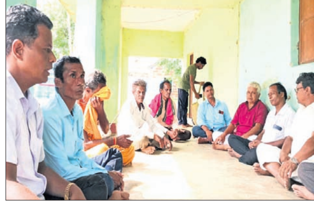
ବୈଠକରେ ଉପସ୍ଥିତ ପାଳା ବାୟକ ସଂଘର କର୍ମକର୍ତ୍ତା।