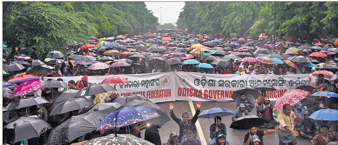
ନବୀନ ନିବାସ ଅଭିମୁଖେ ଯିବା ପୂର୍ବରୁ ଓଡ଼ିଶା ସରକାରୀ ଆଉଟ୍‌ସୋର୍ସିଂ କର୍ମଚାରୀମାନେ ଲୋୟର ପିଏମ୍‌ଜିରେ ବର୍ଷା ଭିଜି ବିରୋଧ ପ୍ରଦର୍ଶନ କରୁଛନ୍ତି।