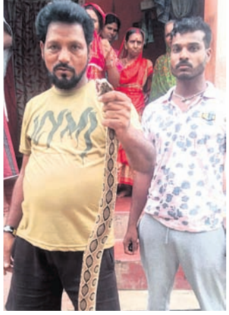
ବୋଲଗଡ଼, ୧୮ (ଦେବବ୍ରତ ହୋତା)

ବୋଲଗଡ଼ ରୁକ୍ମ ଖଜୁରିଆ ପଞ୍ଚାୟତ ସଂପୂର୍ଣ୍ଣ ଗ୍ରାମ ବଡ଼ସାହି (ଛୋଟ ରାୟପୁର)ର ଶିଶୁ ଯାତ୍ରାପାଇଁ ଚିନ୍ତା କରାଯାଇଛି। ଏହାର ଲକ୍ଷ୍ୟ ପ୍ରାୟ ୮ ଟଙ୍କା ପ୍ରତି ପ୍ରାଥମିକ, ଦ୍ୱିତୀୟ ଓ ତୃତୀୟ ଶିକ୍ଷା ପାଇଁ ପରିବାରଲୋକଙ୍କୁ ସହାୟତା ପ୍ରଦାନ କରିବା। ଏନେଇ ପରିବାର ଲୋକଙ୍କୁ ବୋଲଗଡ଼ ଗଡ଼ ଉତ୍ତର ସାହିର ସାପଥରାଳି ଗବାଧର ଚମ୍ପକୀ ଜଣାଇଥିଲେ। ଗବାଧର ପହଣ୍ଡି ସାପଥରାଳି ଧରିବା ସହିତ ବୋଲଗଡ଼ ନିକଟ ବେଗୁନିଆପଡା ନାଳ ପାଠରେ ଥିବା ଜଙ୍ଗଲରେ ଛାଡ଼ିଥିଲେ।