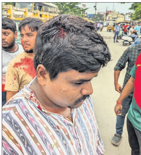
ଗଣଗୋଳରେ ଆହତ ହୁଇ ଛାତ୍ର।

ସମ୍ବଲପୁର, ୧୮ (ଶୁଭାକ୍ଷିପ ପାଠକ) ସମ୍ବଲପୁର ଗଣାଧାର ମେହେର ବିଶ୍ୱବିଦ୍ୟାଳୟ (ଜିଏମ୍‌ସି) ପରିସରରେ ମଙ୍ଗଳବାର ସମ୍ବଲପୁର ଦିନ କାର୍ଯ୍ୟକ୍ରମ ଚାଲିଥିବାବେଳେ ଦୁଇ ଗୋଷ୍ଠୀ ମଧ୍ୟରେ ସଂଘର୍ଷ ହୋଇଥିଲା।