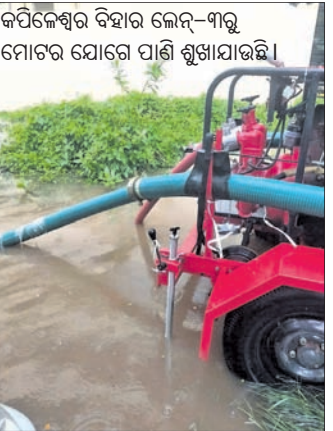
କପିଳେଶ୍ୱର ବିହାର ଲେନ୍-୩ରୁ ମୋଟର ଯୋଗେ ପାଣି ଶୁଖାଯାଉଛି ।

କେବଳ ଆଜି ନୁହେଁ, ପ୍ରତିବର୍ଷ ବର୍ଷା ହେଲେ ରାଜଧାନୀ ଉତ୍ତରକୁ ହେଉଛି । ଭିତର ଜଳ ନିଷ୍କାସନ ବ୍ୟବସ୍ଥା ପାଇଁ ଯଥାସାଧ୍ୟ ଉଦ୍ୟମ କରାଯାଉଥିବା ପ୍ରତିଅର ବିଏମ୍‌ସି କହୁଥିଲେ ମଧ୍ୟ ସମସ୍ୟା ସମାଧାନ ପରିବର୍ତ୍ତେ କ୍ରମଶଃ ବଢ଼ି ଚାଲିଛି । ବିଏମ୍‌ସିର ସବୁ ବୈଠକ ସମସ୍ତ କୌଶଳ ଫୋଲ୍ ମାଉଛି । ବର୍ଷ ବର୍ଷ ଧରି ଏହି ସମସ୍ୟା ଲାଗି ରହିବା ପରେ ୨୦୧୯ ମସିହାରେ ସହର ମଝିରେ ଯାଇଥିବା ୧୨ଟି ପ୍ରାକୃତିକ ନାଳର ପୁନରୁଦ୍ଧାର କରିବାକୁ ଯୋଜନା ହୋଇଥିଲା । କାରଣ ଏହାକୁ ପ୍ରାକୃତିକ ନାଳ କରିଆରେ ସହରର ବର୍ଷା ଓ ବର୍ଷା ଜଳ ନିଷ୍କାସିତ ହୋଇଥାଏ । କିନ୍ତୁ ଏହା ଥଣ୍ଡା ଓସାରିଆ ହୋଇଯାଇଥିବାରୁ ଜଳ ନିଷ୍କାସିତ ହୋଇ ପାଉନାହିଁ । ସେଥିପାଇଁ ମୋଟ ୬୫.୬୨୧ କିମିର ଏହି ୧୨ଟି ପ୍ରାକୃତିକ ନାଳର ପୁନରୁଦ୍ଧାର ପାଇଁ ୬୧.୪୩୮ ଏକର ଘରୋଇ ଜମି ଅଧିଗ୍ରହଣ କରିବାକୁ ୨୫୩ କୋଟି ଖର୍ଚ୍ଚ ଅଟକଳ କରାଯାଇଥିଲେ ବି ଏଯାବତ୍ ହୋଇପାରି ନାହିଁ । ଅପରପକ୍ଷେ ସହରର ଏଭଳି ଅବସ୍ଥା ପାଇଁ ବିଏମ୍‌ସିକୁ କଠୋର ସମାଲୋଚନା ଶୀକାର ହେବାକୁ ପଡ଼ୁଛି । ଜନସାଧାରଣ ସୋସିଆଲ ମିଡ଼ିଆ ମାଧ୍ୟମରେ ବିଏମ୍‌ସିର ଅପାରଗତାକୁ ଦର୍ଶାଇ କଟାକ୍ଷ କରୁଥିବା ଦେଖାଯାଇଛି ।