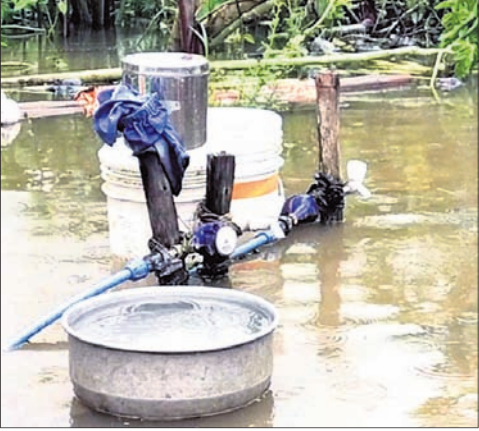
ବର୍ଷା ଯୋଗୁ ପାନୀୟଜଳ ଯୋଗାଣ ବନ୍ଦ ରହିଛି।