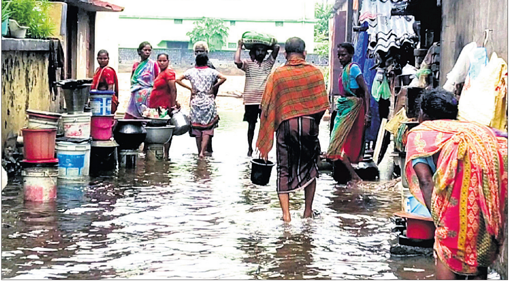
ଲଗାଣ ବର୍ଷା ଯୋଗୁ ବ୍ୟାସନଗର ପୌର ପରିଷଦର ଏକ ବସ୍ତୁରେ ପାଣି ଜମିରହିଛି।

ପୁଖ୍ୟତଃ ସହରର ଆବଶ୍ୟକ ପୁରାବକ ଡ୍ରେନ ନ ଥିବାରୁ ବର୍ଷାଜଳ ନିଷାସନ ହୋଇ ନ ପାରି ବିଭିନ୍ନ ଅଞ୍ଚଳରେ ଜମିରହିଛି। ବର୍ଷାଦିନ ପୂର୍ବରୁ ପୌର ପରିଷଦ ପକ୍ଷରୁ ଡ୍ରେନଗୁଡ଼ିକୁ ପରିଷ୍କାର କରାଯାଇ ନାହିଁ, ଯଦ୍ୱାରା ଜଳ ନିଷାସନ ହୋଇ ନ ପାରି ବନ୍ୟା ପରିସ୍ଥିତି ସୃଷ୍ଟି କରୁଛି। ସହରର ଷ୍ଟେଶନ ବଜାର, ରାଧାନାଥ ମାର୍ଗ, ଉପାପଦା, ନହକା, ମହିପାଳ କଲୋନୀ, ଦଳା,