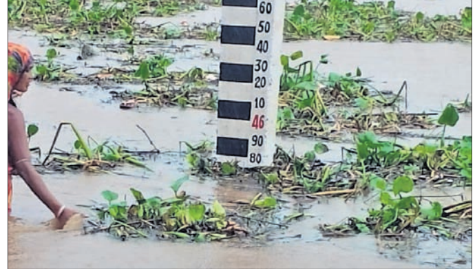
ଲୋକମାନେ ବନ୍ୟାଜଳକୁ କାଠି ସଂଗ୍ରହ କରୁଛନ୍ତି ।

ନାଳ ଓ କଳାପାଟ ପାଠ ନାଳରେ ୨ଫୁଟ ବନ୍ୟାଜଳ ପ୍ରବାହିତ ହେଉଛି । ସେହିପରି ସାଉଁଧ ବଡ଼ମୁଳ ମଙ୍ଗଳନାପାଠରେ ଥିବା ସାତକୋଣିଆ ପରିବେଶ ପର୍ଯ୍ୟନ୍ତ କେନ୍ଦ୍ର ପରିସରରେ ବନ୍ୟାଜଳ ପ୍ରବେଶ କରିଛି । ଲତାଣ ବର୍ଷା ପ୍ରଭାବରେ ବଡ଼ମୁଳ, ଛାମୁଣିଆ, ରାସଙ୍ଗ ଆଦି ଗହିରା ବିଲରେ ବନ୍ୟାଜଳ ପ୍ରବେଶ କରିଛି । ଏ ନେଇ ଗଣିଆ ବିଡ଼ିଓ ଓ ତହସିଲଦାରଙ୍କୁ ସୂଚନା କରାଯିବା ସହ ନଦୀକୁଳିଆ ଲୋକମାନଙ୍କୁ ସତର୍କ ରହିବା ପାଇଁ ନୟାଗଡ଼ ଜିଲାପାଳ ନିର୍ଦ୍ଦେଶ ଦେଇଛନ୍ତି । ତେବେ ସାମାନ୍ୟ ବନ୍ୟା ପରିସ୍ଥିତିକୁ ମୁକାବିଲା କରିବା ପାଇଁ ଲୁକ ପ୍ରଶାସନ ତରଫରୁ ସମସ୍ତ ପ୍ରସ୍ତୁତି ଶେଷ ହୋଇଥିବା ଗଣିଆ ବିଡ଼ିଓ ଖବରଦାତା ପାତ୍ର କହିଛନ୍ତି ।