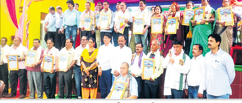
ଆଲୋଚନାଚକ୍ରରେ ସମ୍ବର୍ଦ୍ଧିତ ହୋଇଥିବା ବ୍ୟକ୍ତିମାନେ ।