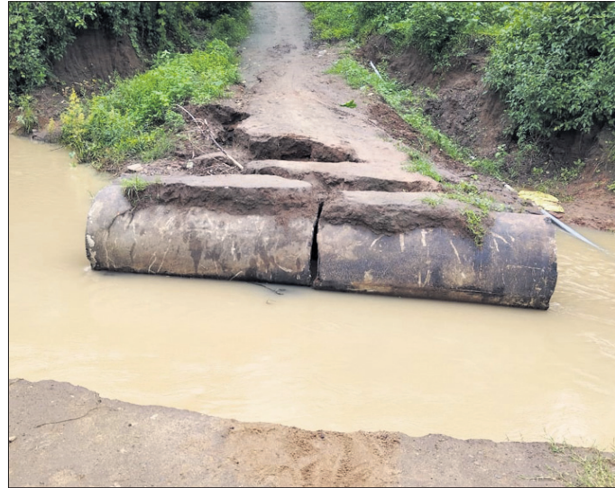
ଧୋଇହୋଇଯାଇଥିବା ରାସ୍ତାରେ ବନ୍ୟାଜଳ ।

ଲଘୁଚାପ ପ୍ରଭାବରେ ଦଶପଲ୍ଲୀ ଅଞ୍ଚଳରେ ମଙ୍ଗଳବାର ଓ ରୁଧିରା ବର୍ଷା ଲାଗି ରହିଛି । ଏଥିପାଇଁ କେତେକ ଅଞ୍ଚଳ ସହିତ ଯୋଗାଯୋଗ ବିଚ୍ଛିନ୍ନ ହୋଇଛି । ତଳିଆ ଅଞ୍ଚଳ ଜଳସ୍ତର ହୋଇଛି । ଦଶପଲ୍ଲୀର ଆଦିବାସୀ ବହୁଳ ନୂଆଗାଁ ପଞ୍ଚାୟତର ଦୋଳପୁରୋଇ କଳସାଠାରେ ଥିବା ଚୁକେଇ ନାଳରେ ବର୍ଷା ଯୋଗୁ ବନ୍ୟାଜଳ ପ୍ରବାହିତ ହେଉଛି । ଫଳରେ ରାସ୍ତା ଧୋଇଯିବାରୁ ଯାତାୟତ ବାଧାପ୍ରାପ୍ତ ହୋଇଛି । ଆଦିବାସୀମାନେ ଯାତାୟତରେ ନାନା ସମସ୍ୟାର ସମ୍ମୁଖୀନ ହେଉଛନ୍ତି । ନାଳର ଦୁଇ ପଟେ ଲୋକମାନେ ଅଟକି ରହିଥିଲେ । ପାଣି କମିବା ପରେ ସେମାନେ ନିଜ ଘରକୁ ଫେରିଛନ୍ତି ।