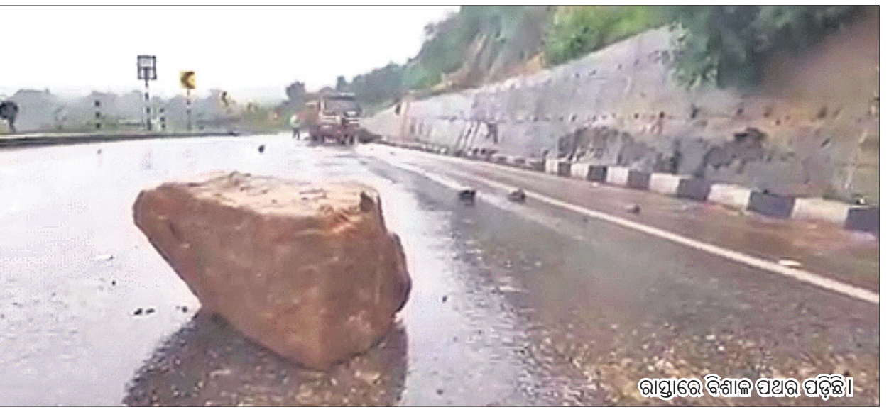
ରାସ୍ତାରେ ବିଶାଳ ପଥର ପଡ଼ିଛି।

କରାଯାଇ ନ ଥିବାରୁ ଅବରୋଧ ପ୍ରକାଶ ପାଇଛି। ଅତଡ଼ା ନ ଖସିବା ପାଇଁ ବହୁ ଅର୍ଥ ବ୍ୟୟରେ ତାରକାଳି ବିଛାଯାଇଥିଲେ ହେଁ ସେ ସବୁ ଛିଣ୍ଡିଯାଇଛି। ଫଳରେ ବାର୍ଦ୍ଧ ପ୍ରାୟ ୧ କି.ମି. ବ୍ୟାପି ରାସ୍ତା ଏହି କାରଣରୁ ଅସୁରକ୍ଷିତ ଅବସ୍ଥାରେ ରହିଛି। ମାଟି ଓ ପଥର ଖସୁଥିବାରୁ ଲୋକମାନେ ଭୟଭୀତ ହୋଇ ଯାତାୟାତ କରୁନାହାନ୍ତି। ଠିକ୍ ମାନର ତାରକାଳି ବିଛାଯାଇ ନ ଥିବାରୁ ଏଭଳି ଅବସ୍ଥା ବାରମ୍ବାର ଉଠୁଛି ବୋଲି ଅଭିଯୋଗ ହେଉଛି।