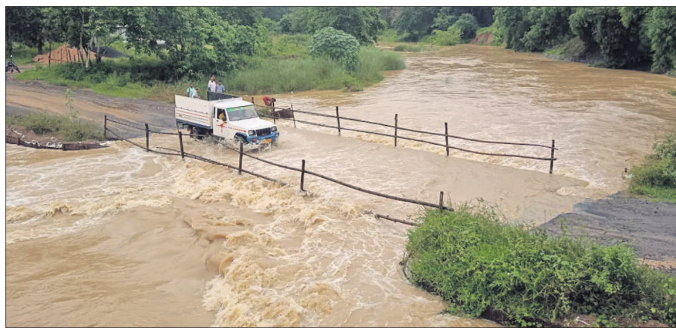
ଅସ୍ଥାୟୀ ରାସ୍ତା ଉପରେ ବନ୍ୟା ଜଳ ପ୍ରବାହିତ ହେଉଛି ।