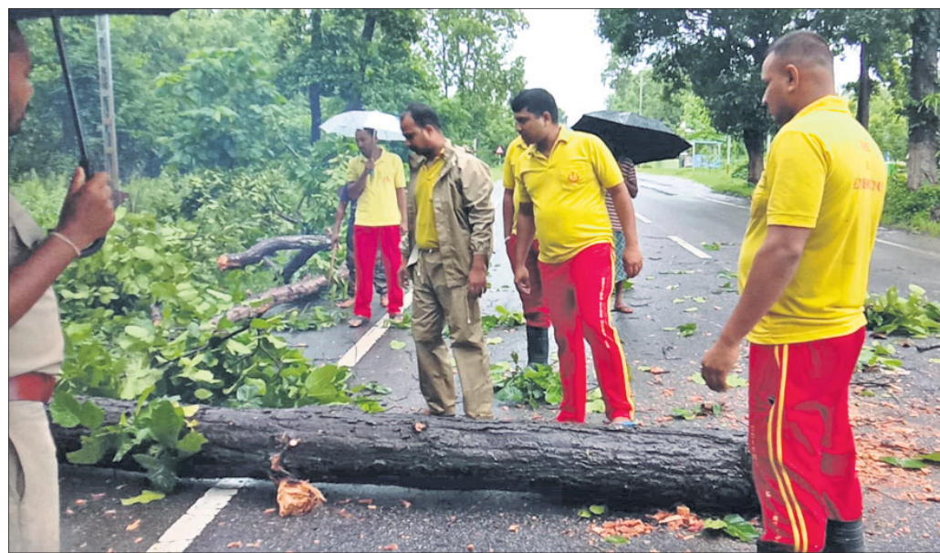
କୁମୁଦୀ ନିକଟରେ ବନକ କର୍ମଚାରୀମାନେ ଗଛକାଟି ସଫା କରୁଛନ୍ତି ।

କୁମୁଦୀର ଦଶପଲ-ଗଣିଆ ରାସ୍ତାରେ ଏକ ବିରାଟ ଆୟତନ ଉପୁଡ଼ି ରାସ୍ତା ଉପରେ ପଡିବାରୁ କିଛି ସମୟ ଧରି ଯାନବାହାନ ଚଳାଚଳ ବନ୍ଦ ରହିଥିଲା । ପ୍ରକାଶ ବର୍ଷା ଯୋଗୁଁ ଏହି ଆୟତନ ଉପୁଡ଼ି ପଡିଥିଲା । ଏ ସଂକ୍ରାନ୍ତରେ ଖବର ପାଇ ଦଶପଲ ବନକ କାହିଁ ଗଛ କାଟି ରାସ୍ତାକୁ ସଫା କରିଥିଲେ । ଏଥିରେ ଗଜା ଲୋକମାନେ ସହଯୋଗ କରିଥିଲେ । ରାସ୍ତାରୁ ଗଛ ହଟିବା ପରେ ଯାତାୟତ ସ୍ୱାଭାବିକ ହୋଇଥିଲା । ସେହିପରି ଦଶପଲ ଧାନ ନିକଟରେ ଏକ ବଡ଼ ଗଛ ଭାଙ୍ଗି ପଡିଥିଲା । ବନକ କର୍ମଚାରୀମାନେ ସେହି ଗଛକୁ କାଟି ସଫାକରି ଥିଲେ । ସେହିପରି ଅପରାହ୍ଣ ପ୍ରାୟ ୪ଟା ୩୦ ସମୟରେ ଖୋର୍ଦ୍ଧା-ବଲାଙ୍ଗୀର ୫୭ ନଂ ଜାତୀୟ ରାଜପଥର ଦଶପଲ ନିକଟରୁ ଗଜା ଓ କୁମୁଦୀ ମଧ୍ୟବର୍ତ୍ତୀ, ମଣିନାଗ ବହୁମୁଖୀ ଉଚ୍ଚ