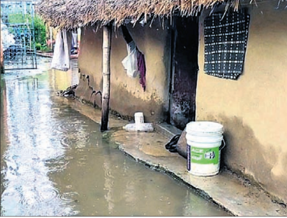
ବର୍ଷା ଯୋଗୁ ମାଟିଘର କାନ୍ଥ ଭୁସୁଡ଼ିବା ଅବସ୍ଥାରେ ରହିଛି।

ଯୋଗାଇ ଦେଉଥିବାବେଳେ ବର୍ତ୍ତମାନ ପରମେଶ୍ୱର ନାୟକ ଗଳି, ସର୍ବିସ୍ ଷ୍ଟେସନ ଗଳି ରାସ୍ତାଗୁଡ଼ିକ ଉପରେ ଆକୃଷ୍ଟ ପାଣି ଚାଲୁଛି। ପୂର୍ବରୁ ବିଭିନ୍ନ ଖାଲ ଓ ଡ୍ରେନରେ ଜମି ରହିଥିବା ବର୍ଷାଜଳ ବର୍ଷା ଜଳରେ ମିଶି ରାସ୍ତା ଉପରେ ଲହଡ଼ି ମରିବା ସହ ଲୋକଙ୍କ ଘରେ ପଶୁଛି ଓ ଅଞ୍ଚଳରେ ଦୁର୍ଗନ୍ଧ ସୃଷ୍ଟି କରୁଛି। ଅନ୍ୟପଟେ ବିଦ୍ୟୁତ୍ ଓ ପାନୀୟ ଜଳ ସମସ୍ୟା ଉପସ୍ଥିତ। ମଙ୍ଗଳବାର ରାତିରୁ ବିଦ୍ୟୁତ୍ ସରବରାହ ବନ୍ଦଥିବାରୁ ଚାରିଆଡ଼େ ଅନ୍ଧାର ହୋଇଛି। ସହରରେ ପାନୀୟ ଜଳ ସଙ୍କଟ ଦେଖାଦେଇଛି। ପୌର ପ୍ରଶାସନ କନ୍ୟା କୌଶିକୀ ଜନ ପ୍ରତିନିଧି ସହରବାସୀ ଓ ବସ୍ତି ଅଞ୍ଚଳର ଅଭାବୀ ଲୋକଙ୍କ ପାଖରେ ପହଞ୍ଚି ନ ଥିବାରୁ ଅସହାୟ ଦେଖାଦେଇଛି। ସହରାଞ୍ଚଳ ଲୋକଙ୍କ ପାଇଁ ସରକାର ବିଭିନ୍ନ ଯୋଜନାରେ ଘର