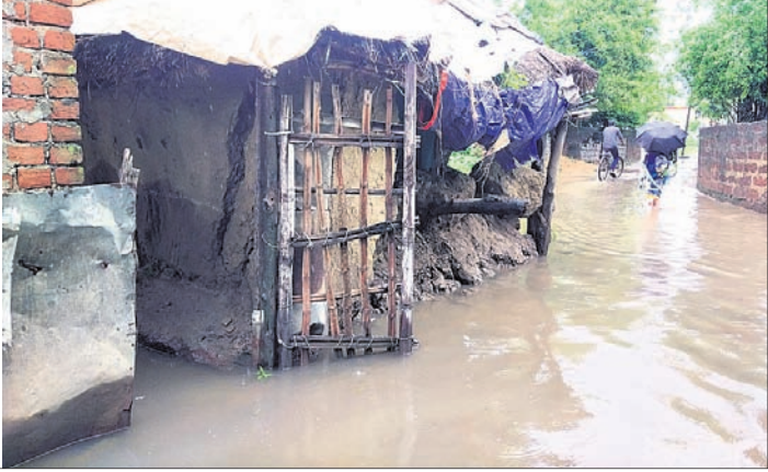
ଗାଁବାଣ୍ଡରେ ବର୍ଷା ପାଣିର ସୁଅ।