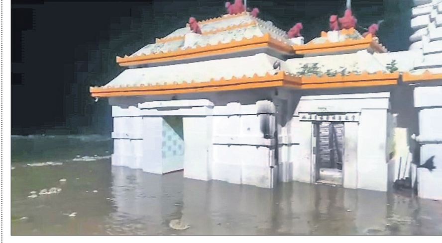
ମହାନଦୀରେ ପ୍ରଥମ ବନ୍ୟାଜଳ: କଟକ ଜିଲାର ବଡ଼ସା ଭଗାରିକା ମନ୍ଦିରରେ ଭୂସଙ୍କଳନ ଘାଟିରେ ପାଣି ପଶିଛି।