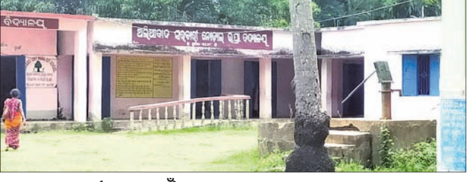
ବରା, ୨୮ (ମହେନ୍ଦ୍ର ସ୍ୱାଇଁ):

ବରା ଶିକ୍ଷା ମଣ୍ଡଳ ଅଧୀନରେ ରହିଛି ୧୭୪ ବିଦ୍ୟାଳୟ। ମାତ୍ର ଭିଡ଼ିଭୁମି ଅଭାବ ସହ ଆବଶ୍ୟକ ଶିକ୍ଷକ ନ ଥିବାରୁ ପିଲାଙ୍କ ପାଠପଢ଼ା ବାଧାପ୍ରାପ୍ତ ହେଉଛି। ମଧ୍ୟାହ୍ନଭୋଜନ ରୋଷେଇ କ୍ଷେତ୍ରରେ ନାହିଁ ନ ଥିବା ଅସୁବିଧା ଦେଖିବାକୁ ମିଳିଛି। କୁଳ ଅଧୀନ ବ୍ରାହ୍ମଣୀ ନଦୀର ଦକ୍ଷିଣପାର୍ଶ୍ୱରେ ଥିବା ଚନ୍ଦନପୁର, ରତ୍ନଗିରି, ଅମଠପୁର, ମନ୍ଦାରୀ ଆଦି ପଞ୍ଚାୟତର ବିଦ୍ୟାଳୟଗୁଡ଼ିକରେ ଥିବା ନଳକୂପରୁ ହଳଦିଆ ପାଣି ବାହାରିବା ଯୋଗୁ ଏହା ପାନୀୟ ଉପଯୋଗୀ ହୋଇପାରୁନାହିଁ। ଫଳରେ ଛାତ୍ରଛାତ୍ରୀ ଘରୁ ବୋତଲ ସାହାଯ୍ୟରେ ପାଣି ନେଇ ବିଦ୍ୟାଳୟକୁ ଆସୁଛନ୍ତି। ନଳକୂପରୁ ବାହାରିଥିବା ପାଣି ମଧ୍ୟାହ୍ନ ଭୋଜନ ପ୍ରସ୍ତୁତ ନିମନ୍ତେ ଉପଯୋଗୀ ହୋଇ ନ ଥିଲେ ମଧ୍ୟ ବାଧ୍ୟ ପାରିବାମାନେ ଏହି ପାଣିକୁ ବ୍ୟବହାର କରୁଛନ୍ତି ବୋଲି ମତ ରଖୁଛନ୍ତି। ବିଶୁଦ୍ଧ ପାନୀୟ ଜଳ ଯୋଗାଇ ଦେବା କ୍ଷେତ୍ରରେ ସରକାର ତିନିମ ପିନ୍ଧୁଥିବାବେଳେ ଅଧ୍ୟୟନରତ