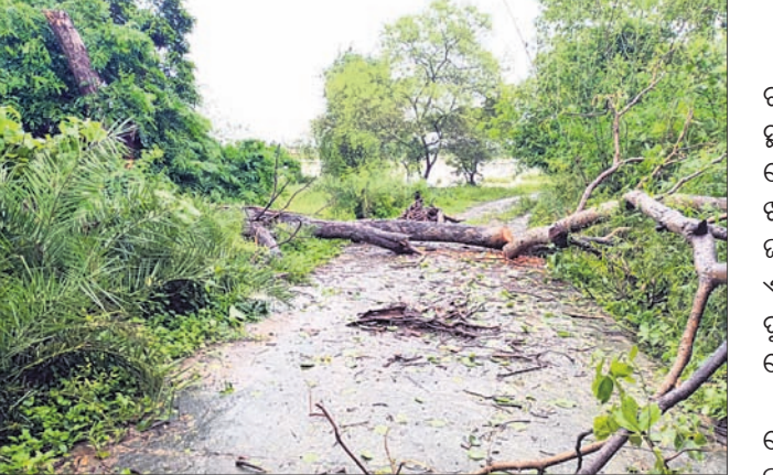
ଗଛପଡ଼ି ରାସ୍ତା ଅବରୋଧ ହୋଇଛି।