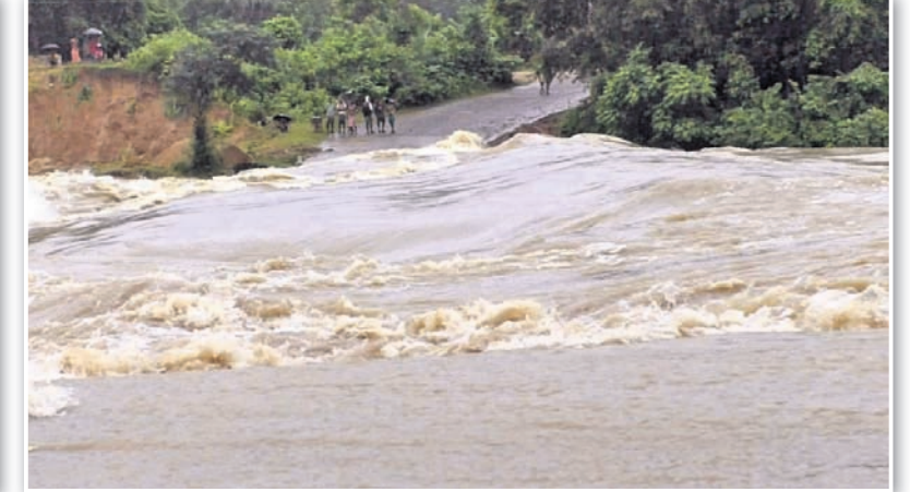
ସୋନ ନଦୀର କଳପୁର ବୃଦ୍ଧି ପାଇବାରୁ ମୟୂରଭଞ୍ଜ ଜିଲାର କସ୍ତିପଦା-ଶାଳକୁଆ ରାସ୍ତାରେ ଥିବା ମହିଷାସୁରୀ ପୋଲ ଉପରେ ପ୍ରବାହିତ ୮ ଫୁଟ ଉଚ୍ଚର ବନ୍ୟାଜଳ।