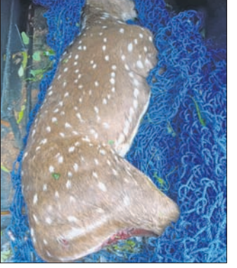
ଦଶପଲ୍ଲୀ, ୨୮ (ପ୍ରକାଶ କୁମାର ପାଣି)

କୁକୁର କାମୁଡ଼ାରେ ଆହତ ହୋଇଥିବା ଏକ ହରିଣର ମୃତ୍ୟୁ ଘଟିଛି । ରୁଧିରା ସେହି ହରିଣକୁ କୁକୁର କାମୁଡ଼ିବା ପାଇଁ ରୋଡ଼ାର ଥିଲା । ଗୁରୁତର ଆହତ ହେବା ପରେ ହରିଣଟି ଦଶପଲ୍ଲୀ ଦୁର୍ଗାବଜାର ପାର୍ବ ନିକଟରୁ ଜଙ୍ଗଲ ନିକଟକୁ ପଳାଇ ଆସିଥିଲା । ଖବର ପାଇ ବନ ବିଭାଗ କର୍ମଚାରୀମାନେ ଆହତ ହରିଣକୁ ଉଦ୍ଧାର କରି ସ୍ଥାନୀୟ ପ୍ରାଣୀଧନ ଚିକିତ୍ସାଳୟରେ ଭର୍ତ୍ତି କରିଥିଲେ । ସେଠାରେ ଆବଶ୍ୟକ ଚିକିତ୍ସା କରାଯାଇଥିଲା । ହେଲେ ରୁଧିରା ସେହି ହରିଣର ମୃତ୍ୟୁ ଘଟିଥିଲା । ଏହାପରେ ତାହାର ବାହା ମୃତଦେହ ବ୍ୟବହାର କରାଯିବା ପରେ ପୋଡ଼ି ଦିଆଯାଇଥିଲା ।