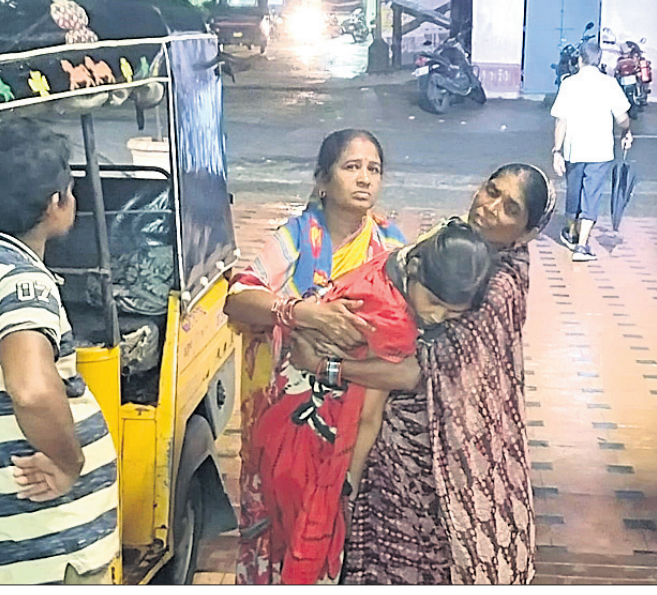
ଅସୁସ୍ଥ ମହିଳାଙ୍କୁ ଅଟୋରିକ୍ଷାରେ ଅଣାଯାଇଛି ।