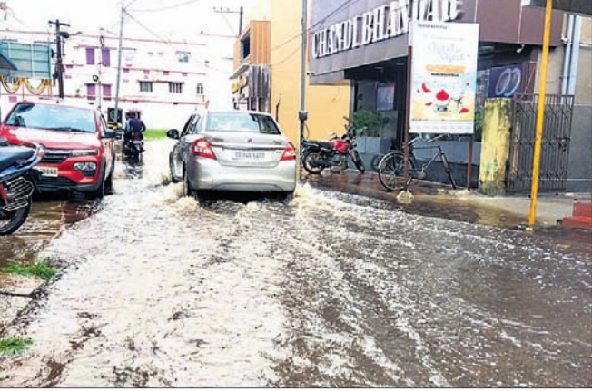
ସହରର ଏକ ରାସ୍ତାରେ ପାଣି ଲହଡ଼ି ମାରୁଛି।