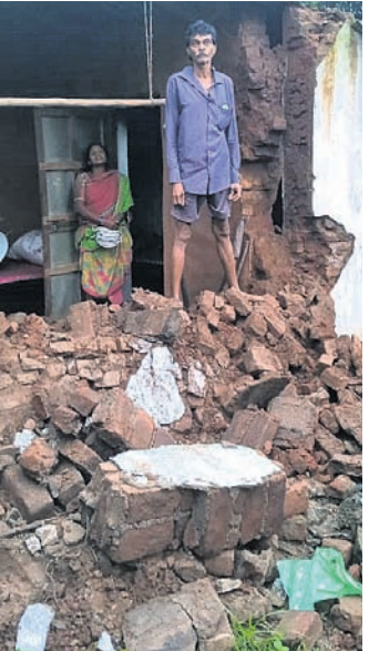
ଭାଙ୍ଗି ଯାଇଥିବା ଘର

ଗଡ଼ ଜିଲ୍ଲା ଦିନ ଧରି ଲୁଗାପାଟା ଜନିତ ବର୍ଷା ଲାଗି ରହିଥିବାରୁ ଗ୍ରାମାଞ୍ଚଳରେ ମଧ୍ୟ ବାଧା ହେବା ସହ ଜନଜୀବନ ଅସୁବିଧା ହୋଇପଡ଼ିଛି। ମଙ୍ଗଳବାରରୁ ଲାଗି ରହିଥିବା ବର୍ଷାରେ କନ୍ଧମାଳ ଜିଲାର ସହର ଏବଂ ଗ୍ରାମାଞ୍ଚଳ ସବୁ ଜଳମଗ୍ନ ହୋଇଛି। ଖଜୁରିପଡ଼ା ରୁକ୍ଷ ଅଞ୍ଚଳର ଗ୍ରାମାଞ୍ଚଳ ଗୁଡ଼ିକରେ ପର୍ବତ ପାହାଡ଼ ଉପରେ ଅବସ୍ଥିତ। ତେଣୁ ଏହି ଲୁଗାପାଟା ଜନିତ ବର୍ଷାରେ ଗ୍ରାମାଞ୍ଚଳ ବେହାଲ ହୋଇଯାଇଛି। ପାହାଡ଼ ଉପରୁ ବୃତ୍ତ ଗତିରେ ପାଣି ଆସି ଘର ତୁଆରେ ପଶି ଯିବା ସହ ବିଦ୍ୟୁତ୍ ସେବା ବ୍ୟାଘାତ ରହିଛି। ପିଲା ସ୍କୁଲ ନଦୀରେ, ବାରପୁଲିଆ ନଦୀରେ ଏବଂ ପୁରୁଣା ପାଣି, କଣ୍ଡାଆନାଳ, ଚିତ୍ରାପଟା ନଦୀରେ ଧୀରେ ଧୀରେ ଜଳ ସ୍ରୋତ ବଢ଼ିବାରେ ଲାଗିଛି। ବାରପୁଲିଆ ନିକଟସ୍ଥ ଶଶି ଯାହାକି ବଳସମ୍ପୂର୍ଣ୍ଣକୁ ସଂଯୋଗ କରୁଥିବା ପ୍ରଧାନମନ୍ତ୍ରୀ ସଡ଼କ ଯୋଜନା ରାସ୍ତାରେ ଆରମ୍ଭରେ ପଡ଼େ ସେଇଠୁ ମାଟି ଧୋଇ ନେବା ସହିତ ନାଳଟି ବିପଦ ସଙ୍କୁଳ ସଂକେତ ରହିଛି। ପ୍ରବଳ ବର୍ଷା ଯୋଗୁଁ ବେଡ଼ୁଙ୍ଗ ପାଲୁ ଗ୍ରାମର ବସଡ଼ ଗଣ୍ଡାକ କଳା ଘର କାଢ଼ ଭୁଣ୍ଡୁଟି ପଡ଼ିବା ସହ ବର୍ଷାରେ ଶ୍ରମିକମାନେ ଆର୍ଥାତ ଅନଟନରେ ରହିଛନ୍ତି। ଏଭଳି ବର୍ଷା ଲାଗି ରହିଲେ