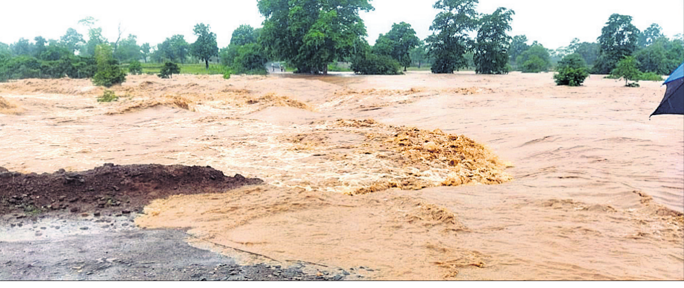
ତମଶାଳ ନାଳରେ ପାଣି ସୁଅ ଛୁଟୁଛି।

ଲଘୁତାପ ଜନିତବର୍ଷା ଲାଗି ରହିଥିବାରୁ ତମଶାଳ ନାଳରେ ପାଣିଆସି ୨ ଯାଜପୁର ଓ ଡେଙ୍କାନାଳ ଜିଲ୍ଲାକୁ ଯୋଗାଯୋଗ ବିଚ୍ଛିନ୍ନ ହୋଇଯାଇଛି। ବହୁ ବର୍ଷ ପୂର୍ବରୁ ତମଶାଳ ନାଳରେ ନିର୍ମାଣ ହୋଇଥିବା ପୋଲ ଭାଙ୍ଗି ଅସୁରକ୍ଷିତ ଅବସ୍ଥାରେ ରହିଥିବାରୁ ଦୁଇପଟ ସୁରକ୍ଷା ବାହୁନାହିଁ। ବର୍ଷା ହୋଇ ନ ଥିବାବେଳେ ପଥଚାରୀ ଓ ଯାନବାହନ ଯାତାୟତ ସୁରକ୍ଷିତ ନ ଥିଲା। ଏବେ ନାଳର ୨ କୁଳ ଖାଉଥିବାବେଳେ ପୋଲ ଉପରେ ୩ ଫୁଟ ପାଣି ଚାଲୁଛି। ମଙ୍ଗଳବାର ରାତିରୁ ଲଗାଣ ବର୍ଷା ଯୋଗୁ ତମଶାଳ ନାଳର ଉପକୂଳ ମହାଗିରି ପାହାଡ଼ ପାଦଦେଶ କର୍ମ ଅଞ୍ଚଳରେ ତିକ୍ତପଡ଼ି ବିଦ୍ୟାଳୟର ପାହାଡ଼କୁ ପାଣି ସହ ବିଭିନ୍ନ