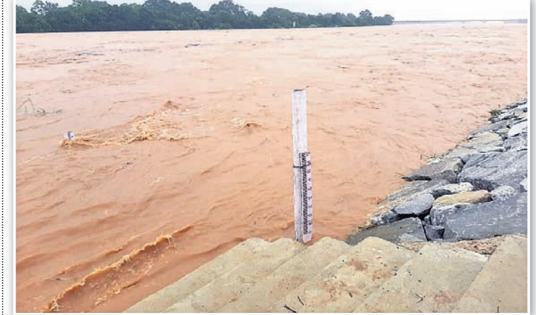
କେନ୍ଦୁଝର ଜିଲାର ଆନନ୍ଦପୁର ଖପରଖାଠାରେ ବୈତରଣୀ ବିପଦ ସଙ୍କେତ ଉପରେ ପ୍ରବାହିତ ହେଉଛି।

ଟାପୁରୁ ଭଦ୍ରାକଳେ ଅଗ୍ନିଶମ କର୍ମଚାରୀ ନଦୀ ମଧ୍ୟରୁ ଅଗ୍ନିଶମ କର୍ମଚାରୀ ମହିଳାଙ୍କୁ ଉଦ୍ଧାର କରୁଛନ୍ତି।