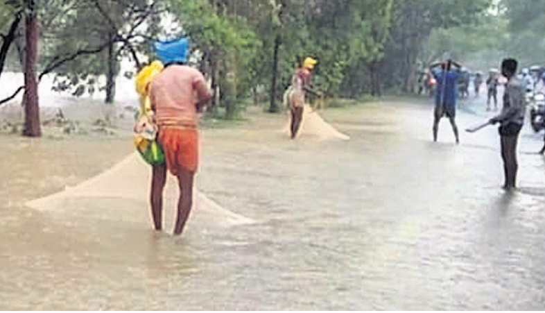
ବୌଦ୍ଧ ଜିଲାର ଦେଉ ଯାଇଥିବା ଖୋର୍ଦ୍ଧା- ବଳାଙ୍ଗୀର ୫୭ମ ଜାତୀୟ ରାଜପଥ ଉପରେ ଲୋକେ ମାଛ ଧରୁଛନ୍ତି।