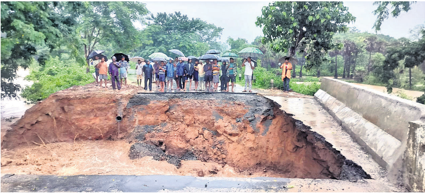
ବର୍ଷା ବିପାତ: ଅନୁଗୋଳ ଜିଲ୍ଲା ଛେଡ଼ିପଦା ବ୍ଲକ୍ ଖମାରୁ ନୂଆଗାଁ-କଣଲୋଇ ଗ୍ରାମ ଦେଇ ସମଲପୁର ଜିଲ୍ଲାକୁ ସଂଯୋଗ କରୁଥିବା ଭଜପାଳ ନିକଟ ଆଉଁଳି ନଦୀ ପୋଲ ସଂଯୋଗକାରଣ ରାସ୍ତାରେ ସୃଷ୍ଟି ହୋଇଥିବା ୧୫ ଫୁଟର ଘାଲ।

ଅଭିନେତା ଆୟୁଷମାନ ଖୁରାନାଙ୍କ ଅଭିନୀତ ଫିଲ୍ମ 'ଡ୍ରିମ୍ ଗର୍ଲ- ୨' ଆସନ୍ତା ୨୫ ତାରିଖରେ ପ୍ରେକ୍ଷାଳୟରେ ରିଲିଜ୍ ହେବାକୁ ଯାଉଛି।