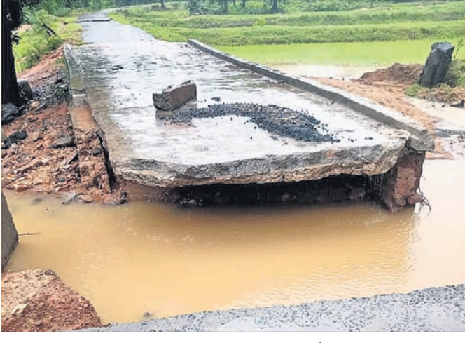
ସମ୍ବଲପୁର ଜିଲାର ମୁସୁପୁରା ବୁକ ଖଲିଆଦର ଯୋର ଉପରେ ନିର୍ମାଣାଧୀନ ଟ୍ରକ୍ ଧୋଇଯାଇଛି।