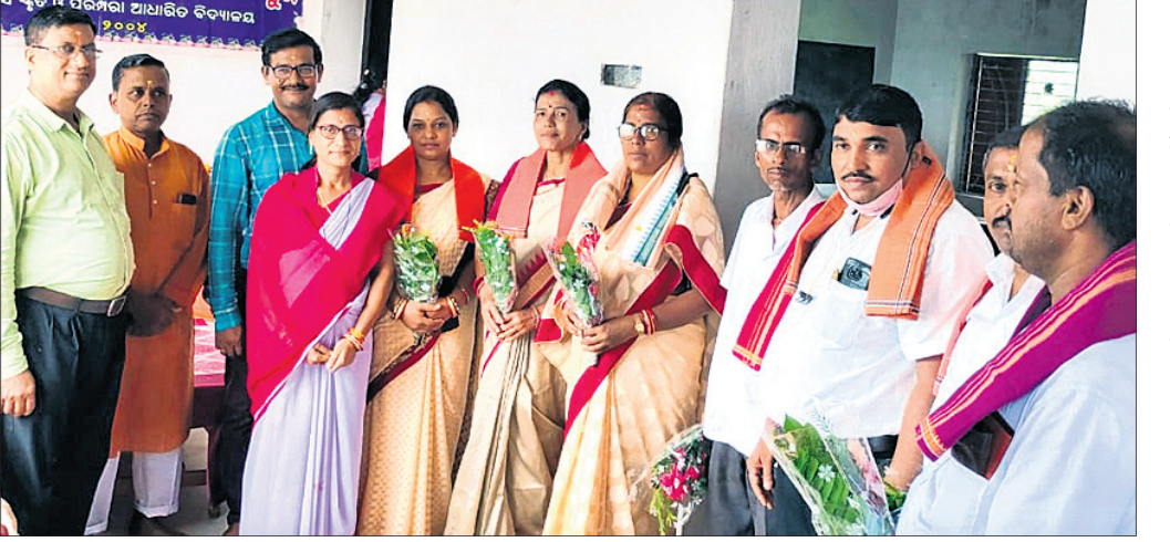
ଜ୍ଞାନ ବିଜ୍ଞାନ ମେଳାରେ ଯୋଗଦେଇଥିବା ଅତିଥି ଓ ଅନ୍ୟମାନେ।

କାର୍ଯ୍ୟ ପ୍ରଭାବିତ ହୋଇଛି। ବାର୍ଦ୍ଧବିନ କରୁଛନ୍ତି। ହେଲେ ବର୍ଷା ପାଣି ନାଳ ପୋଲ ଉପରେ ଚାଲିବାରୁ ଖଣି କାର୍ଯ୍ୟରେ କେହି ପହଞ୍ଚି ପାରିନାହାନ୍ତି। ବେଦାନ୍ତ ଫେକର କମ୍ପାନୀର କଲୋନୀ କାଠପାଳରେ ରହିଥିବାବେଳେ ଖଣି ଓସ୍ତପାଳ, କଲରଙ୍ଗାରେ ରହିଛି। ସେ ଖଣିର କୌଣସି କର୍ମଚାରୀ କାର୍ଯ୍ୟ କରିବା ପାଇଁ ଯାଇପାରିନାହାନ୍ତି।