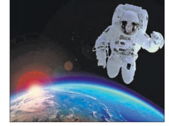
ଚନ୍ଦ୍ରକୁ ଜଣେ ମିଶନକୁ ପଠାଇବା ଯୋଜନା ଚାଲିଛି। ସେହିପରି ମଙ୍ଗଳ ଗ୍ରହକୁ ମଧ୍ୟ ମହାକାଶଚାରୀଙ୍କୁ ପ୍ରେରଣ ଯୋଜନା ମିଶନରେ ୩ ଏବଂ ୧୯୬୭ରେ ଆପୋଲୋ ୧ ଲଣ୍ଡ ପ୍ୟାଡ୍‌ରେ ୩ ଜଣଙ୍କ ମୃତ୍ୟୁ ଘଟିଥିଲା। ୨୦୨୫ରେ ନାସା ପକ୍ଷରୁ

ହୁଷ୍ଟନ, ୨୮ ମହାକାଶକୁ ମାନବ ପ୍ରେରଣ ଏକ ଅତି ବୃହତ୍ ଓ ବିପଜ୍ଜନକ ବ୍ୟାପାର। ୬୦ ବର୍ଷ ପୂର୍ବେ ମହାକାଶ ଅଭିଯାନ ଆରମ୍ଭ ହେବା ପରୁ ଅଦ୍ୟାବଧି ସେଥିରେ ୨୦ ଜଣଙ୍କ ମୃତ୍ୟୁ ଘଟିଛି। ସେମାନଙ୍କ ମଧ୍ୟରୁ ୧୪ ଜଣ ୧୯୮୬ରୁ ୨୦୦୩ ମଧ୍ୟରେ ଆମେରିକୀୟ ମହାକାଶ ଗବେଷଣା ସଂସ୍ଥା ନାସା ସେଣ୍ଟର ଗ୍ରୀନିଫିଲ୍ଡରେ ପ୍ରାଣ ହରାଇଛନ୍ତି। ସେହିପରି ୧୯୭୧ର ଯୋହୁର୍ ୧୧ ମିଶନରେ ୩ ଏବଂ ୧୯୬୭ରେ ଆପୋଲୋ ୧ ଲଣ୍ଡ ପ୍ୟାଡ୍‌ରେ ୩ ଜଣଙ୍କ ମୃତ୍ୟୁ ଘଟିଥିଲା। ୨୦୨୫ରେ ନାସା ପକ୍ଷରୁ