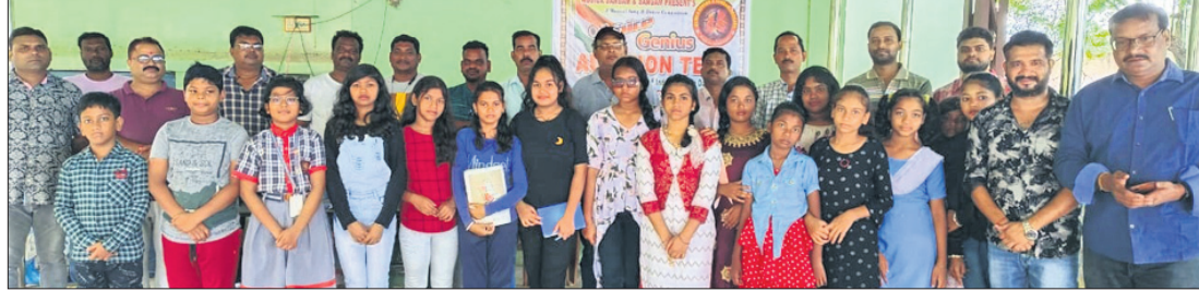
କୃଷି ସର୍ବସାଧକ ସହ ପ୍ରତିଯୋଗୀମାନେ।

ରାଉରକେଲା, ୩୮ (ସଜାତା କେନା) ଲଗାଣ ବର୍ଷାରେ ହେଉ ଷ୍ଟାଡ଼ିୟମ ଷଡ଼ିଗ୍ରହ ଉତ୍ସବରେ ଯୁବା ପାଠକ ଯୋଗଦେଇଛନ୍ତି।