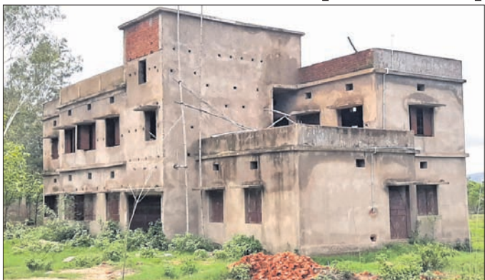
ମାନେଶ୍ୱରରେ ନିର୍ମାଣ ହୋଇଥିବା ହଷ୍ଟେଲ କୋଠା ।

ଆଦିବାସୀ ଛାତ୍ରଛାତ୍ରୀଙ୍କୁ ଉତ୍ତମ ଶିକ୍ଷାଦାନ ପାଇଁ ସରକାର ପଦକ୍ଷେପ ଗ୍ରହଣ କରୁଛନ୍ତି। ଶିକ୍ଷା ଉପକରଣ ପ୍ରଦାନ ସହ ସ୍କୁଲ କଲେଜରେ ରହି ପାଠ ପଢ଼ିବା ପାଇଁ ହଷ୍ଟେଲ ବ୍ୟବସ୍ଥା କରିଛନ୍ତି।