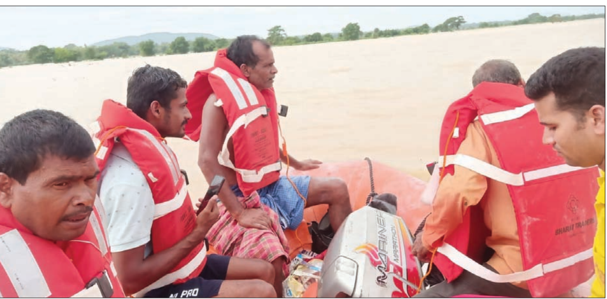
ନିଖୋଜ ଦୁଇ କର୍ମଚାରୀଙ୍କୁ ଓଡ୍ରାଫ୍ଟ ଚିକିତ୍ସା କରି ଆସୁଛନ୍ତି।