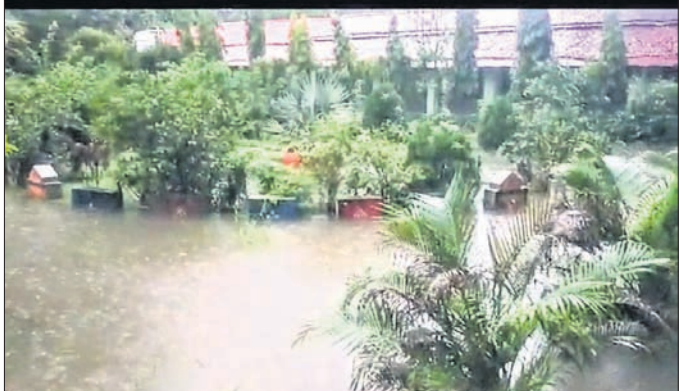
ସ୍କୁଲ ପରିସରରେ ଲାହଡ଼ି ମାଉଛି ବର୍ଷାପାଣି ।

ରାଜ୍ୟ ସରକାର ସ୍କୁଲଗୁଡ଼ିକ ୫-ଟି ଅଧୀନରେ ରୂପାନ୍ତରଣ ପାଇଁ ବହୁ ଅର୍ଥ ଭବନରେ ଆୟୋଜିତ ଖବରଦାତା ସମ୍ମିଳନୀରେ ମୁକ୍ତିଦାୟୀ ସେନା ପକ୍ଷରୁ ତେଜବଦୀ ଦିଆଯାଇଛି।