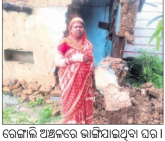
ରେଙ୍ଗାଲି ଅଞ୍ଚଳରେ ଭାଙ୍ଗିଯାଇଥିବା ଘର ।

ଲଘୁଚାପ ଜନିତ ବର୍ଷା ଯୋଗୁ ସମ୍ବଲପୁର ଜିଲା ରେଙ୍ଗାଲି ବ୍ଲକ୍‌ରେ ବ୍ୟାପକ କ୍ଷୟକ୍ଷତି ହୋଇଛି।