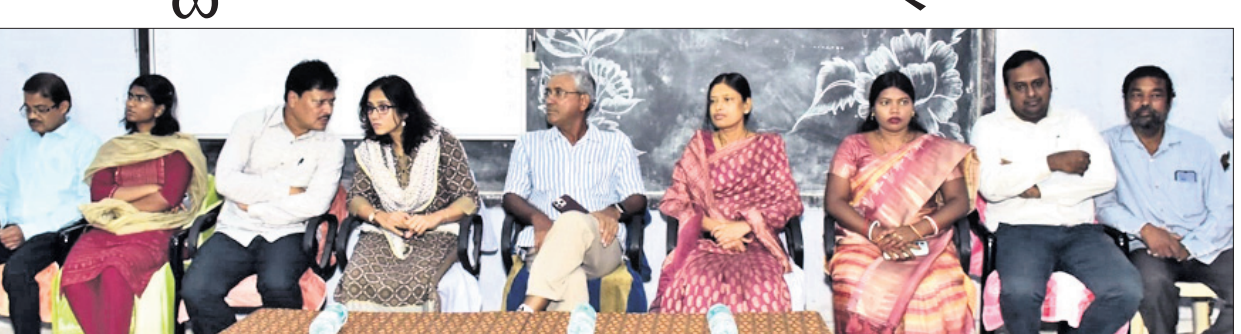
ବୈଠକରେ ଡକ୍ଟର ଉପସ୍ଥାପନ ସହ ବିଧାୟକ ଓ ଅନ୍ୟମାନେ।