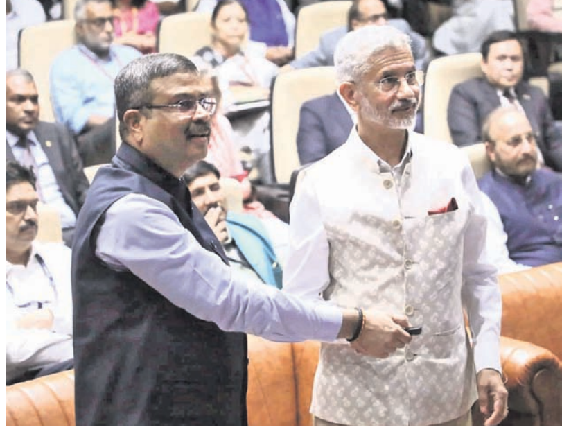
କେନ୍ଦ୍ର ଶିକ୍ଷାମନ୍ତ୍ରୀ ଧର୍ମେନ୍ଦ୍ର ପ୍ରଧାନ ଏବଂ ବର୍ତ୍ତମାନ ମନ୍ତ୍ରୀ ଏସ୍. ଜୟଶଙ୍କରଙ୍କ ଦ୍ୱାରା 'ଷ୍ଟି ଇନ୍ ଇଣ୍ଡିଆ' (ଏସ୍ଆଇଆଇ) ପୋର୍ଟାଲର ଶୁଭାରମ୍ଭ କରାଯାଇଛି।