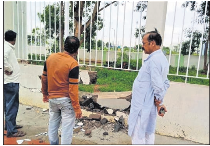
ବର୍ଷା ଯୋଗୁଁ ହଳି ଷ୍ଟାଡ଼ିୟମ ପାଟେର ଲାଙ୍ଗି ଯାଇଛି।

ସୁନ୍ଦରଗଡ଼, ୩୮ (କମ ନାରାୟଣ ମେହୁରି) ଲଗାଣ ବର୍ଷା ଯୋଗୁଁ ସୁନ୍ଦରଗଡ଼ ଜିଲ୍ଲାରେ ଜନଜୀବନ ପ୍ରଭାବିତ ହୋଇଛି।