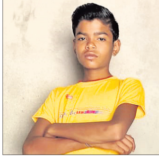
ଏଫଏମ୍‌ସି ରିପୋର୍ଟ ଆସିଛି। ସାକ୍ଷିପିତ୍ୱ ଚିନ୍ତା ରିପୋର୍ଟ ଆସିନାହିଁ। ଅଧିକ ତଦନ୍ତ ପାଇଁ ଚର୍ଚ୍ଚା ପରାମ୍ଭ କରିବାକୁ ୧୦ ଜଣଙ୍କୁ ପରାମ୍ଭ କରାଯାଇଛି।