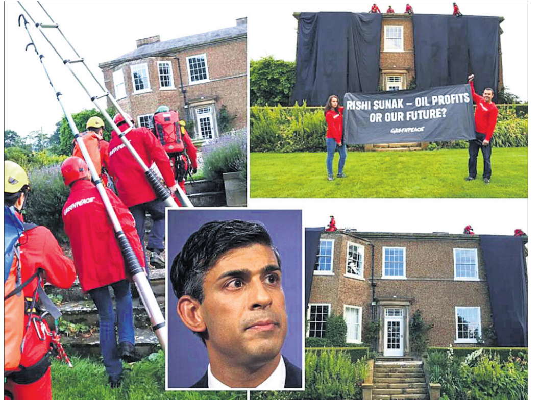
ରୁହ୍ନାରେ ବିକ୍ଷୋଭକାରୀମାନେ ରିଶି ସୁନାକଙ୍କୁ ବିରୋଧ କରିବାକୁ ଯାଉଛନ୍ତି।

ଏବଂ ଘୃଣା ମତ୍ତବ୍ୟ ବନ୍ଦ ଲାଗି ପ୍ଲାଟଫର୍ମ ଉପରେ ନଜର ରଖିବା ନିମନ୍ତେ ହରିୟାଣା ସରକାର ଏକ କମିଟି ଗଠନ କରିଛନ୍ତି। ଉକ୍ତ କମିଟି ସମସ୍ତ ଆନୁଷ୍ଠାନିକ ସଂସ୍ଥା ସହ ସମନ୍ୱୟ ରକ୍ଷାକରି ଶାନ୍ତି ବଜାୟ ରଖିବା ଦିଗରେ କାର୍ଯ୍ୟ କରିବ।