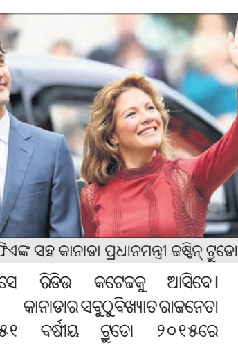
ସ୍ତ୍ରୀ ସୋପିଏଙ୍କ ସହ କାନାଡା ପ୍ରଧାନମନ୍ତ୍ରୀ କ୍ଷତ୍ରିୟ ତୁଡେ

ସାଧିନିକ ପୀଠରେ ସିକେଆଇଙ୍କ ସହ କ୍ଷତ୍ରିୟ ସଞ୍ଜୟ କିଷନ ଚୌଧୁରୀ, ସଞ୍ଜୀବ ଖାନା, ବି.ଆର୍. ଗଭାଲ ଏବଂ ସୂର୍ଯ୍ୟ କାନ୍ତ ରହିଛନ୍ତି। ଜଷ୍ଟି-କମ୍ପାନୀର ସାଧିନିକ ସଭା କାର୍ଯ୍ୟକାଳ ୧୯୫୭ରେ ଶେଷ ହୋଇଥିଲା। ସାଧିନିକରେ ଏକ ଅସ୍ଥାୟୀ ବ୍ୟବସ୍ଥା ଭାବେ ସୁପ୍ରିମକୋର୍ଟ୍ କରିପାରିବେ ବୋଲି ସୁପ୍ରିମକୋର୍ଟ୍ କୁହାବାର ପ୍ରଶ୍ନ କରିଥିଲେ। ପ୍ରଧାନ ବିଚାରପତି ଡି.ଭି.ଲି. ରଞ୍ଜିତ୍ କ୍ଷତ୍ରିୟଙ୍କୁ ଆଧ୍ୟକ୍ଷତାରେ ୫ ଜଣିଆ ସାଧିନିକ ପୀଠ ଗୁରୁବାର ଶୁଣାଣି ଆରମ୍ଭ କରିଥିଲା। ବିରୋଧୀ ପକ୍ଷରୁ କେନ୍ଦ୍ର ସରକାରଙ୍କ ୨୦୧୯ ଅଗଷ୍ଟ ୫ ନିଷ୍ପତ୍ତିକୁ କଡ଼ା ସମାଲୋଚନା କରିଥିଲେ।