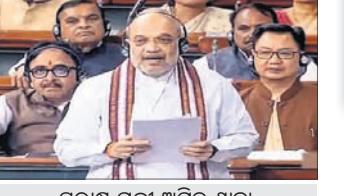
ସ୍ୱରାଷ୍ଟ୍ର ମନ୍ତ୍ରୀ ଅମିତ ଶାହା

ବିରୋଧ କରୁଛନ୍ତି ଓ ବିରୋଧୀ ଦଳଗୁଡ଼ିକର ସମର୍ଥନ ଲୋଡ଼ିଛନ୍ତି। ପୂର୍ବରୁ ଭାଜପା ଏବଂ କଂଗ୍ରେସ୍ ଗାଡ଼ାୟ, ରାଜଧାନୀରେ ଶାସନ କରୁଥିବାବେଳେ କେନ୍ଦ୍ର ସହ କେବେ ପୂର୍ଣ୍ଣସ୍ୱରୂପ ହୋଇ ନ ଥିଲା। ୨୦୧୫ରେ ଆମ୍ ଆଦମୀ ପାର୍ଟି ସରକାର ଆସିବା ପରେ ସବୁ ସମସ୍ୟା ଆରମ୍ଭ ହୋଇଛି। ଆଲୋଚନାରେ ଆଗେଇ ବିକେତ୍ ସଦସ୍ୟ ପିନାକୀ ମିଶ୍ର କହିଥିଲେ, ଆଇନ ପ୍ରଣୟନ କରିବା କ୍ଷମତା ପାଲିମେଣ୍ଟର ରହିଛି। ତେବେ ଏହା ଭଲ ଆଇନ କି ଖରାପ, ତାହାର ନିଷ୍ପତ୍ତି ପ୍ରମାଣକୋର୍ଟ୍ ଉପରେ ଛଡ଼ାଯାଉ