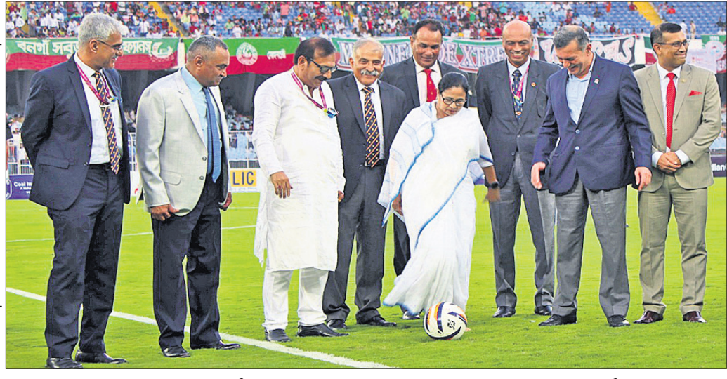
ଭୁରାଣ୍ଡ କପ୍ ପୁରବଲ୍ ଚୂନାମେଣ୍ଟକୁ ଉଦ୍‌ଘାଟନ କରୁଛନ୍ତି ପଶ୍ଚିମବଙ୍ଗ ମୁଖ୍ୟମନ୍ତ୍ରୀ ମମତା ବାନାର୍ଜୀ।

କୋଲକାତା, ୩୮ (ପି.ଟି.) ଏହିଆର ସର୍ବ ପୁରାତନ ପୁରବଲ୍ ଚୂନାମେଣ୍ଟ ଭୁରାଣ୍ଡ କପ୍ ପୁରବଲ୍ ଗୁରୁବାର ଠାରୁ ଆରମ୍ଭ ହୋଇଛି। ଉଦ୍‌ଘାଟନୀ ମ୍ୟାଚ୍‌ରେ ଆଇସିଏସ୍‌ଲ୍ ଚାମ୍ପିୟନ ମୋହନ ବାଗାନ୍