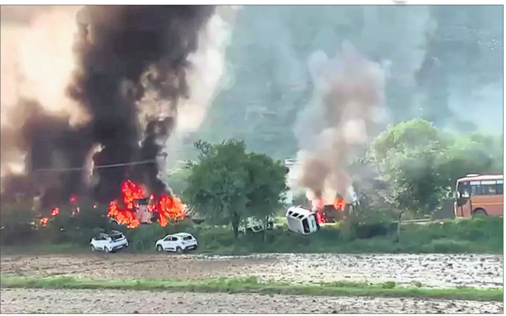
ହରିୟାଣାର ରୁହ୍ନାରେ ବିକ୍ଷୋଭକାରୀମାନେ ଜାଲିଦେଲେଥିବା କାର୍ଯ୍ୟ (ପୋଲିସ୍ ପଟୌ)