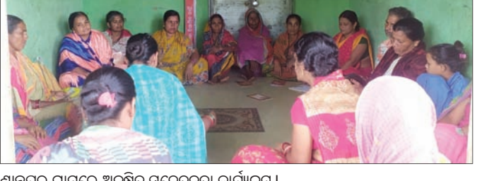
ଶାନ୍ତିପୁର ଗ୍ରାମରେ ଅନୁଗୋଳ ସଚେତନତା କାର୍ଯ୍ୟକ୍ରମ।

ଅନୁଗୋଳ ଜିଲ୍ଲା କିଆକଟା ଥାନା ବାସୁଦେବପୁର ପଞ୍ଚାୟତ ସୁବର୍ଣ୍ଣପୁର ନାବାଳକ ସଞ୍ଚାଳକ ବିଶ୍ୱାଳଙ୍କୁ ବନ୍ଦି ଦିଆଯାଇଥିବା ସନ୍ଦେହ ଦୂଢ଼ୀଭୂତ ହେଉଥିବାରୁ ପଞ୍ଚାୟତର ଅନେକ ଅଭିଭାବକ ପିଲାଙ୍କୁ ସଚେତନ କରାଯାଇଛି।