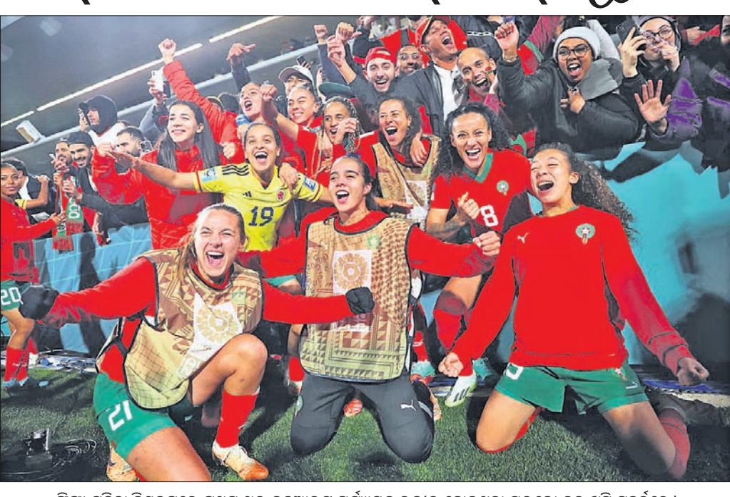
ପିପା ମହିଳା ବିଶ୍ୱକପ୍‌ରେ ପ୍ରଥମ ଥର ନକ୍‌ଆଉଟ ପର୍ଯ୍ୟାୟକୁ ଉନ୍ନତ ହୋଇଥିବା ମରବୋ ଦଳ ଖୁସି ପୁହୁଛନ୍ତି।

ଅଷ୍ଟ୍ରେଲିଆ ଓ ନ୍ୟୁଜିଲାଣ୍ଡରେ ଅନୁଷ୍ଠିତ ମହିଳା ପୁରବଲ୍ ବିଶ୍ୱକପ୍‌ରେ ଗୁରୁବାର ଆଉ ଏକ ବଡ଼ ବିପର୍ଯ୍ୟୟ ଦେଖିବାକୁ ମିଳିଛି। ଦୁଇି ଓ ଇଟାଲୀ ପରି ଶକ୍ତିଶାଳୀ ଦଳ ଚୂନାମେଣ୍ଟକୁ ବାଦ୍ ପଡ଼ିଥିବା ବେଳେ ଆଜି ଜର୍ମାନୀ ଓ ଦକ୍ଷିଣ କୋରିଆ ବାଦ୍ ପଡ଼ିଛନ୍ତି। ଅନ୍ୟପକ୍ଷରେ ପ୍ରଥମ ଥର ପାଇଁ ନକ୍‌ଆଉଟରେ ପ୍ରବେଶ କରିଛନ୍ତି। ଏହା ସହିତ ରାଜ୍ୟ ଅର୍ପ-୧୬ ଲାଇନ୍‌ଅପ୍ ମଧ୍ୟ ଚୁଡ଼ାକ୍ର ହୋଇଛି। ପ୍ରଥମ ଥର ନକ୍‌ଆଉଟରେ ମରବୋ: ଭର ଆପ୍ରିକାନ୍ ରାଷ୍ଟ୍ର ମରବୋ ପ୍ରଥମ