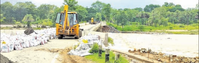
ଆଉଁଳି ନାଲ ପୋଲ ପାର୍ଶ୍ୱ ଘାଟ ମରାମତି କରାଯାଇଛି।

ଲଗାଣ ବର୍ଷା ଯୋଗୁ ଅନୁଗୋଳ ଜିଲ୍ଲା ଛେଡ଼ିପଦା ବ୍ଲକ୍ରେ ଅନେକ ଗ୍ଳାନରେ ଜଳବନ୍ଦୀ ଅବସ୍ଥା ସୃଷ୍ଟି ହୋଇଛି।