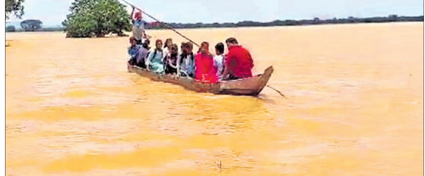
ଜୟପୁର ଗ୍ରାମ ରାସ୍ତା ବନ୍ୟାପାଣିରେ ବୁଡ଼ିଯାଇଥିବାବେଳେ ଡଙ୍ଗାରେ ଗ୍ରାମବାସୀ ଓ ଛାତ୍ରାଛାତ୍ରୀଙ୍କୁ ପାର୍ କରାଯାଇଛି ।

୨ ଗ୍ରାମ ଜଳବନ୍ଧୀ କଢ଼ିବା ଆରମ୍ଭ କରିଛି । ବିଭିନ୍ନ ଯୋଗାଯୋଗ ଦାମ୍ଭ, ପଞ୍ଚାୟତ ଅଧିକାରୀ ପ୍ରଭାବିତକ ସମସ୍ୟା ପତାରି ବୁଝିଛନ୍ତି । ଅପରପକ୍ଷେ ବନ୍ୟା ପ୍ରଭାବରେ ବ୍ୟାପକ ଫସଲ ନଷ୍ଟ ହୋଇଛି । ଖରିପ ଧାନ ଚାଷ ଏକ ପ୍ରକାର ଉଚ୍ଚତ୍ରୟାକାଳୀ ବିଭିନ୍ନ ସ୍ଥାନରେ ଘରେ ପାଣି ପଶି ଆସିବାପତ୍ର ନଷ୍ଟ ହୋଇଯାଇଛି । ପିଲାମାନଙ୍କ ବହିପତ୍ର, ଘରର କରୁଣା କାଗଜପତ୍ର ଭିଜିଯାଇଛି । ଏ ନେଇ ବିଡିଓ କୁହୁଛି, ବ୍ରାହ୍ମଣୀରୁ ଜଳପ୍ରସର ହୁଏ ପାଇଁ । ଜୟପୁର ଏବଂ କୃଷ୍ଣପୁର ଗ୍ରାମବାସୀଙ୍କ ସମସ୍ୟା ବୁଝିବା ଲାଗି ଏକ ଟିମ୍ ଗଠନ କରାଯାଇଛି ।