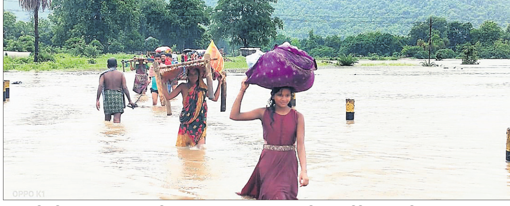
ବନ୍ୟା ପଶି ପଶିବା ପରେ ଅନୁଗୋଳ ରୁକ୍ଷ ଚିକିତ୍ସା ପକ୍ଷରୁ ଲୋକେ ଘର ଛାଡ଼ି ଅଗ୍ନିଶାଳା ଶିବିରକୁ ଯାଇଛନ୍ତି।

ଅଧିକାରୀଙ୍କୁ ବର୍ଷା ବନ୍ଦ ହୋଇଛି ବିଭିନ୍ନ ତ୍ୟାଗର ଗୋଟାଏ ହେଲେ କମିଟି ବର୍ଷା ଓ ବନ୍ୟା ବିପଦକୁ ଦୂରରେ ରଖି ପ୍ରଶାସନ ପକ୍ଷରୁ ବୋଟ ମାଧ୍ୟମରେ ସେମାନଙ୍କୁ ଉଦ୍ଧାର କରାଯାଇଛି।