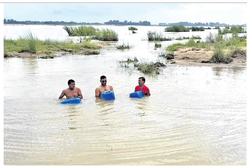
ଡେଜାନାଲ ଜିଲ୍ଲା ଗର୍ଭାବତୀ ବ୍ଲକ୍ କାଶୀପୁର ପଞ୍ଚାୟତ ଅଞ୍ଚଳରେ ପ୍ରାୟ ୧୨୩ ଜଣଙ୍କୁ ଉଦ୍ଧାର କରାଯାଇ ଗ୍ଳାନାନ୍ତର କରାଯାଇଛି।

ରୁକ୍ଷ ଗାଠି ପଞ୍ଚାୟତରେ ପ୍ରାୟ ୬୦୦ରୁ ଅଧିକ ଘର ଭାଙ୍ଗିଥିବା ଅଭିଯୋଗ ହେଉଛି।