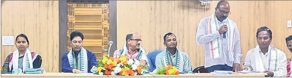
ବୈଠକରେ ବିଧାୟକ, ପ୍ରଶାସନିକ ଅଧିକାରୀଙ୍କ ସମେତ କେନ୍ଦ୍ରୀୟ ପୂଜା କମିଟି କର୍ମକର୍ମୀମାନେ।