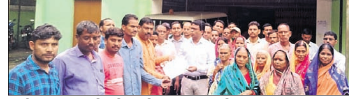
ଦଣ୍ଡସିଂହା ଗ୍ରାମ ତଳସାହି ବାସିନ୍ଦା ଦାବିପତ୍ର ପ୍ରଦାନ କରୁଛନ୍ତି।