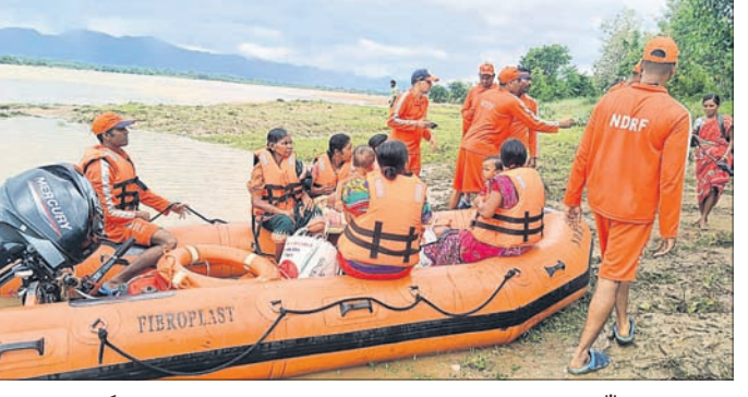
ପ୍ରଥମ ପର୍ଯ୍ୟାୟରେ ଗତ ରୁକ୍ଷଚାରୀ ଗର୍ଭାବତୀ ମହିଳା ଓ ଛୋଟପଲାଇ ସମେତ ୧୦ ଜଣଙ୍କୁ ଉଦ୍ଧାର କରାଯାଇ ଗ୍ଳାନାନ୍ତର କରାଯାଇଛି।

ମହାନଦୀ ବନ୍ୟା ପାଣି ଘେରରେ ଥିବା ଅନୁଗୋଳ ଜିଲ୍ଲା ଆନୁଗୋଳ ବ୍ଲକ୍ କୁଦଗାଁ ଗ୍ରାମର ୧୨୩ ଜଣଙ୍କୁ ଅସ୍ଥାୟୀ ଶିବିରକୁ ଗ୍ଳାନାନ୍ତର କରାଯାଇଛି।