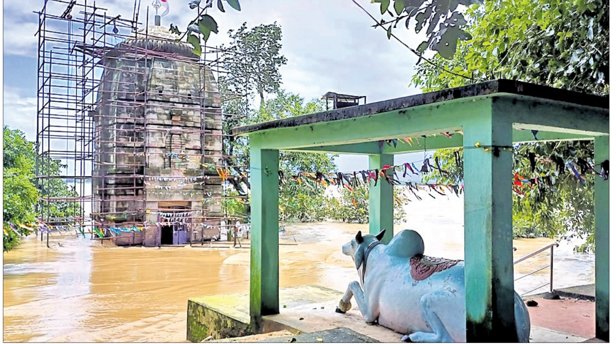
ପାଣି ସେତେବେଳେ ବୌଦ୍ଧେଶ୍ୱର ଶୈବପୀଠ ।