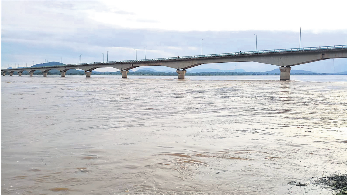
ତେଜାନାଳ-କାପାଶାନର ରାସ୍ତାର କମଗରାଠାରେ ବ୍ରାହ୍ମଣୀ ନଦୀରେ ପ୍ରବାହିତ ବନ୍ୟା ଜଳ ।