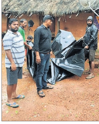
କ୍ଷତିଗ୍ରସ୍ତଙ୍କୁ ଜରିପାଲ ପ୍ରଦାନ କରାଯାଇଛି।

ପ୍ରଶାସନ ସାମାନ୍ୟ ଆଶ୍ୱସ୍ତ ପ୍ରକାଶ କରିଛି। ମାନବୀୟ ତ୍ୟାଗର ଖୋଲିଥିବା ଯୁଦ୍ଧ ସ୍ଥିତିରେ ଲୋକଙ୍କୁ ବ୍ୟବସ୍ଥା କରାଯାଇଛି।