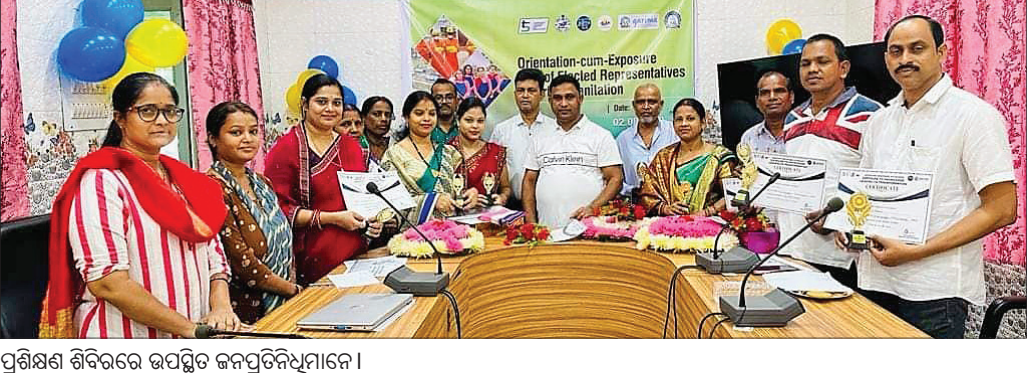
କାମାକ୍ଷାନଗର, ୩୮୮ (ଅମଳାକା ଖାନ୍)

କାମାକ୍ଷାନଗର ଏନ୍ଏସିର ନିର୍ବାଚିତ ପ୍ରତିନିଧିଙ୍କୁ ନେଇ ପ୍ରଶିକ୍ଷଣ ଓ ଶିକ୍ଷା ପରିଦର୍ଶନ ଶିବିର ଅନୁଷ୍ଠିତ ହୋଇଯାଇଛି । ଉଚ୍ଚ କାର୍ଯ୍ୟକ୍ରମରେ ମଳପଟ୍ଟ ଓ ବର୍ଦ୍ଧ୍ୟବସ୍ତୁ ପରିଚାଳନା ସମ୍ପର୍କରେ ଆଲୋଚନା କରାଯାଇଥିଲା । ଅଧିକାଂଶ ଶିବିରରେ ଉଦ୍ଦିଷ୍ଟ ଶିକ୍ଷା ପ୍ରସ୍ତୁତି ପ୍ରକ୍ରିୟା, ଏଥିରେ ଉପଯୋଗ କରାଯାଇଥିବା ପଦ୍ଧତି ବିଷୟରେ