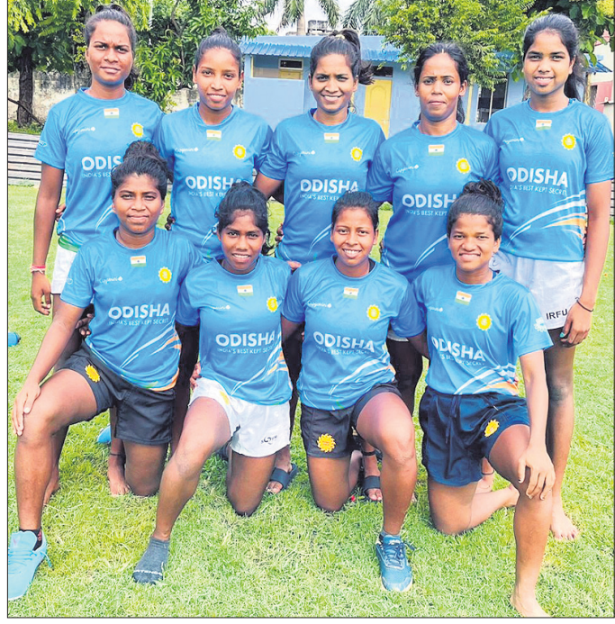
ମନୋନୀତ ଓଡ଼ିଆ ଖେଳାଳି