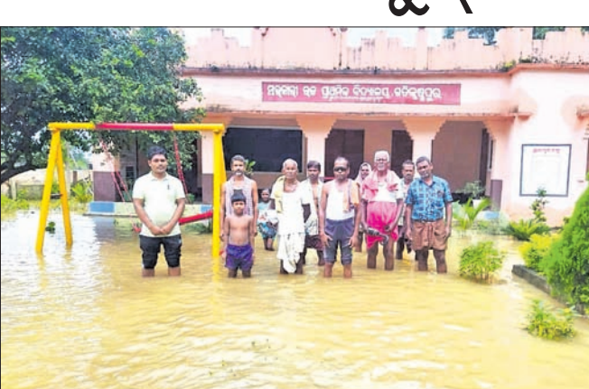
ବିଦ୍ୟାଳୟ ପରିସରରେ ଜମି ରହିଥିବା ବର୍ଷା ପାଣି।

କିଶୋରନଗର ବ୍ଲକ୍ ହତ୍ୟା ଥାନା ଗତିକୃଷ୍ଣପୁର ସରକାରୀ ବିଦ୍ୟାଳୟ ପରିସରରେ ୨ ଫୁଟର ପାଣି ଜମି ରହିଛି। ରାଜପଥ କାମ କରୁଥିବା ଠିକାସଂସ୍ଥାର ଅବହେଳା ଯୋଗୁ ଏପରି ପରିସ୍ଥିତି ସୃଷ୍ଟି ହୋଇଥିବା ଗତିକୃଷ୍ଣପୁର ଗ୍ରାମବାସୀ ଅଭିଯୋଗ କରିଛନ୍ତି।