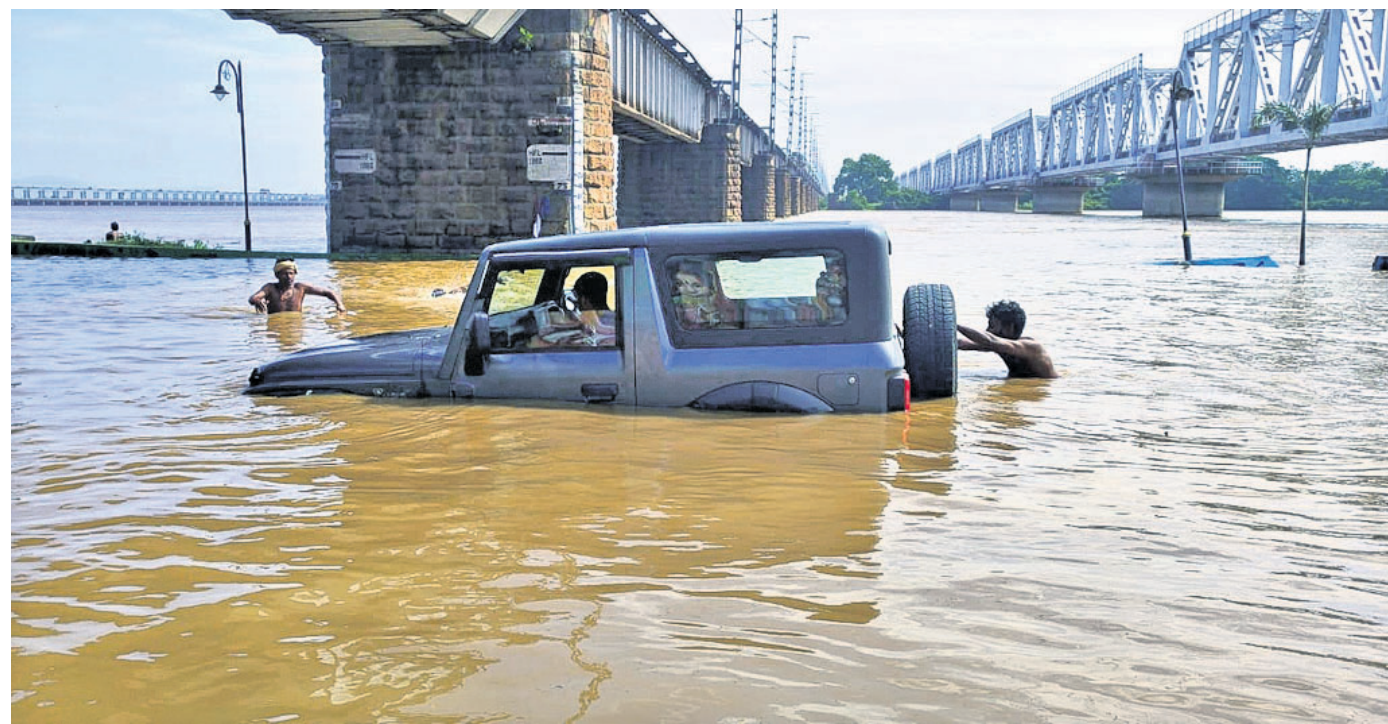
ମହାନଦୀରେ ବନ୍ୟାକଳ ଆସିବା ପରେ ଗୁରୁବାର କଟକ ଯୋଡ଼ା ନିକଟରେ ପାଣିରେ ଫସିଯାଇଥିବା ଏକ ଗାଡ଼ି।