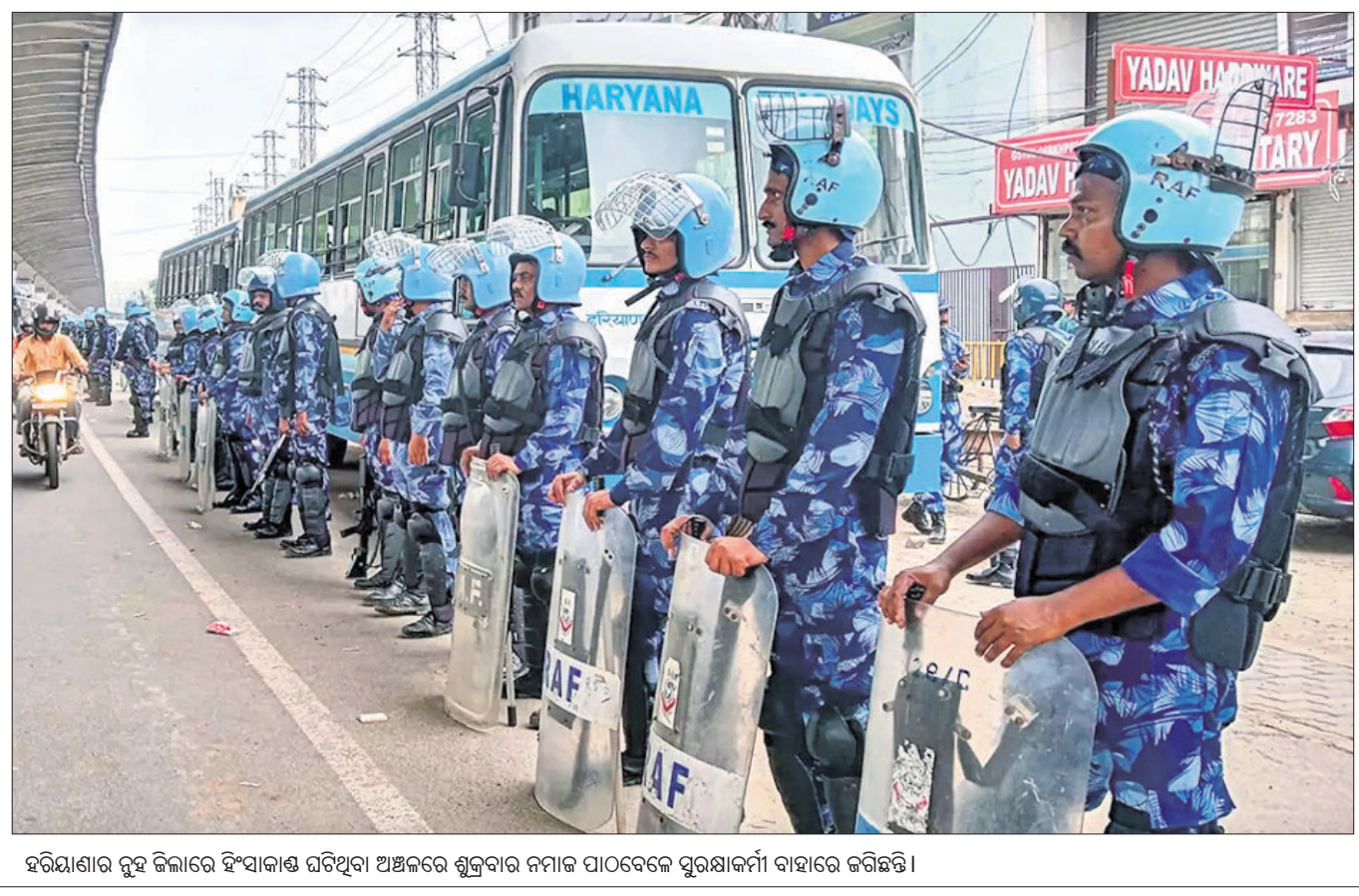
ହରିୟାଣାର ରୁହ ଜିଲ୍ଲାରେ ହିଂସାକାଣ୍ଡ ଘଟିଥିବା ଅଞ୍ଚଳରେ ଶୁକ୍ରବାର ନମାଜ ପାଠବେଳେ ସୁରକ୍ଷାକର୍ମୀ ବାହାରେ ଜରିଛନ୍ତି।

ଇମ୍ଫାଲ, ୪୮: ମଣିପୁର ସରକାର ଇମ୍ଫାଲ ଇଷ୍ଟ ଏବଂ ଇମ୍ଫାଲ ୱେଷ୍ଟ ଜିଲ୍ଲାରେ କର୍ତ୍ତୃ୍ୟ ୬ ଘଣ୍ଟା କୋହଲ କରିଛନ୍ତି। ସାଧାରଣ ଲୋକେ ଯେପରି ସେମାନଙ୍କ ଅତ୍ୟାବଶ୍ୟକ ସାମଗ୍ରୀ କିଣାକିଣି କରିପାରିବେ, ସେଥିପାଇଁ ସକାଳ ୫ଟାରୁ ମଧ୍ୟାହ୍ନ ୧୨ଟା ଯାଏ କର୍ତ୍ତୃ୍ୟ କୋହଲ କରାଯାଇଥିଲା। ଏହି ଜିଲ୍ଲାର ବିଭିନ୍ନ ଅଞ୍ଚଳରେ ସାନି ହିଂସାକାଣ୍ଡ ଘଟିବାରୁ ପୂର୍ବରୁ କୋହଲ ଘୋଷଣାକୁ ପ୍ରତ୍ୟାହାର କରାଯାଇ ଗୁରୁତ୍ଵ ସମ୍ପୂର୍ଣ୍ଣ କର୍ତ୍ତୃ୍ୟ ଲାଗୁ କରାଯାଇଥିଲା। ଗୁରୁତ୍ଵ ବିଶ୍ଵାସୀ କର୍ତ୍ତୃ୍ୟ ଜିଲ୍ଲାର କଟାକାଠ ଓ ପୁରୀକଟାଠାରେ ଅଞ୍ଚଳରେ ସୁରକ୍ଷା ବଳ ଏବଂ ଉତ୍ତମ ଲୋକଙ୍କ ମଧ୍ୟରେ ସଂଘର୍ଷ ଘଟି ୨୫ ଜଣ ଆହତ ହୋଇଥିଲେ।