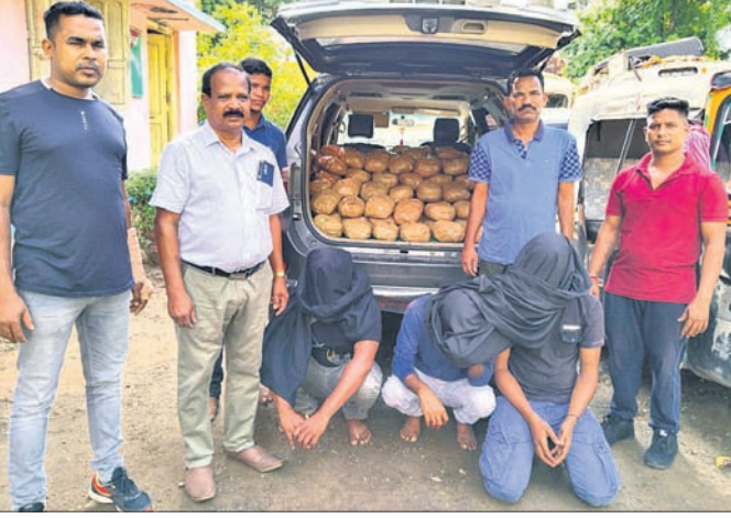
ଗିରଫ ଅଭିଯୁକ୍ତ ସହ ଜବତ ଗଞ୍ଜେଇ ଓ କାର୍।