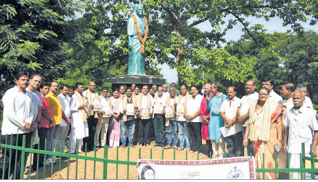
ନନ୍ଦିନୀ ଶତପଥୀଙ୍କ ୧୭ତମ ଶ୍ରୀକ୍ଷୋଧବରେ ଶୁକ୍ରବାର ଓଡ଼ିଆ ଭାଷା, ସାହିତ୍ୟ ଓ ସଂସ୍କୃତି ବିଭାଗ ସମେତ ବିଭିନ୍ନ ସଙ୍ଗଠନ ପକ୍ଷରୁ ରାଜକର୍ମଚାରୀ ନିକଟସ୍ଥ ତାଙ୍କ ପ୍ରତିମୂର୍ତ୍ତିରେ ଶ୍ରଦ୍ଧାଞ୍ଜଳି ଅର୍ପଣ ଅବସରରେ 'ନନ୍ଦିନୀ ଶତପଥୀ ସ୍ମୃତି ସମ୍ମାନ' ପାଇଥିବା ବ୍ୟକ୍ତିଗଣଙ୍କ ସହ ଅଭିଭାବନା ଓ ଅନ୍ୟମାନେ।

ଶ୍ରୀକ୍ଷୋଧବରେ ବକ୍ତାମାନେ ମତ ପ୍ରକାଶ କରିଛନ୍ତି। ଓଡ଼ିଆ ଭାଷା, ସାହିତ୍ୟ ଓ ସଂସ୍କୃତି ବିଭାଗ ପକ୍ଷରୁ ରାଜକର୍ମଚାରୀ ନିକଟସ୍ଥ ତାଙ୍କ ପ୍ରତିମୂର୍ତ୍ତି ସ୍ଥଳରେ ଆୟୋଜିତ ଶ୍ରୀକ୍ଷୋଧବକୁ ପରିବାର ଲୋକ ଖୋଲାଖୋଲି କରିବା ପରେ କିଛି ବାର ଦୂର ପାହ୍ୟାସି ମେଳନ ପଡ଼ିଥିଲା। ନିକଟରେ ମୃତଦେହ ଉଦ୍ଧାର କରିଥିଲେ। ଗୁରୁବାର ଧାମନଗର ରୁକ୍ଷ ଖଡ଼ିପଦା ପଞ୍ଚାୟତ କାଞ୍ଚିଆପାଳ ଗ୍ରାମର ନିକଟସ୍ଥ ମାଳଦା ବଜାରକୁ ଚୋରିକାରି ପାଇଁ ଯାଉଥିଲେ। ଅସାଧାରଣତଃ ଗାଁ ମୁଣ୍ଡ ପୋଲ ଉପରେ ଚାଲିଥିବା ବନ୍ୟାପାଣିରେ ଭାସିଯାଇଥିଲେ। ସ୍ଥାନୀୟ ଲୋକେ ତାଙ୍କୁ ଉଦ୍ଧାର କରି ଯାକପୁର ମୁଖ୍ୟ ଚିକିତ୍ସାଳୟକୁ ନେଇଥିଲେ। ସେଠାରେ ଡାକ୍ତର ତାଙ୍କୁ ମୃତ ଘୋଷଣା କରିଥିଲେ। ନିକଟସ୍ଥ ମୁଖ୍ୟରେ ଗାଁରେ ଶୋକର ଛାୟା ଖେଳିଯାଇଛି। ସେହିପରି ଧାମନଗର ରୁକ୍ଷ କରଦା ପଞ୍ଚାୟତ ସୁଲକ୍ଷଣସହପୁର