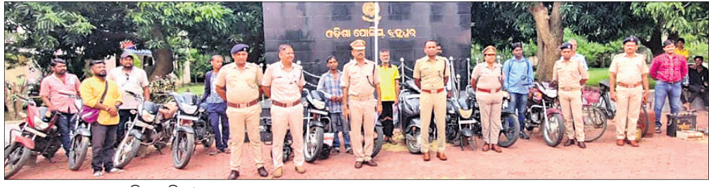
ଉଦ୍ଧାର ବାଇକ୍ ଫେରାଇ ପୋଲିସ୍।