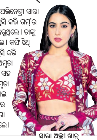
ସାରା ଅଲ୍ଲା ଖାନ୍

ମୃତ୍ୟୁ: ସାବତ ମା' କରିନା କପୁରଙ୍କ ସହ ଅଭିନେତ୍ରୀ ସାରା ଅଲ୍ଲା ଖାନ୍ଙ୍କ ସମ୍ପର୍କ ଭଲ ରହିଛି। 'କିଛି କିଛି କିଛି'ର ଅଭିନେତ୍ରୀ ନେଇ ସେ ତାଙ୍କୁ ବେଶ୍ ପସନ୍ଦ କରୁଥିଲେ। ତାଙ୍କୁ ଭେଟିବା ଲାଗି କୁଟି ସେବୁ ମଧ୍ୟ ଯାଇଥିଲେ। କଟି ଓଡ଼ି କରନ୍ତେ କରିନା କହିଥିଲେ ଯେ, 'କିଛି କିଛି କିଛି'ର ମା' ଗ୍ରୀତ୍ସଲ୍ୟା ସମୟରେ ସାରାଙ୍କୁ ନେଇ ମା' ଅନୁଭାବ ଗାଳ୍ପିକ ଯାଇଥିଲେ। କରିନା ତାଙ୍କ ସହ ଫଟୋ ଉଠାଇଥିଲେ। ସେତେବେଳେ ଅନୁଭାବ ଏବଂ ସେହି ଅଲି ଖାନ୍ଙ୍କ ବିବାହ ବିଚ୍ଛେଦ ହୋଇ ନ ଥିଲା। ଏହାର ଛବିସମ୍ପର୍କରେ ବୁଝିଲେ ମଧ୍ୟରେ ଫାଟ୍ ସୃଷ୍ଟି ହୋଇଥିଲା। ସେମାନେ ଅଲଗା ହେବା ପରେ ସେହି କରିନାଙ୍କ ହାତ ଧରିଥିଲେ।