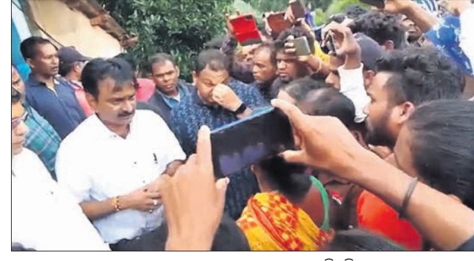
ଲୋକମାନେ କମ୍ପାନୀ ଅଧିକାରୀଙ୍କୁ ଘେରିଛନ୍ତି।

ରାୟଗଡ଼ା/ବିନି, ୪୮ (ଆଶିଷ ରଞ୍ଜନ ପଣ୍ଡା/ପ୍ରଫୁଲ୍ଲ କୁମାର ବେହେରା)