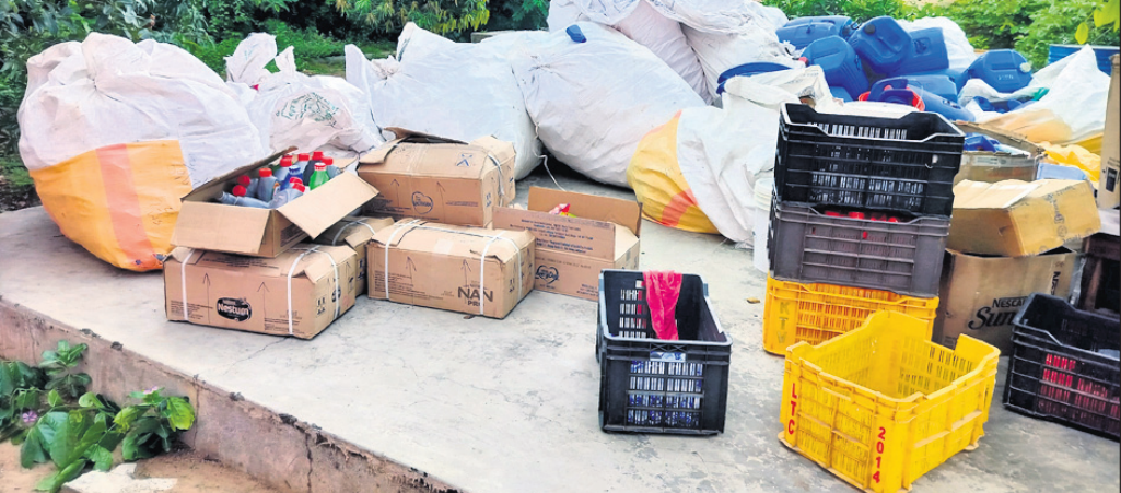
ଗୋପାଳପୁର, ୪୮୮ (ନବୀନ ରାଜ ଆଚାରୀ)