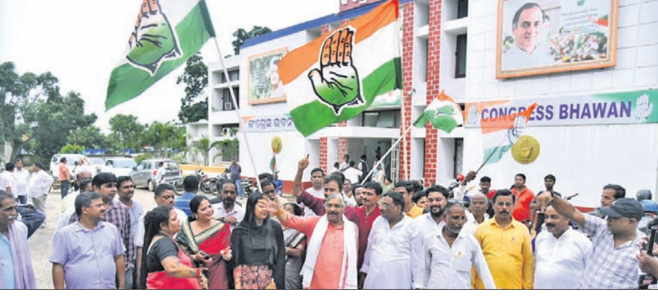
କଂଗ୍ରେସ ଭବନ ଆଗରେ ଦଳୀୟ ନେତା ଓ କର୍ମୀମାନେ ଖୁସି ମନାଉଛନ୍ତି।