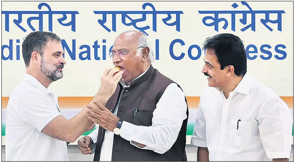
ଦଣ୍ଡ ଉପରେ ସୁପ୍ରିମକୋର୍ଟର ଗୁରୁତ୍ଵାଦେଶ ପରେ ଏଆଇସିପି ମୁଖ୍ୟାଳୟରେ କଂଗ୍ରେସ ଅଧ୍ୟକ୍ଷ ମଲ୍ଲିକାର୍ଜୁନ ଖାର୍ଗେଙ୍କୁ ମିଠା ଖୁଆଉଛନ୍ତି ରାହୁଲ ଗାନ୍ଧୀ। ନିକଟରେ ଅଭିଜି କଂଗ୍ରେସ ସାଧାରଣ ସମ୍ମାନ (ସଜ୍ଠନ) କେ.ସି. ବେଣ୍ଟୋପାୟା।

୨୪ ଘଣ୍ଟା ଭିତରେ ତାଙ୍କ ଲୋକ ସଭା ସଦସ୍ୟତା ରଦ୍ଦ କରାଯାଇଥିଲା। ସେ ଏମ୍ପି ପଦ ଫେରିପାଇବାକୁ କେତେ ସମୟ ଲାଗିବ। ସମ୍ବିଧାନ ବଞ୍ଚୁଛି ଏବଂ ଏହା ହେଉଛି ଲୋକେ ନ୍ୟାୟ ପାଇବାର ଦୃଷ୍ଟାନ୍ତ। ଏହା ସାଧାରଣ ଜନତା ଓ ସାମ୍ପ୍ରଦାୟିକ ସିଦ୍ଧାନ୍ତର ବିଜୟ। ସର୍ବୋଚ୍ଚ ଅଦାଲତଙ୍କ ରାୟ ଭାଙ୍ଗିବାର ଖଡ଼୍ଵାମନ୍ତକୁ ଧରାପକାଇଦେଇଛି। ଲୋକ ସଭାରେ କଂଗ୍ରେସ ନେତା ଅଧୀର ରଞ୍ଜନ ଚୌଧୁରୀ ବାଚସ୍ପତିଙ୍କୁ ରାହୁଲଙ୍କ ସଦସ୍ୟତା ପୁନଃ ଅବସ୍ଥାପିତ କରିବା ପାଇଁ ଅନୁରୋଧ କରିଛନ୍ତି। ରାହୁଲଙ୍କୁ ଗୃହକୁ ଆସିବାକୁ ଅନୁମତି ଦିଆଯାଇ ବୋଲି ଲୋକ ସଭାରେ ଅଧ୍ୟକ୍ଷତା କରୁଥିବା ରାଜେନ୍ଦ୍ର ଅଗ୍ରୱାଲଙ୍କ ନିକଟରେ ସେ ଦାବି କରିଥିଲେ। ରାଜେନ୍ଦ୍ର କହିଥିଲେ, ବାଚସ୍ପତି ଓମ୍ ବିଲ୍ ଏହି ଘଟଣାକ୍ରମକୁ ସ୍ଵତଃ ସଞ୍ଜନକୁ ନେବେ।