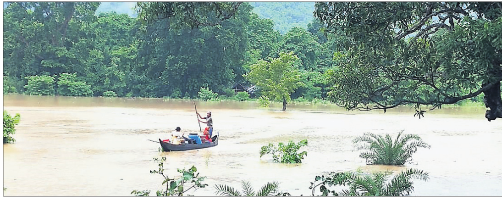
ଅନୁଗୋଳ ଜିଲ୍ଲା ଚିକରପଡ଼ା ପଞ୍ଚାୟତରେ ବନ୍ୟାଜଳ ପ୍ରବେଶ କରିଛି।

ଲୁହା ଚୋରି ବେଳେ ୪ ଗିରଫ ଅନୁଗୋଳ, ୪୮୮ (ଅନିତ କୁମାର ସାମଲ) ଅନୁଗୋଳ ଜିଲ୍ଲା ଚାଳଚେର ପୋଲିସ ଲୁହା ଚୋରା କାରବାର କରୁଥିବା ଅଭିଯୋଗରେ ୪ ଜଣଙ୍କୁ ଗିରଫ କରାଯାଇଛି।