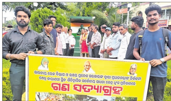
ଗଣ ସତ୍ୟାଗ୍ରହରେ ବାହାରିଥିବା କର୍ମକର୍ତ୍ତାମାନେ।