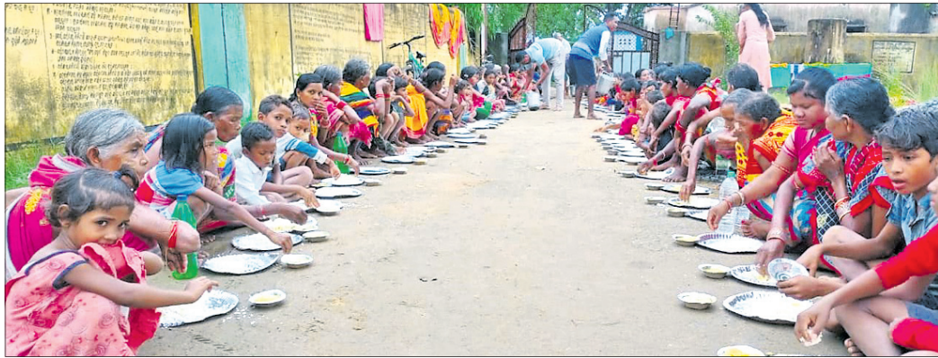
ଅଗାଧା ଶିବିରରେ ଥିବା ବିପନ୍ନମାନଙ୍କୁ ପ୍ରଶାସନ ପକ୍ଷରୁ ରନ୍ଧାଖାଦ୍ୟ ପ୍ରଦାନ କରାଯାଇଛି।