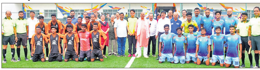
ଉଦ୍‌ଘାଟନୀ ମ୍ୟାଚ ପୂର୍ବରୁ ଦଳର ଖେଳାଳିଙ୍କ ସହ ଅତିଥି, କର୍ମକର୍ତ୍ତା ଓ ଅନ୍ୟମାନେ ।