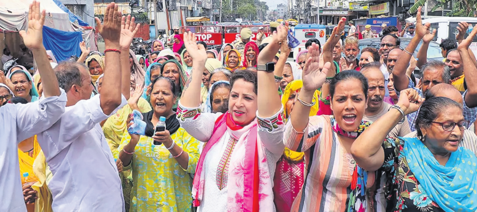
ବରଦାସ ବୁଦ୍ଧି ଓ ବେକାର ସମସ୍ୟା ନେଇ ଜମ୍ବୁଠାରେ ଶୁକ୍ରବାର କଂଗ୍ରେସ କର୍ମୀମାନେ କେନ୍ଦ୍ର ସରକାରଙ୍କ ବିରୋଧରେ ବିରୋଧ ପ୍ରଦର୍ଶନ କରୁଛନ୍ତି।

ସଭାପତି ବିଭାଗୀୟ ତରାଫ ଓ ଓଡ଼ିଶା ମୋର୍ଚ୍ଚା ସଭାପତି ଭାବେ ପୁରୀ ବିଧାନସଭାରେ ଯୋଗ ଦେଇଛନ୍ତି। ସଭାପତି ମନମୋହନ ସାମଲଙ୍କୁ ସାମଲ ଦଳର ନୂଆ ସଭାପତି ଭାବେ ନିର୍ବାଚନ କରାଯାଇଛି।