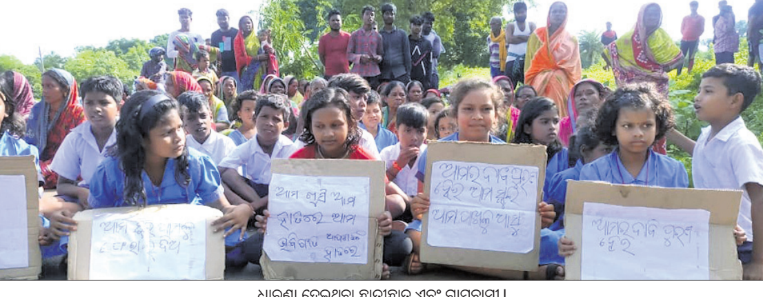
ଧାରଣା ଦେଇଥିବା ଛାତ୍ରଛାତ୍ରୀ ଏବଂ ଗ୍ରାମବାସୀ।