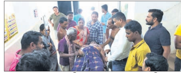
ଡାକ୍ତରଖାନାରେ ଗୁଣିଆ ମୃତଦେହକୁ ଡୋକ୍ତରୀ କରୁଛନ୍ତି।

କାମାକ୍ଷାନଗର, ୪୮୮ (ପୁଧାପର ପରିଡ଼ା/ଅମଳାଦ୍ୱାରା)