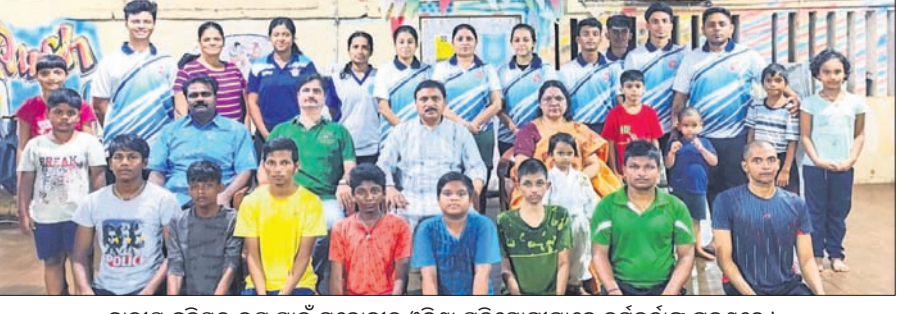
ଜାତୀୟ କ୍ରୀଡ଼ାରେ ଭାଗ ନେଇଥିବା ଓଡ଼ିଶା ପ୍ରତିଯୋଗୀମାନଙ୍କର ଗ୍ରହଣିତ ଚିତ୍ର।