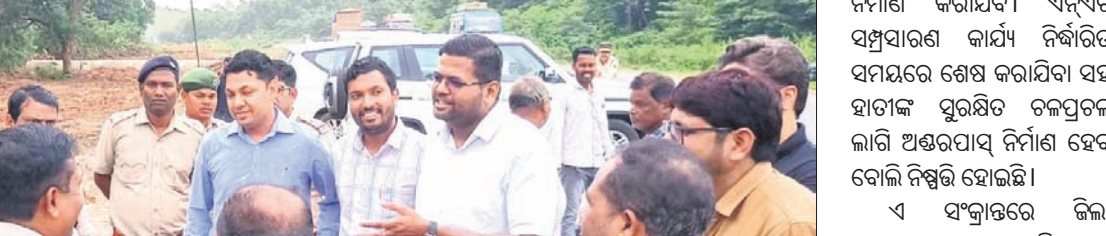
ବନ ବିଭାଗ ଓ ଏନ୍-ଏସ୍-ଆଇ ଅଧିକାରୀମାନେ ହାତୀ ଚଳାପଥ ନିର୍ମାଣ ସ୍ଥଳ ପରିଦର୍ଶନ କରୁଛନ୍ତି।