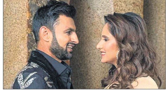
ଶୋଏବ ମଲିକ ଓ ସାନିଆ ମିର୍ଜା।

ସେଲିବ୍ରିଟି ଦମ୍ପତି ଭାରତୀୟ ଚେସ୍ ଷ୍ଟାର ସାନିଆ ମିର୍ଜା ଓ ପାକିସ୍ତାନୀ କ୍ରିକେଟର ଶୋଏବ ମଲିକଙ୍କୁ ନେଇ ପୁଣି କଳ୍ପନାଜଳ୍ପନା ପ୍ରକାଶ ପାଇଛି। ଉଭୟଙ୍କ ସୋସିଆଲ ମିଡ଼ିଆ ଆକାରରେ ଯାହା ଦେଖିବାକୁ ମିଳୁଛି ସେମାନଙ୍କ ଦାମ୍ପତ୍ୟ ଜୀବନରେ ଫାଟ ଦେଖାଦେଇଥିବା ଅନୁମାନ କରାଯାଇଛି। ଦୁଇ ଜଣାଣୁଣା ଆଧିକାରୀଙ୍କ ମଧ୍ୟରେ ବିବାହ