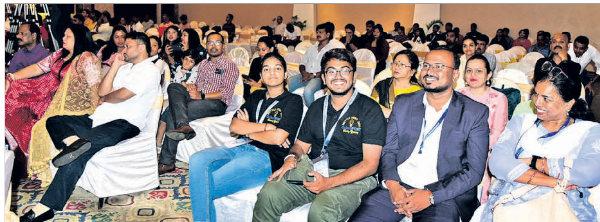
କାର୍ଯ୍ୟକ୍ରମରେ ଉପସ୍ଥିତ ମାନ୍ୟଗଣ୍ୟ ବ୍ୟକ୍ତି, ଅତିଥି, ପ୍ରତିଯୋଗୀ ଓ ସେମାନଙ୍କ ସମ୍ପର୍କୀୟ ।