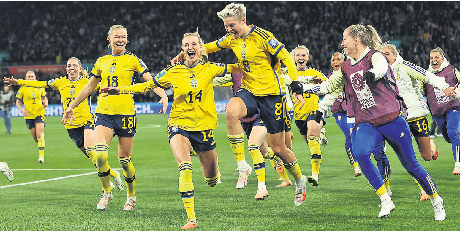
ମହିଳା ଫିଫା ବିଶ୍ୱକପରେ ଆମେରିକାକୁ ହରାଇବାପରେ ଉଲ୍ଲସିତ ସୁଇଡେନ ଖେଳାଳି