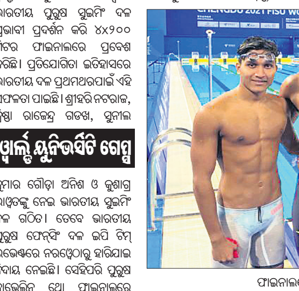
ଫାଇନାଲରେ ପ୍ରବେଶ କରିଥିବା ଭାରତୀୟ ସୁଇମିଂ ଦଳ।