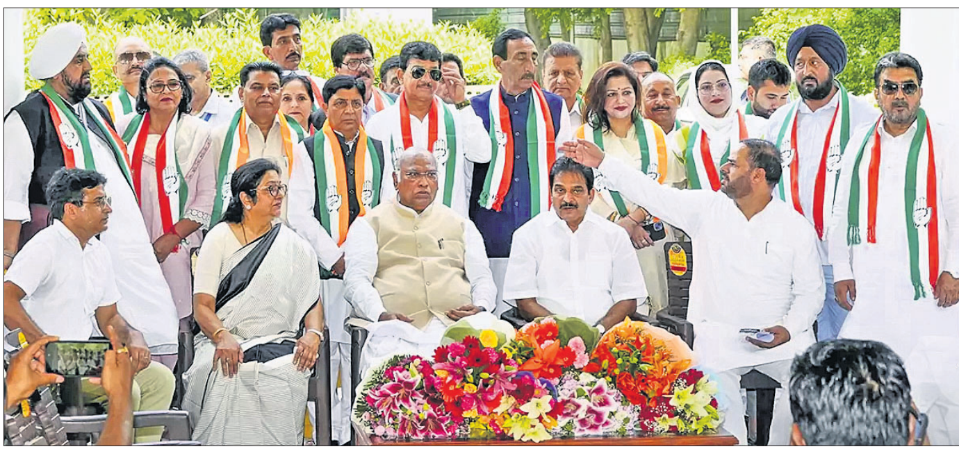
ନୂଆଦିଲ୍ଲୀରେ କଂଗ୍ରେସ ଅଧ୍ୟକ୍ଷ ମଲ୍ଲିକାର୍ଜୁନ ଖାର୍ଗେଙ୍କ ଉପସ୍ଥିତିରେ ସୋମବାର ଡେମୋକ୍ରାଟିକ ପ୍ରୋଗ୍ରେସିଭ ଆକାଦ ପାର୍ଟିର ଜେଡେକ ନେତା କଂଗ୍ରେସରେ ଯୋଗଦେଇଛନ୍ତି।

ସେ ମୁଖ୍ୟମନ୍ତ୍ରୀ ଶିବରାଜ ସିଂ ଗୌହାନଙ୍କୁ କଂଗ୍ରେସରେ ଯୋଗଦେବାକୁ ନିମନ୍ତ୍ରଣ କରିଥିଲେ। ସେ କହିଛନ୍ତି ଯଦି ଶିବରାଜ ଚାହାଁନ୍ତି, ତେବେ ସେ ମଧ୍ୟ କଂଗ୍ରେସରେ ସାମିଲ ହୋଇ ପାରିବେ।