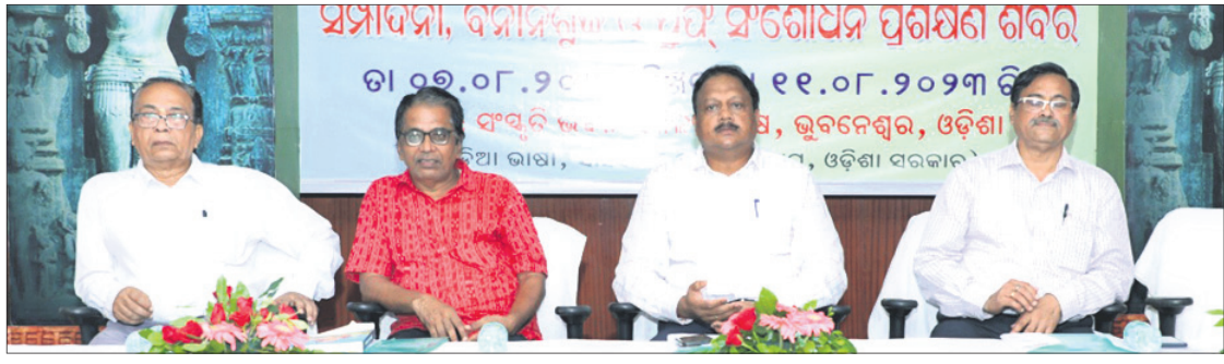
ଶିବିରରେ ଓଡ଼ିଆ ଭାଷା ପ୍ରତିଷ୍ଠାନର ନିର୍ଦ୍ଦେଶକ ବିଭାଗ ରାଜକରାଣୀ ଓ ଅନ୍ୟମାନେ ।

ଭୁବନେଶ୍ୱର, ୩୮ (ବନ୍ଦନା ସେଠୀ) ଓଡ଼ିଆ ଭାଷା ପ୍ରତିଷ୍ଠାନ ପସରୁ ଓଡ଼ିଆ ଭାଷାର ସମ୍ପାଦନା, ବନାନଶୁଦ୍ଧି ଓ ପୁସ୍ତକ ସଂଗୋଧନକୁ ଗୁରୁତ୍ୱ ଦିଆଯାଇଛି । ଏଥିନିମନ୍ତେ ପ୍ରଥମ ପର୍ଯ୍ୟାୟରେ ଶିବିର ଆରମ୍ଭ ହୋଇଛି । ପ୍ରଶିକ୍ଷଣ ଶିବିର ଯୋଗଦାନରେ ଉପସ୍ଥିତ ହୋଇ ଉପସ୍ଥିତ ଛାତ୍ରଛାତ୍ରୀ ଓ ଅନ୍ୟମାନେ ।