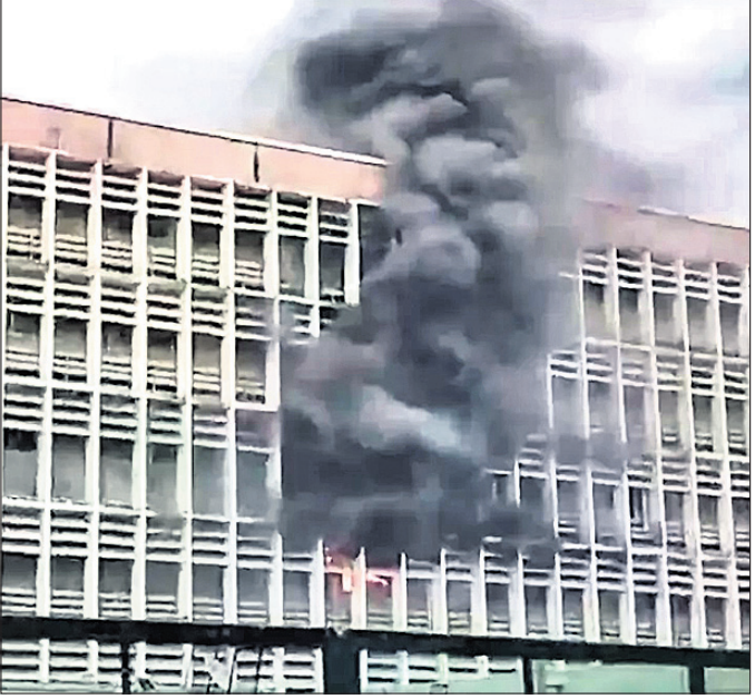
ପରମ୍ପରାପୂର୍ଣ୍ଣ ଓପିଡି ବିଲ୍ ଦ୍ୱାରା ମହଲରେ ଥିବା ଏକ୍ସୋସ୍କୋପି ପ୍ରକୋଷ୍ଠରେ ନିଆଁ ଲାଗିଛି