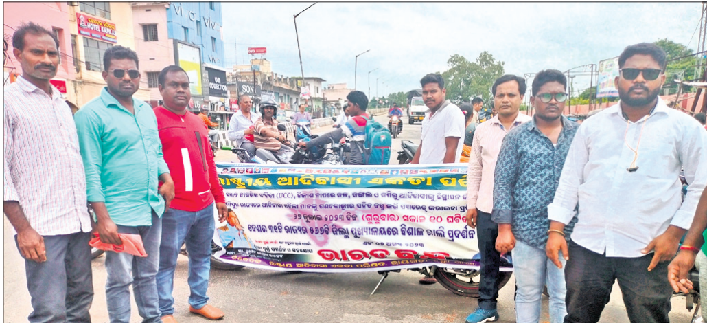
ଆଦିବାସୀ ଏକତା ପରିଷଦ କର୍ମକର୍ତ୍ତା ବିକ୍ଷୋଭ ପ୍ରଦର୍ଶନ କରୁଛନ୍ତି।