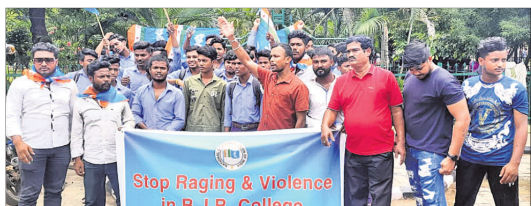
ବିଜେବି କଲେଜର କଲେଜ ସମ୍ମୁଖରେ ସୋମବାର ଛାତ୍ର କଂଗ୍ରେସ ପକ୍ଷରୁ ବିରୋଧ କରାଯାଇଛି।