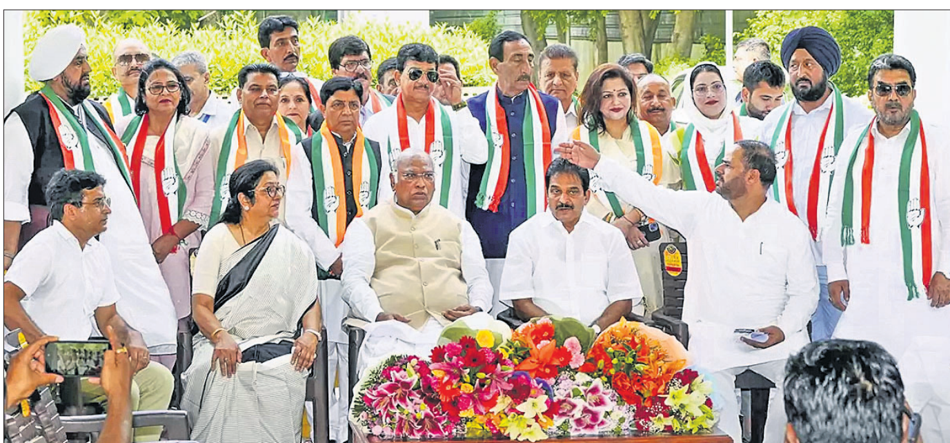
ନୂଆଦିଲ୍ଲୀରେ କଂଗ୍ରେସ ଅଧ୍ୟକ୍ଷ ମଲ୍ଲିକାର୍ଜୁନ ଖାର୍ଗେଙ୍କ ଉପସ୍ଥିତିରେ ସୋମବାର ଡେମୋକ୍ରାଟିକ ପ୍ରୋଗ୍ରେସିଭ ଆକାଦ ପାର୍ଟିର କେତେକ ନେତା କଂଗ୍ରେସରେ ଯୋଗଦେଇଛନ୍ତି।

ସେ ମୁଖ୍ୟମନ୍ତ୍ରୀ ଶିବରାଜ ସିଂ ଗୌହାନଙ୍କୁ କଂଗ୍ରେସରେ ଯୋଗଦେବାକୁ ନିମନ୍ତ୍ରଣ କରିଥିଲେ।