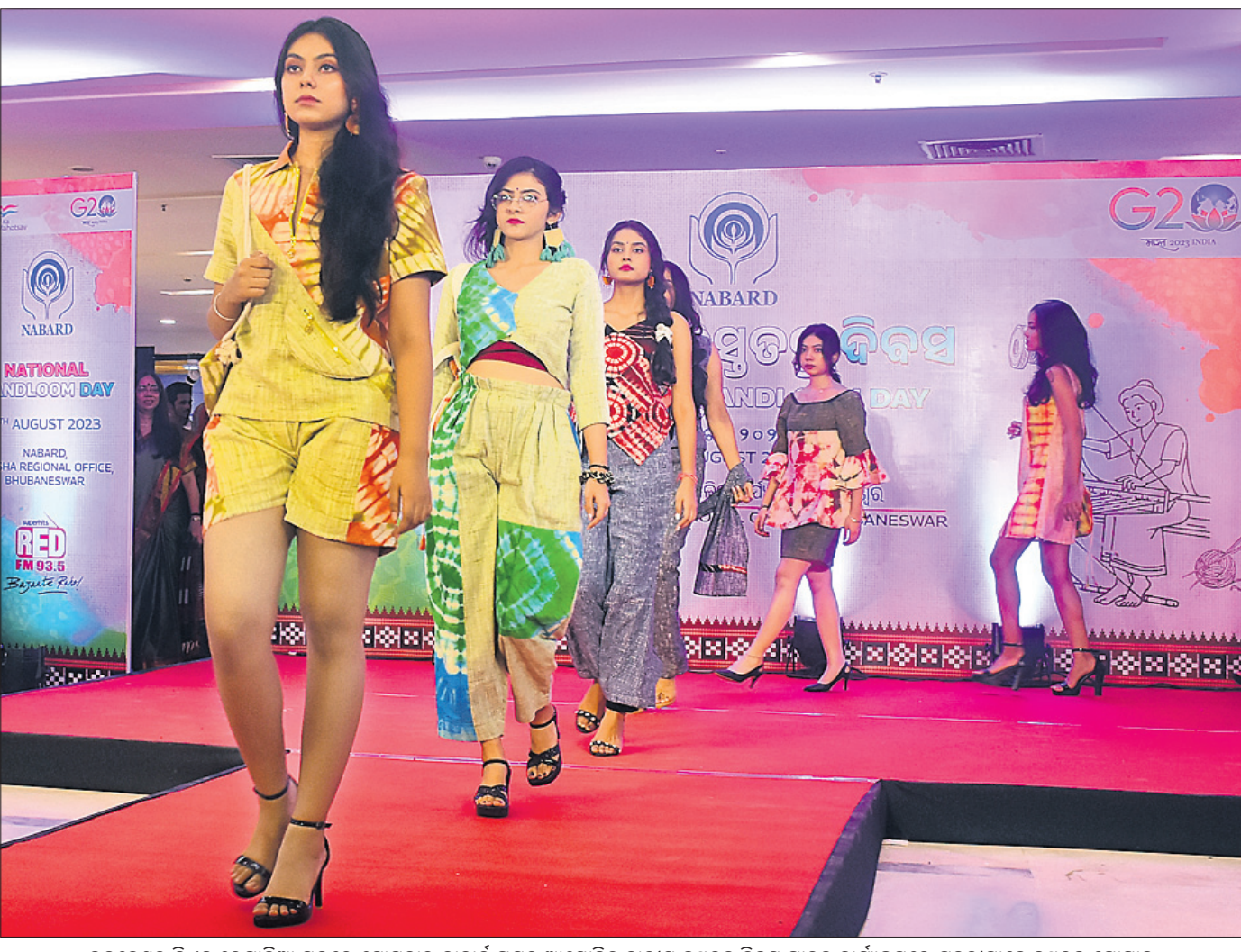
ଭୁବନେଶ୍ୱର ଡିଏନ୍ ରେଡିଆ ମଲ୍ରେ ଯୋଗ୍ୟତା ନାବାର୍ତ୍ତ ପକ୍ଷରୁ ଆୟୋଜିତ ଜାତୀୟ ହସ୍ତତନ୍ତ ଦିବସ ପାଳନ କାର୍ଯ୍ୟକ୍ରମରେ ହସ୍ତତନ୍ତ ପୋଷାକ ପରିଧାନ କରି ଫ୍ୟାଶନ ଶୋ' ରାମ୍ପରେ ଚାଲୁଛନ୍ତି।

ପାଇଁ ଲୋକ ସଭାକୁ ଫେରିଥିବାରୁ ରାହୁଲଙ୍କୁ କଂଗ୍ରେସ ଓ ଅନ୍ୟାନ୍ୟ ବିରୋଧୀ ଦଳ ସଦସ୍ୟମାନେ ଭବ୍ୟ ସ୍ୱାଗତ କରିଥିଲେ। ପୁଣ୍ୟ ଫାଟକ ନିକଟରେ ମିଠା ବନ୍ଧାଯିବା ସହିତ ଏଆଇସିପିର ପୂର୍ବତନ ପୁଖ୍ୟଙ୍କ ସପକ୍ଷରେ ଘୋରାମାନ ଦିଆଯିବାରୁ ସେଠାରେ ଏକ ଉତ୍ସବର ବାତାବରଣ ସୃଷ୍ଟି ହୋଇଯାଇଥିଲା। ତାଙ୍କ ସଦସ୍ୟତା ପୁନଃ ଅବସ୍ଥାପିତ ହୋଇଥିବାରୁ ବିଭିନ୍ନ କଂଗ୍ରେସ ନେତା ଓ କର୍ମୀଙ୍କ ମହଲରେ ଆନନ୍ଦ ପ୍ରକାଶ ପାଇଛି। କଂଗ୍ରେସ ଅଧ୍ୟକ୍ଷ ମଲ୍ଲିକାର୍ଜୁନ ଖାର୍ଯ୍ୟେ କହିଛନ୍ତି, ରାହୁଲଙ୍କ ଏମ୍ପି ପଦ ବଳାୟ ରହିବା ଏକ ସ୍ୱାଗତଯୋଗ୍ୟ ପଦକ୍ଷେପ। ଏହା ଦେଶବାସୀ ବିଶେଷକରି ଖୁସିରାଜ୍ୟର ପାଇଁ ଆଶ୍ୱସ୍ତି ଆଣିଦେଇଛି। ଖାର୍ଯ୍ୟେ ଏକ ବୁଲେଟି କରି ଆହୁରି କହିଛନ୍ତି, ବର୍ତ୍ତମାନ ସରକାରଙ୍କ ଆଉ ଯେତେକ ଅଧିକ ବାକି ରହିଛି ତାହା ଓ ପ୍ରଧାନମନ୍ତ୍ରୀ ନରେନ୍ଦ୍ର ମୋଦି ବିରୋଧୀ ନେତାଙ୍କୁ ଚାଟେର ନ କରି ତାହାକୁ ବାସ୍ତବ ଶାସନ ଦେବେ।