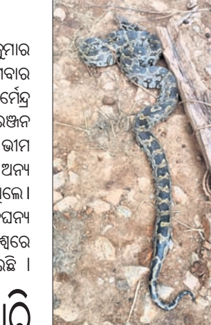
ଓଜନ ୮ କେଜି, ୯ ଫୁଟ ଲମ୍ବ ଥିବା ବେଳେ ବୟସ ୨୦ ତିନି ବର୍ଷ ହେବ।