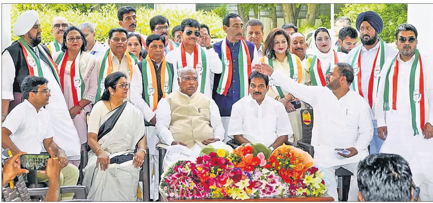
ନୂଆଦିଲ୍ଲୀରେ କଂଗ୍ରେସ ଅଧ୍ୟକ୍ଷ ମଲ୍ଲିକାର୍ଜୁନ ଖାର୍ଗେଙ୍କ ଉପସ୍ଥିତିରେ ସୋମବାର ଡେମୋକ୍ରାଟିକ ପ୍ରୋଗ୍ରେସିଭ ଆକାଦ ପାର୍ଟିର କେତେକ ନେତା କଂଗ୍ରେସରେ ଯୋଗଦେଇଛନ୍ତି।

ସେ ମୁଖ୍ୟମନ୍ତ୍ରୀ ଶିବରାଜ ସିଂ ଗୌହାନଙ୍କୁ କଂଗ୍ରେସରେ ଯୋଗଦେବାକୁ ନିମନ୍ତ୍ରଣ କରିଥିଲେ।