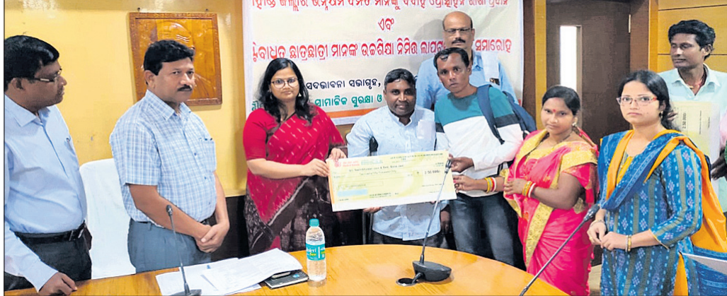
ଜିଲାପାଳ ଦିବ୍ୟାଙ୍ଗ ପରିବାରକୁ ଦିବାସ ପ୍ରୋଫାଇଣ୍ଡ ରାଶି ଟଙ୍କା ପ୍ରଦାନ କରୁଛନ୍ତି ।