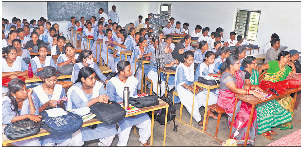
ରଘୁନାଥପୁର ବ୍ଲକ କୁର୍ତ୍ତାଙ୍ଗସ୍ଥିତ ସ୍ୱାମୀ ଅରୁପାୟନ ହାୟର ସେକେଣ୍ଡାରୀ ସ୍କୁଲ ଅଫ୍ ଏକ୍ସକେଲେନ୍ସ ଆଣ୍ଡ ଟେକ୍ନୋଲୋଜିରେ ସୋମବାର 'ଧରଣୀ' ପସରୁ ଆୟୋଜିତ 'ଗଣତନ୍ତ୍ର, ଗଣତନ୍ତ୍ର, ସୁଦୃଢ଼' ଶୀର୍ଷକ ବିଭିନ୍ନ ପ୍ରତିଯୋଗିତାର ପୂର୍ଣ୍ଣ ଅଭିଯାନ ଉଦ୍ଘୋଷଣା କରାଯାଇଥିଲା। ପ୍ରତିଯୋଗିତାରେ ଉପସ୍ଥିତ ଛାତ୍ରଛାତ୍ରୀ ଓ ଅନ୍ୟମାନେ।