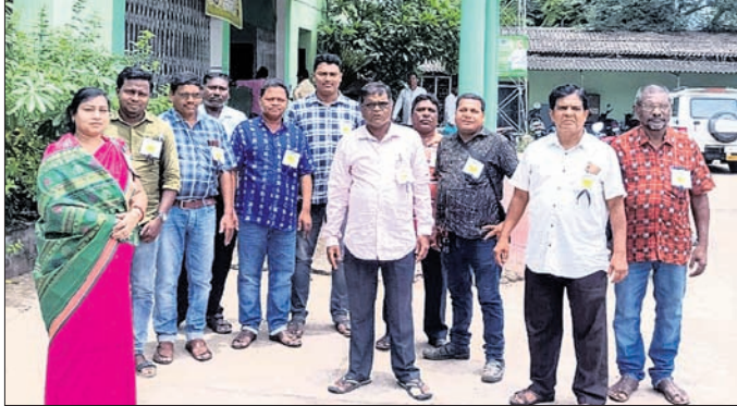
ପଞ୍ଚାୟତ କାର୍ଯ୍ୟନିର୍ବାହୀ ଅଧିକାରୀମାନେ କଳାବ୍ୟାଜ୍ ପିନ୍ଧିବା ନିମନ୍ତେ କୁଳିଆରୀଙ୍କ ଆଗରେ ପ୍ରତିବାଦ କରୁଛନ୍ତି ।

ଅମରପାଲି, ୭୮୮ (ପାତାମର ସାହୁ) ରାଜ୍ୟ ନିଖୁଳ ଉତ୍କଳ ପଞ୍ଚାୟତ ନିର୍ବାହୀ ଅଧିକାରୀ ସଂଘର ଆହ୍ୱାନକ୍ରମେ ବୀରମହାରାଜପୁର ବ୍ଲକର ୧୫ ଗୋଟି ଗ୍ରାମ ପଞ୍ଚାୟତରେ କାର୍ଯ୍ୟକ୍ରମ ପଞ୍ଚାୟତ ନିର୍ବାହୀ ଅଧିକାରୀମାନେ ସୋମବାର ଠାରୁ କଳାବ୍ୟାଜ୍ ପିନ୍ଧି ପ୍ରତିବାଦ କରୁଛନ୍ତି ।