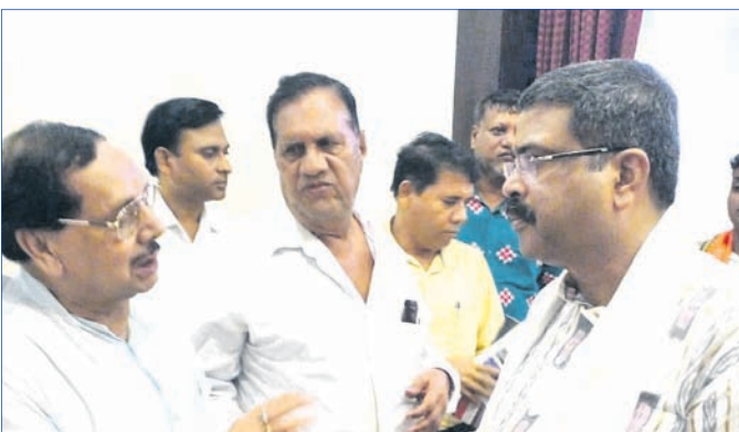
ଧର୍ମେନ୍ଦ୍ର ପ୍ରଧାନଙ୍କୁ ଦାବିପତ୍ର ଦିଆଯାଇଛି।

ପ୍ରସ୍ତାବକୁ ପୁନଃ ବିଚାର କରିବା ପାଇଁ ଜିଲା ନାଗରିକ କମିଟି ପକ୍ଷରୁ କେନ୍ଦ୍ର ଖାଦ୍ୟ ପ୍ରକ୍ରିୟାକରଣ ମନ୍ତ୍ରାଳୟ ଉଦ୍ଦେଶ୍ୟରେ ଏକ ସ୍ମାରକପତ୍ର କେନ୍ଦ୍ରମନ୍ତ୍ରୀ ଧର୍ମେନ୍ଦ୍ର ପ୍ରଧାନଙ୍କୁ ଜରିଆରେ ସମ୍ପର୍କ ପୁସ୍ତକ ପ୍ରତିଷ୍ଠା ହେଲେ ଦେବଗଡ଼ ସମେତ କୁଟିଆ, ପାଲଲହତା, ବଣେଇ ତଥା ରେଡ଼ାଖୋଲ ଉପଖଣ୍ଡର ଗଣା ଉପକୂଳ ହେବେ ବୋଲି ସ୍ମାରକପତ୍ରରେ ଉଲ୍ଲେଖ ରହିଛି।