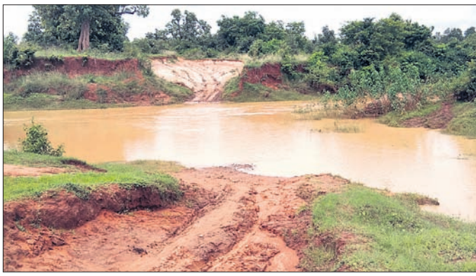
ଫଟାମୁଣ୍ଡା ଓ ଦେବେଶମାଳ ରାସ୍ତା ମଝିରେ ଥିବା ନୀଳ ।

ଘଣ୍ଟାପଡା, ୭୮୮ (ପ୍ରଭାତ କୁମାର ସାହୁ): ଲୋକଙ୍କ ସୁବିଧା ନିମନ୍ତେ ରାଜ୍ୟ ସରକାର ଗମନାଗମନ କ୍ଷେତ୍ରକୁ ଅଧିକ ସୁଗମ କରିବା ପାଇଁ ବିଭିନ୍ନ ପ୍ରକାରର କାର୍ଯ୍ୟକ୍ରମ ଚଳାଇଛନ୍ତି ।