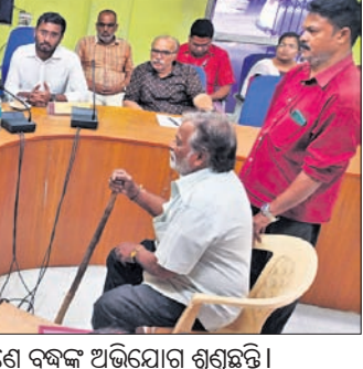
ଶିବିରରେ ଜିଲ୍ଲାପାଳ ଓ ଏସ୍ପି ଜଣେ ବୃଦ୍ଧଙ୍କ ଅଭିଯୋଗ ଶୁଣୁଛନ୍ତି ।

କାର୍ଯ୍ୟକ୍ରମ ପାଇଁ ଅତିରିକ୍ତ ରୋଷେଇ ଘର ନ ଥିବାରୁ ବିଦ୍ୟାଳୟ ବାରଣ୍ଡାରେ ଭୋଜନ ପ୍ରସ୍ତୁତ କରାଯାଉଅଛି । ପ୍ରଧାନ ଶିକ୍ଷକଙ୍କ କାର୍ଯ୍ୟକ୍ରମ ମଧ୍ୟାହ୍ନ ଭୋଜନ ସାମଗ୍ରୀର ଗୋଦାମ ପାଲଟିଛି ।