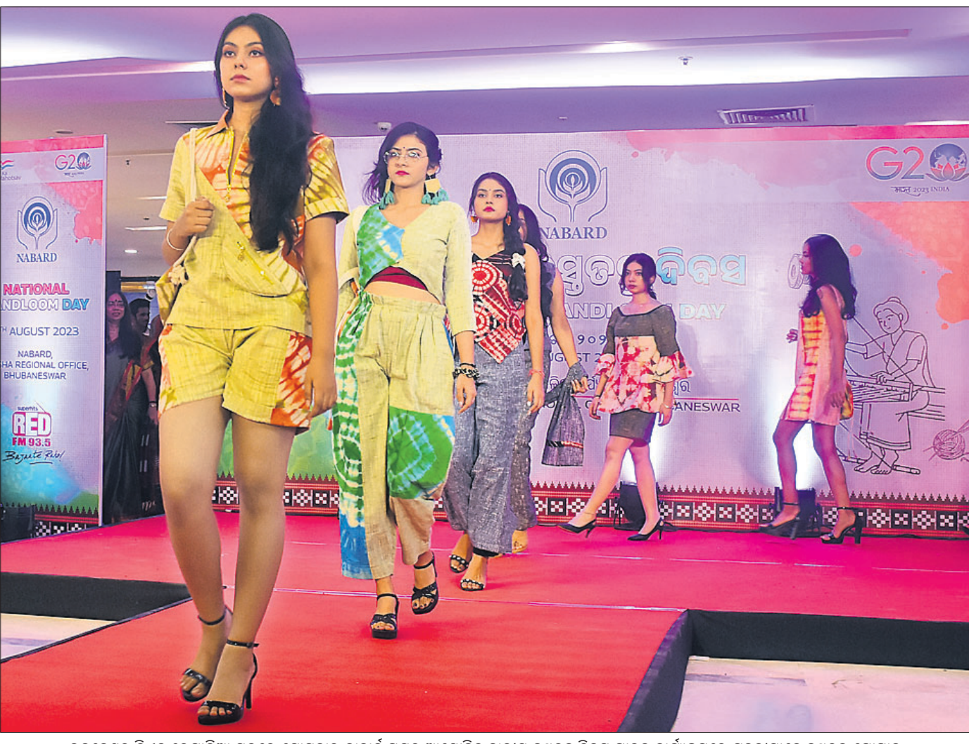
ଭୁବନେଶ୍ୱର ଡିଏନ୍ ରେଜିୟନାଲ୍ ଅଫିସ୍ରେ ଯୋଗବାନ ନାବାର୍ଥ ପକ୍ଷରୁ ଆୟୋଜିତ କାମାୟ ହସ୍ତତନ୍ତ ଦିବସ ପାଳନ କାର୍ଯ୍ୟକ୍ରମରେ ଯୁବତୀମାନେ ହସ୍ତତନ୍ତ ପୋଷାକ ପରିଧାନ କରି ଫ୍ୟାଶନ ଶୋ' ରାମ୍ପରେ ଚାଲୁଛନ୍ତି।

ନୂଆଦିଲ୍ଲୀ, ୭।୮ (ପି.ଟି.) ଅପରାଧ୍ୟ ଯୋଗିତ ହୋଇ ଚାରି ମାସ ଲୋକ ସଭାକୁ ବୃତ୍ତର ରହିଥିବା କଂଗ୍ରେସ ନେତା ରାହୁଲ ଗାନ୍ଧୀ ଯୋଗବାନ ପାଲଟିବାର ନିମ୍ନ ସଦନକୁ ଫେରିଛନ୍ତି। ଏକ ମାନସାହି ମାମଲାରେ ତାଙ୍କୁ ଦୋଷୀ ସାବ୍ୟସ୍ତ କରାଯାଇ ଦିଆଯାଇଥିବା ରାୟ ଉପରେ ସୁପ୍ରିମକୋର୍ଟ ସ୍ଥଗିତାଦେଶ ଦେଇଥିବାରୁ ସେ ତାଙ୍କ ସଦସ୍ୟ ପଦ ଫେରି ପାଇଛନ୍ତି। ଫଳରେ ଏହା ତାଙ୍କର ଲୋକ ସଭାକୁ ବହୁତ ବିକ୍ରମ ବୋଲି କୁହାଯାଉଛି। ମଙ୍ଗଳବାର ମୋଦି ସରକାରଙ୍କ ବିରୋଧରେ ଅଣାଯିବାକୁ ଥିବା ଅନାସ୍ଥା ପ୍ରସ୍ତାବ ପୂର୍ବରୁ ରାହୁଲ ଲୋକ ସଭାକୁ ଫେରିଥିବାରୁ ତାହା ବିରୋଧୀଙ୍କ ମନୋବଳକୁ ସୁଦୃଢ଼ କରିଛି। ଯଦିଓ ଏନଡିଏ ସପକ୍ଷରେ ବହୁମତ ରହିଛି, ତଥାପି ବିରୋଧୀ ବ୍ଲକ୍ 'ଇଣ୍ଡିଆ'ର ଜଣେ ପ୍ରମୁଖ ବନ୍ଧା ଭାବେ ଲୋକ ସଭାରେ ତାଙ୍କ ଉପସ୍ଥିତି ଜନସାଧାରଣଙ୍କୁ ଏକ ବାଣୀ ଦେବାକୁ ଯାଉଛି। ଅଗଷ୍ଟ ୪ରେ ସର୍ବୋଚ୍ଚ