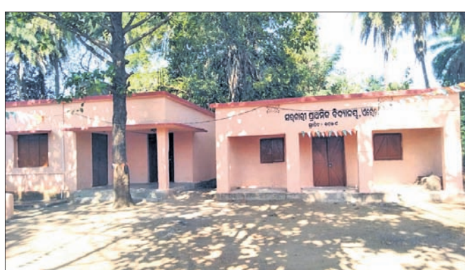
ଏରେଡା ସରକାରୀ ପ୍ରାଥମିକ ବିଦ୍ୟାଳୟ ।

ବନ୍ଦିଆପଡା, ୭୮୮ (ଶ୍ରୀକାନ୍ତ ସାହୁ) ରାଜ୍ୟ ସରକାର ଛାତ୍ରଛାତ୍ରୀମାନଙ୍କୁ ଉତ୍ତମ ଓ ଗୁଣାତ୍ମକ ଶିକ୍ଷାଦାନ ଉପରେ ଗୁରୁତ୍ୱ ଦେଇ ଆସୁଛନ୍ତି । ରୂପାନ୍ତରଣ କାର୍ଯ୍ୟକ୍ରମ ମାଧ୍ୟମରେ ବିଦ୍ୟାଳୟଗୁଡ଼ିକର ଭିତ୍ତିଭୂମି ସଜାଡିବା ଦେଖିବାକୁ ମିଳୁଛି ।