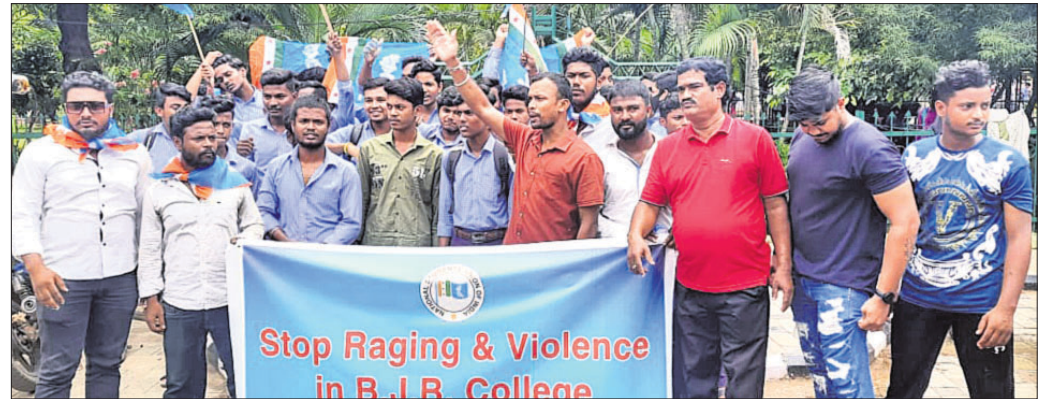
ବିଜେପି କଲେଜର କଲେଜ ସମ୍ମୁଖରେ ସୋମବାର ଛାତ୍ର କଂଗ୍ରେସ ପକ୍ଷରୁ ବିରୋଧ କରାଯାଇଛି।