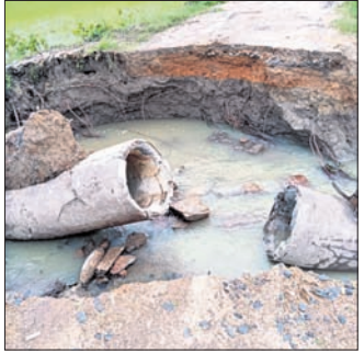
ବର୍ଷାରେ ମନ୍ଦିରକୁ ଯାଇଥିବା ରାସ୍ତା ଧୋଇଯାଇଛି ।

ବୌଦ୍ଧ, ୭୮୮ (ଅଜିତ କୁମାର ବାରିକ) ଅଗଷ୍ଟ ୧ ତାରିଖରେ ବୌଦ୍ଧ ଜିଲ୍ଲାରେ ଲଗାଣ ବର୍ଷା ଯୋଗୁ ବୌଦ୍ଧ ସହରରେ ବନ୍ୟା ପରିସ୍ଥିତି ଦେଖାଦେଇଥିଲା ।