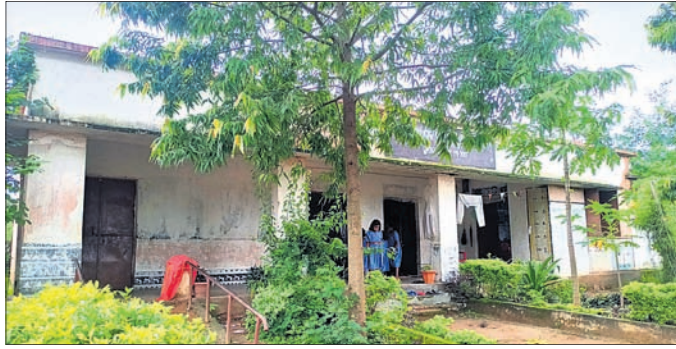
ବିପଦ ସଙ୍କୁଳ ବିଦ୍ୟାଳୟ ।