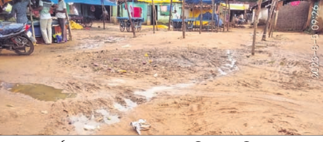
କର୍ମନାମ୍ନା ହୋଇଥିବା ଲାଠୋର ସାପ୍ତାହିକ ହାଟ ପରିସର ।

ଲାଠୋର, ୭।୮ (କୁବନେଶ୍ୱର ବାରିକ) ବଲାଙ୍ଗୀର ଜିଲା ଖପ୍ରାଖୋଳ ବ୍ଲକ୍ ଅଧିନ ଲାଠୋର ସାପ୍ତାହିକ ହାଟ ପରିସର ବାସ୍ତିକ ହେବ କଳ୍ପିତକରଣ କରିବାକୁ ବାବି ହୋଇ ଆସିଛି ।