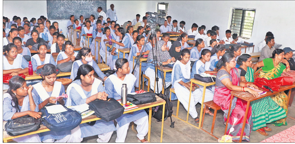
ରଘୁନାଥପୁର ବ୍ଲକ କୁର୍ତ୍ତାଙ୍ଗସ୍ଥିତ ସ୍ୱାମୀ ଅରୁପାନନ୍ଦ ହାଇଲ ସେକେଣ୍ଡାରୀ ସ୍କୁଲ ଅଫ୍ ଏଜୁକେଶନ ଆଣ୍ଡ ଟେକ୍ନୋଲୋଜିରେ ସୋମବାର 'ଧାରତ୍ରୀ' ପଞ୍ଚମ ଆୟୋଜିତ 'ଗଣମାଧ୍ୟମ, ଗଣବନ୍ଧୁ, ସୁଦୃଢ଼' ଶୀର୍ଷକ ବହୁତା ପ୍ରତିଯୋଗିତାର ପୂର୍ଣ୍ଣ ଅଧିକାରୀ ଉପସ୍ଥିତରେ ଉପସ୍ଥିତ ଛାତ୍ରାଛାତ୍ରୀ ଓ ଅନ୍ୟମାନେ ।