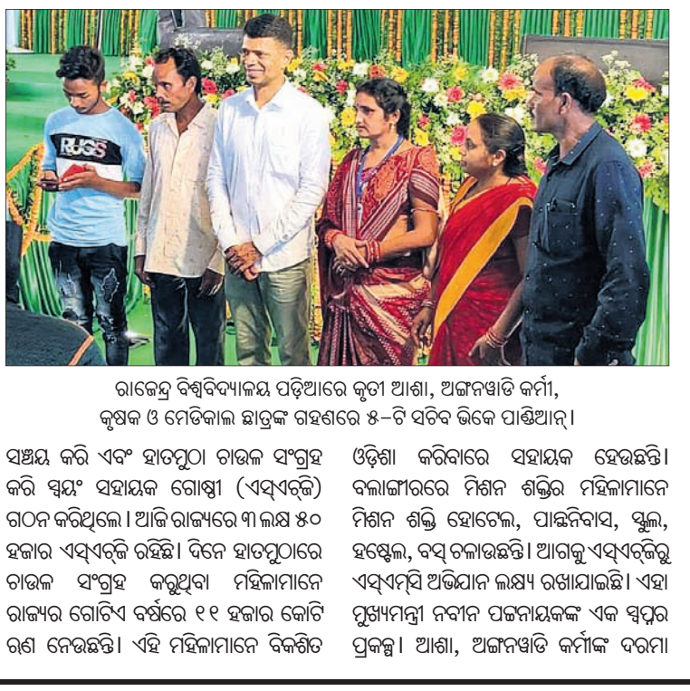
ରାଜେନ୍ଦ୍ର ବିଶ୍ୱବିଦ୍ୟାଳୟ ପଢ଼ିଆରେ କୁଟା ଆଶା, ଅଜନଶ୍ରୀ କର୍ମୀ, କୁମ୍ଭକ ଓ ମେଡିକାଲ ଛାତ୍ରୀଙ୍କ ସହିତ ୫-ଟି ସଚେତନ ଭିକେ ପାଠ୍ୟପୁସ୍ତକାଳୟ ।

ବଲାଙ୍ଗୀର, ୭୮ (ବାରେନ୍ଦ୍ର କୁମାର ଝାଙ୍କର) ୫-ଟି ସଚେତନ ଭିକେ-ପାଠ୍ୟପୁସ୍ତକ ପୁସ୍ତକାଳୟ ବଲାଙ୍ଗୀର ଜିଲ୍ଲା ଗସ୍ତ କାର୍ଯ୍ୟକ୍ରମ ସୋମବାର ଶେଷ ହୋଇଛି । ସକାଳେ ବଲାଙ୍ଗୀର ସହରର ସମାଜସ୍ୱରା ମନ୍ଦିର, କୋଶଳ କଳାମଣ୍ଡଳ, ଲୋକାର ସୁକ୍ଷେମ ଜଳସେଚନ ପ୍ରକଳ୍ପ ପରିବର୍ତ୍ତନ ସହ ରାଜେନ୍ଦ୍ର ବିଶ୍ୱବିଦ୍ୟାଳୟ ପରିସରରେ ମିଶନ ଶକ୍ତି କର୍ମକର୍ତ୍ତାଙ୍କ ସହ ସେ ଆଲୋଚନା କରିଥିଲେ । ଏହା ସହିତ ଜନସାଧାରଣଙ୍କ ସହ ସାକ୍ଷାତ, ଲୋକାଧିକାରୀଙ୍କୁ ସ୍ୱାଗତ କରିବା ପାଇଁ ୫-ଟି ସ୍କୁଲ, ଶିବମନ୍ଦିର ପରିବର୍ତ୍ତନ, ଲୋକାଧିକାରୀଙ୍କୁ ସହିତ ପଢ଼ିଆ ଓ ପୁସ୍ତକାଳୟରୁ ବୁକ୍ସ ଉପରେ କନ ଅଭିଯୋଗ ଶୁଣାଣି କରିଥିଲେ ପାଠ୍ୟପୁସ୍ତକାଳୟ ।