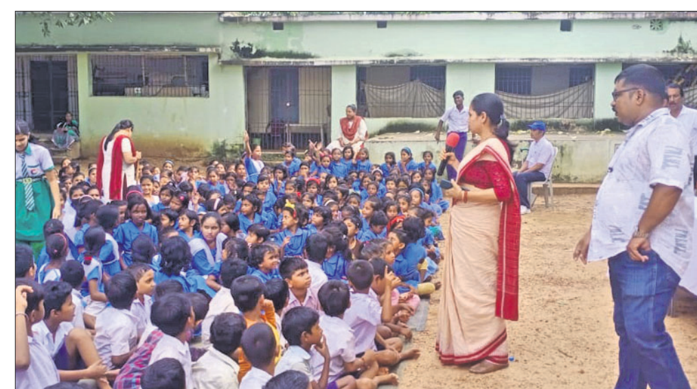
ଲକ୍ଷ୍ମୀସାଗର ଉଚ୍ଚବିଦ୍ୟାଳୟରେ ଯୋମବାର ସ୍ନେହ ହେଲ୍ଲୁ ଲାଇନ୍ ପକ୍ଷରୁ ଅନୁଷ୍ଠିତ ସାପ କାମୁଡ଼ା ସଂକ୍ରାନ୍ତ ସଚେତନତା ମନ୍ତ୍ରଣା

ଦୁର୍ବ୍ୟବହାର କରିବା ଅଭିଯୋଗରେ ପୁରୋହିତଙ୍କୁ ପୋଲିସ ଗିରଫ କରିଥିବା ଜଣାପଡ଼ିଛି । ତେବେ ଏହି ଘଟଣାରେ ଉଭୟ ପକ୍ଷରୁ ଅନ୍ୟ ଅଭିଯୁକ୍ତମାନେ ଫେରାର ଅଛନ୍ତି । ସେମାନଙ୍କୁ ଧରିବାକୁ ପୋଲିସ ଉଦ୍ୟମ ଚଳାଇଛି ।