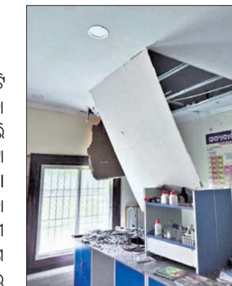
ପରେ ଅଧ୍ୟାପକ ଓ କର୍ମଚାରୀମାନେ ଦେଖି କର୍ତ୍ତୃପକ୍ଷଙ୍କୁ ଜଣାଇଥିଲେ। ଏପରିକି ଶ୍ରେଣୀଗୁହ ସମେତ ଅଫିସ କାର୍ଯ୍ୟାଳୟରେ ଉପସ୍ଥୁତ ଝରକା କବାଟ ନଥିବାରୁ ବେଳେବେଳେ ଜଳୁ ପଡୁଛି। ଏହି ସବୁ ସମସ୍ୟାକୁ ନେଇ ସ୍କୁଲ ଶିକ୍ଷୟିତ୍ରୀ ଶିକ୍ଷକ ଓ ଛାତ୍ରାଛାତ୍ର ଭାୟରେ ରତ୍ନହସ୍ତି ବୋଲି ସ୍କୁଲ କର୍ତ୍ତୃପକ୍ଷ ପ୍ରକାଶ କରିଛନ୍ତି। ତେଣୁ ପ୍ରଶାସନ ଏଥିପ୍ରତି ଦୃଷ୍ଟି ଦେଇ ଠିକ୍ ଭାବେ ମରାମତି କାର୍ଯ୍ୟ କରିବାକୁ ଦାବି କରିଛନ୍ତି।

ସାକ୍ଷୀଗୋପାଳ, ୭।୮ (ପ୍ରଶାନ୍ତ ବାରିକ/ କିଶୋର ମହାପାତ୍ର)