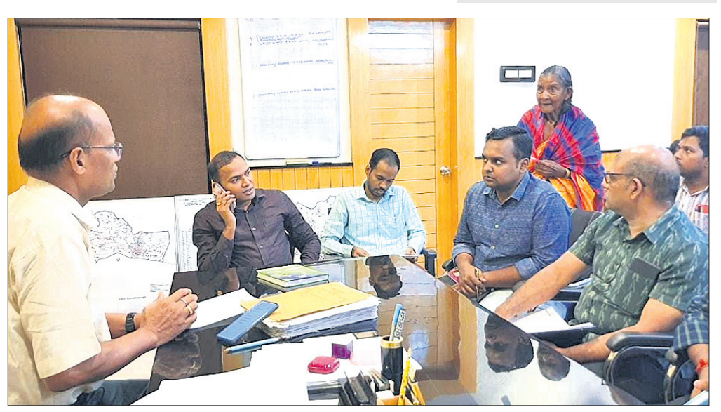
କାମାକ୍ଷାନଗର ଉପଜିଲ୍ଲାପାଳଙ୍କୁ ଅଭିଯୋଗ କରୁଛନ୍ତି ରୁକ୍ଷଣୀ ପାତ୍ର ।

କାମାକ୍ଷାନଗର, ୭।୮ (ସୁଧାଂଶୁ ପରିଡ଼ା) ବୟସ ଆଣିବୃଦ୍ଧାବସ୍ଥାରେ ପହଞ୍ଚିଲାଣି । ଶରୀର ଦୁର୍ବଳ ହୋଇଗଲାଣି । ଖଟି ଖାଇବା ଆଉ ସମ୍ଭବ ନୁହେଁ । ହେଲେ ଏକଥା ଜାଣି ବି ପର କରିଦେଲେ ପରିବାର ଲୋକେ । ଘରୁ ତଡ଼ିଦେଲେ ବୋହୂ ଓ ପୁଅ । ଏପରି ଅବସ୍ଥାରେ ପର ପିଣ୍ଡାରେ ଆଶ୍ରୟ ନେଇଥିବା ତାଙ୍କୁ ଭୁବନେଶ୍ୱର ନ୍ୟାୟ ଦେବାକୁ ଡେକୋରା କାମାକ୍ଷାନଗର ଆଲଫୁନା ବଡ଼ଦିଲ୍ଲୀ କାମାକ୍ଷୀ ପାତ୍ର ଯୋଗଦାନ ଉପଜିଲ୍ଲାପାଳଙ୍କୁ ନିବେଦନ କରିଛନ୍ତି । ଅଭିଯୋଗରେ ରୁକ୍ଷଣୀ ଦର୍ଶାଇଛନ୍ତି, ବୟସ ଅଧିକ ହୋଇଯାଇଥିବାରୁ ସେ ଆଉ ବାହାରେ କାମ କରି ନିଜ ଗୁଜୁରାଣ ମେଣ୍ଟାଇବା ଅବସ୍ଥାରେ ନାହାନ୍ତି । ପରିବାରରେ ବୋହୂ ଓ ପୁଅ ଥିଲେ ମଧ୍ୟ ସେମାନେ ତାଙ୍କର ଦେଖାଶୁଣା କରୁନାହାନ୍ତି । ଏପରି କି ନିଜ ଘରେ ବି ତାଙ୍କୁ ରଖାଇ ଦେଉନାହାନ୍ତି । ସେମାନେ ଘରୁ ବାହାର କରିଦେବା ପରେ ସେ ଏବେ ସାହି ପଡ଼ିଶାଳ ପିଣ୍ଡାରେ ମୁଣ୍ଡ