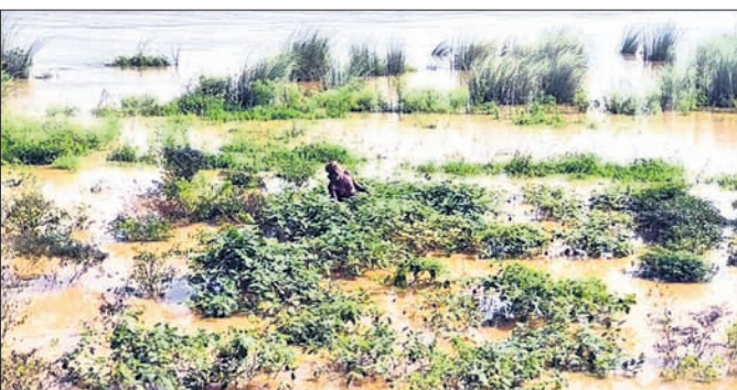
ଚାଷ ଜମିରେ ପାଣି ମାଡିଯାଇଛି ।

ମହାନଦୀ ଶାଖା ଦେବୀ ନଦୀରେ ବନ୍ୟାଜଳ ହ୍ରାସ ପାଇବାରେ ଲାଗିଛି। ଦେବୀ ନଦୀର ବାଉଁଶିଆକଣ୍ଠା ବିପଦ ସଙ୍କେତ ୪.୯୩ ମିଟର ଥିବେବେଳେ ଏବେ ବିପଦ ସଙ୍କେତ ତଳେ ଅର୍ଥାତ୍ ୩.୮୩ ମିଟରରେ ବନ୍ୟାଜଳ ପ୍ରବାହିତ ହେଉଛି। ବନ୍ୟା ଛଡ଼ୁଥିବା ବେଳେ ଚାଷୀଙ୍କ ଦୁର୍ଦ୍ଦଶା ବଢୁଛି। ଶତାଧିକ ଏକର ଚାଷଜମି ବନ୍ୟାରେ ପ୍ରଭାବିତ ହୋଇଛି। ପୁରୀ ଜିଲା ଅସ୍ତରଙ୍ଗ ବ୍ଲକ ଦେବୀ ନଦୀ ଉପକଣ୍ଠ ଖଣ୍ଡାସାହି, ଓସିଆ, ବିନାୟକପୁର, ବରାଙ୍ଗ, ପୁଲିଆଦିଆ, ଅନନ୍ତା ଓ ଅସ୍ତରଙ୍ଗ ମୌଜାର ଶତାଧିକ ଏକର ଚାଷଜମିରେ ବନ୍ୟାଜଳ ପଶି ଖରିପ ଧାନ ଫସଲ ସହ ପରିପରା ନଷ୍ଟ ହୋଇଯାଇଛି। ଏକର ଏକର ପରିବା ଚାଷଜମିରେ ଲହଡ଼ି ମାଛ