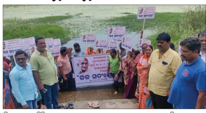
କ୍ରିୟାତ୍ମକ କର୍ମିତ୍ରୀ ପକ୍ଷରୁ କରଜାକଟା ବନ୍ଦର ଜଳ ସତ୍ୟାଗ୍ରହ କରାଯାଇଛି।

ବଲାଙ୍ଗୀର, ଗାଁ (ବୀରେନ୍ଦ୍ର କୁମାର ଝାଙ୍କର) ବଲାଙ୍ଗୀର ସହରର ଏକ ପ୍ରମୁଖ ଜଳାଶୟ ଭାବେ ପରିଚିତ କରଜାକଟା ବନ୍ଦର ପୁନରୁଦ୍ଧାର ଦାବିରେ କ୍ରିୟାତ୍ମକ କର୍ମିତ୍ରୀ ପକ୍ଷରୁ ଜଳ ସତ୍ୟାଗ୍ରହ କରାଯାଇଥିଲା।