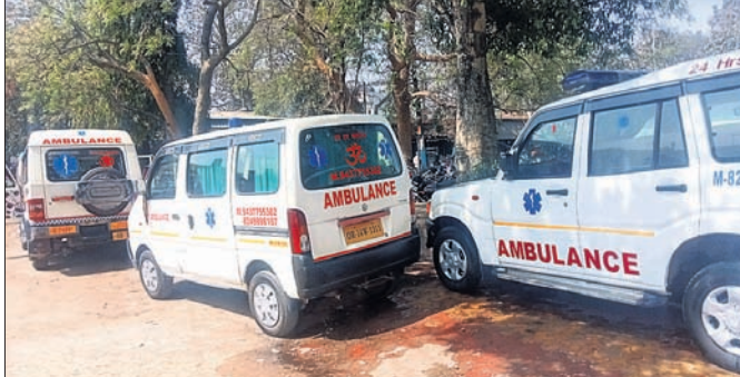
ଆର୍କିଏର କ୍ୟାମ୍ପସରେ ଘରୋଇ ଆୟୁଲ୍ୟାନ୍ ରହିଛି ।

ରାଜରକେଲା ସରକାରୀ ହସ୍ପିଟାଲ(ଆର୍କିଏର) କ୍ୟାମ୍ପସରେ ରହିଥିବା ଘରୋଇ ଆୟୁଲ୍ୟାନ୍ ରୋଗୀଙ୍କୁ ଶୋଷଣ କରୁଥିବା ଅଭିଯୋଗ ହେଉଛି ।