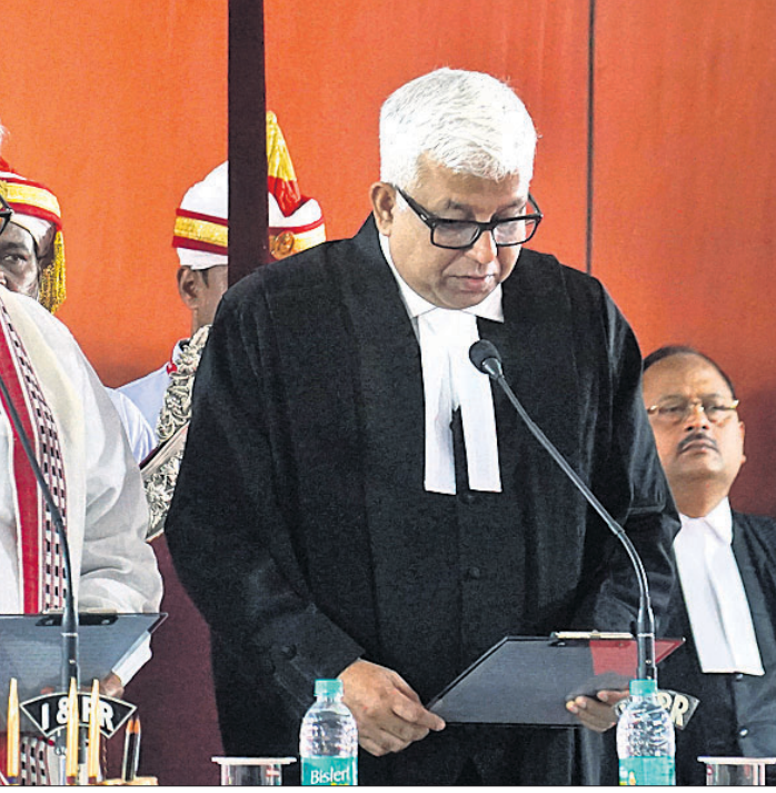
ଓଡ଼ିଶା ହାଇକୋର୍ଟ ପରିସରରେ ମଙ୍ଗଳକରୀ ରାଜ୍ୟପାଳ ପ୍ରଫେସର ଗଣେଶୀ ଲାଲ କଣ୍ଠସ୍ୱର ଶୁଭାଶିଷ୍ଟ ଡାକପତ୍ରକୁ ପୁଷ୍ପା ବିତାରପତି ଭାବେ ଶପଥ ପାଠ କରାଉଛନ୍ତି। (ରିପୋର୍ଟ: ପୃଷ୍ଠା-୨)