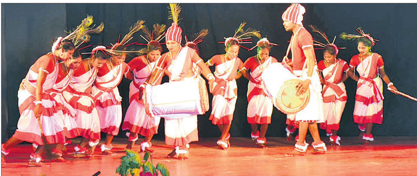
ଯୁବ କଳୋତ୍ସବର ଦ୍ୱିତୀୟ ସନ୍ଧ୍ୟାରେ ନୃତ୍ୟଶିଳ୍ପୀଙ୍କ ଦ୍ୱାରା ନୃତ୍ୟ ପରିବେଷଣ କରାଯାଇଛି ।

ରାଜରକେଲା, ୮।୮ (ବିଦେଶ ମିଶ୍ର) ରାଜରକେଲା ବେଦବ୍ୟାସ ମନ୍ଦିର ନିକଟରେ ସାପ ଖୋଳାଉଥିବା ବେଳେ ବନ୍ଦି ଭାବେ ଜଣେ ଯୁବକଙ୍କୁ ଗିରଫ କରିଛି ।