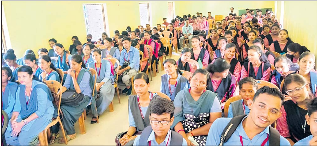
ଜଗଣୀ ମହାବିଦ୍ୟାଳୟରେ ମଙ୍ଗଳବାର ‘ଧରିତ୍ରୀ’ ପକ୍ଷରୁ ଆୟୋଜିତ ‘ଗଣମାଧ୍ୟମ, ଗଣତନ୍ତ୍ର ଓ ମୁବପିଡ଼ି’ ଶୀର୍ଷକ ବକ୍ତୃତା ପ୍ରତିଯୋଗିତାରେ ମଞ୍ଚସ୍ଥାନ ଅତିଥି ଓ ବିଚାରକ ମଣ୍ଡଳୀ। ପ୍ରତିଯୋଗିତାରେ ଉପସ୍ଥିତ ଛାତ୍ରାଛାତ୍ରୀ।