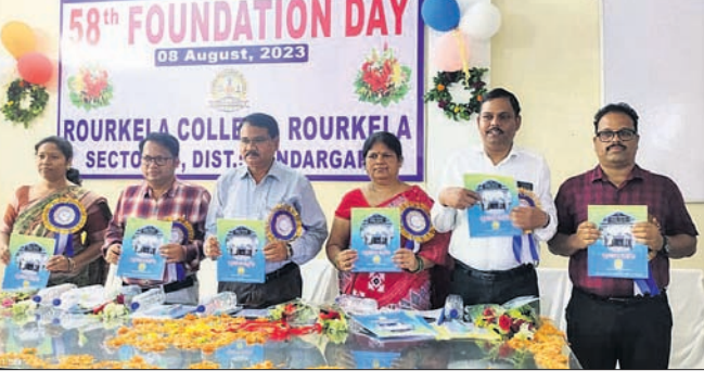
ଅତିଥିଙ୍କ ଦ୍ୱାରା କଲେଜ ମୁଖପତ୍ର ଉନ୍ମୋଚିତ ହେଉଛି ।