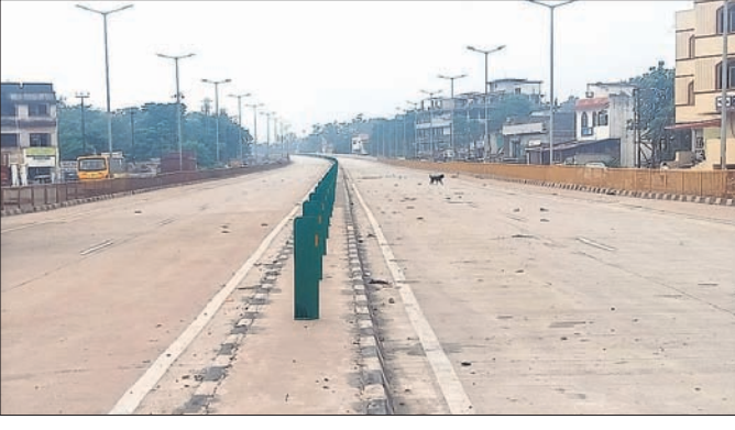
ବେଦବ୍ୟାସ ଉତ୍ତରଦ୍ୱିକ ।

ବୀରମିତ୍ରପୁର-ବାରକୋଟ ୧୪୩ ନଂ. ଜାତୀୟ ରାଜପଥ ନିର୍ମାଣ କାର୍ଯ୍ୟ ଶେଷ ହେଉନାହିଁ ।