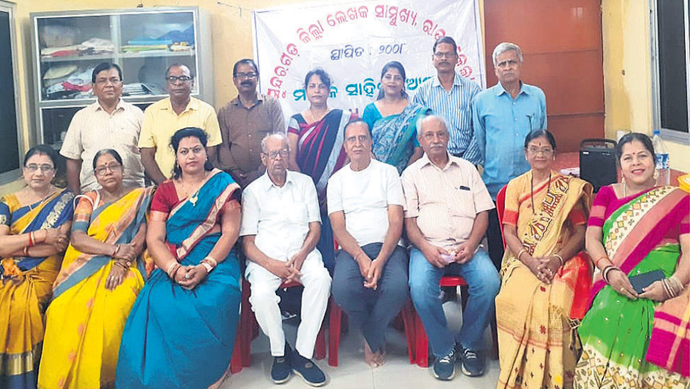
କାର୍ଯ୍ୟକ୍ରମରେ ଉପସ୍ଥିତ କର୍ମଚାରୀ ଓ କର୍ମଚାରୀ ।

କେନ୍ଦ୍ର ସମ୍ପର୍କରେ ରହିଥିବା ଘରୋଇ ଆୟୁଲ୍ୟାନ୍ରୁ ସରକାରୀ ଭାବି ସେଥିରେ ରୋଗୀଙ୍କୁ ଘରକୁ ଆଣିବା ଘରୋଇ ଆୟୁଲ୍ୟାନ୍ ରାଜକ ମଧ୍ୟ ଲୋକଙ୍କଠାରୁ ନିଜର ଉତ୍ତର ଆଦାୟ କରନ୍ତି ।