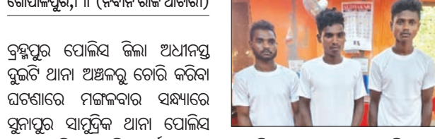
ପୋଲିସ୍ ଚଢ଼ଇ ଆରମ୍ଭ କରିଥିଲା