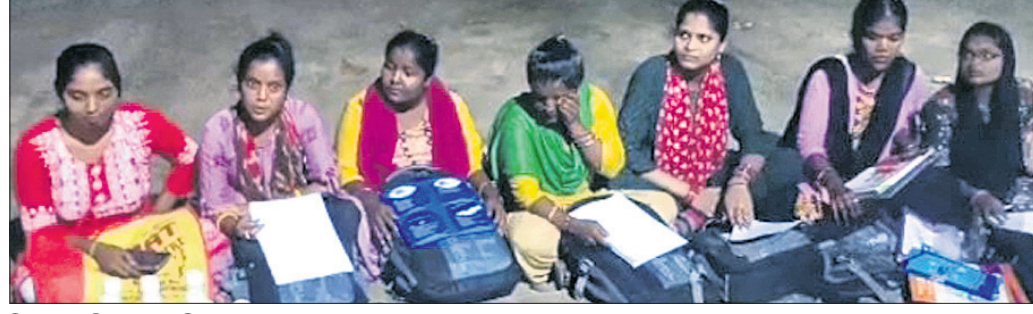
ଠକେଇ ଅଭିଯୋଗ ଆଣିଥିବା ଛାତ୍ରୀ

ପାରଳାଖେମୁଣ୍ଡି, ଟାଣିଆପାଲି (ବିଭାଗୀୟ ପରିଚାଳକ)