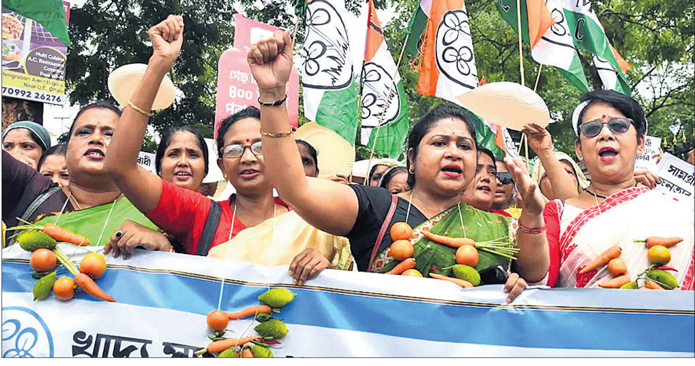
ଅତ୍ୟାଚାରଣ କାର୍ଯ୍ୟକ୍ରମରୁ ବଞ୍ଚିବା ପାଇଁ କେନ୍ଦ୍ର ସରକାରଙ୍କ ବିରୋଧରେ ଭୁବନେଶ୍ୱରରେ ମହିଳାଙ୍କର ବିକ୍ଷୋଭ କରାଯାଇଛି ।