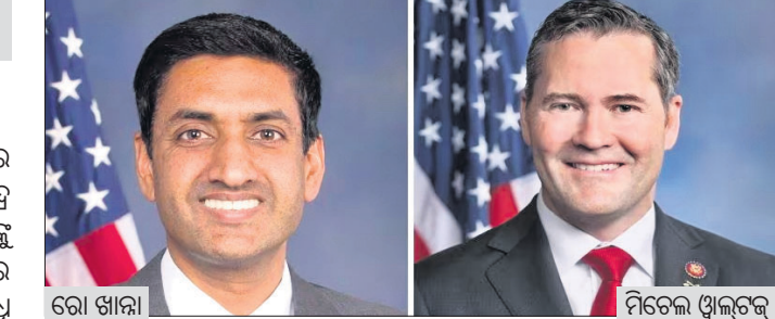
ଦେଶର ସ୍ୱାଧୀନତା ଦିବସ ଅବସରରେ ଅଗଷ୍ଟ ୧୫ରେ ପ୍ରଧାନମନ୍ତ୍ରୀ ନରେନ୍ଦ୍ର ମୋଦି ଲାଇବଲିଙ୍ଗ ଦେଖିବାପାଇଁ ଉଦ୍‌ଦେଶ୍ୟରେ ଆମେରିକାର ଆଇନ ପ୍ରଶାସନାଳୟ ଏକ ପ୍ରତିନିଧି ଦଳ ଉପସ୍ଥିତ ରହିବେ।

ସ୍ୱାଧୀନତା ଦିବସ ଖୁଶି, ୮ (ପି.ଟି.): ଦେଶର ସ୍ୱାଧୀନତା ଦିବସ ଅବସରରେ ଅଗଷ୍ଟ ୧୫ରେ ପ୍ରଧାନମନ୍ତ୍ରୀ ନରେନ୍ଦ୍ର ମୋଦି ଲାଇବଲିଙ୍ଗ ଦେଖିବାପାଇଁ ଉଦ୍‌ଦେଶ୍ୟରେ ଆମେରିକାର ଆଇନ ପ୍ରଶାସନାଳୟ ଏକ ପ୍ରତିନିଧି ଦଳ ଉପସ୍ଥିତ ରହିବେ।