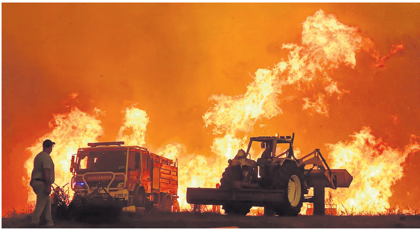
ପୂର୍ବଭାଗରେ ଅସାଧାରଣ ତାପମାତ୍ରା ବୃଦ୍ଧି ଯୋଗୁ ଜଙ୍ଗଲଗୁଡ଼ିକରେ ନିଆଁ ଲାଗିଛି। ଏହି ଦନାନ୍ତ ୧୬,୬୦୦ ଏକର ପ୍ରାୟକୁ ମାଡ଼ିଥିବା ବେଳେ ୧୫୦୦ ଲୋକଙ୍କୁ ସୁରକ୍ଷିତ ସ୍ଥାନକୁ ନିଆଯାଇଛି।

ମୁକ୍ତେନ୍ଦ୍ରରେ ରୁଷିଆର ସ୍ୱେଚ୍ଛାସ୍ତ୍ର ମାଡ଼: ୭ ନିହତ କିଲ୍, ୮୮: ମୁକ୍ତେନ୍ଦ୍ରର ପୂର୍ବଭାଗରେ ଥିବା ପୋଲୋଭସ୍ କୋଲରେ ରୁଷିଆର ସ୍ୱେଚ୍ଛାସ୍ତ୍ର ମାଡ଼ ଯୋଗୁ ୭ ଜଣଙ୍କ ମୃତ୍ୟୁ ଘଟିବା ସହ ୮୯ ଜଣ ଆହତ ହୋଇଛନ୍ତି।