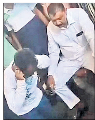
ସେ ଦଣ୍ଡ ଦେଇ ନ ଥିଲେ ଉଦ୍‌ବ୍ୟ ଲୋକେ ମାଡ଼ ମାରିଥାନ୍ତେ ଓ ଯୁବକଙ୍କ ଜୀବନ ପ୍ରତି ବିପଦ ସୃଷ୍ଟି ହୋଇଥାନ୍ତା ବୋଲି ଭାଜପା ନେତା କହିଛନ୍ତି।