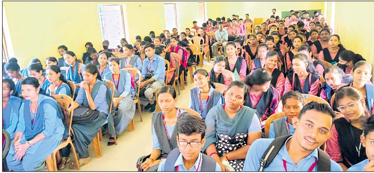
ଜଗଣୀ ମହାବିଦ୍ୟାଳୟରେ ମଙ୍ଗଳବାର ‘ଧରିତ୍ରୀ’ ପକ୍ଷରୁ ଆୟୋଜିତ ‘ଗଣମାଧ୍ୟମ, ଗଣତନ୍ତ୍ର ଓ ମୁବପିଡ଼ି’ ଶୀର୍ଷକ ବକ୍ତୃତା ପ୍ରତିଯୋଗିତାରେ ମଞ୍ଚସ୍ଥାନ ଅତିଥି ଓ ବିଚାରକ ମଣ୍ଡଳୀ। ପ୍ରତିଯୋଗିତାରେ ଉପସ୍ଥିତ ଛାତ୍ରାଛାତ୍ରୀ।