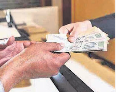
ଏହାକୁ ନେଇ ଅଶାନ୍ତି ଓ ଅସନ୍ତୋଷ ବୃଦ୍ଧିପାଇବ ଏବଂ ସାମାଜିକ ଭେଦଭାବ ବି ସୃଷ୍ଟି ହେବ । କାହା ପ୍ରତି ଅନୁଚିତ ଅନୁଗ୍ରହ ପ୍ରଦର୍ଶନ କରିବା ପୂର୍ବରୁ ଏହାର ପ୍ରାସଙ୍ଗିକତାକୁ ବିଚାର କରାଯିବା ଆବଶ୍ୟକ । ନୀତିନିୟମ ଆଧାରରେ ତଥା ଯଥାର୍ଥ ଓ ନ୍ୟାୟସଙ୍ଗତ ଭାବେ ସର୍ବୋପରି ସମାଜର ହିତକୁ ଆଖି ଆଗରେ ରଖି ବ୍ୟକ୍ତି ବା ଗୋଷ୍ଠୀ ପ୍ରତି ଅନୁଗ୍ରହ ପ୍ରଦର୍ଶନ କରାଯିବାର ଅନୁଗ୍ରହ ନାହିଁ । ଦେଶ ସ୍ୱାଧୀନତା ପାଇବା ଦିନଠାରୁ ପୁଣି ଆଜି ଯାଏ ପୁଷ୍ଟିମେୟ ଲୋକଙ୍କ ସ୍ୱାର୍ଥ ଓ ସୁଖସୁବିଧାକୁ ଦୃଷ୍ଟିରେ ରଖି ସେମାନଙ୍କ ପ୍ରତି ଅନୁଚିତ ଅନୁଗ୍ରହ ପ୍ରଦାନ କରାଯିବାର କୁପରିଣାମ ସମଗ୍ର ଦେଶବାସୀଙ୍କୁ ହିଁ ଭୋଗିବାକୁ ହେଉଛି । ଅନେକ ସମୟରେ ଦେଖାଯାଏ ସରକାର ଗରିବଙ୍କ ହିତ ଲାଗି ଯୋଜନା ମାନ ପ୍ରଣୟନ କରୁଥିବା ବେଳେ ସମାଜର ଥିଲାବାଲା ଶ୍ରେଣୀରେ ଲୋକେ ସେଥିରୁ ଫାଇଦା

କରାଯିବା ଆଦୌ ସମାଚାର ନୁହେଁ । କାରଣ ଏକ ଗଣତାନ୍ତ୍ରିକ ବିଧି ବ୍ୟବସ୍ଥାରେ ସମାଜର ସବୁ ବର୍ଗର ସ୍ୱାର୍ଥ ଓ ସମସ୍ୟାକୁ ସୁରୁକ୍ଷ ଦିଆଯିବା ନିୟମ ଥିବା ସ୍ତଳେ କାହାର ଅନୁଚିତ ଅନୁଗ୍ରହକୁ ଜଣେ କିମ୍ପା ପୁଷ୍ଟିମେୟ ଲୋକ ଫାଇଦା ହାସଲ କରିବାର ସୁଯୋଗ ପାଇଲେ ସାମାଜିକ ବ୍ୟବସ୍ଥାକୁ ବୁଝି ପଡ଼ିବା ଆଶଙ୍କା ରହିଛି । ଅନେକ ସମୟରେ ଦେଖାଯାଏ ଶାସନରେ ଥିବା ଦଳ, ନିର୍ବାଚିତ ଜନ ପ୍ରତିନିଧି କିମ୍ପା ବିରକ୍ଷ ପ୍ରଶାସନିକ ଅଧିକାରୀମାନେ ଲାଭ ବା ଲୋଭଭଗତଃ ଯେବେ କୌଣସି ବ୍ୟକ୍ତି କିମ୍ପା ଗୋଷ୍ଠୀ ପ୍ରତି ଅନୁଚିତ ଅନୁଗ୍ରହ ପ୍ରଦର୍ଶନ କରନ୍ତି ତେବେ ତାହା ଦ୍ୱାରା ସଂପୂର୍ଣ୍ଣ ବ୍ୟକ୍ତି କିମ୍ପା ଗୋଷ୍ଠୀ ଲାଭବାଦ୍ ହେବେ ସତ ହେଲେ ଅନ୍ୟମାନେ ଯେ ଏହାଦ୍ୱାରା ବୁଝୁଛନ୍ତି ପ୍ରଭାବିତ ହେବେ ଏଥିରେ ସନ୍ଦେହ ନାହିଁ । ତା'ଛଡ଼ା