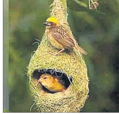
ଭୁଲୁ କରବ, ସେତେଥର ସକାଡ଼ିବା । ଆଉ ଏମିତି ଏକ ବସା ତିଆରି କରିବ, ଯାହା ଭିତରେ ସେ ତା' ପିଲାସ୍ତ୍ରୀଙ୍କୁ ନେଇ ଝଡ଼ବତାସରେ ବି ପୁରସ୍କୃତ ରହିପାରିବ । ଛୋଟପକ୍ଷୀଟିଏ ହେଲେ କ'ଣ ହେବ, ତା'ର କାର୍ଯ୍ୟ ପ୍ରତି ଯୈର୍ଯ୍ୟ, ସ୍ଥିରତା, ପ୍ରତିବନ୍ଧକ ଯୋଗୁଁ ସେ ନିଜ ପାଇଁ ଏକ ନିର୍ଭୁଲ୍ ବସା ତିଆରି କରିବାର କ୍ଷମତା ଓ ଦକ୍ଷତା ରଖେ । ଏହା କହି, ମୋ ଆଜି ସେଇ ବାଇଚଢ଼େଇ ବସାକୁ ବ୍ୟବହାର ହେଉ ନ ଥିବା ଏକ କୂଅକୁ ପିଲିଦେଲା । ଛୋଟପିଲାମାନେ ବାଇଚଢ଼େଇକିଏ ଧରିଲେ ତାକୁ ପାଳିବୁ ବୁଧ, ମୋ ଆଜ୍ଞା ଏହି କଥା ସମ୍ପୂର୍ଣ୍ଣ ମିଥ୍ୟା ହୋଇପାରେ, ହେଲେ ବାଇଚଢ଼େଇ ଓ ତା'ର ବସା ନିମାଣ କରିବାର ସାହସ, ଶକ୍ତି, ପ୍ରତିବନ୍ଧକ

ପିଲାଦିନେ ଖରାକୁଟିରେ ଯୁଁ ମୋ ମାମୁଘରକୁ ଯାଇଥାଏ । ଖରାଦିନ ରାତିରେ ଦିନେ ବହୁତ ଜୋରରେ ଝଡ଼ ଆସିଲା । ତା'ପରଦିନ, ବାଢ଼ିରେ ଥିବା ଆୟତନକୁଳକୁ ଯୁଁ ଯାଇଲି, ମିଠାମିଠା ଆମ୍ଭ ଗୋଟେଇବାକୁ । ଆମ ଗୋଟାଉ ଗୋଟାଉ, ଗୋଟେ ବାଇଚଢ଼େଇକିଏ ତଳେ ପଡ଼ିଥିବାର ଦେଖିଲି । ଗୋଟେଇ ଥିବା ଆୟତନ ତଳେ ରଖିଦେଇ, ସେଇ ବାୟାବସାକୁ ଧରି ଆଜ୍ଞାପାଖକୁ ଦୌଡ଼ିଲି । 'ଦେଖ ଦେଖ ଆଜି ଯୁଁ କ'ଣ ପାଇଛି' । ଆଜି ମୋ ହାତରେ ଥିବା ବାଇଚଢ଼େଇ ବସାକୁ ଦେଖି ଖୁସିହେବା ବଦଳରେ, ତାକୁ ମୋ ହାତରୁ ଛଡ଼େଇ ନେଇଗଲା ଓ କହିଲା, 'ଛୋଟପିଲାମାନେ ଏଇବସାକୁ ଧରିଲେ ପାଳିବୁ ହେବ । ତୁ ଆଉ କେବେ ବି ଯାକୁ ଛୁଇଁବୁନି ।' ଯୁଁ ଧରିଲି ତୁ ଦେଖ । ସେତେବେଳେ ଛିନି ନ ବୁଝି ଯୁଁ ବଡ଼ ହିଁସ ମାରି